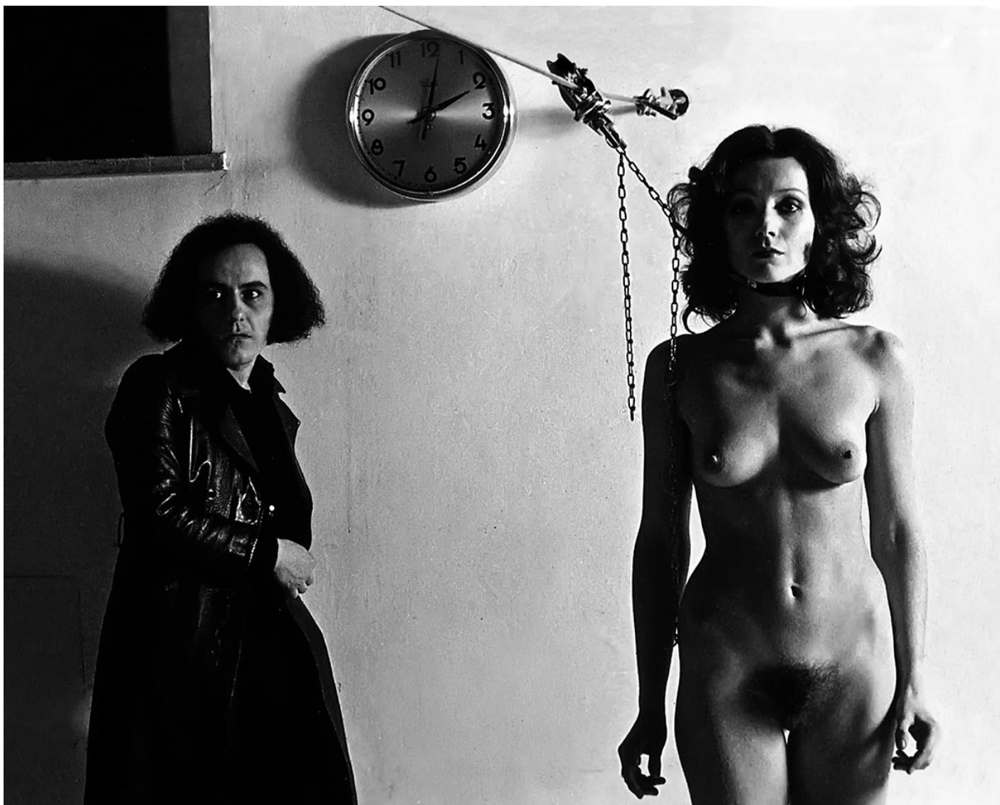
Vettor Pisani, Lo scorrevole , 1970

Se i due momenti di Ghenos Eros Thanatos , la “scrittura espositiva” e lo scritto in catalogo, sono distinti ma geneticamente compenetrati, non si danno l’una senza l’altro – così che alla “mostra-libro” corrisponde dialetticamente un “libro-mappa” in cui testo e immagini a piena pagina scorrono l’uno accanto alle altre in reciproca autonomia –, “scrivere” nello spazio della mostra e scrivere sulla pagina stampata appaiono, nell’economia del progetto di Boatto, due polarità in competizione tra loro. Il testo abolisce infatti specificamente ciò che nell’ambiente di esposizione è il dato essenziale: le opere, i loro titoli, i nomi dei loro autori. La soppressione di questi elementi può a prima vista parere sorprendente, ma la decisione sottintende una deliberata strategia di emancipazione della scrittura critica da ogni servitù, e forse da ogni corresponsabilità, nei confronti del suo oggetto. È uno stratagemma essenziale che serve ad assegnare al testo un territorio autonomo e alla critica un’occasione per ricostruire la propria autorevolezza, oltre la mera funzione asseverativa di un “valore” di cui si denuncia in modo implicito la definitiva reificazione.