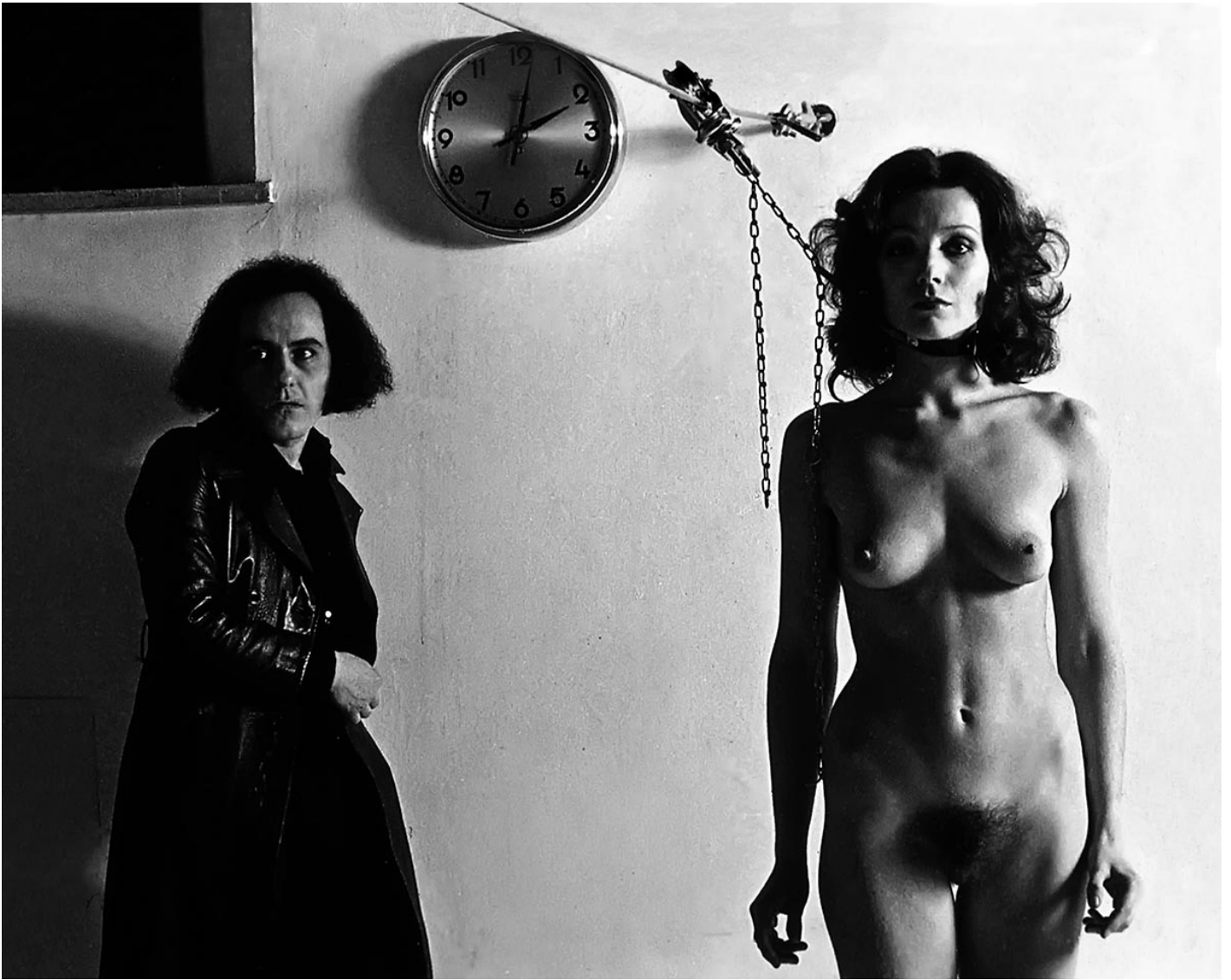
Vettor Pisani, Lo scorrevole , 1970

Se i due momenti di Ghenos Eros Thanatos , la "scrittura espositiva" e lo scritto in catalogo, sono distinti ma geneticamente compenetrati, non si danno una senza l'altro cos'è che alla "mostra-libro" corrisponde dialetticamente un "libro-mappa" in cui testo e immagini a piena pagina scorrono uno accanto alle altre in reciproca autonomia, e scrivere nello spazio della mostra e scrivere sulla pagina stampata appaiono, nell'economia del progetto di Boatto, due polarità in competizione tra loro. Il testo abolisce infatti specificamente ciò che nell'ambiente di esposizione è il dato essenziale: le opere, i loro titoli, i nomi dei loro autori. La soppressione di questi elementi può a prima vista parere sorprendente, ma la decisione sottintende una deliberata strategia di emancipazione della scrittura critica da ogni servitù, e forse da ogni corresponsabilità, nei confronti del suo oggetto. È uno stratagemma essenziale che serve ad assegnare al testo un territorio autonomo e alla critica un'occasione per ricostruire la propria autorevolezza, oltre la mera funzione asseverativa di un "valore" di cui si denuncia in modo implicito la definitiva reificazione.