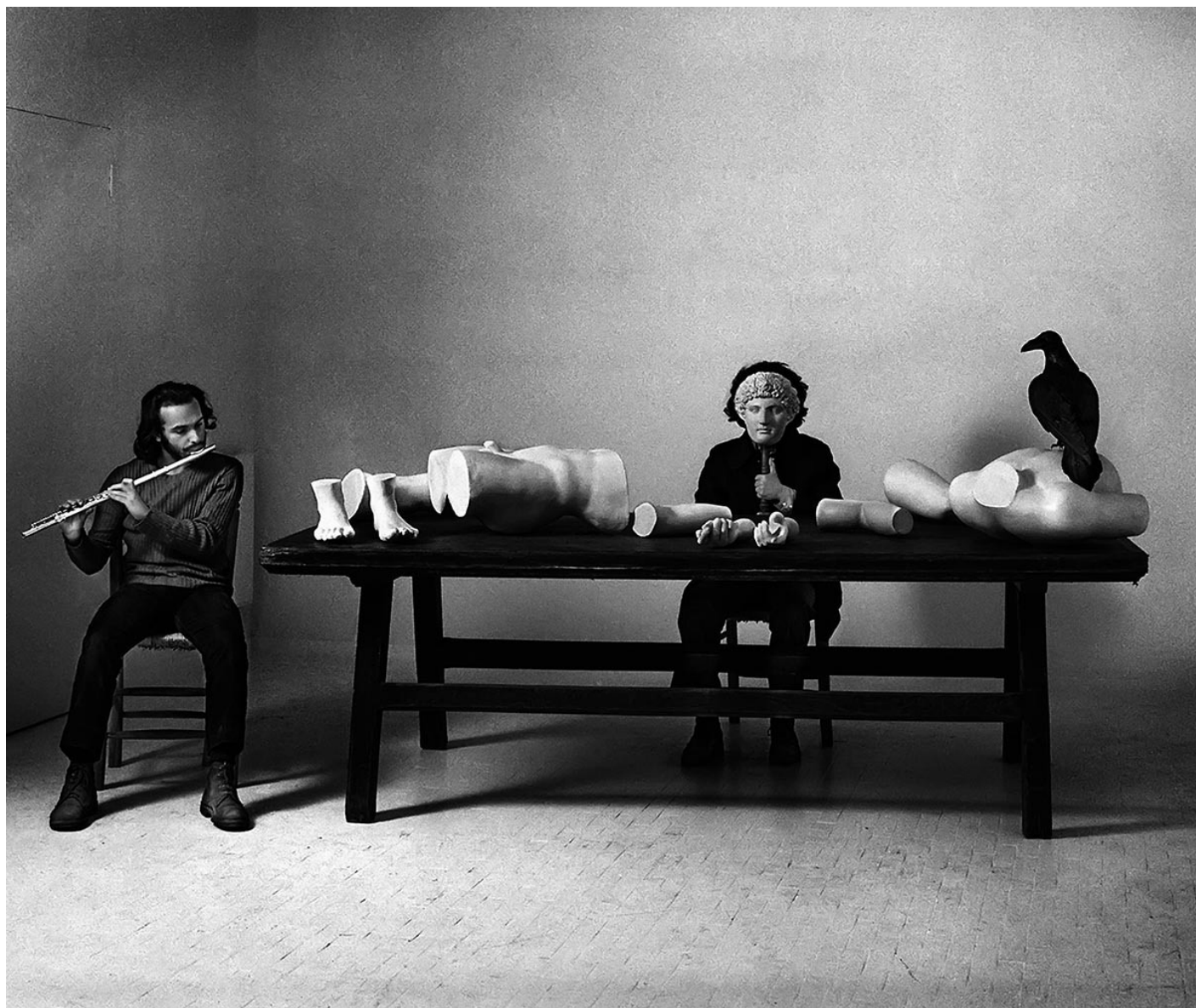
Jannis Kounellis, Senza titolo , 1973