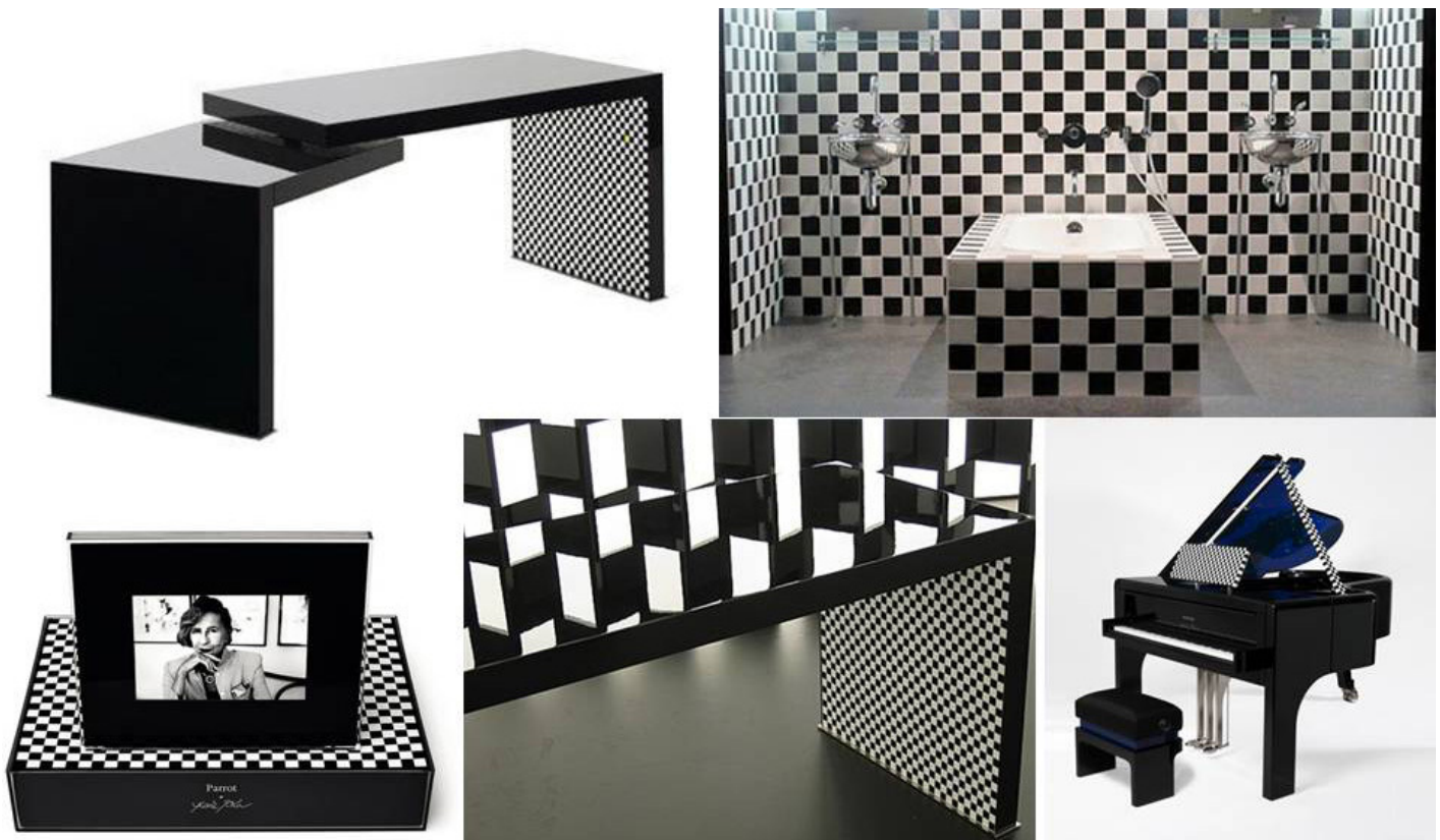
Da sinistra in alto: tavolo bianco e nero laccato; sala da bagno Hotel Morgans, New York (1984); ritratto numerico (2008); dettaglio del tavolo precedente; pianoforte Via Lattea (2008).

La dame aux damiers è una delle perifrasi con cui era conosciuta Andrée Putman, in virtù del suo amore per gli scacchi e per il bianco e nero. Dominanti nei suoi progetti degli Anni Ottanta, ma mai abbandonati neppure in quelli successivi, gli scacchi appaiono come una chiara rivisitazione dell' Art Cinétique , che aveva grandemente influenzato la moda degli Anni Sessanta (soprattutto quella di André Courrèges, di Jacques Esterel e di Pierre Cardin) al cui mondo la Putman apparteneva, prima di approdare, ultracinquantenne, a quello del design.