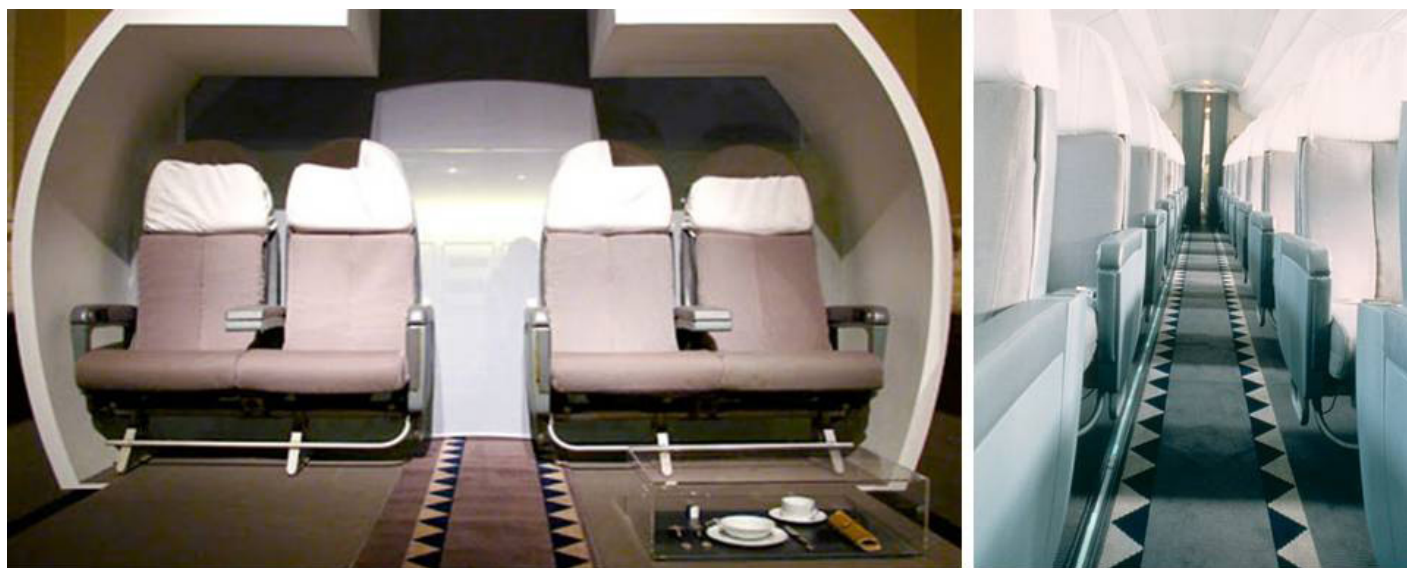
Interni del Concorde, 1995.

storico sugli Champs-Élysées, tanto il minimalismo putmaniano aveva sedotto l'utenza d'élite. Sarà allora che il quotidiano Le Monde la definirà la 'vestale dell'immacolato concettuale', anche dopo che, nel 1995, Air France si era rivolta a lei per gli arredi del quarto Concorde, il mitico aereo con il muso a “becco di cicogna”.