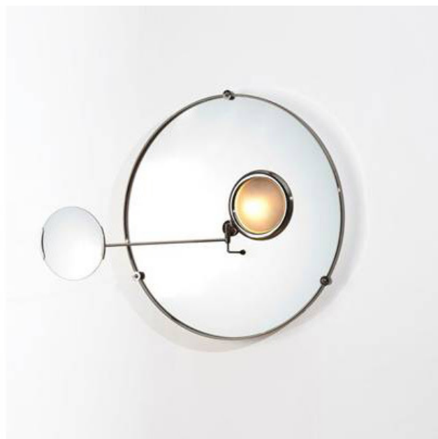
Lampada di Mariano Fortuny i de Madrazo e Specchio satellite di Eileen Gray.

« L'éternel dans l'instant », è uno dei motti di Charles Baudelaire, preso a prestito per dare il titolo a una delle ultime rassegne dedicate all'opera di Andrée Putman, allestite nella sua città d'origine prima della sua morte.