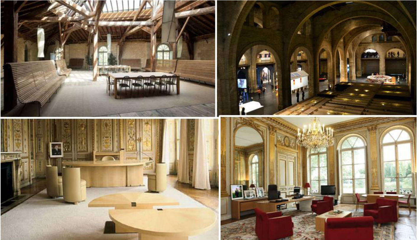
In alto: CAPC, Bordeaux (1984.) In basso: Ufficio di Jack Lang (1985).

Tra gli interni più antipodici realizzati da “ la grande dame du design ” (soprannome mutuato dal suo progetto del 1998 per la Maison Veuve Clicquot Ponsardin di una bottiglia di champagne, chiamata appunto La Grande Dame , dotata di scatola-scrigno, rigorosamente a scacchi, che riempita di ghiaccio diventa cestello raffredda bottiglia), due appaiono soprattutto emblematici dell’antinomia che ne ha connotato la poetica, sempre oscillante tra un minimalismo quasi conventuale e uno sfarzo raffinato fino all’estremo: da un lato, l’allestimento museale del CAPC ( Centre d’arts plastiques contemporains ) di Bordeaux, del 1984, e, dall’altro, l’arredamento dello studio personale del ministro della cultura francese Jack Lang del 1985, mantenuto inalterato da tutti i ministri della cultura successivi.