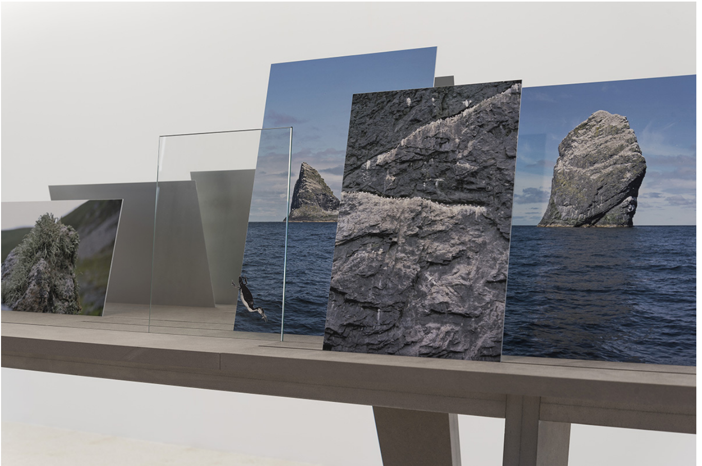
Claudia Losi No Place 2015 tavolo con fotografie, vetri, collages, pietre, oggetti in ceramica, fusioni in bronzo, cartapesta, incisioni su zinco, libro in plastica / table with photographs, glasses, collages, stones, ceramic objects, bronze sculptures, papier-mâché, zinc etchings, plastic book particolare / detail

Osservando le opere in mostra penso a George Perec, che in Specie di spazi a cavallo tra il 1973 e il 1974 scrive: