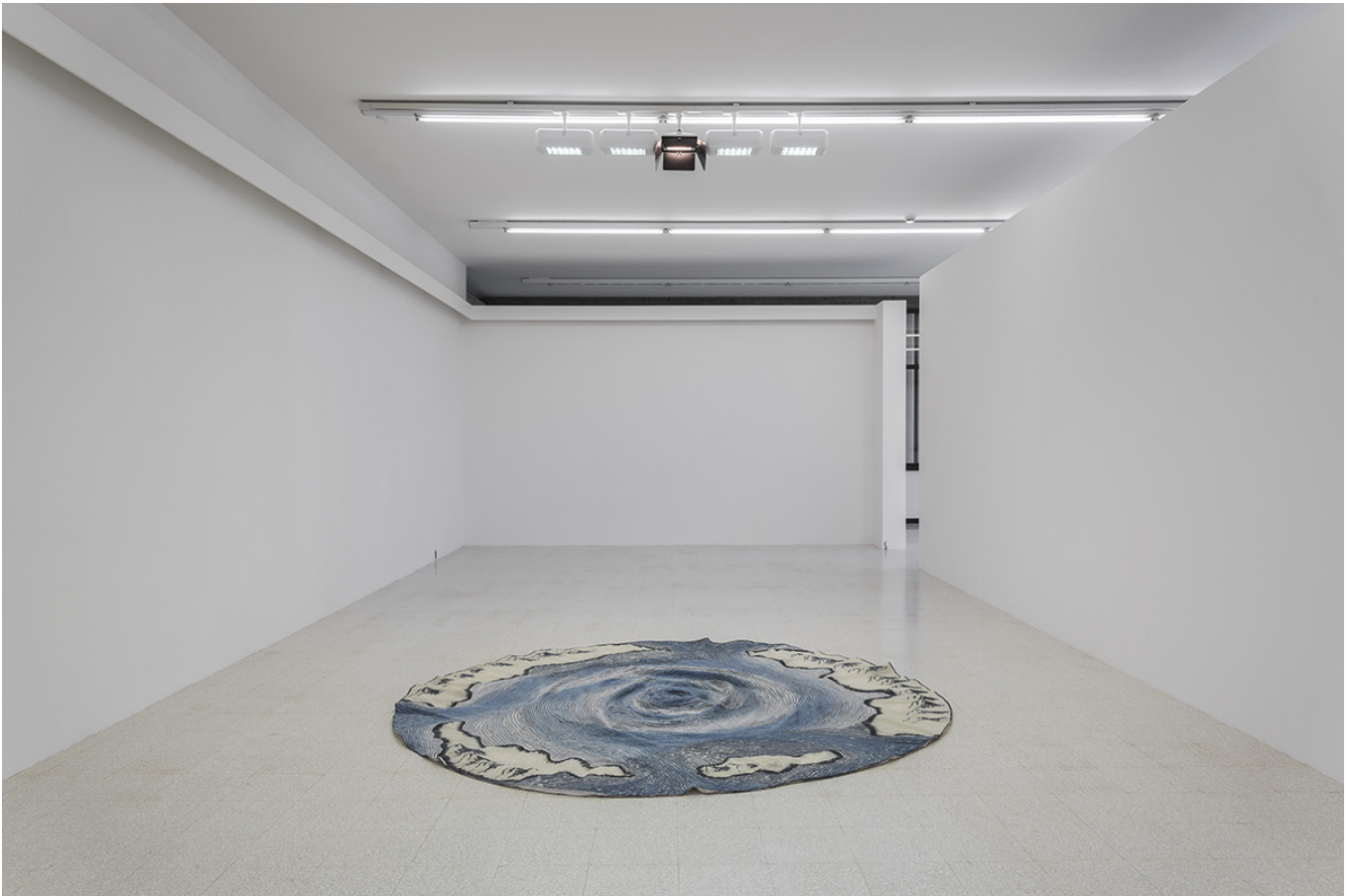
Claudia Losi How do I imagine being there? veduta della mostra / exhibition view Collezione Maramotti, Reggio Emilia

Alpha e omega del viaggio al centro dell'indagine: l'arcipelago di St. Kilda, estremo nord ovest della Scozia, un remoto paradiso naturale. Un altro finis terrae, costantemente spazzato dai venti e in balia dei marosi atlantici, un luogo che Losi ha raggiunto solo al secondo faticoso tentativo di approdo, mentre altre persone coinvolte nell'elaborazione di testi e materiali non lo visiteranno mai, se non grazie alla cartografia e alla letteratura dedicata.