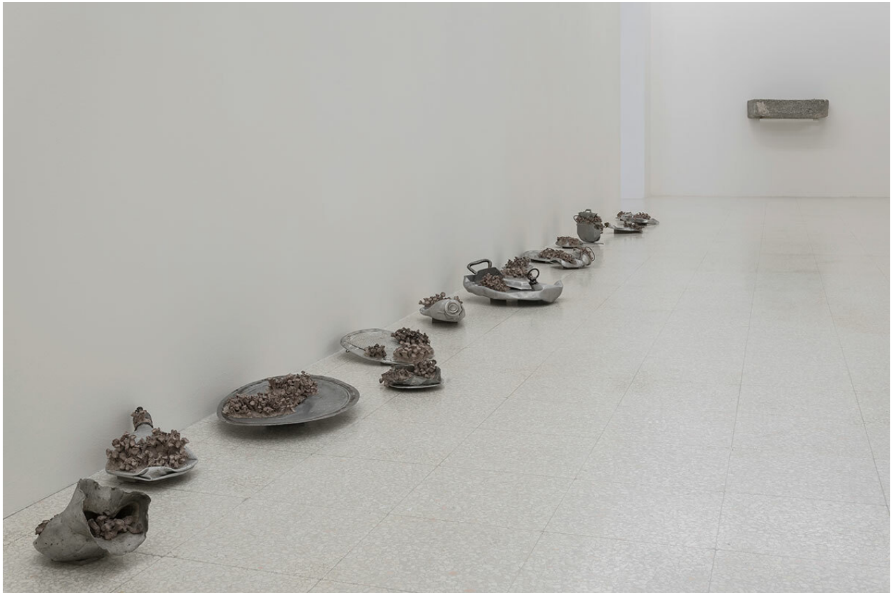
Claudia Losi How do I imagine being there? veduta della mostra / exhibition view Collezione Maramotti, Reggio Emilia Ph. Marco Siracusano.

Tutti gli oggetti accuratamente scelti per comporre l'esposizione appartengono a un mondo lontano eppure curiosamente familiari, alcuni ormai inutilizzati, coperti di concrezioni vegetali e trasmutati allo stato di reperti di una memoria finzionale. Gli scarichi di fornace, i portolani, le rocce che testimoniano l'opera di catalogazione dei Musei Civici di Reggio Emilia, il telo ricamato che richiama Athanasius Kircher, sono essi stessi invitati a partecipare al viaggio, in quel detournement che tipicamente avviene nel momento in cui l'esperienza - vera o presunta - si tramuta in narrazione. Il legame tra il compiersi di un viaggio e il racconto è così intrinsecamente profondo che sospetto non possano esistere l'uno senza l'altro: la parola trova il proprio senso primario e la sua completezza nell'arco spazio-temporale di un moto a luogo, è sempre inconfutabilmente elemento che ci trascina da un punto ad un altrove; lo spostamento non può essere se non trova accogliamento e forma in una narrazione, anche muta e non esplicitata, ma vivente, che appare ogni qual volta fantastichiamo su un andare, come un riflesso in uno specchio d'acqua.