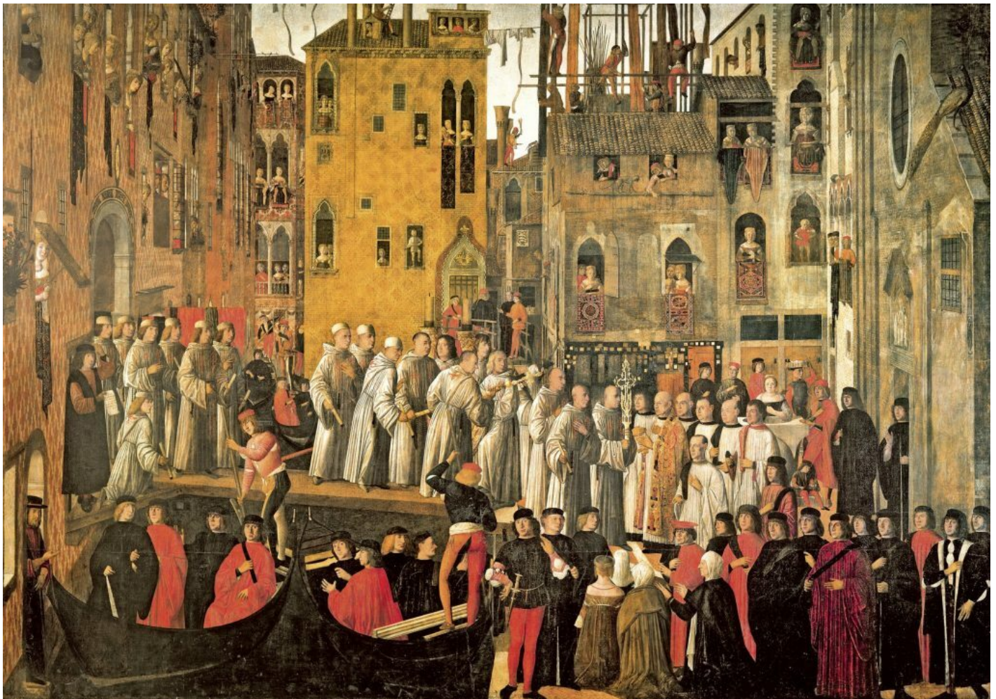
Giovanni Mansueti, Miracolo della reliquia della Santa Croce in Campo San Lio (1496).

Diers riconduce la fotografia a un celebre antecedente, il frontespizio del Leviatano di Hobbes (1651). E trova un antenato di quelle immagini nell'opera di un allievo dei Bellini, Giovanni Mansueti: il Miracolo della reliquia della Santa Croce in Campo San Lio (1496) mostra la folla degli uomini nelle strade e nella piazza, osservata dalle donne affacciate alle finestre, in una dialettica tra interno ed esterno, tra spazio pubblico e privato, tra maschile e femminile.