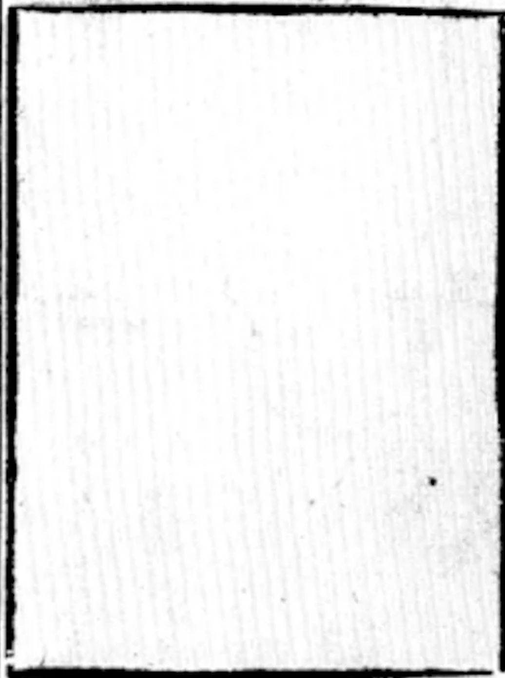
Figura neminis. quia nemo in ea depictus.

de sancto Nemine cum preseruatione regni eiusdem ab epidemia.