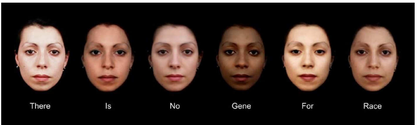
Nancy Burson, The Human Race Machine.

Ma è anche possibile ottenere effetti stranianti e conoscitivi, come fa dagli anni Settanta Nancy Burson, per studiare la nostra reazione (anche emotiva) di fronte all'Altro. Come lo vediamo, un volto umano? Come lo guardiamo? Come lo giudichiamo? In particolare, l’artista (che collabora con il MIT) ha costruito immagini che deformano i volti facendo loro assumere caratteristiche che associamo a etnie diverse, per vedere le reazioni che suscitano le diverse tipologie somatiche, dall’empatia alla repulsione.