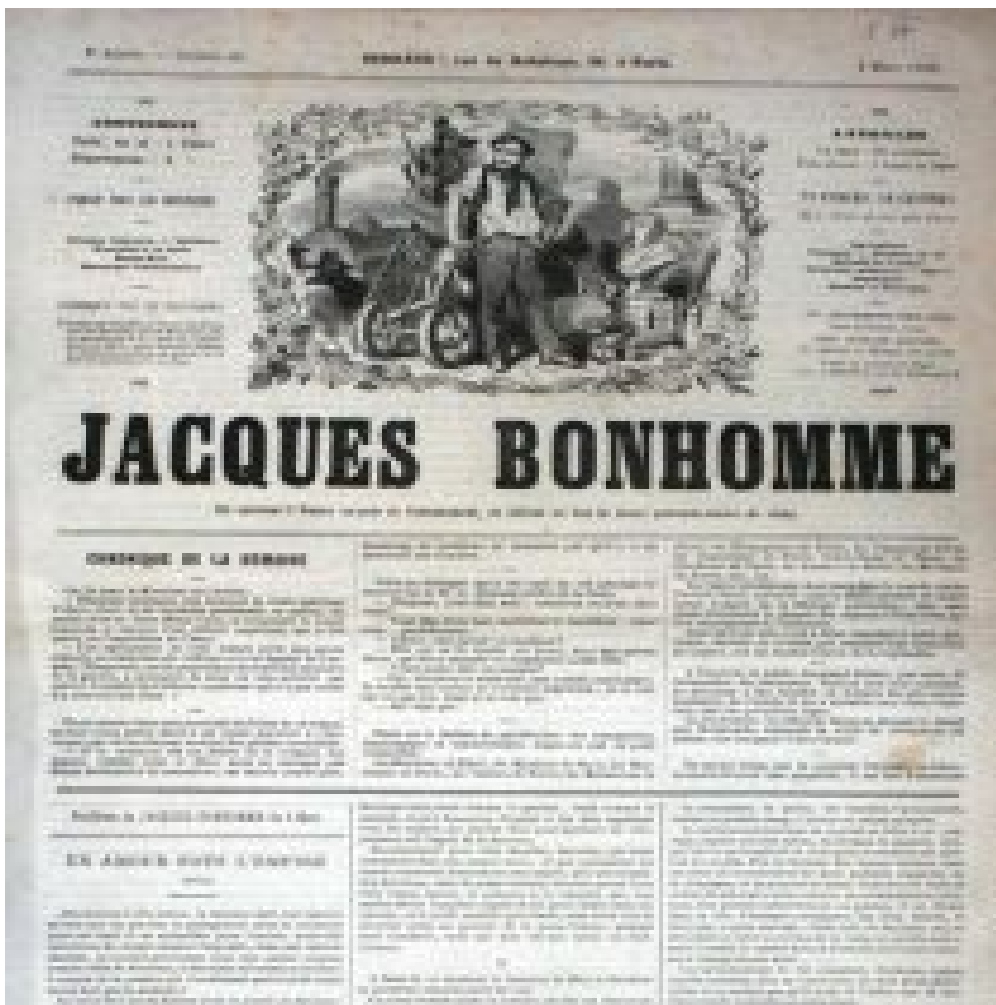
Jacques Bonhomme, ovvero l'Uomo Qualunque versione francese.

Dagli albori della modernità l'Uomo Qualunque (e poi la Ragazza della Porta Accanto) hanno trovato molteplici incarnazioni, a volte contraddittorie. Sbucano nei contesti più vari, dalla politica alla filosofia, dalle arti visive al teatro, dal cinema alla pubblicità, e offrono un prezioso indicatore delle pulsazioni (e delle convulsioni) dell'immaginario collettivo. Con l'affermarsi della democrazia, il fulcro simbolico dell'ordine sociale non è più il Corpo del Re, vertice e fondamento dei corpi intermedi in cui si articolavano le società tradizionali. Ma non può esserlo nemmeno la massa indifferenziata, il crogiolo comunitario in cui le soggettività si sono azzerate in un'unica volontà. L'Uomo Qualunque è l'artificio retorico che offre una precaria soluzione al problema dell'identità e della volontà collettive.