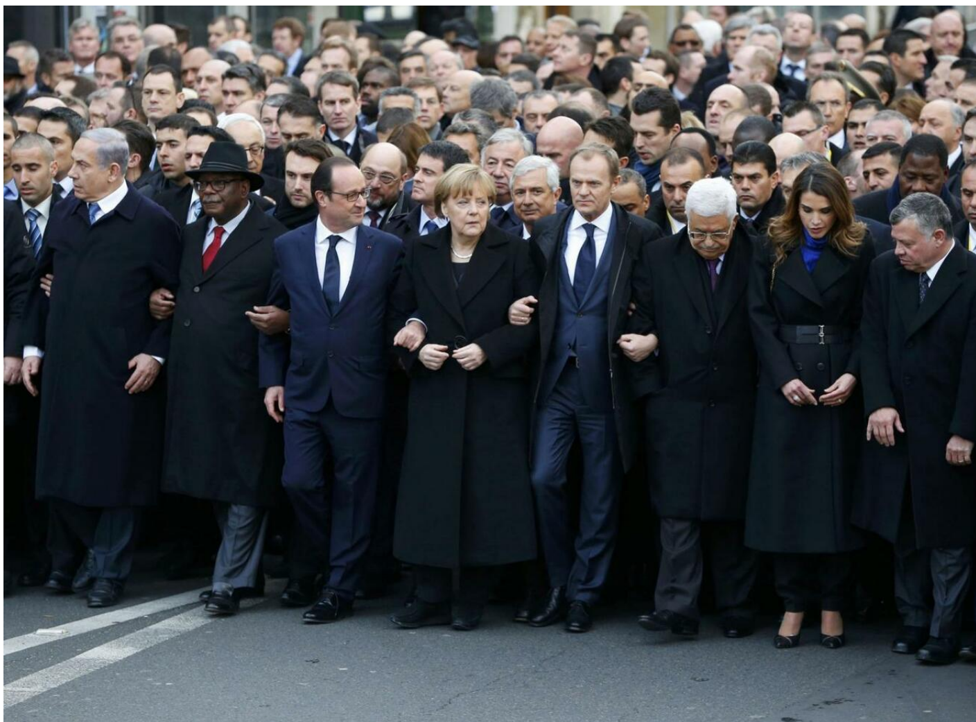
La manifestazione dei Capi di Stato, Parigi, 11 gennaio 2015

Nella figura del Leviatano, il corpo dell'Everybody trova una testa.