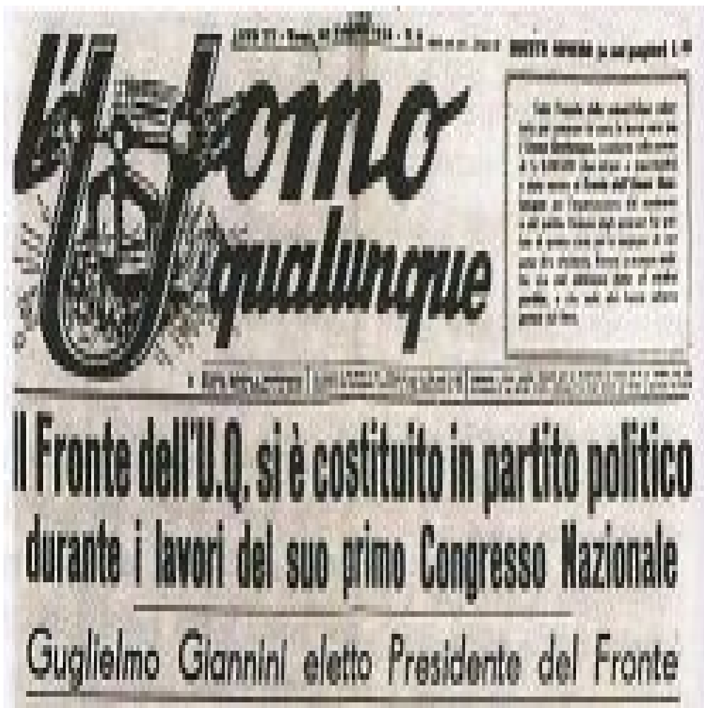
Il settimanale “L’Uomo qualunque” (1946).

Nella sua parabola, lo Everybody è agito da due paradossi simmetrici. Il primo nodo riguarda le modalità in cui il particolare – la differenza – si riconnette con l’universale, senza annullarsi ovvero senza perdere la propria identità. Simmetricamente, come è possibile che dalla molteplicità degli Everyone, dalla volontà di ciascuno di noi, si crei una public authority ? Come le singole determinazioni si possono coagulare in una volontà collettiva? Da sempre la filosofia politica si interroga sulle modalità con cui l’individualismo del singolo può risolversi nell’individualismo dell’universale. Oggi questo processo trova una nuova esplosiva declinazione nel web: a caratterizzare la nostra presenza in un social network come Facebook è la dialettica tra l’aspirazione alla stardom e la tendenza all’egualitarismo. Questa mutazione della nostra immagine pubblica e dunque della nostra identità non può non avere conseguenze politiche.