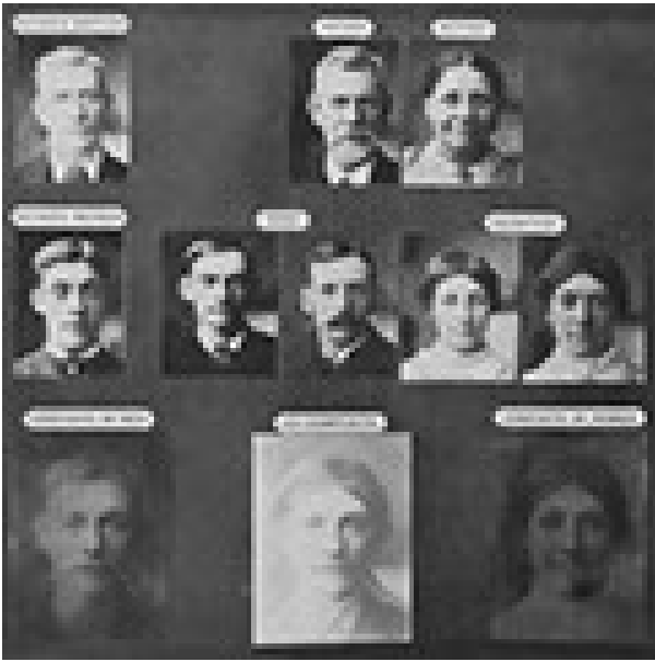
Francis Galton, Composite Portraits (1878).

Un'altra opzione, resa possibile dall'invenzione della fotografia e dalla crescente attenzione per la statistica, è stata esplorata nell'Ottocento con la Composite Portraiture ideata da Francis Galton a partire dal 1878 (a questa tecnica era dedicato l'intervento di Raul Gschrey , autore anch'egli di progetti artistici basati su questa tecnica).