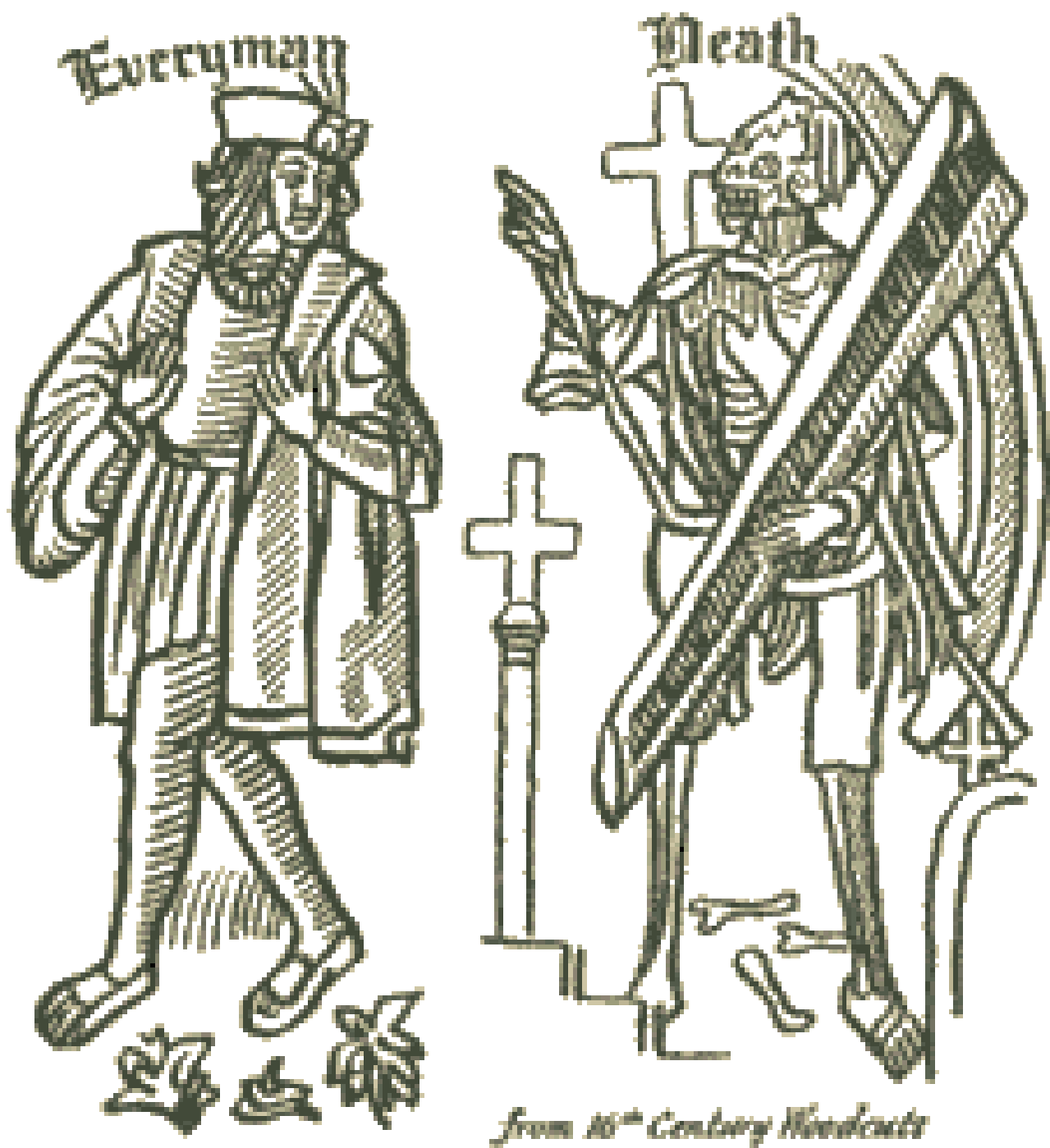
Frontespizio dell'edizione di Everyman pubblicata da John Skot (c. 1530).

Parlare di populismo e qualunquismo per interpretare la scena politica europea contemporanea può apparire semplicistico, o addirittura fuorviante. Spesso queste categorie vengono utilizzate per liquidare gli avversari e sono prive di valore aggiunto interpretativo.