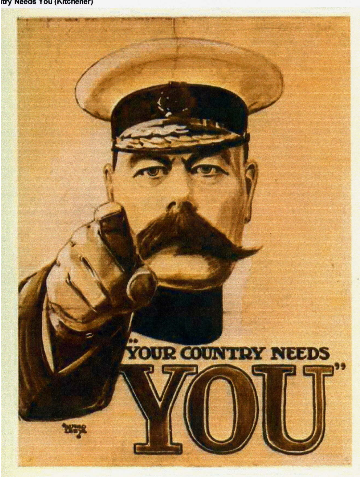
Your Country Needs You (manifesto, 1914).