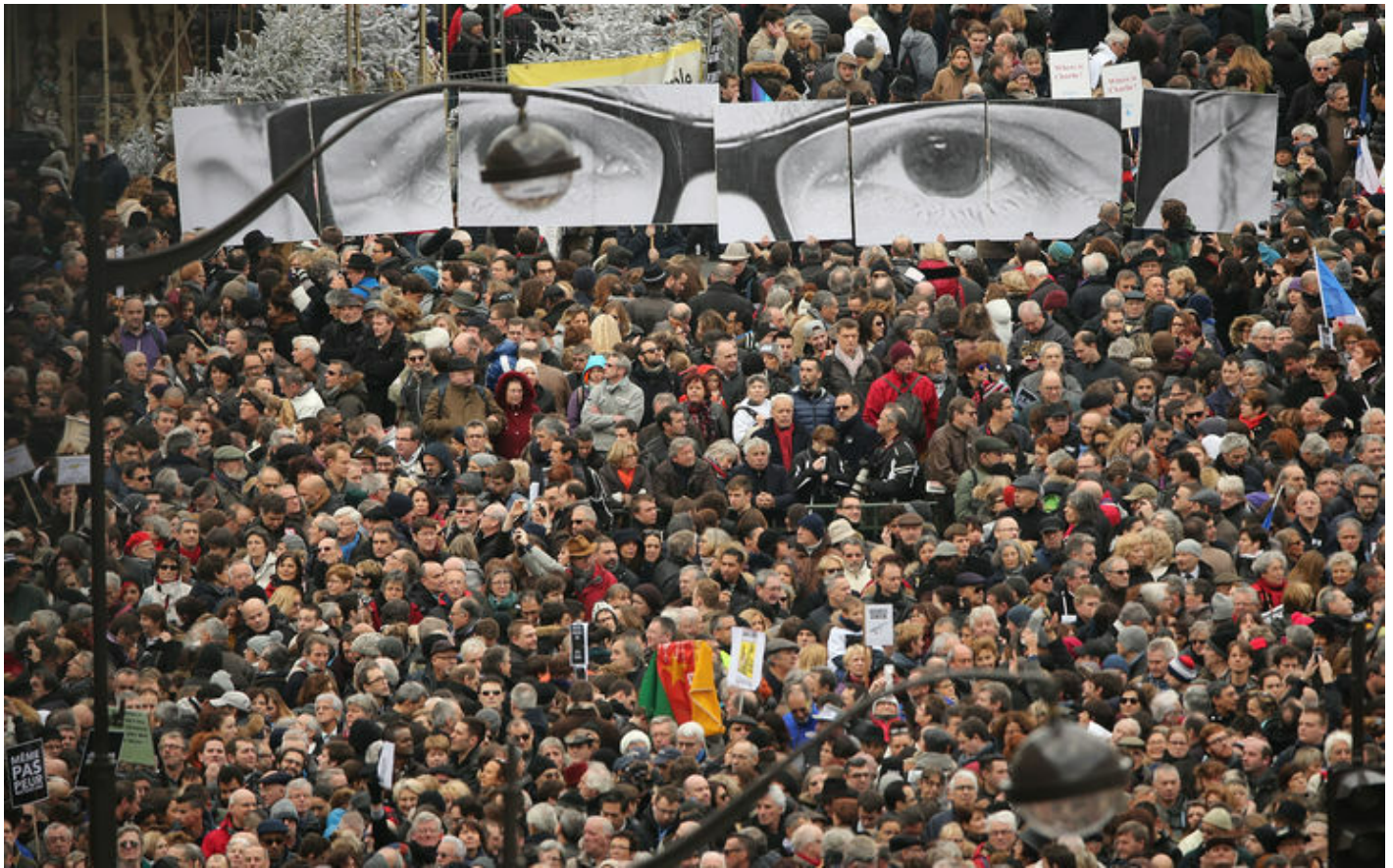
Parigi, Place de la République, 11 gennaio 2015.

Per tracciare un identikit dell'Uomo Qualunque si può partire da un'immagine rubata dall'attualità. Il metodo lo ha indicato Carlo Ginzburg, quando ha ricondotto l'iconografia del celebre manifesto che raffigura Lord Kitchener – “Your Country Needs You” – ai suoi antecedenti, la tradizione pittorica del ritratto frontale e quella del gesto di invocazione: è un'immagine “performativa”, che funziona sulla base della reazione dello spettatore più che sui contenuti che veicola.