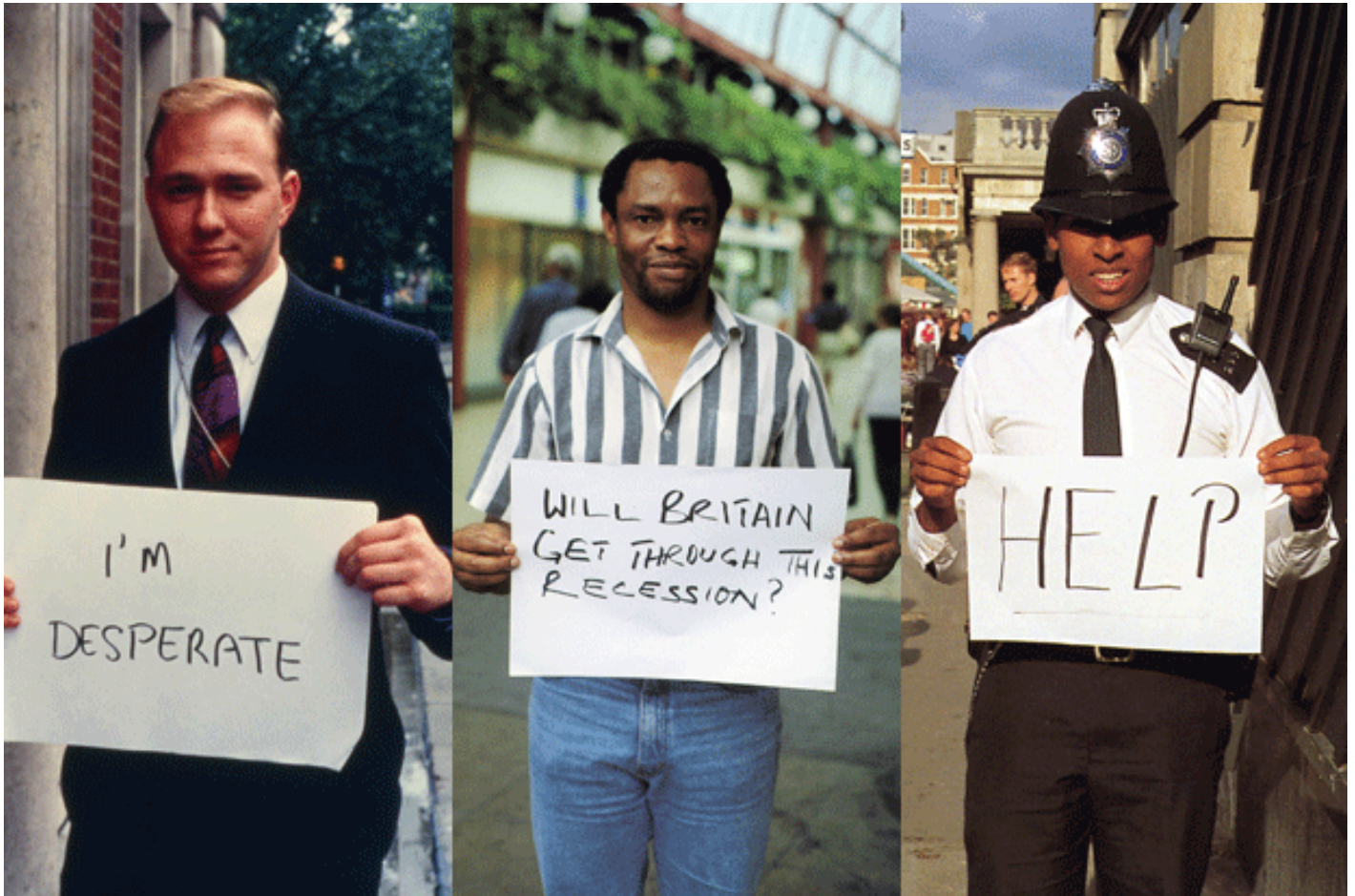
Gillian Wearing, Signs that Say What You Want Them to Say and Not Signs that Say What Someone Else Wants You to Say (1992–3).

In ambito artistico, usano la stessa metodologia alcune opere di Gillian Wearing. Nel suo primo lavoro, Signs that Say What You Want Them to Say and Not Signs that Say What Someone Else Wants You to Say (1992–3), l'artista britannica chiedeva ai passanti che incontrava nelle strade di Londra di scrivere una frase e poi li fotografava con il cartello in mano: per esempio, un poliziotto con la scritta “Aiuto!”.