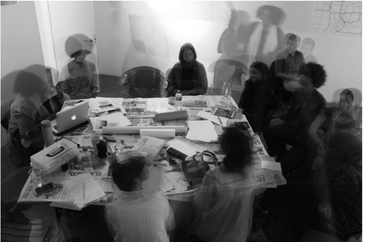
Photos from Numbi Heritage walk Intersectionality workshops and Numbi Rio exhibition.

Il Rich Mix non Ã la sola sede delle attivit del collettivo Numbi Arts, ma lo sono anche altri luoghi che ben rispondono al suo spirito. Nelle nostre peregrinazioni londinesi, uno dei nostri spazi prediletti era lâ?iklectik Art- Lab, dove si realizzano laboratori, conferenze, proiezioni, concerti, letture e, che nelle parole del suo direttore, Eduard Solaz, Ã una performance costante, unâ?installazione sociale, un luogo dove persone diversissime si incontrano e interagiscono.