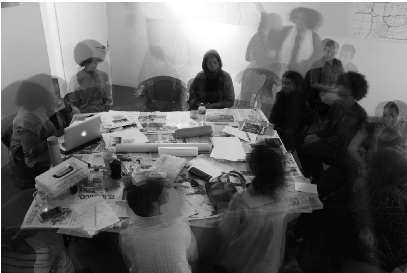
Photos from Numbi Heritage walk Intersectionality workshops and Numbi Rio exhibition.

Il Rich Mix non è la sola sede delle attività del collettivo Numbi Arts, ma lo sono anche altri luoghi che ben rispondono al suo spirito. Nelle nostre peregrinazioni londinesi, uno dei nostri spazi prediletti era l'iklektik Art- Lab, dove si realizzano laboratori, conferenze, proiezioni, concerti, letture e, che nelle parole del suo direttore, Eduard Solaz, è una performance costante, un'installazione sociale, un luogo dove persone diversissime si incontrano e interagiscono.