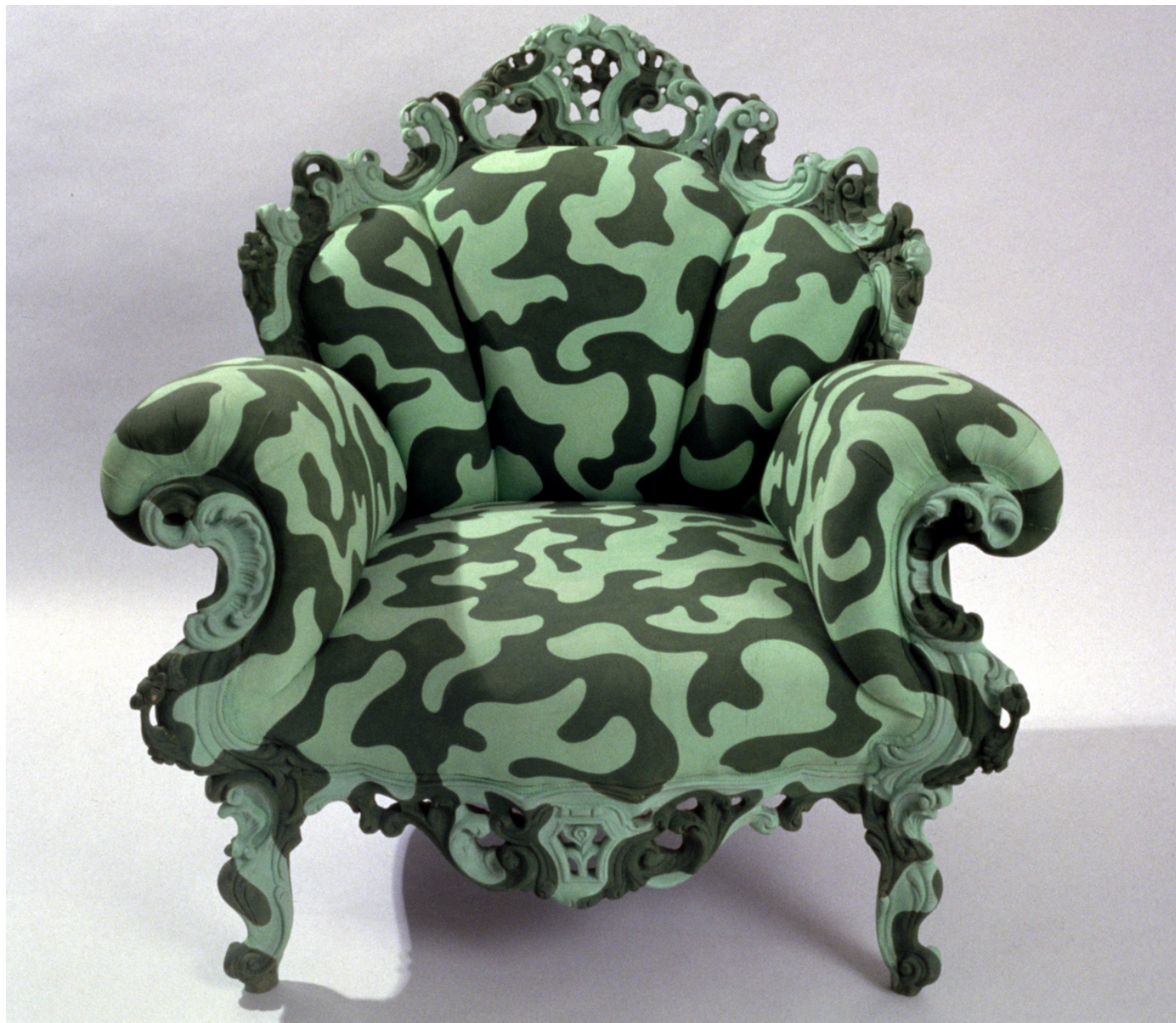
Poltrona di Proust ecomimetica.