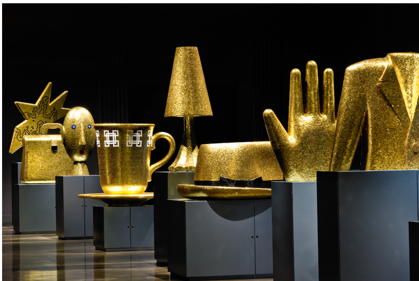
Mobili per uomo 1997-2003.