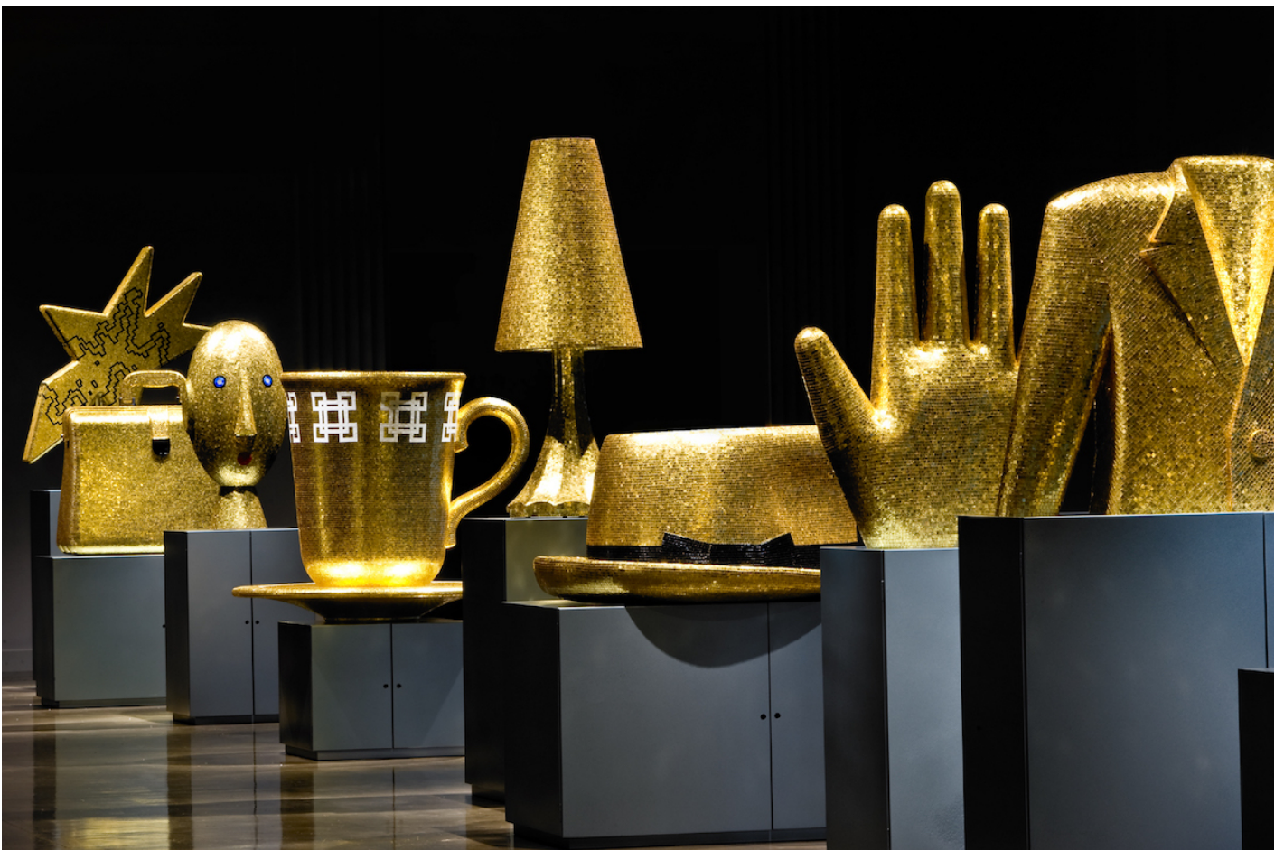
Mobili per uomo 1997-2003.