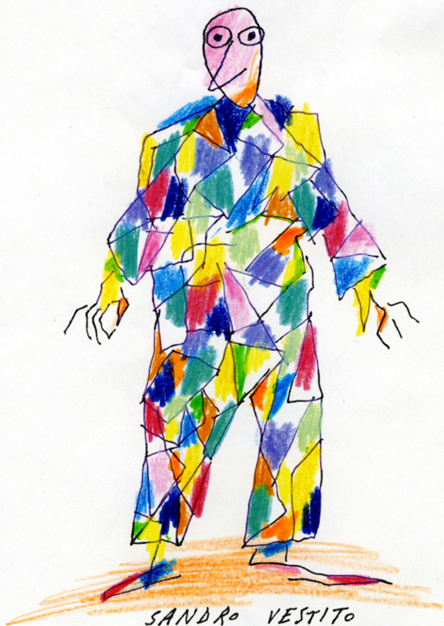
SANDRO VESTITO DA ARLECCHINO