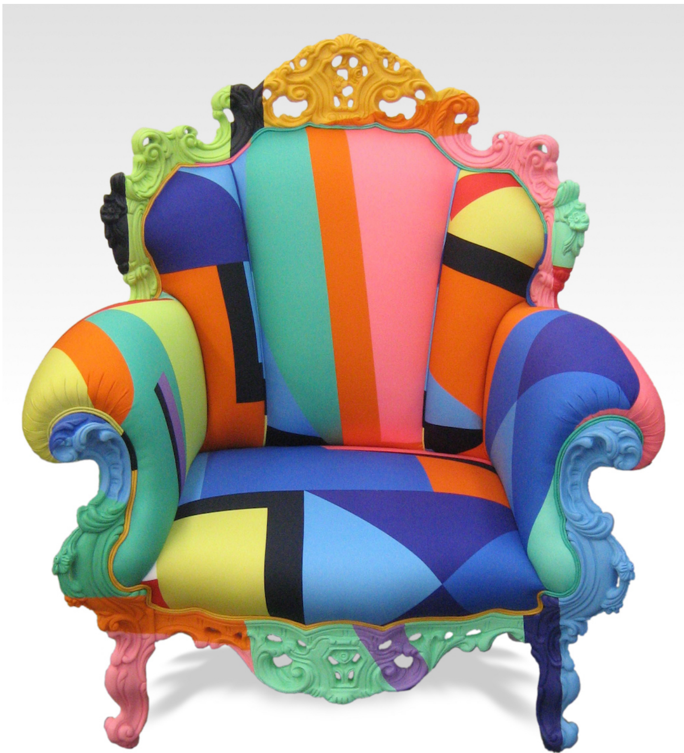
Poltrona di Proust geometrica.