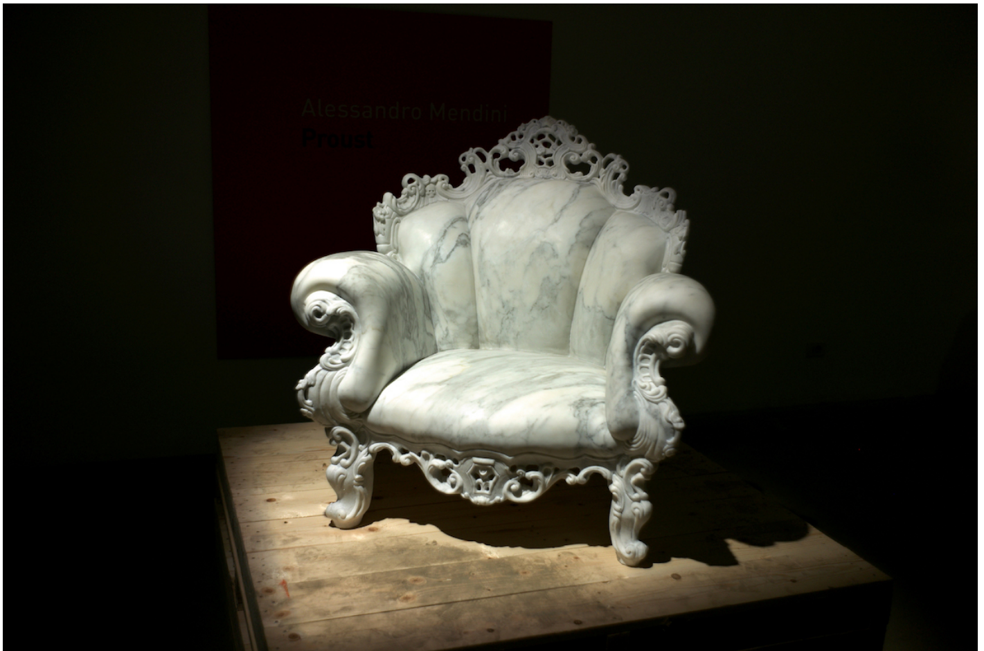
Poltrona di Proust marmo.

Mendini, più di altri, per il ruolo che ha avuto nel mondo delle riviste (è stato il successore di Ponti in Domus, ha diretto Casabella e Modo, oltre a Ollo), forse è colui che ha affrescato meglio di chiunque altro la grande storia del Radical e del Post moderno e in questo ha messo in scena il pensiero del progetto dell'architettura e del design, mostrando il lato intellettuale, (ossia quello del pensiero prima ancora del disegno o le immagini), rivendicando la volontà di agire nel territorio aperto (e con regole proprie) del consumo, per incontrarsi e scontrarsi con esso, sedurlo, cavalcarlo o forse più semplicemente piegarlo al proprio volere, addomesticarlo. Già. Quasi che tutto si risolvesse in questo magico potere di ricondurre ogni cosa nella dimensione domestica e soffice della casa.