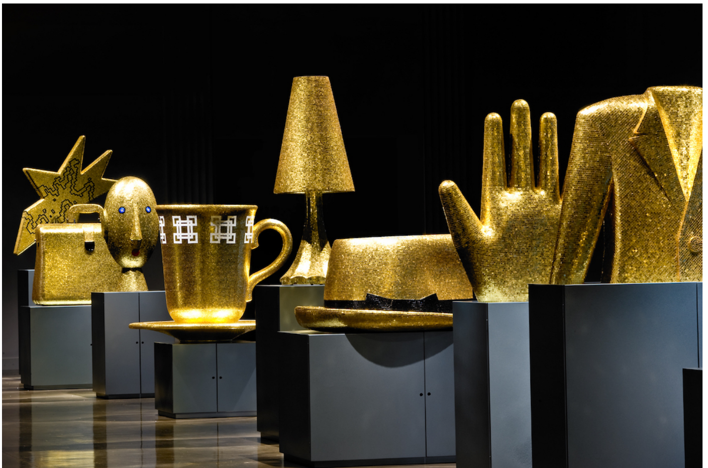
Mobili per uomo 1997-2003.