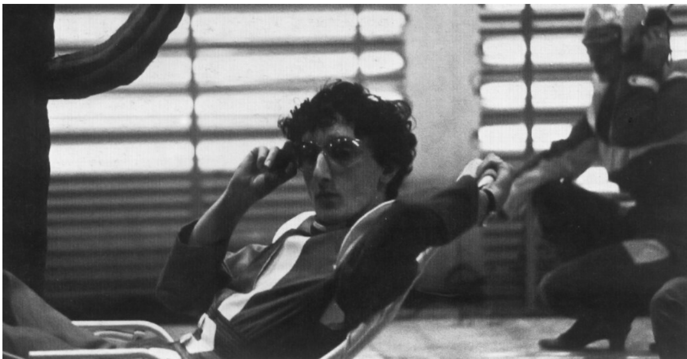
Magazzini Criminali, Crollo Nervoso, ph. Patrizia Rossi.