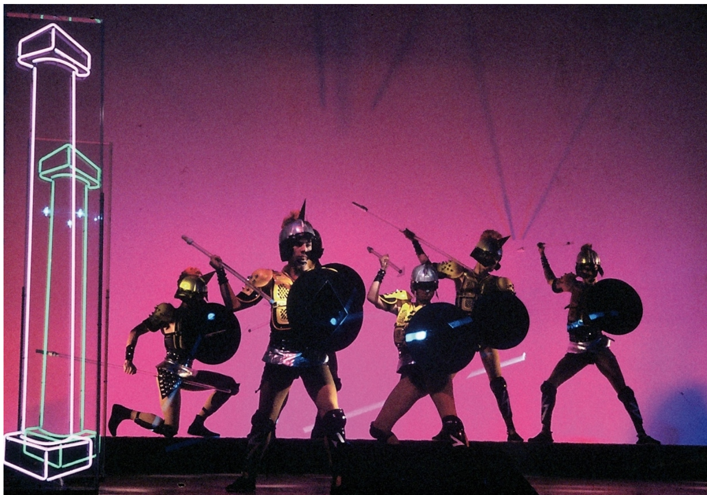
Krypton, Eneide, ph. Sferlazzo Lucchese.

La seconda parte del libro affronta, per grandi nuclei concettuali, attitudini e forme del Nuovo Teatro: la drammaturgia dello spettacolo che inizia a essere composta dalla figura (inedita fino ad allora per l'Italia) dello scrittore-autore; la messa in discussione dell'impianto scenico e di tutte le sue parti; il teatro-luogo non solo inteso come palcoscenico, ma nella sua interezza finanche alla strada; l'attore e l'uso nuovo della parola (accorciata, tagliuzzata, mescolata, gridata, narrata, disegnata, proiettata, elisa). Il pluralismo dei discorsi artistici che si è aperto in questi cinquanta anni di teatro, quella seconda via che ne configurava una terza e poi chissà quante altre ancora, ha contribuito a raccontare una Italia diversa, un laboratorio che voleva sperimentare e provare a cambiare un Paese. Una vivacità, quella teatrale, che ha lasciato un segno forte nella nostra identità culturale. Di tutto questo ricercare e di quello che ne è scaturito il libro della Valentini è guida, gioiosa e presente. È questo entusiasmo, questa voglia di raccontare e regalare ai lettori di oggi e di domani i tratti di questa avventura a rendere questo libro un bene prezioso.