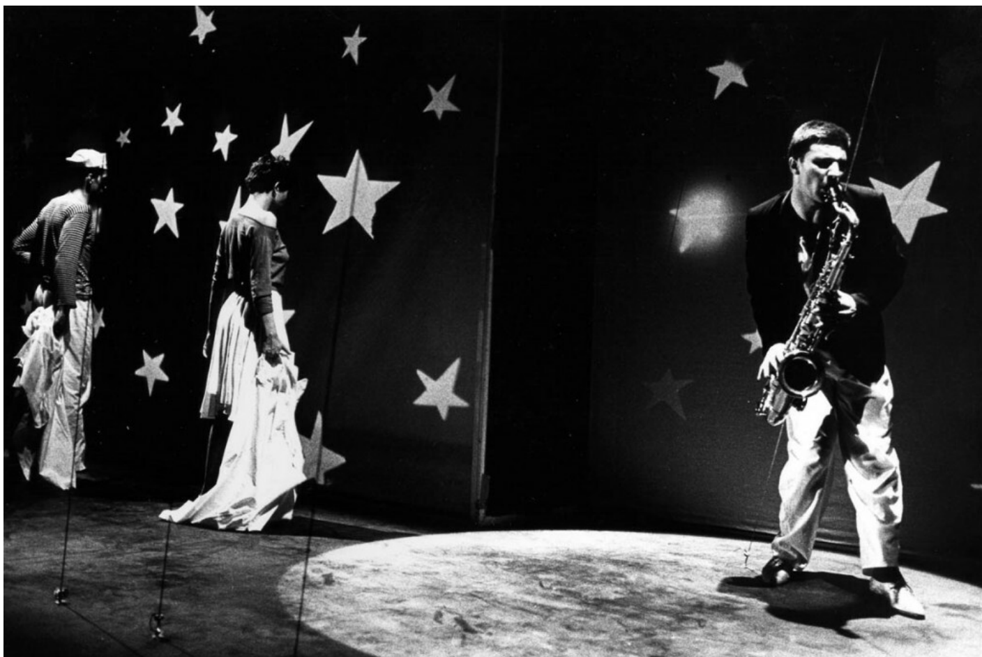
Falso Movimento, Tango Glaciale