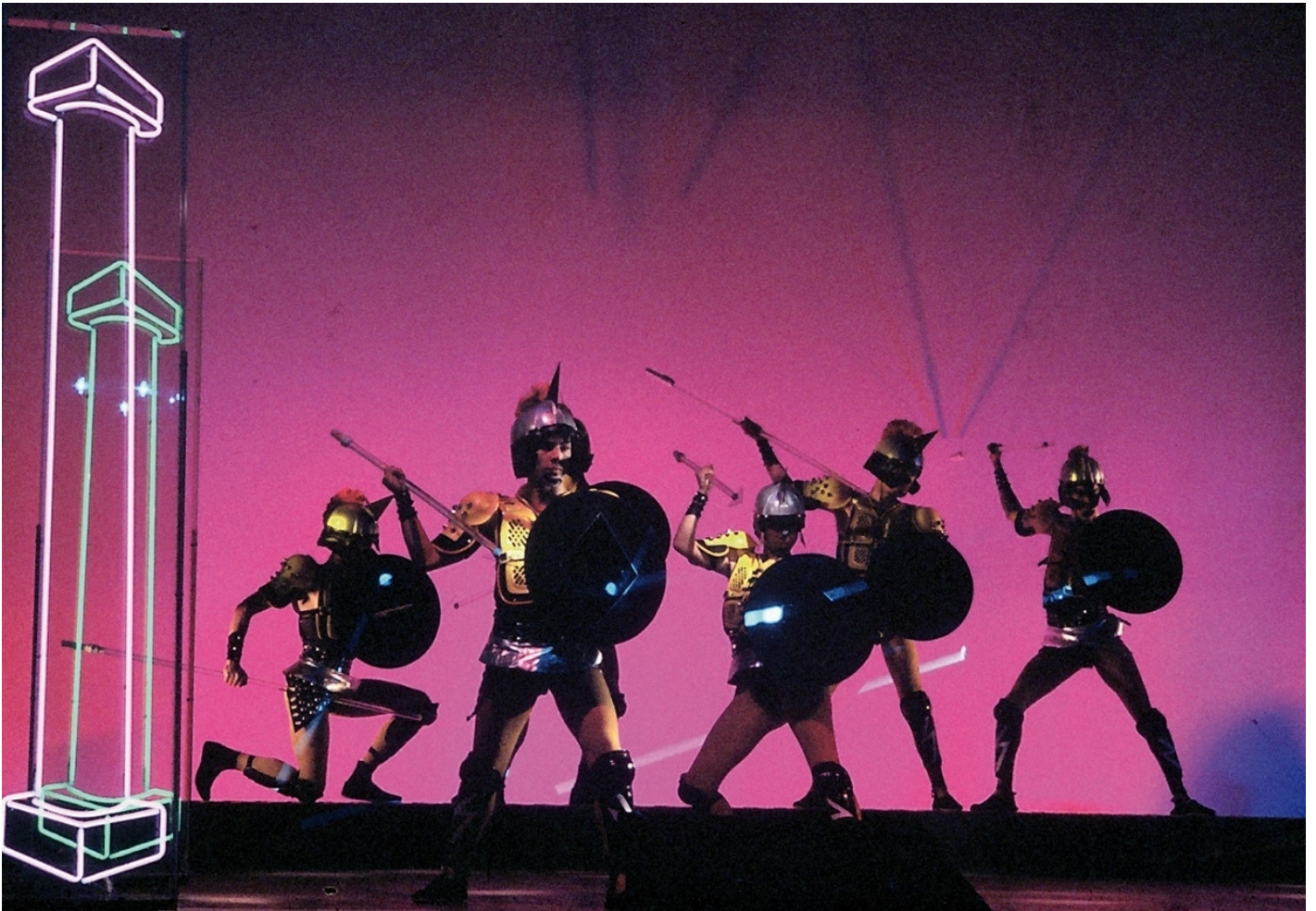
Krypton, Eneide.

La seconda parte del libro affronta, per grandi nuclei concettuali, attitudini e forme del Nuovo Teatro: la drammaturgia dello spettacolo che inizia a essere composta dalla figura (inedita fino ad allora per l'??Italia) dello scrittore-autore; la messa in discussione dell'??impianto scenico e di tutte le sue parti; il teatro-luogo non solo inteso come palcoscenico, ma nella sua interezza finanche alla strada; l'??attore e l'??uso nuovo della parola (accorciata, tagliuzzata, mescolata, gridata, narrata, disegnata, proiettata, elisa). Il pluralismo dei discorsi artistici che si Ã? aperto in questi cinquanta anni di teatro, quella seconda via che ne configurava una terza e poi chissÃ? quante altre ancora, ha contribuito a raccontare una Italia diversa, un laboratorio che voleva sperimentare e provare a cambiare un Paese. Una vivacitÃ?, quella teatrale, che ha lasciato un segno forte nella nostra identitÃ? culturale. Di tutto questo ricercare e di quello che ne Ã? scaturito il libro della Valentini Ã? guida, gioiosa e presente. Ã? questo entusiasmo, questa voglia di raccontare e regalare ai lettori di oggi e di domani i tratti di questa avventura a rendere questo libro un bene prezioso.