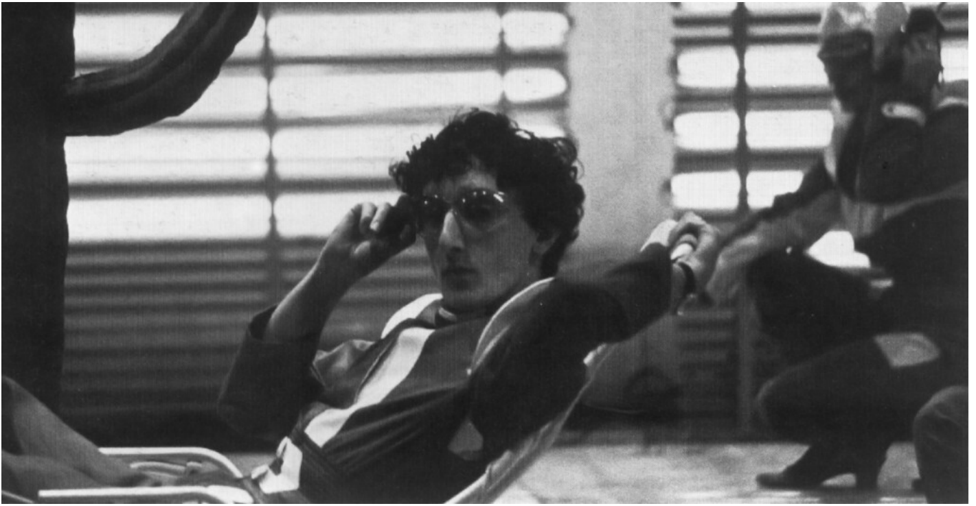
Magazzini Criminali, Crollo Nervoso, ph. Patrizia Rossi.