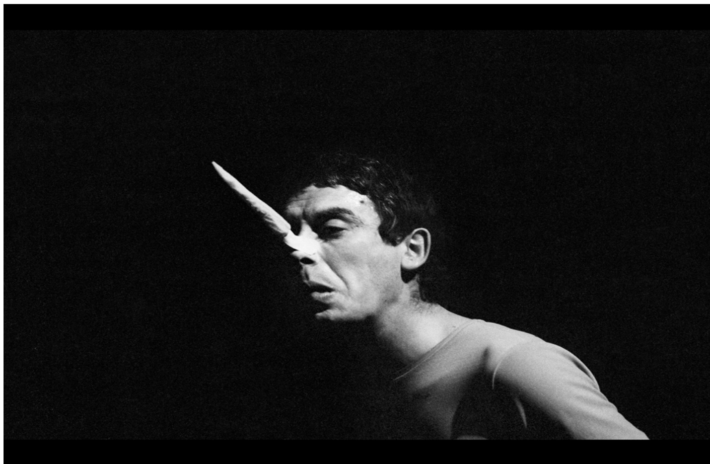
Carmelo Bene, Pinocchio, ph. Claudio Abate.

La nostra Storia dal secondo dopoguerra fino a oggi Ã¨ fatta di continue onde, progressi e indietreggiamenti, riempimenti e svuotamenti, aperture e chiusure date in successione. Dalla politica all'economia, dalla letteratura alla scienza, tutto Ã¨ come se stesse su una barca che oscilla a seconda degli agenti interni ed esterni e della loro potenza: un oscillare che Ã¨ in stretta relazione con il passato ed Ã¨ conscio di essere base di appoggio per il futuro che verrÃ . Questo andamento appena descritto Ã¨ valido anche per la storia del teatro, o meglio per la storia di quel multiforme filone di teatro descritto nell'ultimo volume curato da Valentina Valentini, Nuovo Teatro Made in Italy (1963-2013) , uscito per Bulzoni sul finire dell'anno scorso. Strettamente connesso al volume Ã¨ il sito nuovoteatromadeinitaly.it che arricchisce di studi e proposte utili il contenuto cartaceo.