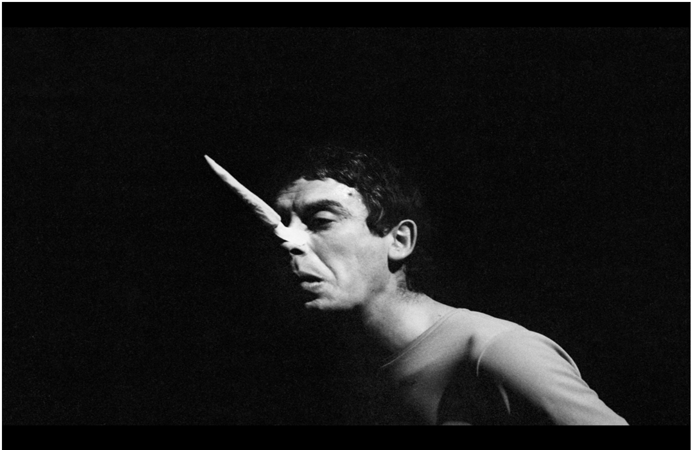
Carmelo Bene, Pinocchio, ph. Claudio Abate.

La nostra Storia dal secondo dopoguerra fino a oggi è fatta di continue onde, progressi e indietreggiamenti, riempimenti e svuotamenti, aperture e chiusure date in successione. Dalla politica all'economia, dalla letteratura alla scienza, tutto è come se stesse su una barca che oscilla a seconda degli agenti interni ed esterni e della loro potenza: un oscillare che è in stretta relazione con il passato ed è conscio di essere base di appoggio per il futuro che verrà. Questo andamento appena descritto è valido anche per la storia del teatro, o meglio per la storia di quel multiforme filone di teatro descritto nell'ultimo volume curato da Valentina Valentini, Nuovo Teatro Made in Italy (1963-2013) , uscito per Bulzoni sul finire dell'anno scorso. Strettamente connesso al volume c'è il sito nuovoteatromadeinitaly.it che arricchisce di studi e proposte utili il contenuto cartaceo.