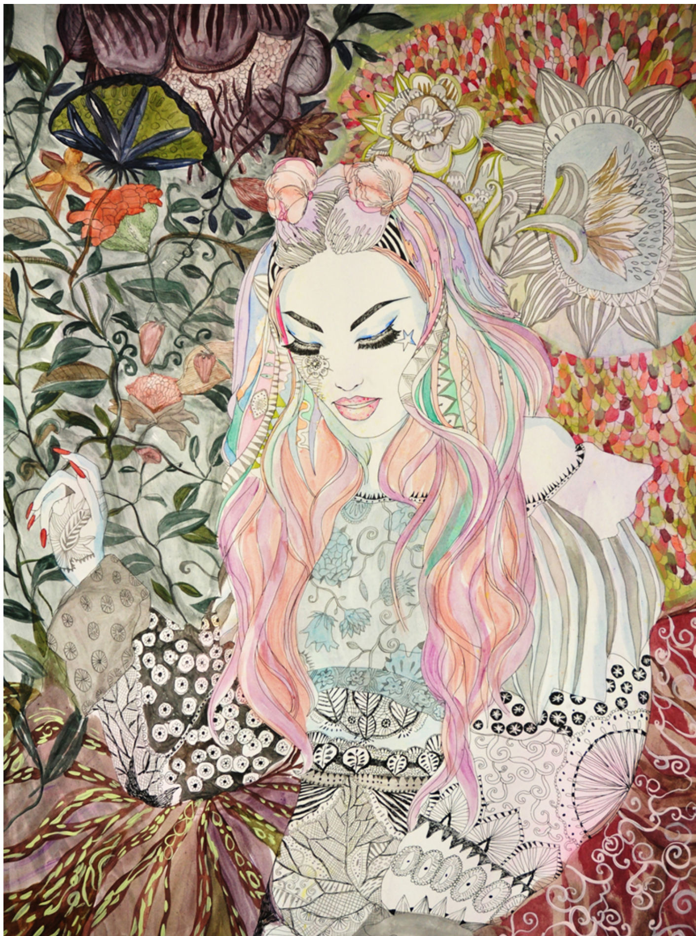
Illustrazione di Aisté Bileviciute.