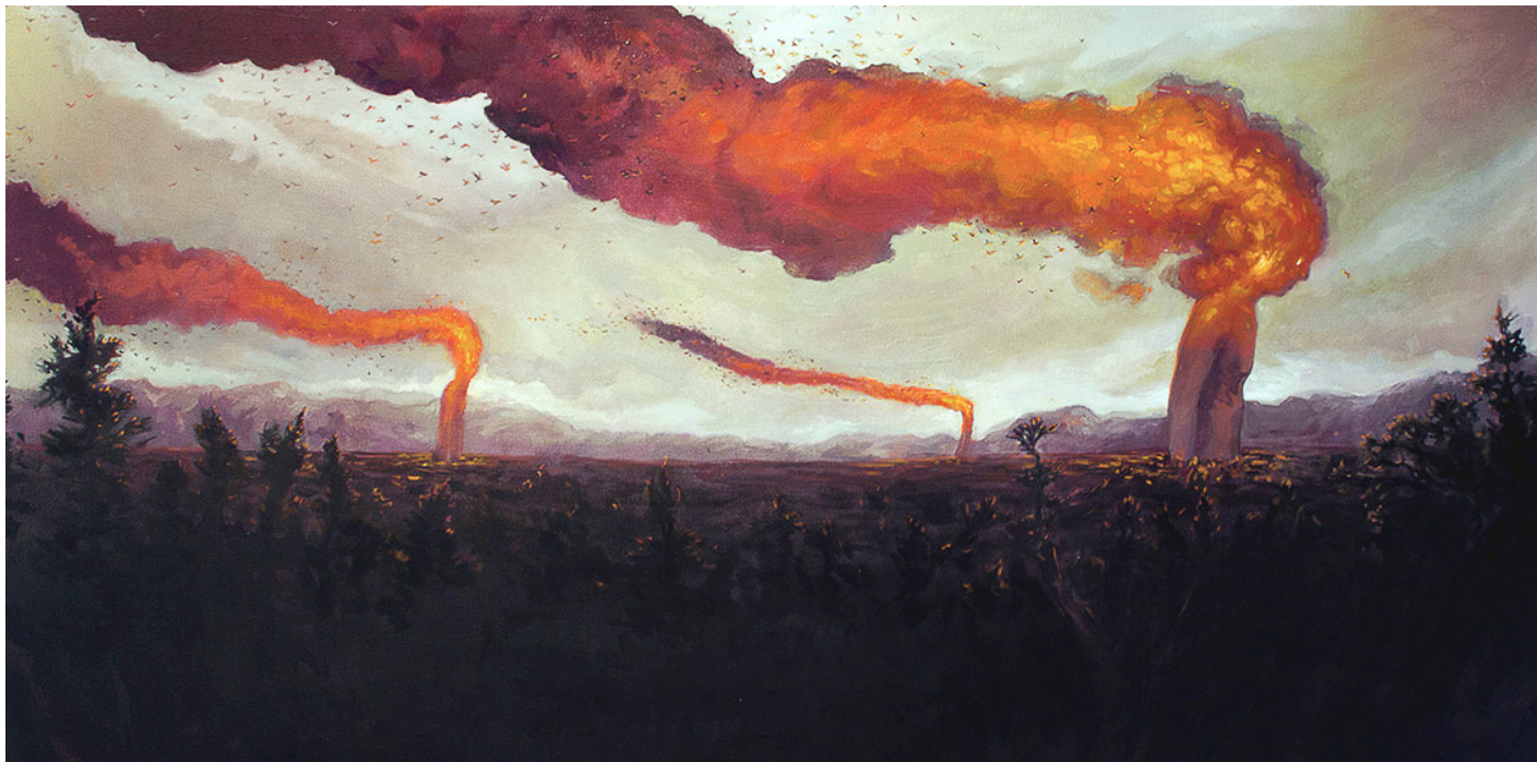
Illustrazione di T. Dylan Moore.

ispirazione, sia tematica che stilistica. Questa influenza si può trovare chiaramente anche nella sua illustrazione. Qui il LAVORO è declinato nel mondo animale, e l'attenzione si posa sull'insetto che nella cultura popolare rappresenta da sempre il LAVORO e la collaborazione: le formiche. Queste sono tratteggiate con pochi tratti di matita, per una tavola caratterizzata da una semplicità disarmante ma di sicuro impatto.