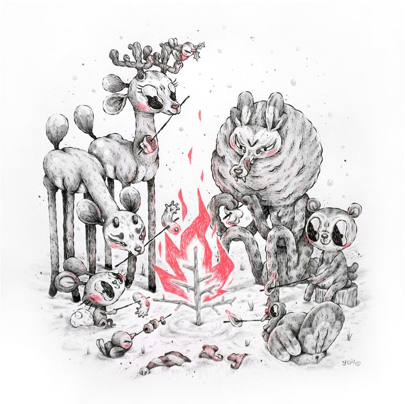
Illustrazione di Anna Johnstone.