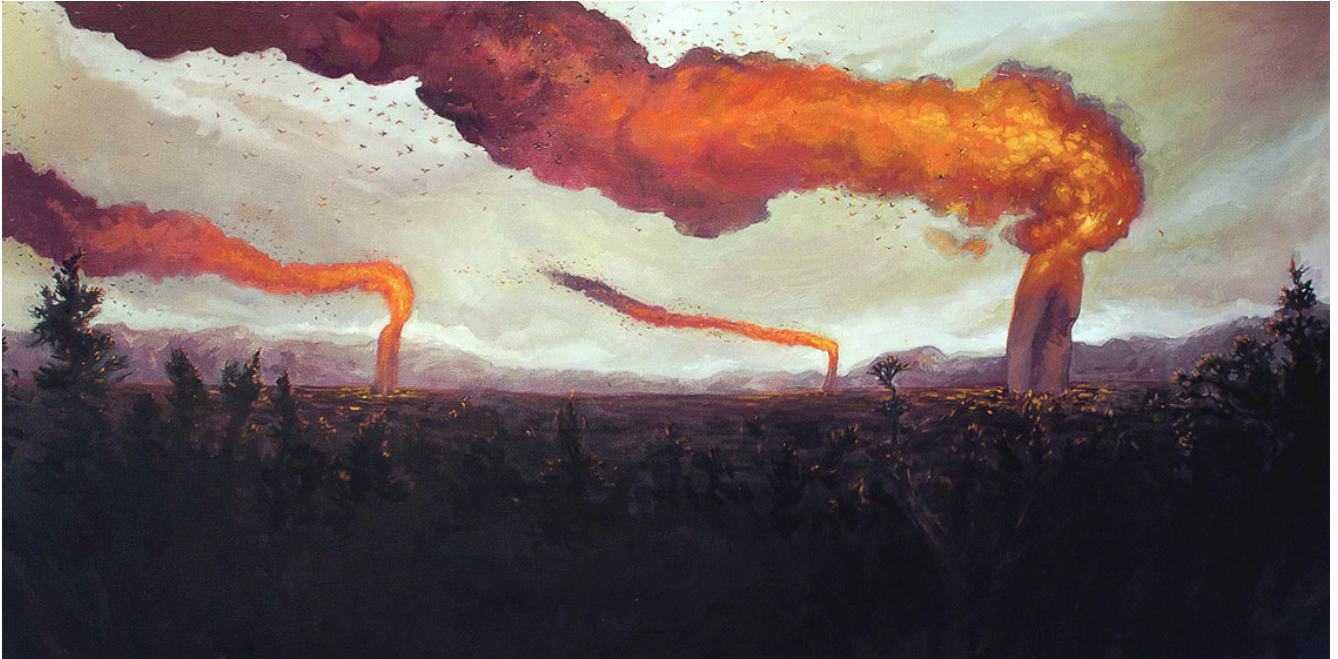
Illustrazione di T. Dylan Moore.

ispirazione, sia tematica che stilistica. Questa influenza si può trovare chiaramente anche nella sua illustrazione. Qui il LAVORO è declinato nel mondo animale, e l'attenzione si posa sull'insetto che nella cultura popolare rappresenta da sempre il LAVORO e la collaborazione: le formiche. Queste sono tratteggiate con pochi tratti di matita, per una tavola caratterizzata da una semplicità disarmante ma di sicuro impatto.