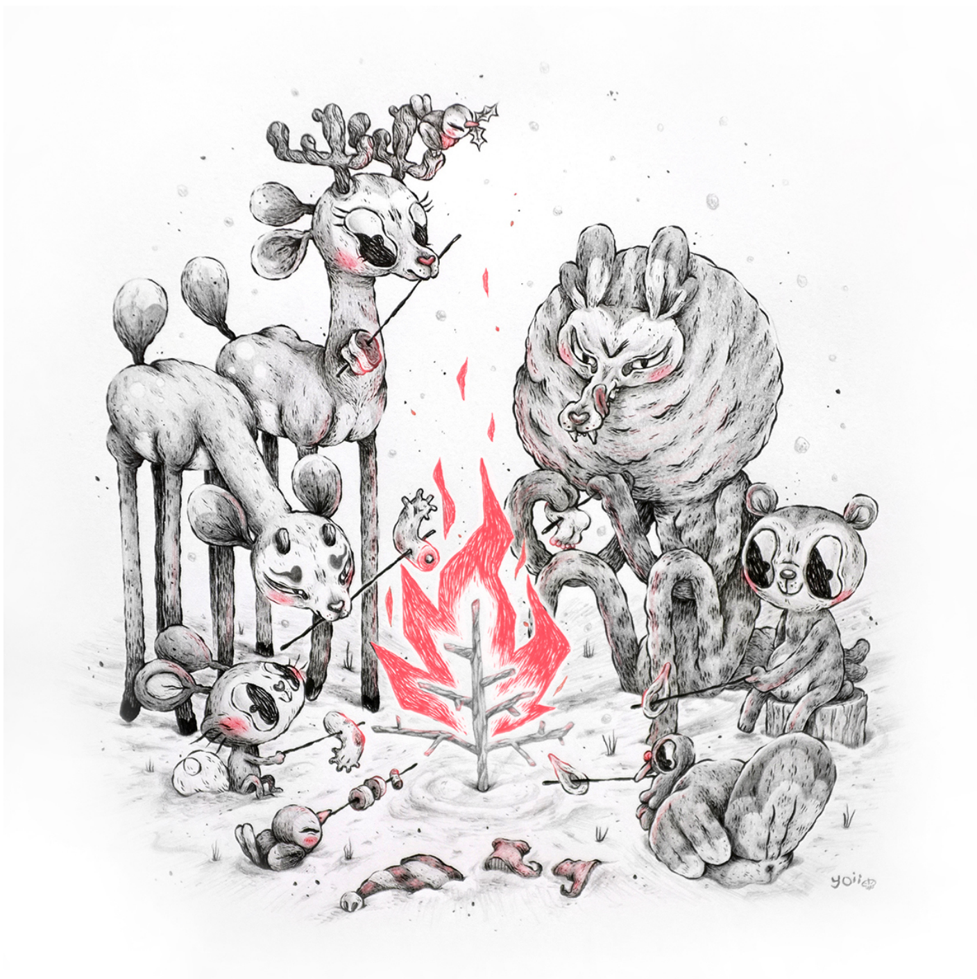
Illustrazione di Anna Johnstone.