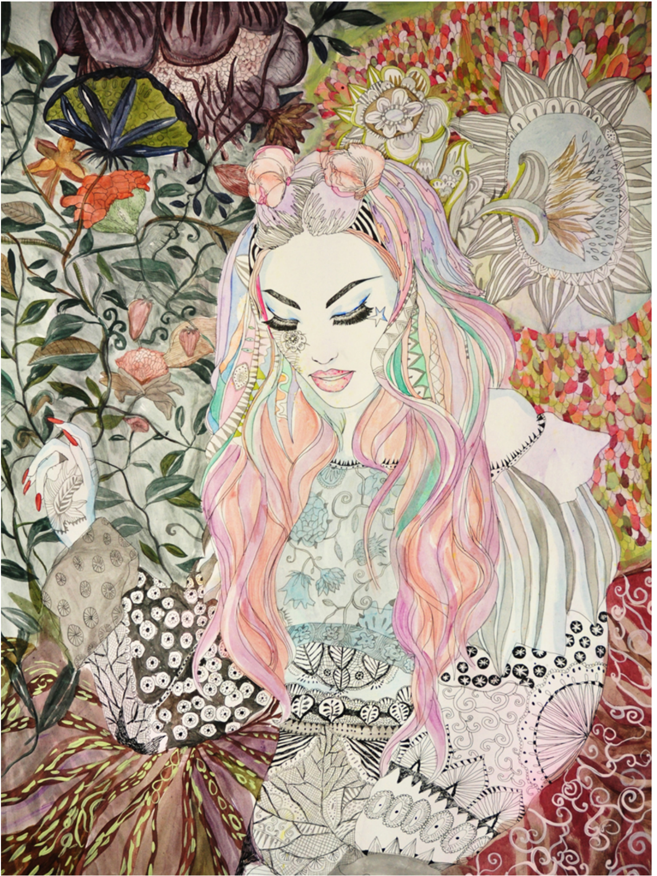
Illustrazione di Aisté Bileviciute.