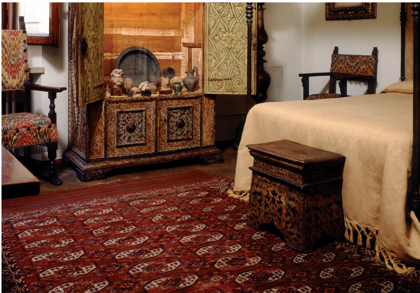
La camera del letto a baldacchino del museo casa Rodolfo Siviero.

L'Accademia dei Lincei, però, le ha tributato un premio nel '61. Enrico Molè, allora senatore e presidente del comitato degli artisti e degli scrittori italiani, le ha scritto: "della gioia, della soddisfazione, della riconoscenza della nostra gente ti do atto e ti ringrazio".