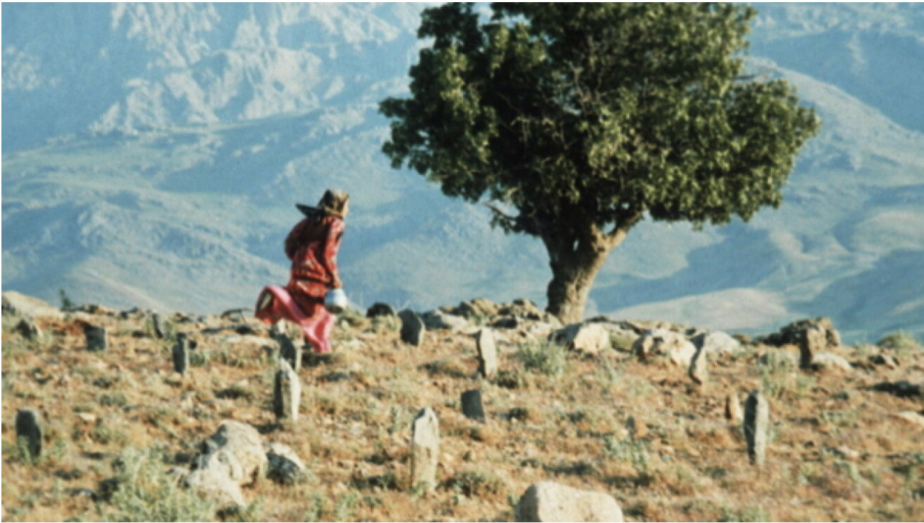
Il vento ci porterà via

L'albero e la notte diventano i simboli del legame fra l'uomo, la terra e la morte, e tornano naturalmente lungo tutto il cinema di Kiarostami. In Il sapore della ciliegia e Il vento ci porterà via entrambi i protagonisti salgono e scendono da macchine, colline e strade; cercano persone, inseguono il segnale di un telefono cellulare, discutono e restano in silenzio. Il loro percorso porta all'oscurità di una tomba o di una grotta, illuminati dal chiaro di luna o da una lampada, o ancora messi di fronte alla verginità della natura o all'evidenza di un osso umano, sintesi tremenda di ciò che siamo e ciò che torneremo.