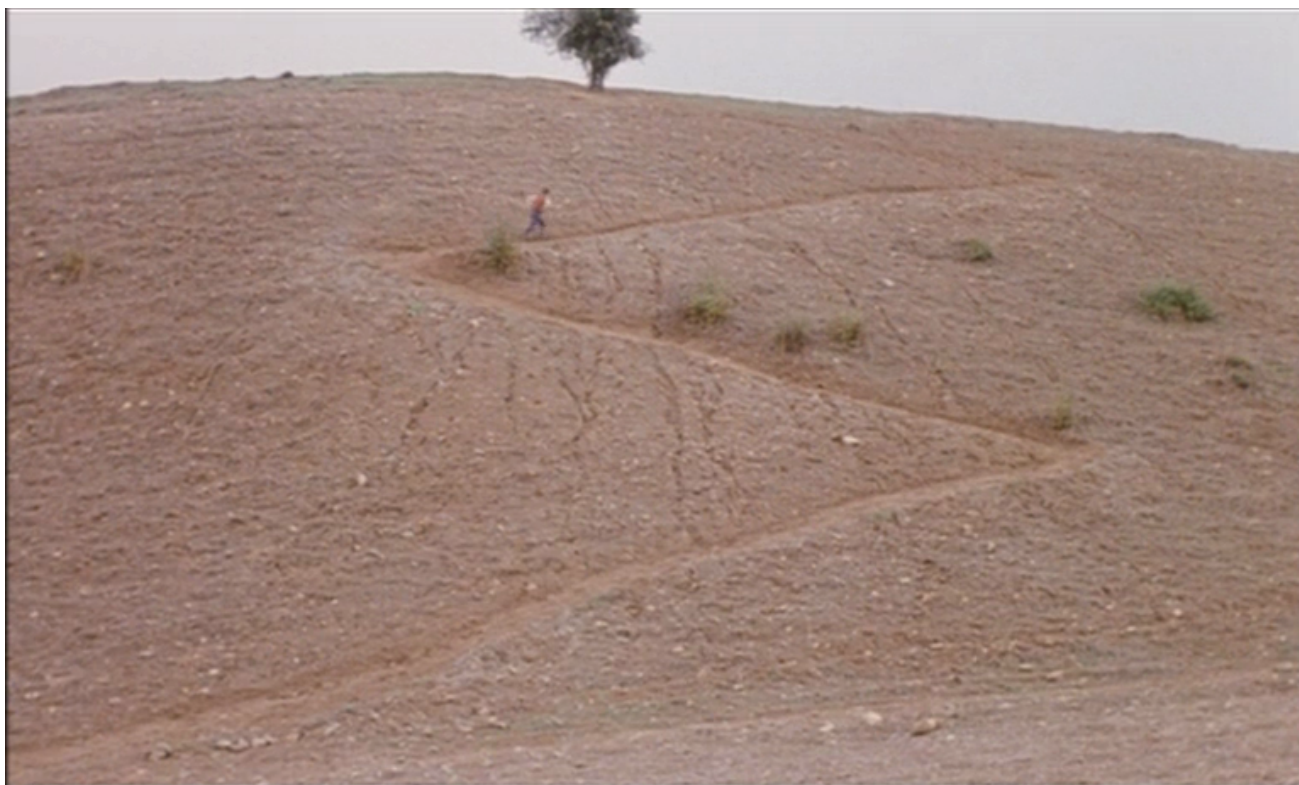
Dov'è la casa del mio amico?

L'immagine piú significativa del cinema di Abbas Kiarostami, morto il 4 luglio a 76 anni, è quella che il regista iraniano presenta per la prima volta in Dov'è la casa del mio amico? (1987), per poi riprenderla e rielaborarla nei film che da esso nasceranno, E la vita continua? (1992) e Sotto gli ulivi (1994). Questa immagine: