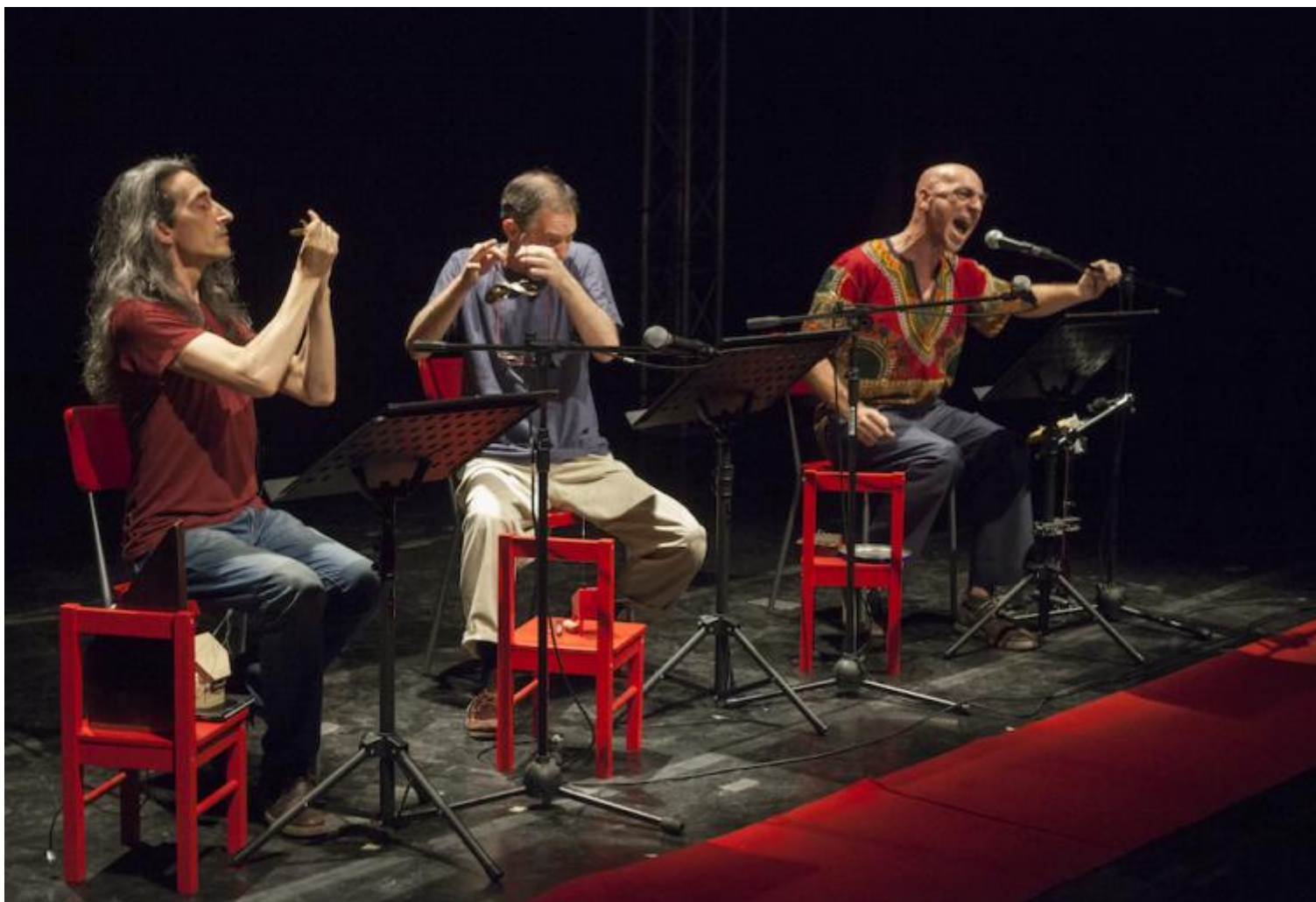
Freier Klang