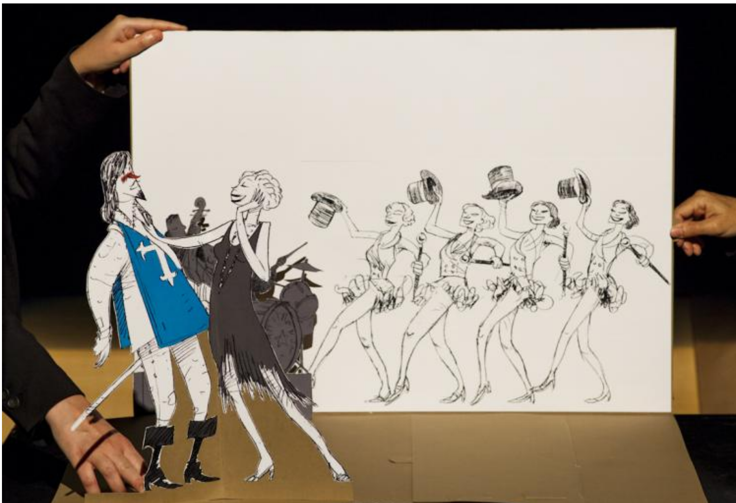
Sacchi di sabbia

Ci sono anche altri bambini a Castiglioncello, li si incontra con unâ??occhiata distratta appena si imbecca il viale alberato che porta al Castello: sbiadiscono in una riproduzione tirata in seppia di un quadro del macchiaiolo Giuseppe Abbati, e cosa facciano Ã¨ difficile dirlo, seduti su un manto erboso, forse giocano, ma non Ã¨ escluso che si stiano organizzando per una crociata. Di certo câ??Ã¨ che alle loro spalle una strana porta aperta su un muro si affaccia sul mare e sul cielo. Da quasi ventâ??anni questi bambini, che nel quadro originale sono macchie di colore abbacinate, creature solari, â??fanno teatroâ?*, cioÃ¨ qualcosa che Ã¨ insieme molto evidente e molto nascosto. Lo scrivo qui per gli assessori che sul genius loci di Castiglioncello e del suo Castello, visibilmente concepito come una scenografia, rischiano di ingannarsi (cosÃ¬ tanto che uno di loro, intervenendo a uno dei dibattiti in programma al festival parla di â??territorio dei pittoriâ?• e cita â??i vari Martelli, Legaâ?•, dimenticando nella foga che Diego Martelli non fu mai un pittore ma un critico e un mecenate amico di pittori, un organizzatore di residenze artistiche ante litteram).