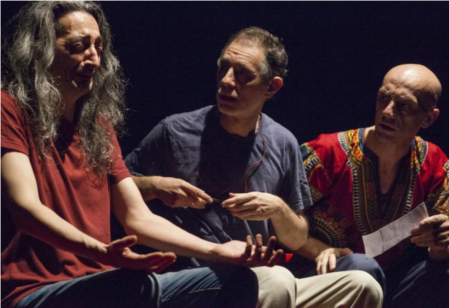
Freier Klang, ph Lucia Baldini.

vacilla, siamo a teatro, nel regno della competenza usurpata e dell'??incompetenza elevata ad arte. Ma sta proprio qui il sottile prestigio del concerto morgantiano che all'??inizio della sua esecuzione declina anche la propria teoria antiesecutiva (??non dominiamo, non eseguiamo, non creiamo, noi liberiamo la musica.