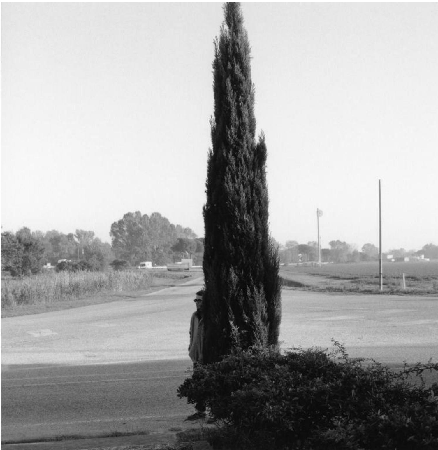
01 Romea - foto di Sabrina Ragucci, 2014

La stessa superiorità di cui, per una volta, disponevo anch'io. Fatte le debite proporzioni s'intende, non essendo chi scrive un Pasolini, né artisticamente né, soprattutto, economicamente; e, ciò che più conta, non avendo in sé la benché minima vocazione al martirio, meno che mai omosessuale – il martire etero, del resto, non esiste. Perciò, nessun tormento spirituale che mi dilaniasse l'anima: io volevo solo scopare e le mie marchette erano femmine. E siccome non avevo tanti soldi, e le puttane africane costavano meno, erano nere. Ma a parte l'aspetto economico, c'era anche forte tutta la mia innata passione per la negritude, sia in senso artistico (all'epoca, tra l'altro, ero il batterista di un gruppo hard-funk, composto per il resto da tre soldati afroamericani della Ederle), sia in senso fisico. Quanto all'età delle mie ragazze, chi poteva dire quanti anni