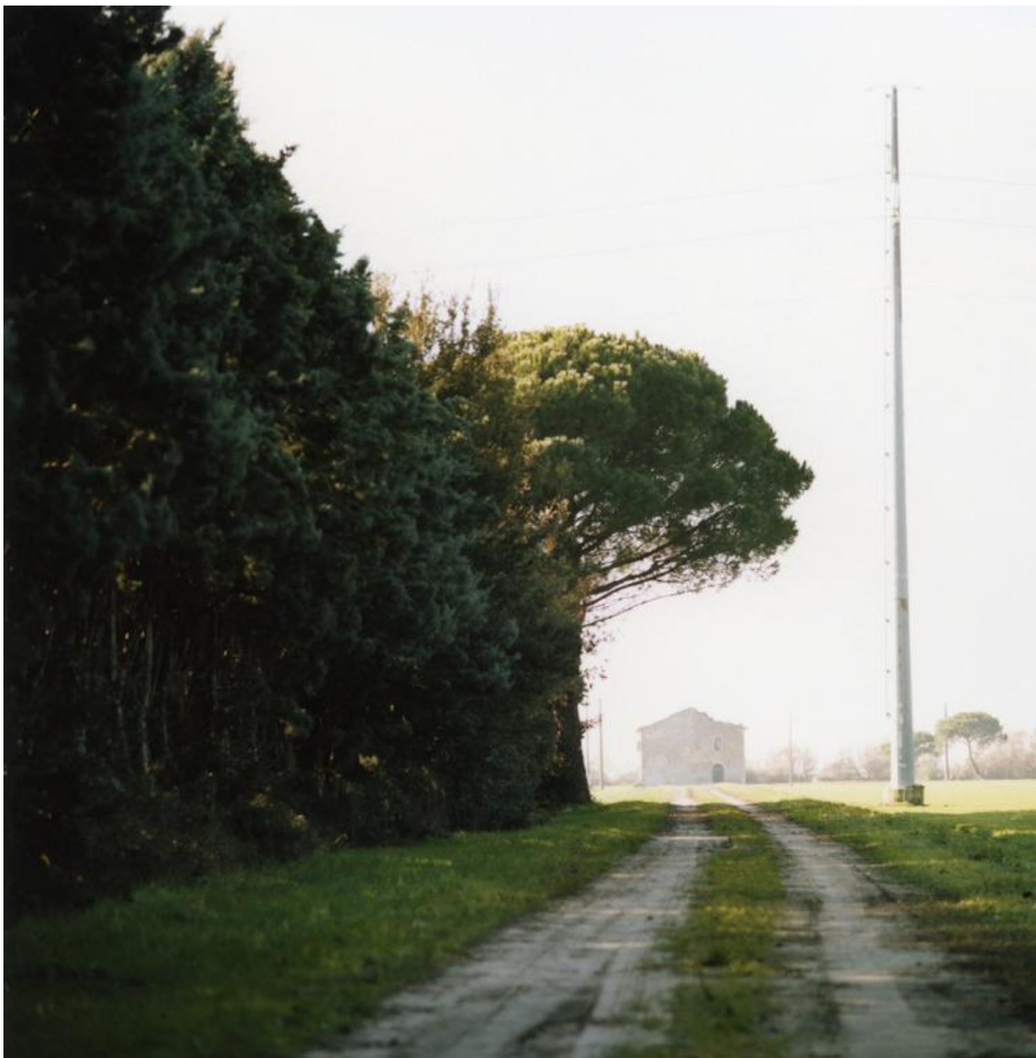
04 Romea

andrea cortellessa — Alla maniera di Bernhard, come sempre, anche questo tuo testo ha un sottotitolo falsamente “rematico”, direbbe un narratologo, tale cioè da esplicitare la natura del testo. Ma scrivere Un impatto ambientale , come Un crollo dopo Il ponte (o Una segregazione dopo Il freddo ), non equivale a scrivere “Romanzo”, sotto il titolo d’un testo. Con quale intenzione mutui questa dizione, diciamo, ecologico-burocratica?