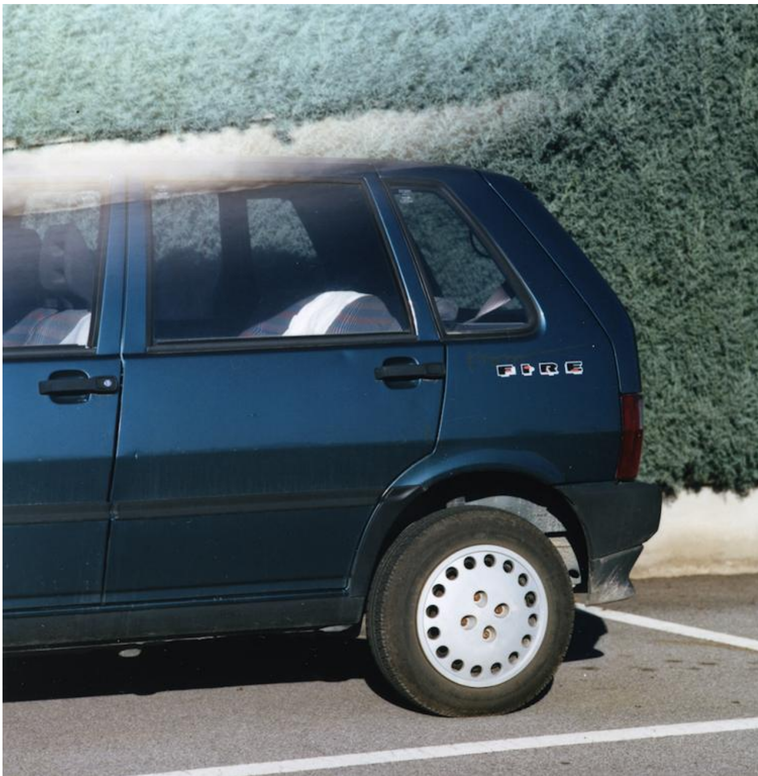
03 Romea - foto di Sabrina Ragucci, 2014

Altre volte si parlava e basta, o meglio, per la maggior parte del tempo, loro parlavano e io ascoltavo. Sono sempre stato bravo ad ascoltare, a patto che ci sia effettivamente qualcosa da ascoltare, s'intende. Era uno dei motivi per cui con le ragazze indigene avevo lasciato perdere. Troppe inutili chiacchiere prima di arrivare al cosiddetto dunque, e, se possibile, ancora di più, e altrettanto inutili, dopo. L'Africa invece, la Nigeria in particolare, era un argomento che mi interessava sempre, prima, dopo e addirittura senza il dunque. A forza di sentirla raccontare, e di vederla incarnata, a un certo punto mi resi conto che, in qualche modo, mi era entrata dentro, come si dice – intendo la Nigeria; e sì, un po' anche lei –, tanto che ormai parlavo un discreto pidgin-english, e avevo imparato qualche espressione in edu e in igbo; e spesso mangiavo fried plantation, pounded yam, rice and fish eccetera – qualcuna delle mie ragazze ogni tanto cucinava. A un certo punto, a