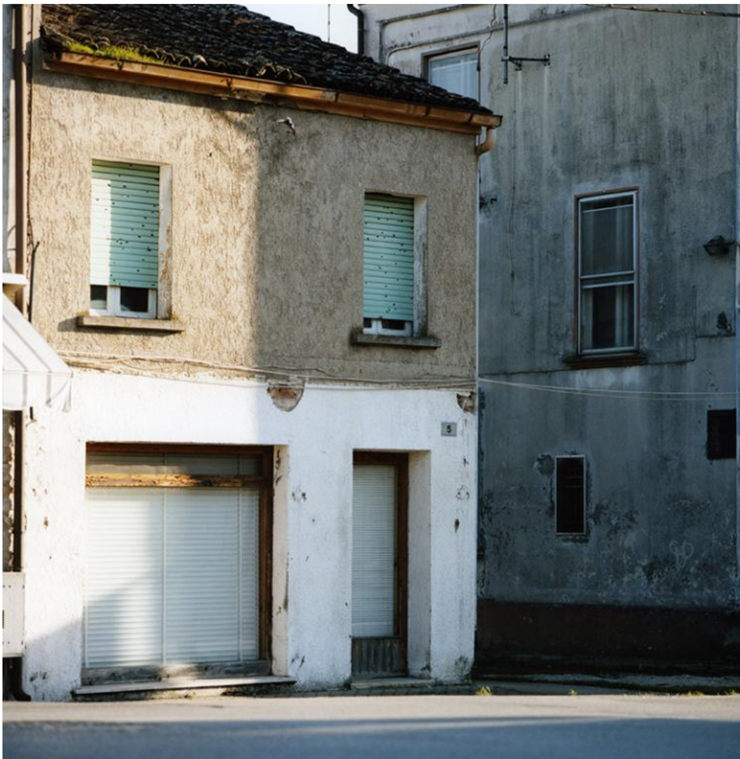
02 Romea

Qui i turisti non ci vengono, solo uomini d'affari, che si rinchiudono al più presto nei loro Sheraton e nei loro Hilton, e da lì più non si muovono, se non per tornare a prendere l'aereo; molto rare le cosiddette Ong e i relativi volontari professionisti; quasi del tutto assenti i giornalisti e i comunicatori vari; insomma, affari a parte, sembra proprio che della Nigeria non freggi un cazzo a nessuno. Qui, penso, non potrai mai nemmeno fare una passeggiata senza essere notato. In quanto bianco in mezzo ai neri – con tutto ciò che questo significa, ovvero per quanto muove, nel profondo, di oscuro e di irrazionale. Tutti gli altri pallidi, intendo quelli sbarcati con me – circa una dozzina, tutti appunto uomini d'affari, tutti con un cartello con su scritto Mr eccetera ad aspettarli, erano spariti insieme ai loro accompagnatori. Per me nessun cartello, solo un