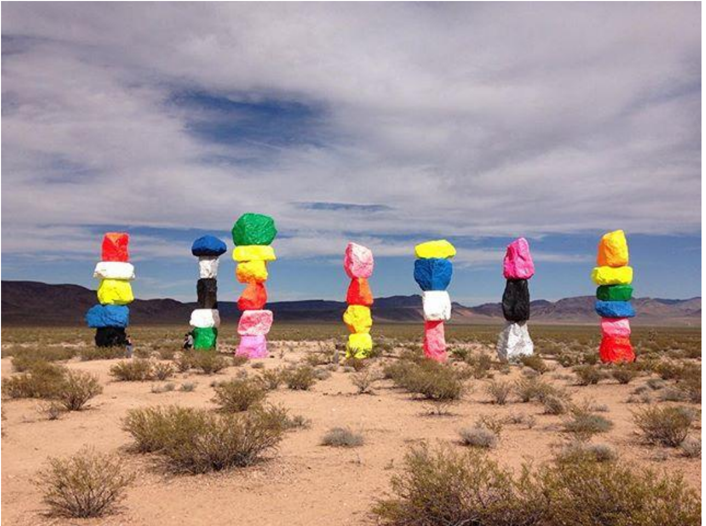
Ugo Rondinone, Seven Magic Mountains, 2016, large-scale site-specific public art installation located near Jean Dry Lake

della regressione dallo stato umano a quello minerale. Isidoro di Siviglia sosteneva nelle sue celebri quanto immaginifiche etimologie che lapis viene da laedet pedem , ledere il piede , perché la pietra è un impedimento: fa inciampare e cadere, compromettendo l'avanzamento regolare dei passi.