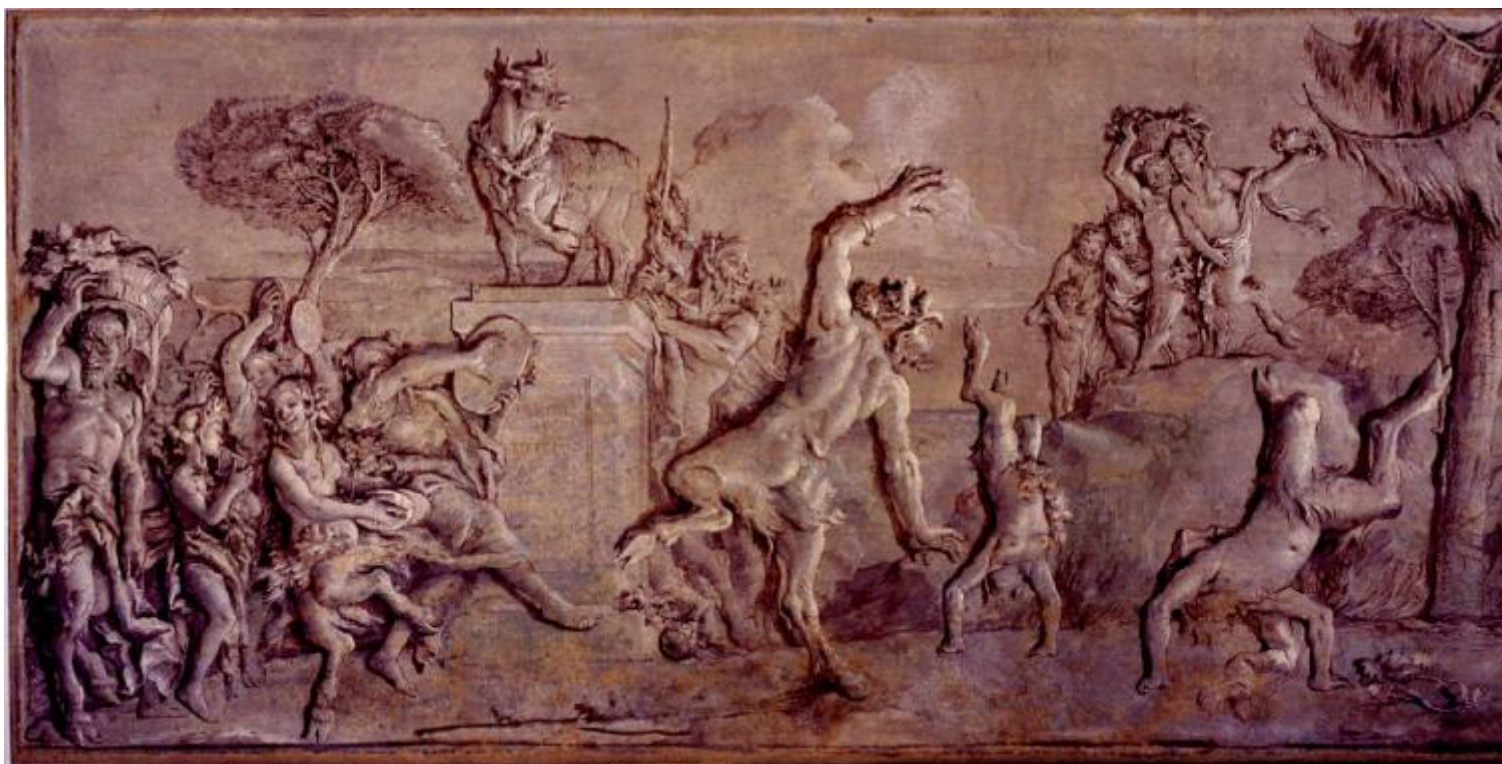
Giandomenico Tiepolo, Baccanale con satiri e satiresse, 1771, affresco. Ca' Rezzonico, Venezia

Agamben scrive che questa simmetria non è casuale, ma è anzi una costellazione visuale dove tali personaggi semi-umani sono i nuovi attori che entrano in scena alla fine di un mondo storico, dotati di una saggezza, una gaia scienza che disinnesci lo “spirito di gravità” in favore di una potenza irragionevole. La parabasi, cioè il momento in cui la commedia si interrompeva e il coro, togliendosi la maschera, si rivolgeva direttamente agli spettatori, sembra essere la condizione di Pulcinella, che “non recita un dramma, lo ha già sempre interrotto, ne è sempre già uscito, per una scorciatoia o una via traversa [...] nella vita degli uomini – questo è il suo insegnamento – la sola cosa importante è trovare una via d’uscita [...] Ubi fracassum, ibi fuggitorium – dove c’è una catastrofe, là c’è una via di fuga”.