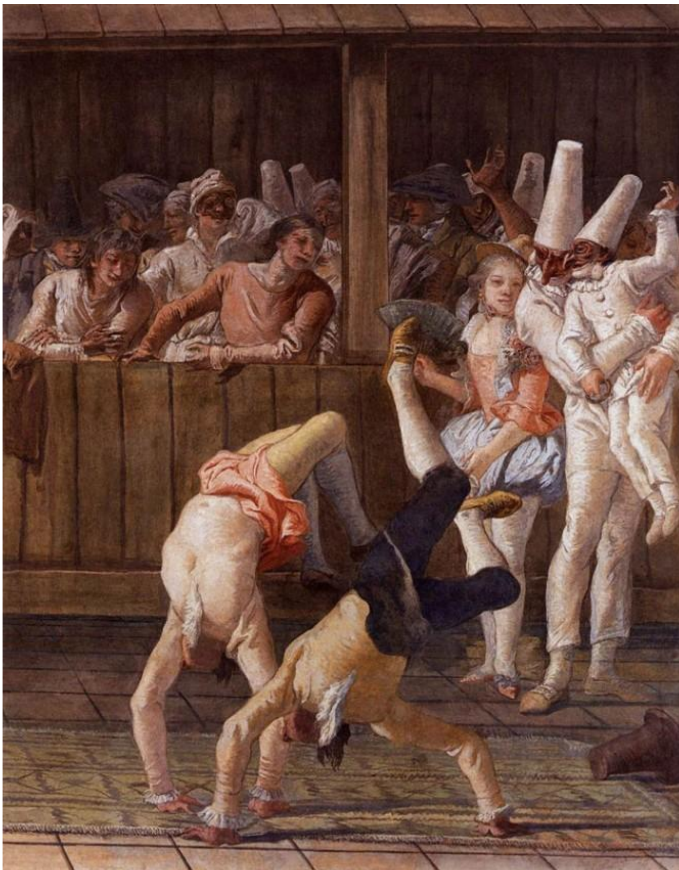
Giandomenico Tiepolo, Pulcinella e i saltimbanchi, 1797, affresco. Ca' Rezzonico, Venezia

Negli affreschi della villa di Ziniago, Giandomenico Tiepolo aveva, anni prima, dipinto scene satiresche e vi sono molte corrispondenze di gesti, pose, situazioni fra i dipinti con protagonisti dei satiri e quelli con i pulcinella.