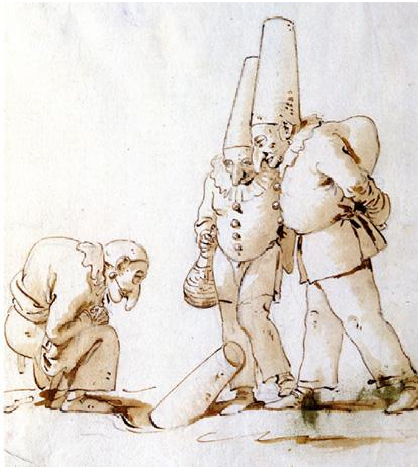
Giambattista Tiepolo, Due Pulcinella e i postumi della Festa degli Gnocchi, 1725-'50, penna, inchiostro, acquerello, Fondazione Giorgio Cini – Gabinetto Disegni e Stampe, Venezia

È in fondo questo che ci consegnano le molteplici immagini di Pulcinella: un io sfuggente e plurale, un'esistenza larvale che accompagna quella degli uomini "veri" e che avrebbe il potere di inceppare la "macchina antropologica dell'occidente" grazie a un corpo ilare e deforme, sospeso fra l'umano e l'animale; un carattere che presenta un tratto di non-vissuto che è come "un clandestino senza volto che mi accompagna giorno dopo giorno senza che io riesca mai a rivolgergli la parola".