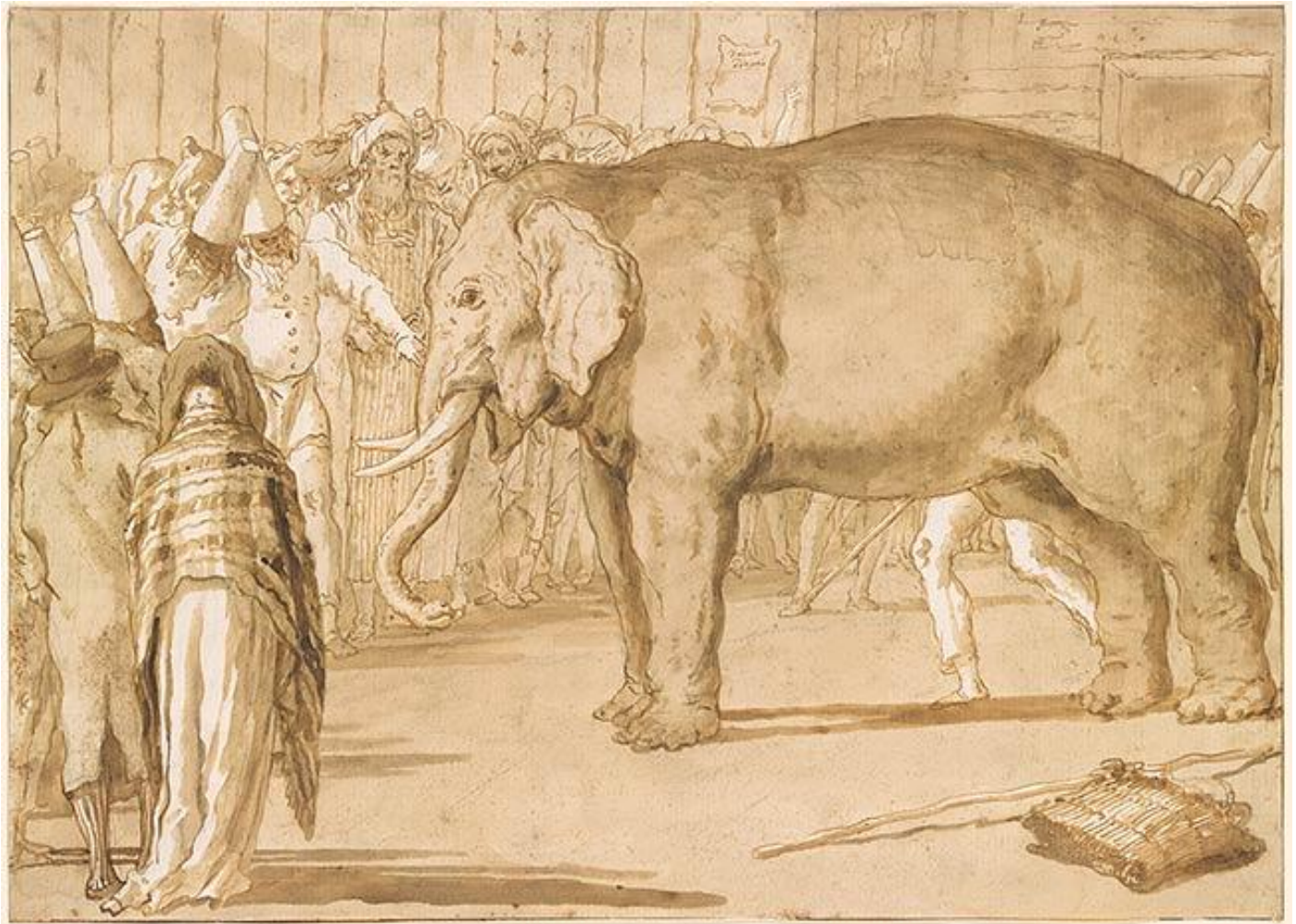
Giandomenico Tiepolo, Pulcinella con un elefante, 1797-1804, penna e inchiostro marrone su carta, The Morgan Library & Museum, New York.

Ma di quale catastrofe si tratta? Qui la riflessione entra in un campo storico e politico. L'impresa artistica delle "pulcinellerie" avviene quando Giandomenico Tiepolo ha settant'anni e si è ritirato nella villa ereditata dal padre Giambattista, dopo che, nel 1797, la Repubblica di Venezia era crollata nelle mani napoleoniche, perdendo una millenaria autonomia. Era la fine di un mondo e "nell'economia di questa fine dei tempi, tutte le cose si ricapitolano in Pulcinella". Questo personaggio filosofico con il quale il pittore si accompagna era già stato il muto testimone, in un grande affresco del 1791, del tramonto di un'epoca e dell'annuncio di una nuova era, il Mondo novo .