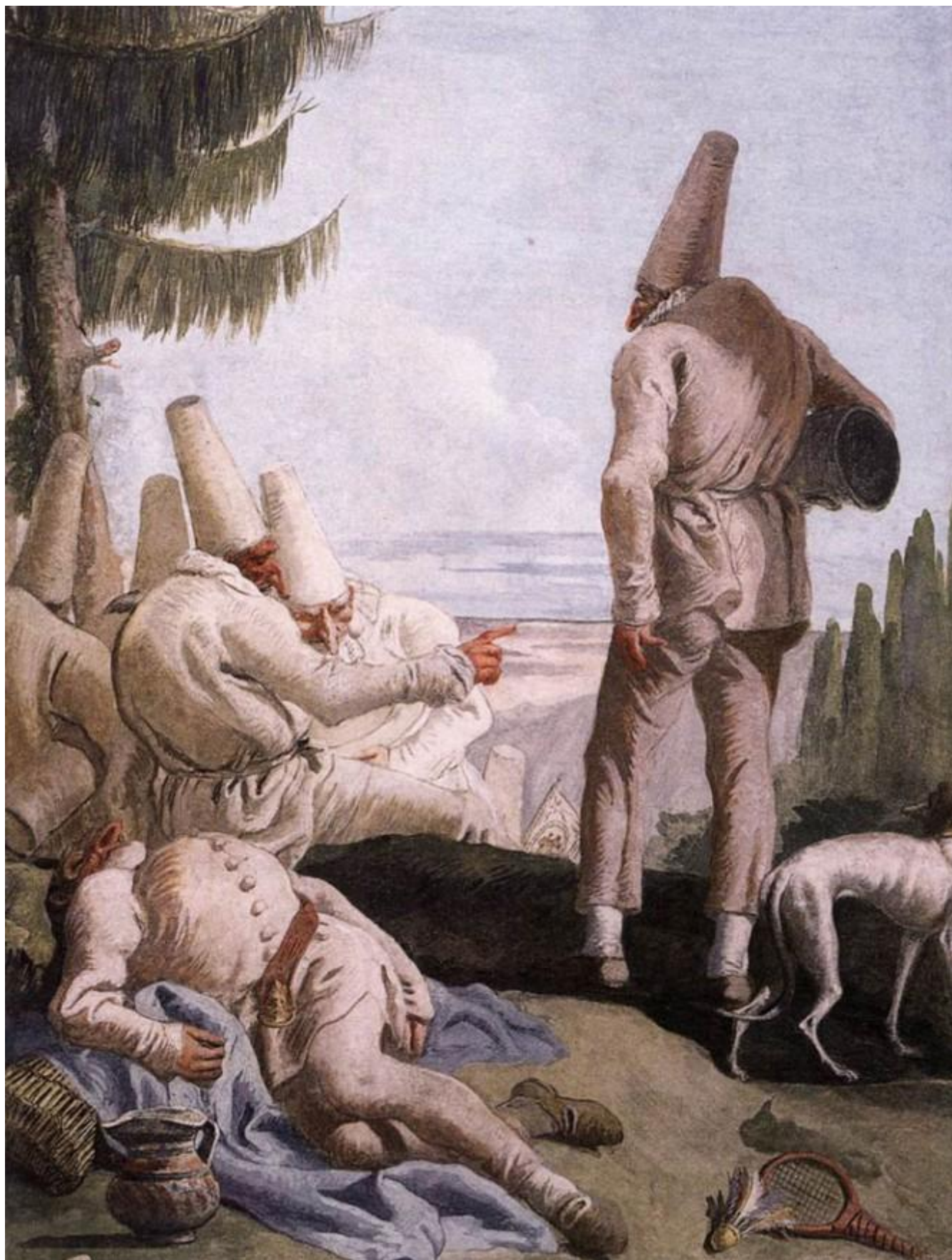
Giandomenico Tiepolo, La partenza di Pulcinella, 1797, affresco. Ca' Rezzonico, Venezia

Agamben intreccia più regimi discorsivi (filosofico, storico, politico, iconografico, autobiografico) entrando e uscendo dai personaggi che il filo del suo pensiero incontra.