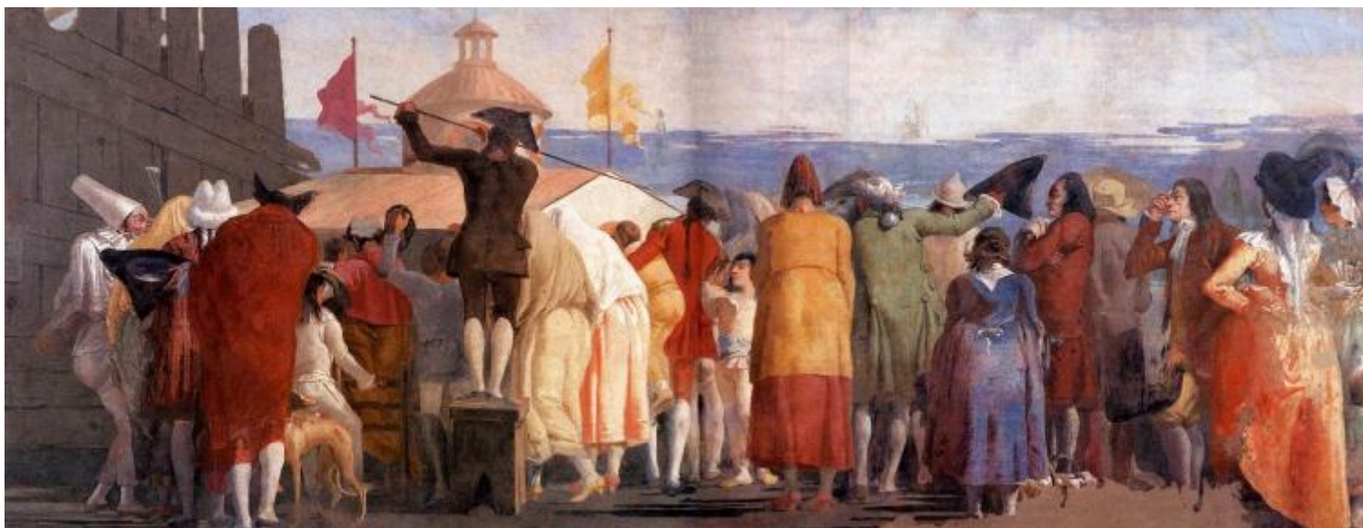
Giandomenico Tiepolo, Il Mondo novo, 1791, affresco. Ca' Rezzonico, Venezia

Una folla di spalle osserva curiosa dentro una finestrella di un casotto dove si mostrano le attrazioni che verranno, i nuovi spettacoli tecnologici della modernità; tutti attendono di guardare dentro un cosmorama, uno dei dispositivi ottici pre-cinema, che permetteva di vedere con grande realismo panorami di luoghi lontani. In un lato ci sono due persone di profilo, il pittore e suo padre Giambattista, al centro, unico che guarda verso l'osservatore, un bambino (il protagonista del mondo che viene), al lato opposto vediamo invece un Pulcinella con il cappello a tubo, un personaggio che “annuncia il regno – o il sogno – intemporale che coincide con la fine di quello storico”. Agamben non si sofferma però su un particolare significativo: è questa l'unica immagine in cui Pulcinella appare senza maschera, ma con il solo volto grifagno, in cui sorriso e pianto sembrano coincidere; nei disegni e negli affreschi successivi di questo infinito divertimento avrà sempre invece la sua classica maschera nera, senza poterla più togliere. Ma nello straordinario gioco di sguardi dell'affresco, vediamo il suo volto così uguale alla maschera, il suo sguardo da un altro mondo che attraversa con disincanto gli sguardi negati della folla di spalle, gli sguardi seri, attenti, curiosi della donna di profilo che chiude il gruppo e dei due pittori che osservano con distacco lo spettacolo.