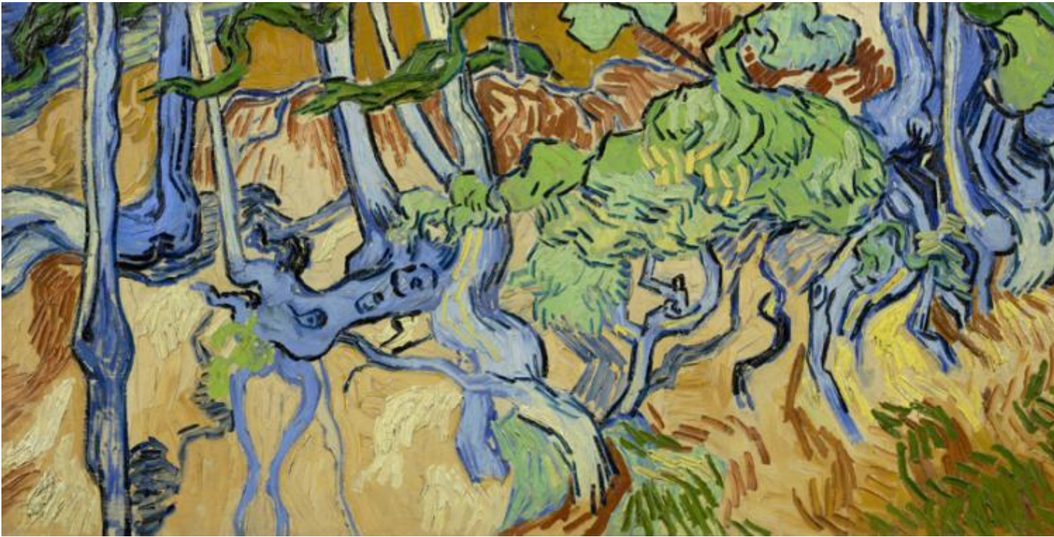
Vincent van Gogh, Radici , 1890, Van Gogh Museum, Amsterdam

Nel rileggere le righe di un uomo che si suiciderà quattro giorni dopo, nelle due versioni (inseparabili) della stessa lettera, della stessa penna, si percepisce l'altalena lacerante tra la melanconia attiva, quella del lavoro, e melanconia della disperazione, già descritta dieci anni prima, ai tempi del Borinage. Sono più di duecento le svariate diagnosi formulate nel tempo, ma la lucida autoanalisi del pittore riemerge qui, negli ultimi due scritti.