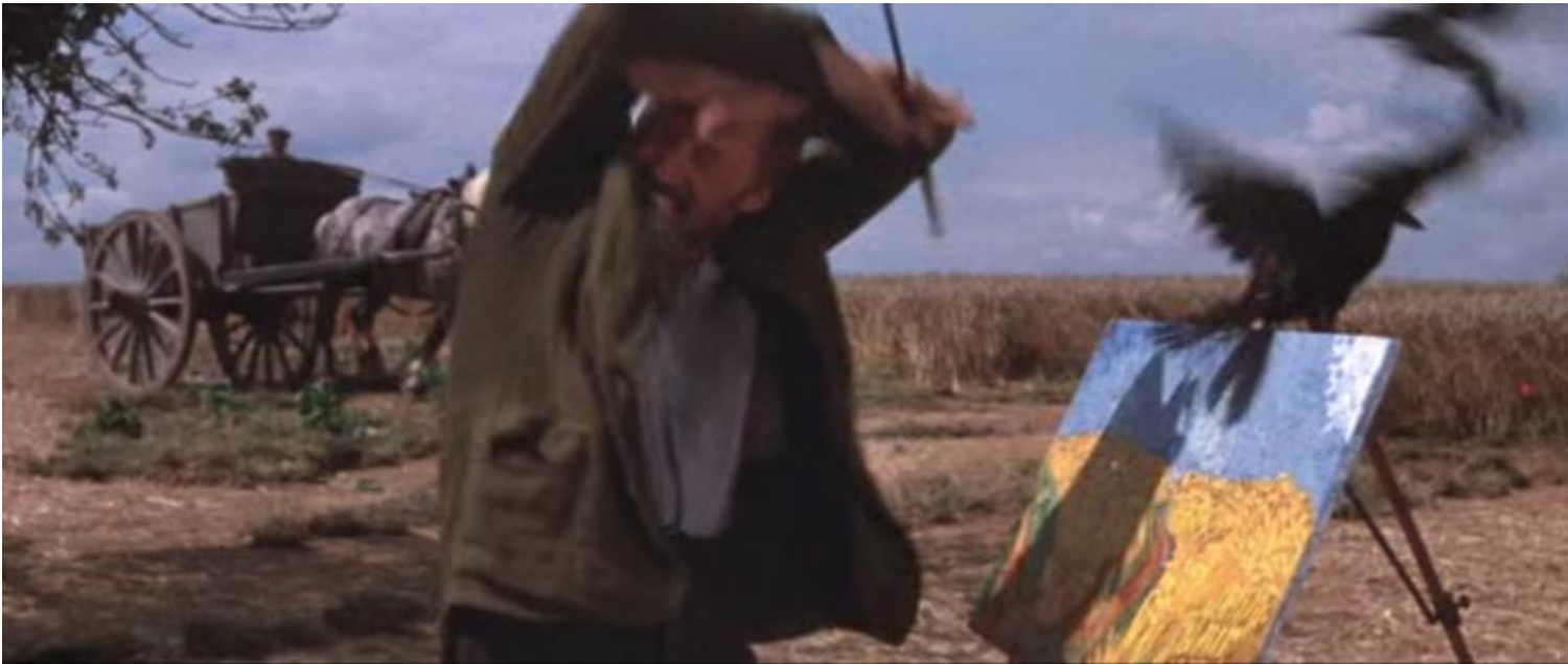
Still da Lust for life, Vincente Minelli, 1956, scena nel campo di grano con i corvi

Non per niente il labirinto Ã stato il grande omaggio a Van Gogh dello scorso settembre, in occasione del 125° dalla morte dell'artista e del nuovo ingresso del museo. Ben 125.000 girasoli altissimi, disposti in forma di labirinto-giardino, occuparono per quattro giorni parte del Museumplein, per essere donati ai passanti alla fine dell'evento. Girasoli per tutta la cittÃ , portati in bicicletta, in tram o a piedi, un'idea geniale per smontare tutto e disperdere festosamente il fiore preferito di Vincent che fu anche compagno del suo ultimo viaggio. Dalla locanda Ravoux di Auvers-sur-Oise al cimitero, sulla sua bara che non aveva potuto entrare in chiesa perchÃ© il prete si era opposto, c'era un mazzo di girasoli, Tournesols . Era il 30 luglio 1890, si era sparato una pallottola in petto tre giorni prima, la domenica 27, rimanendo in agonia per quasi due giorni.