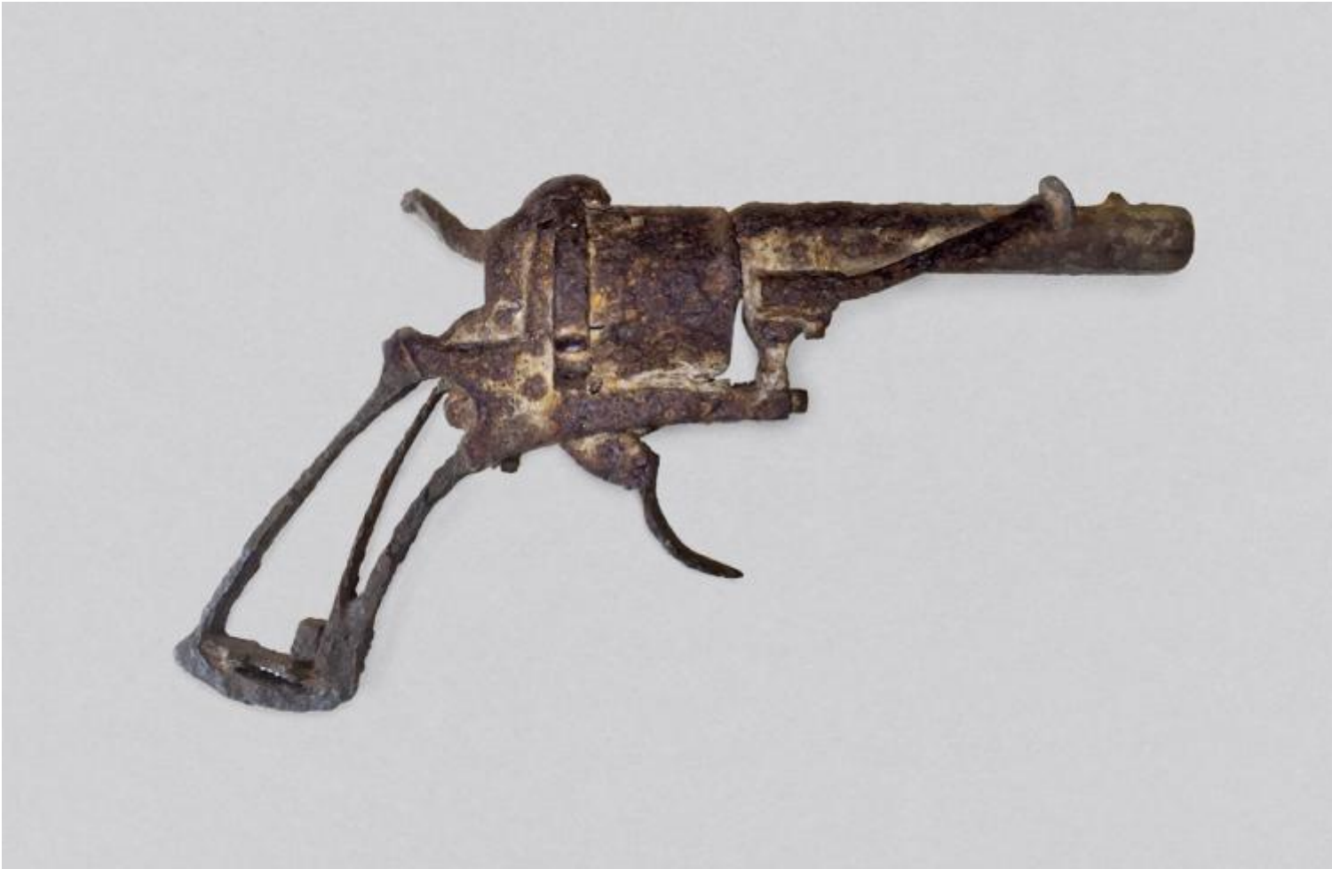
Lefauchaux revolver, 1865-93, collezione privata

francese. Lo sparo era stato «troppo esterno» ( trop en dehors ), dunque non aveva potuto raggiungere il cuore di Vincent (che morì due giorni dopo). E non «troppo da lontano»? In somma un granchio colossale. La questione è chiusa: niente altro che rumors .