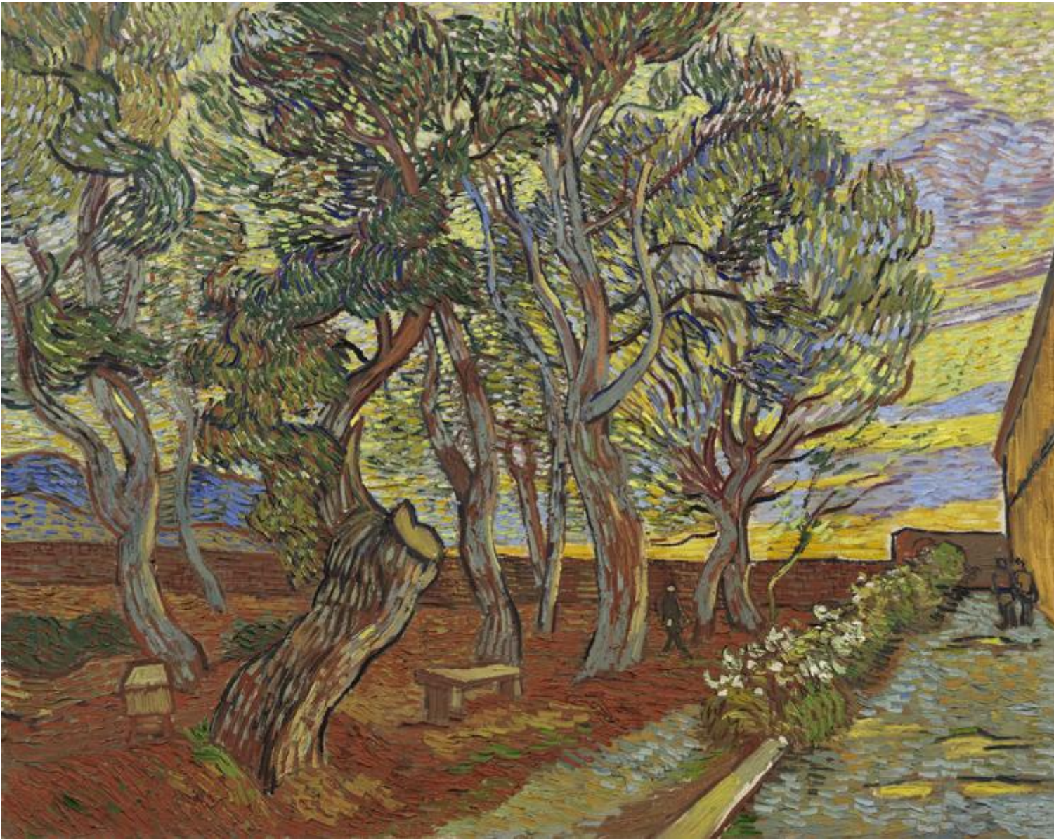
Vincent van Gogh, Il giardino dell'ospedale, 1889, Van Gogh Museum, Amsterdam

I malati dapprima lo spaventano un po', anche se Ã¨ arrivato a considerare âla follia una malattia come un'altraâ. La pittura Ã¨ la sua miglior medicina, il âcontrovelenoâ il âparafulmineâ contro il suo male. Varie crisi a Saint RÃ©my, dove si sente in prigione, tanto che dipinge una copia a colori dell'opera di Gustave DorÃ©, lâora d'aria dei condannati di Newgate: uno di loro ha i capelli rossicci.