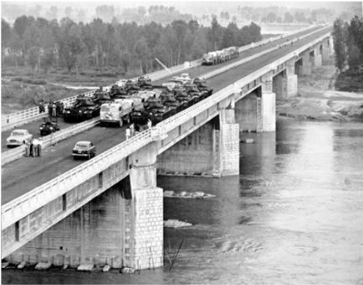
Ponte sul Po presso Piacenza. Collaudo 4-5 giugno 1959.

ciascuna, per il cui collaudo, vero evento mediatico del tempo, furono mobilitati i carri armati dell'esercito.