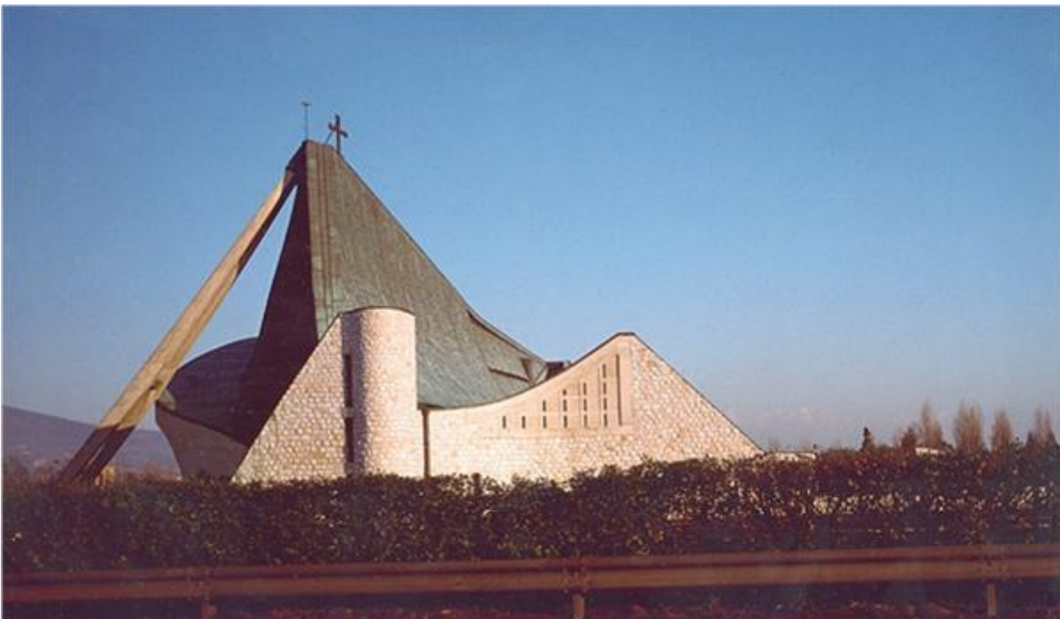
Chiesa di S. Giovanni Battista di Campi Bisenzio.