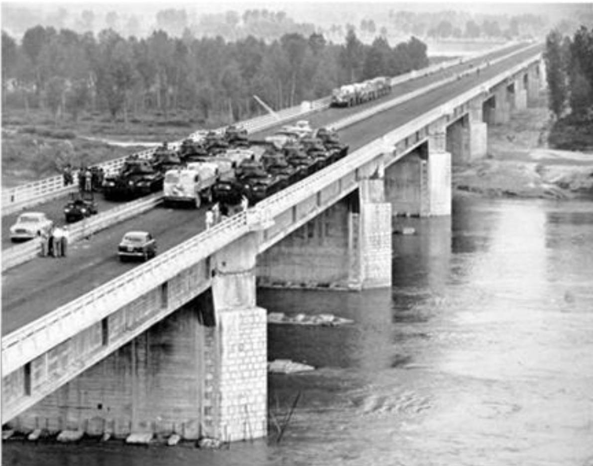
Ponte sul Po presso Piacenza. Collaudo 4-5 giugno 1959.