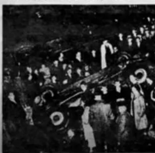
TEN PERSONS WERE INJURED ON KIMMICK ST., BRIGHTON