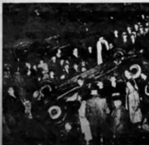
TEN PERSONS WERE INJURED IN KIDNAP ST. CRASH