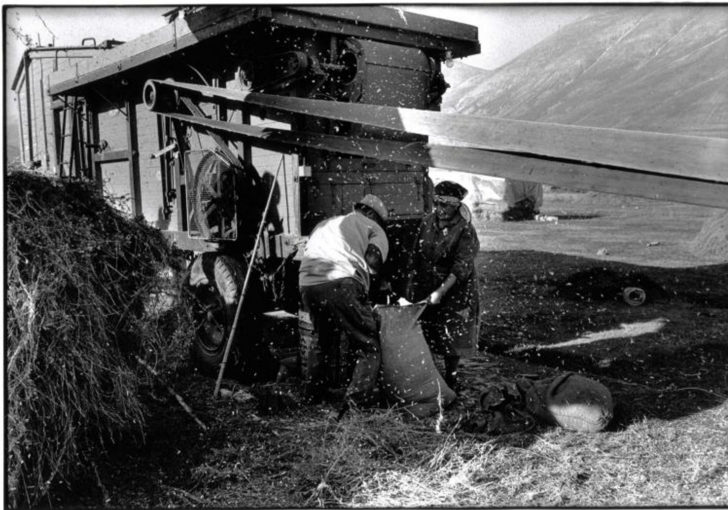
Raccolta delle lenticchie di Castelluccio 1988.