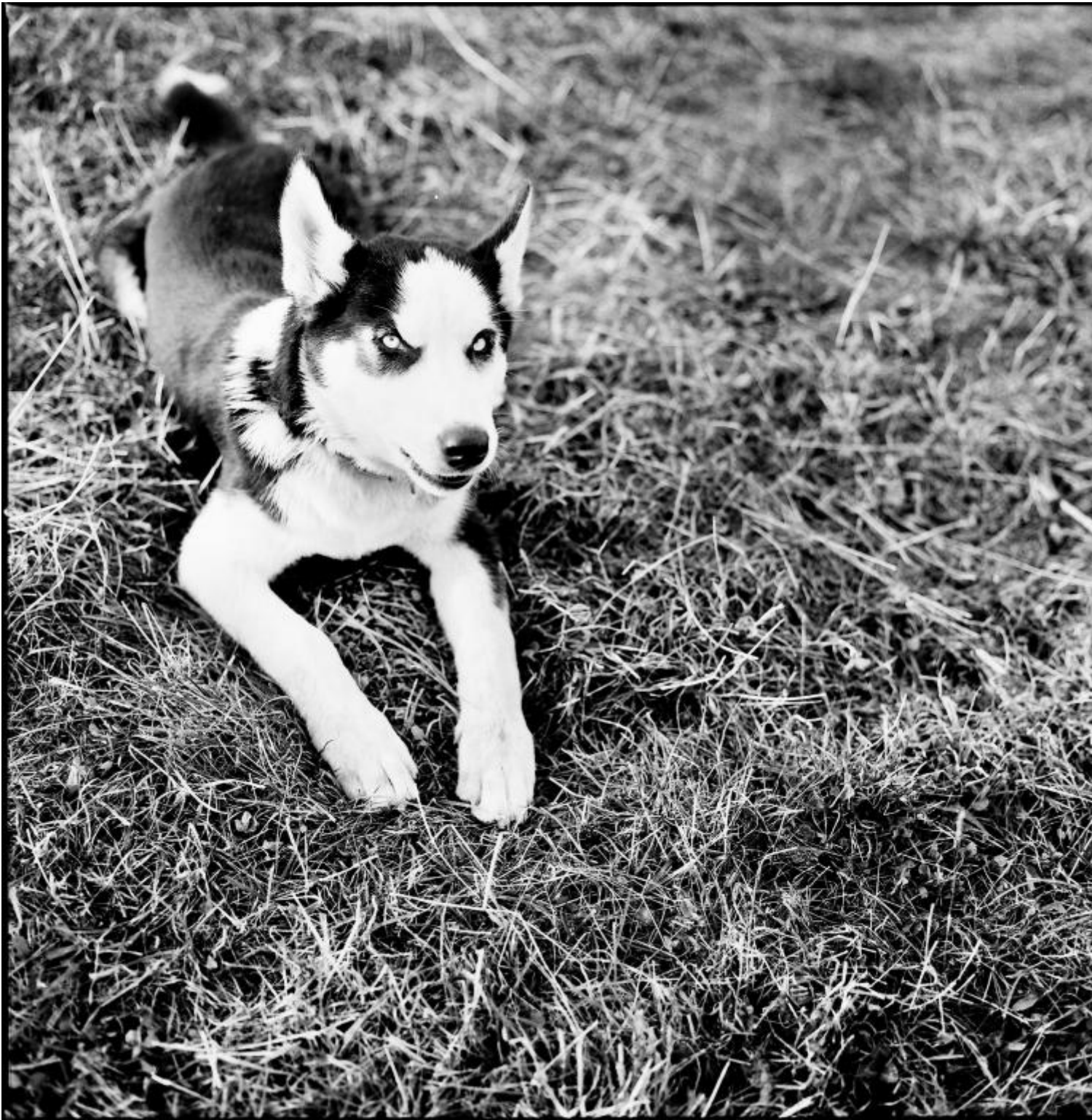
Forca di presta 1993.