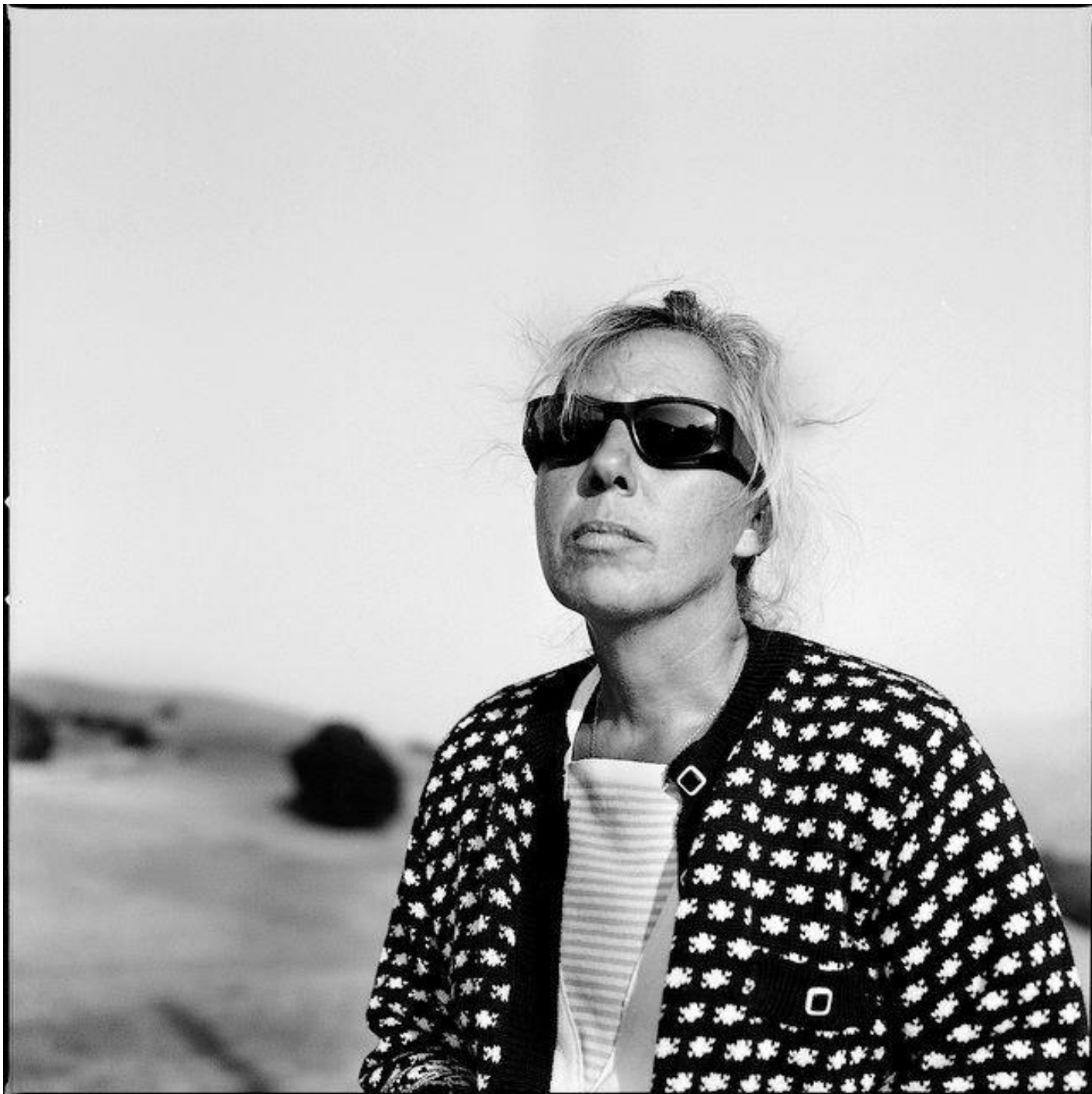
Macchia del cavaliere 1993, ph Salvatore Piermarini.

Il risultato geologico di questo terremoto, documentato e misurato dall'INGV, Ã che il Monte Vettore Ã sprofondato di 10 centimetri e che la parete Est del Corno Piccolo del Gran Sasso d'Italia Ã crollata in un sol colpo.