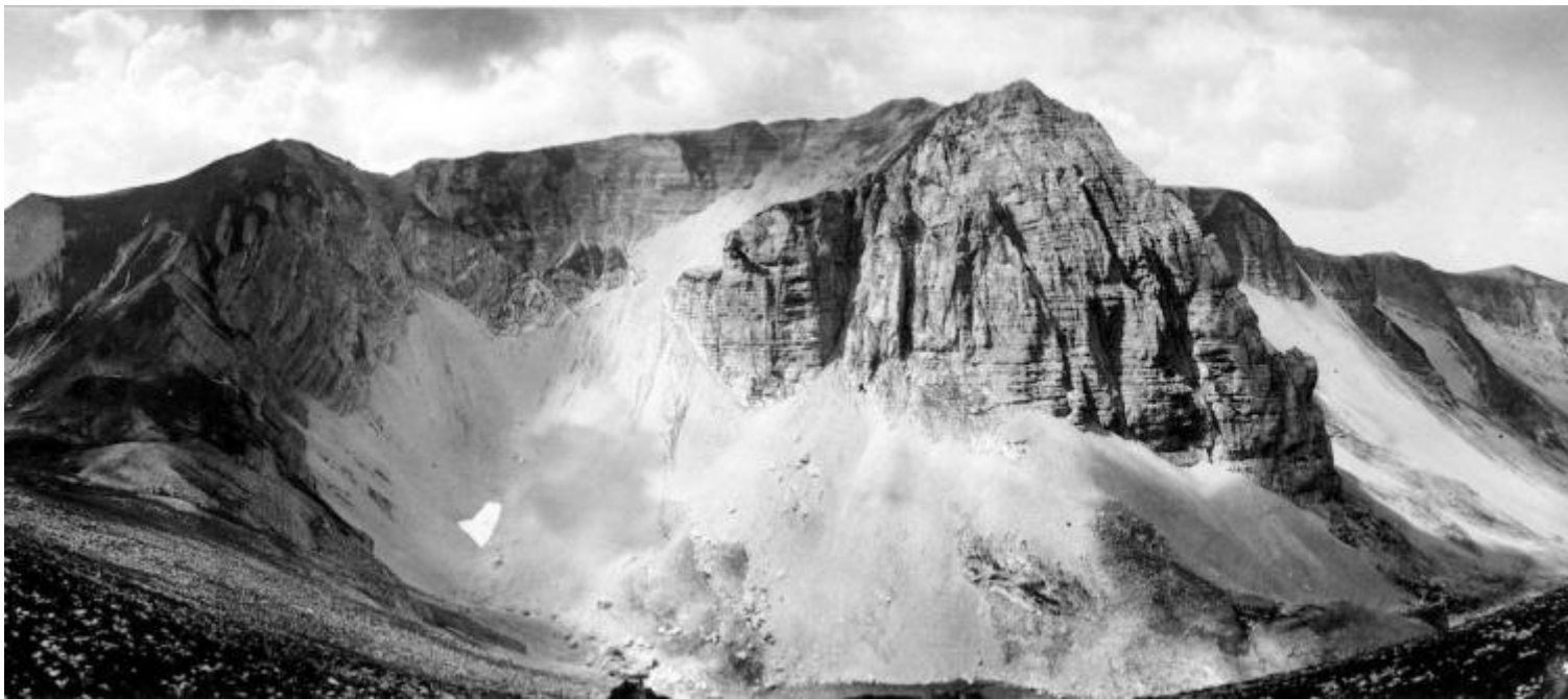
Cima del redentore, Pizzo del diavolo, lago di Pilato dalla vetta del Monte Vettore, ph Salvatore Piermarini.

Come leggere questi luoghi di montagna – a loro modo unici, magici e incantevoli – responsabili dell'ultimo terremoto che ha colpito Arquata, Amatrice e le decine e decine di borghi di un confine geografico ristretto che raccoglie, in pochi chilometri in linea d'aria, ben quattro regioni del centro Italia (Marche, Umbria, Lazio e Abruzzo)?