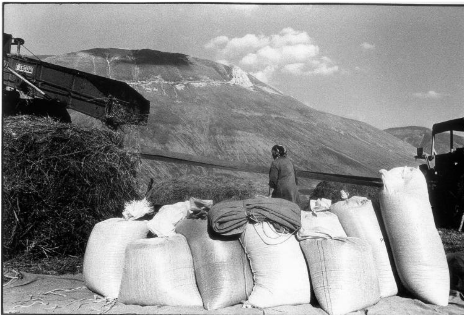
Raccolta delle lenticchie 1988.