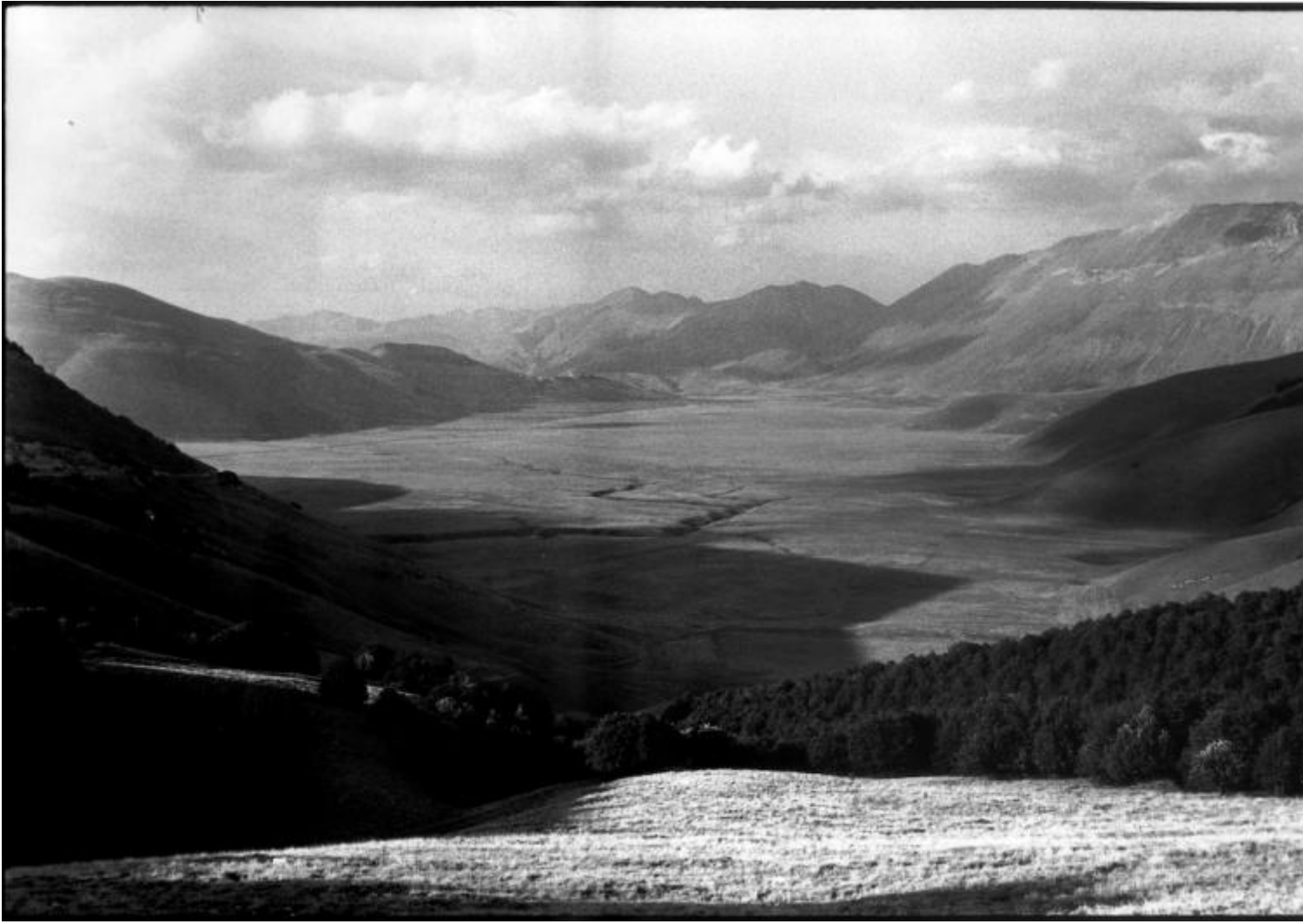
Pian piccolo, Pian grande, Castelluccio di Norcia, Monte Vettore 1988, ph Salvatore Piermarini.