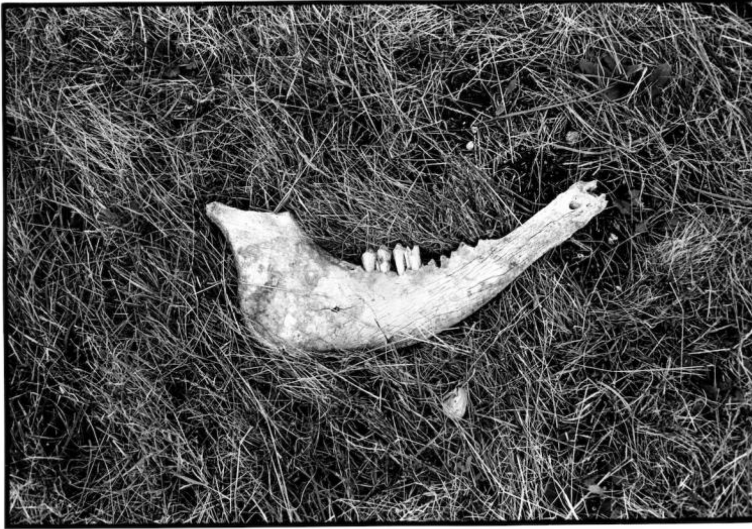
Monte Vettore 1988, ph Salvatore Piermarini..