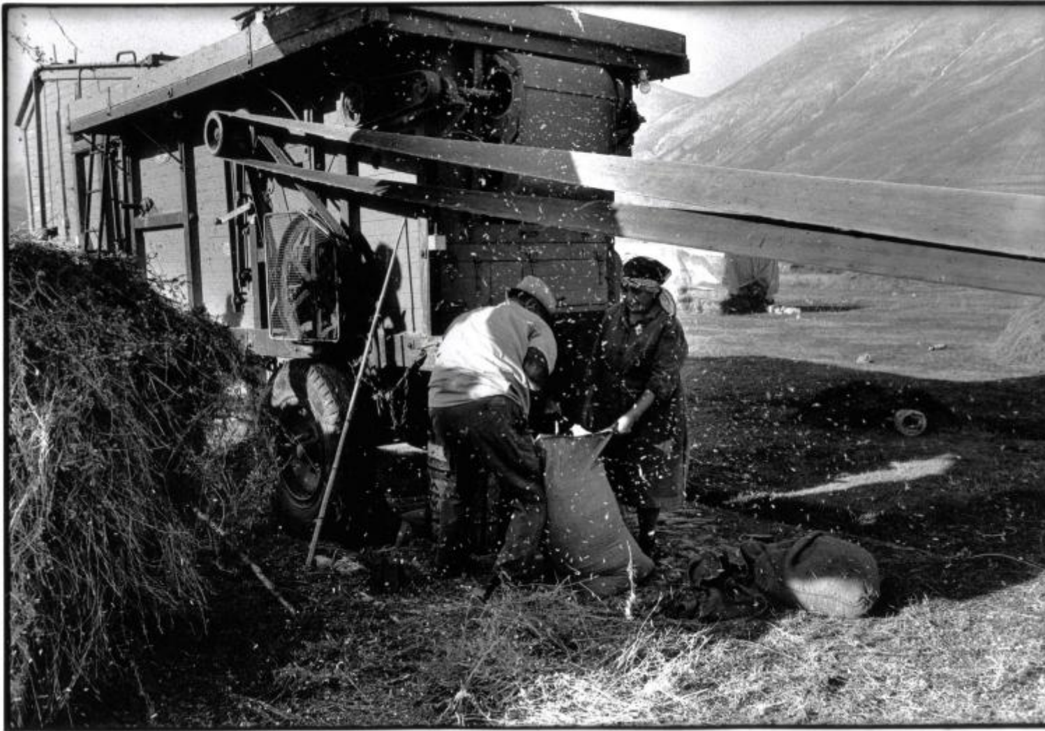
Raccolta delle lenticchie di Castelluccio 1988, ph Salvatore Piermarini.