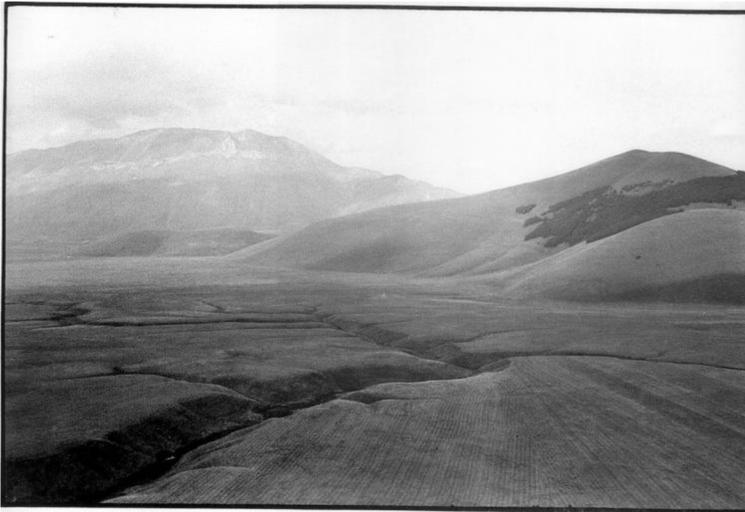
Inghittitoio, fosso del Mergani, Monte Vettore 1988, ph Salvatore Piermarini.

La faglia sismica "partita da qui, intercettata e scovata dai geologi dell'INGV che, a poche ore dalle scosse devastanti del 24 Agosto 2016, si sono incamminati e arrampicati e sono andati a cercarla proprio nel Parco Nazionale dei Monti Sibillini, luogo di natura incontaminata ma di millenaria instabilità .