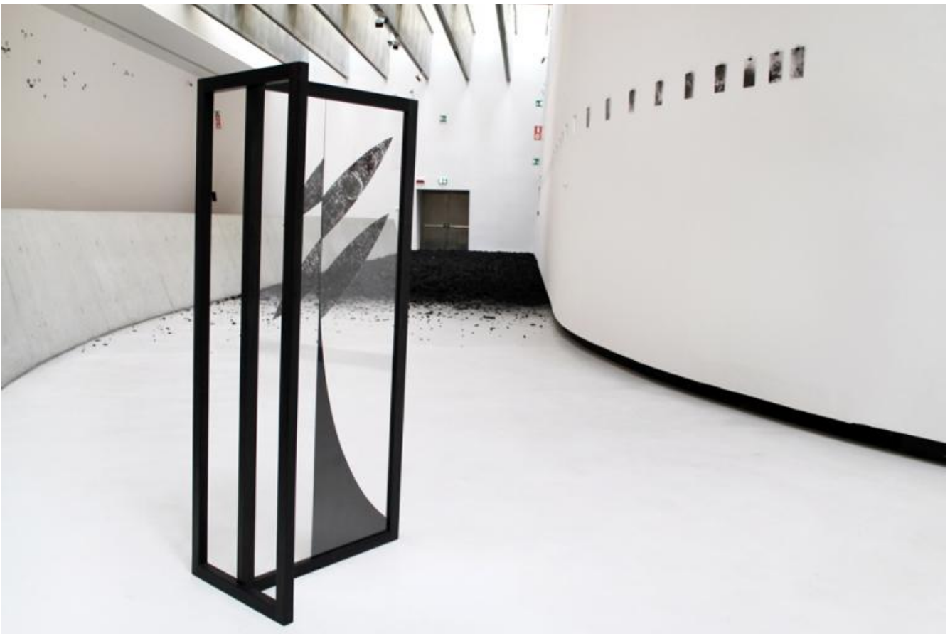
Riccardo Arena Orient 1 - Everlasting Sea 2016

Le mie sono investigazioni coincidentali adagate su una struttura narrativa. Ho iniziato alcuni anni fa in un viaggio in Cina, che mi ha portato fino in Tibet. Da lì, in seguito al furto del portafogli mi sono ritrovato a Buenos Aires, dove sono state usate per la prima volta nella storia le impronte digitali come metodo investigativo. Questo viaggio è stato dettato da una successione di coincidenze che ho seguito. I miei viaggi vanno di pari passo con le mie ricerche e costituiscono la base delle narrazioni intorno alle quali realizzo e sviluppo le mie opere, collage narrativi, stratificazioni da interpretare attraverso diversi livelli di lettura. Anche il rapporto con lo spazio è fondamentale, diventa parte del lavoro.