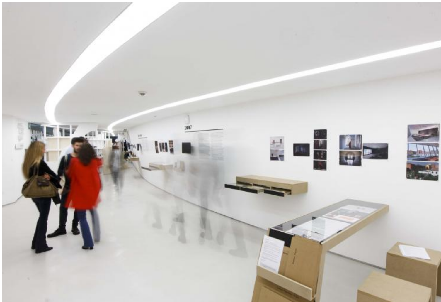
Premio MAXXI | Reading Room