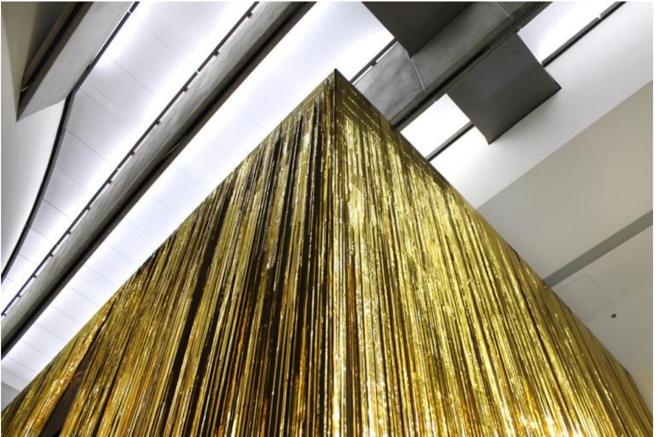
ZAPRUDER filmmakersgroup Zeus Machine 2016

Il vostro nome è un riferimento ad Abraham Zapruder, il video amatore più noto del secolo scorso per essersi casualmente trovato a filmare con la sua Super8 l'omicidio Kennedy, uno degli eventi più significativi della storia recente; narratore per caso nel secolo della fine di tutte le narrazioni storiche. A dispetto di ciò i vostri sono lavori complessi, presieduti da impianti performativi e canovacci surreali, a volte ossessivamente ripetitivi, altre con una struttura narrativa priva di uno svolgimento lineare, ma sempre prefissata. Come definite da un punto di vista dei contenuti il vostro lavoro e come vi ponete rispetto ai presupposti della narrazione classica e al rapporto con la storia?