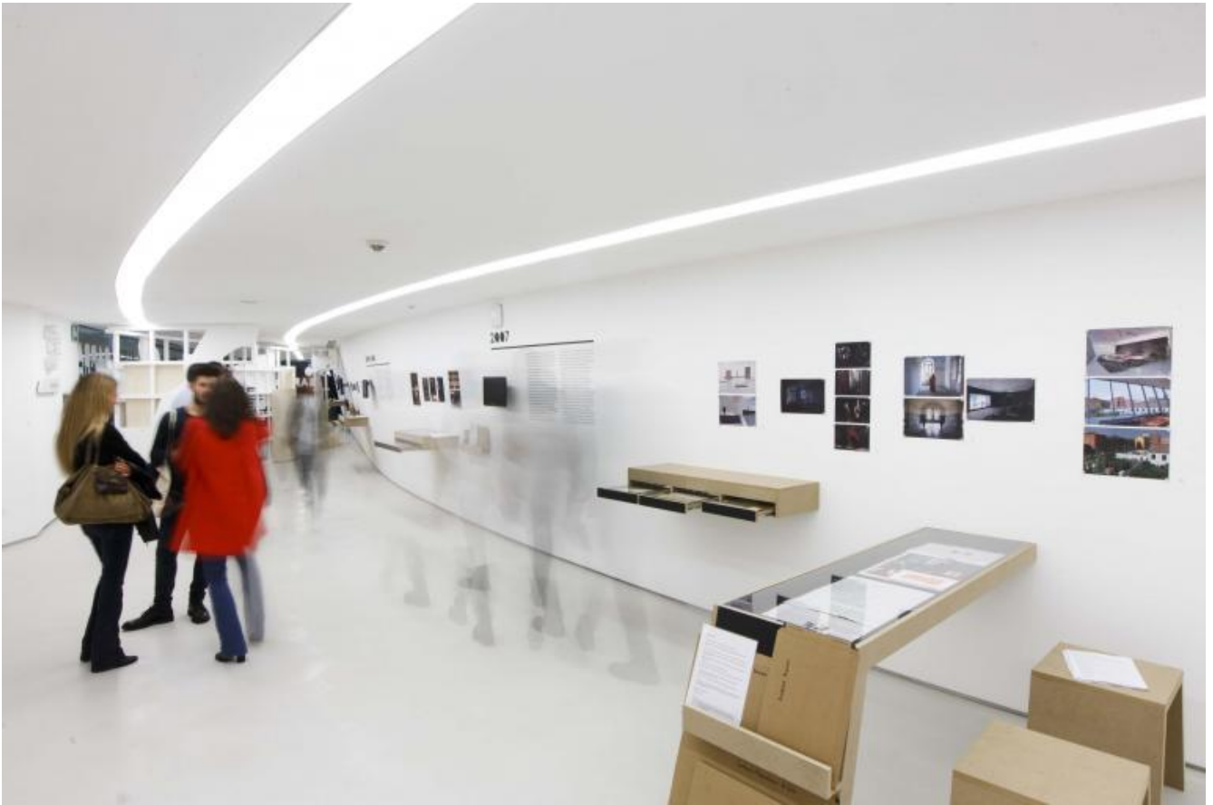
Premio MAXXI | Reading Room