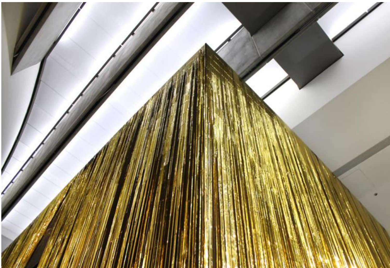
ZAPRUDER filmmakersgroup Zeus Machine 2016

Il vostro nome è un riferimento ad Abraham Zapruder, il video amatore più noto del secolo scorso per essersi casualmente trovato a filmare con la sua Super8 l'omicidio Kennedy, uno degli eventi più significativi della storia recente; narratore per caso nel secolo della fine di tutte le narrazioni storiche. A dispetto di ciò i vostri sono lavori complessi, presieduti da impianti performativi e canovacci surreali, a volte ossessivamente ripetitivi, altre con una struttura narrativa priva di uno svolgimento lineare, ma sempre prefissata. Come definite da un punto di vista dei contenuti il vostro lavoro e come vi ponete rispetto ai presupposti della narrazione classica e al rapporto con la storia?