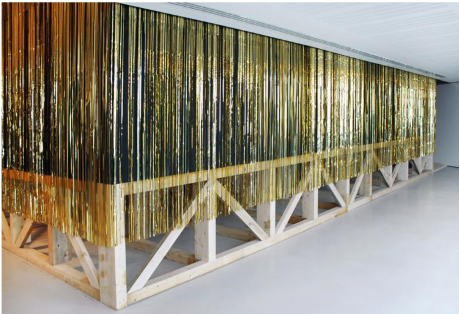
ZAPRUDER filmmakersgroup Zeus Machine 2016

Zapruder è un collettivo di cineasti che si confronta con un cinema da camera di influenza francese e surrealista. Tra gli altri hanno collaborato con Motus e Fanny&Alexander. Come nasce e come si struttura Zapruder filmmakersgroup? Quali sono le ragioni di un lavoro di gruppo e della scelta della forma filmica? Cosa significa in questa prospettiva essere film makers e come è cambiato dal 2000 a oggi il vostro lavoro in relazione alle evoluzioni tecnologiche?