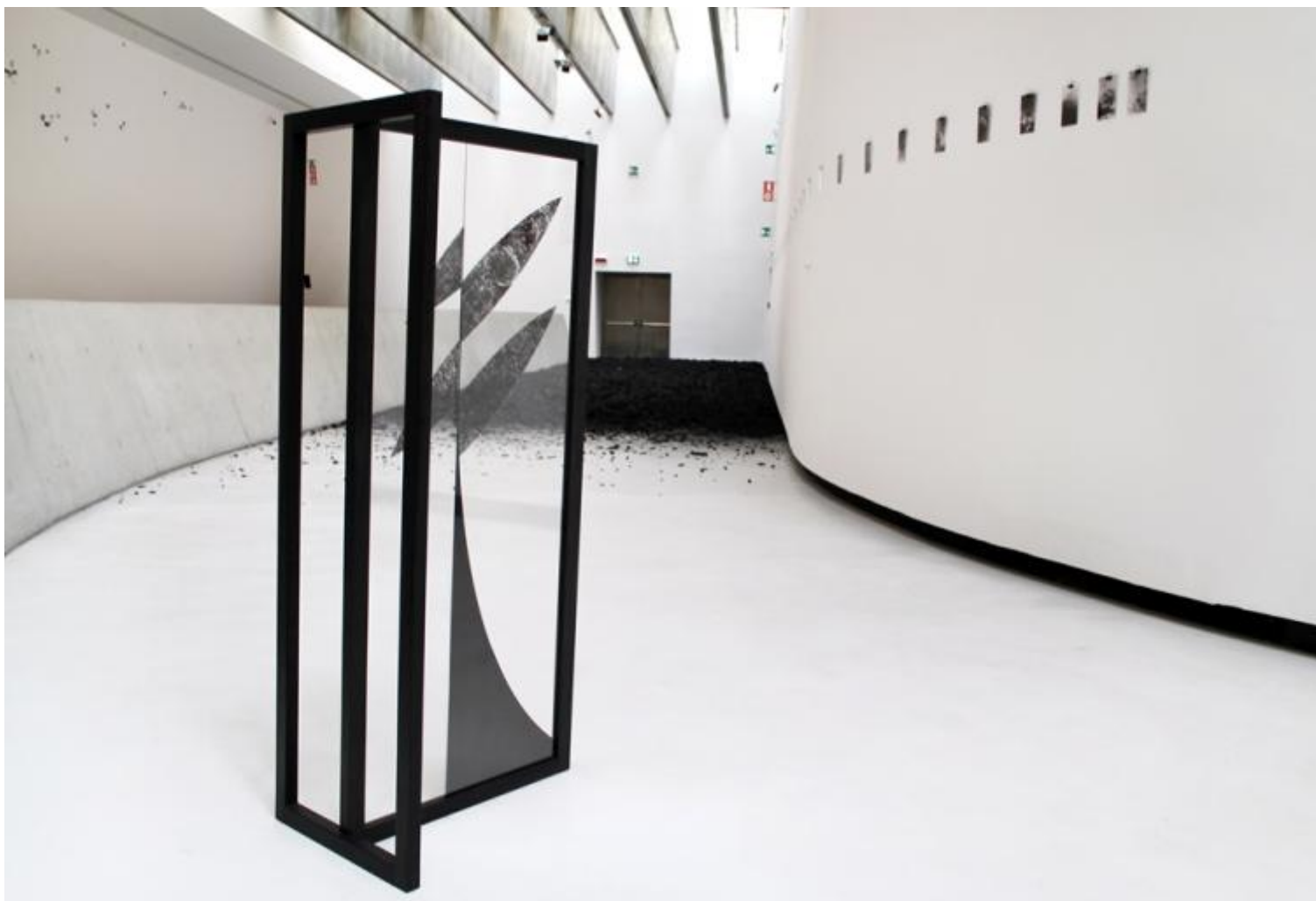
Riccardo Arena Orient 1 - Everlasting Sea 2016

In Orient 1 – Everlasting Sea ripercorri parte della tua esperienza in Russia alla ricerca di una verità cosmica. Ne distribuisce le tracce e le suggestioni lungo tutto lo spazio dal pavimento all’altezza massima della parete, rendendo inaccessibili molte delle loro parti. Si può parlare del tuo lavoro come di uno strumento cognitivo? Come di una ricerca al tempo stesso personale e spirituale?