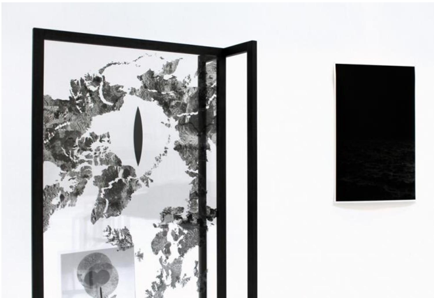
Riccardo Arena Orient 1 - Everlasting Sea 2016

Orient 1 – Everlasting Sea è una tappa di un lavoro che hai iniziato anni fa. Quali sono state le tappe precedenti e come va osservato?