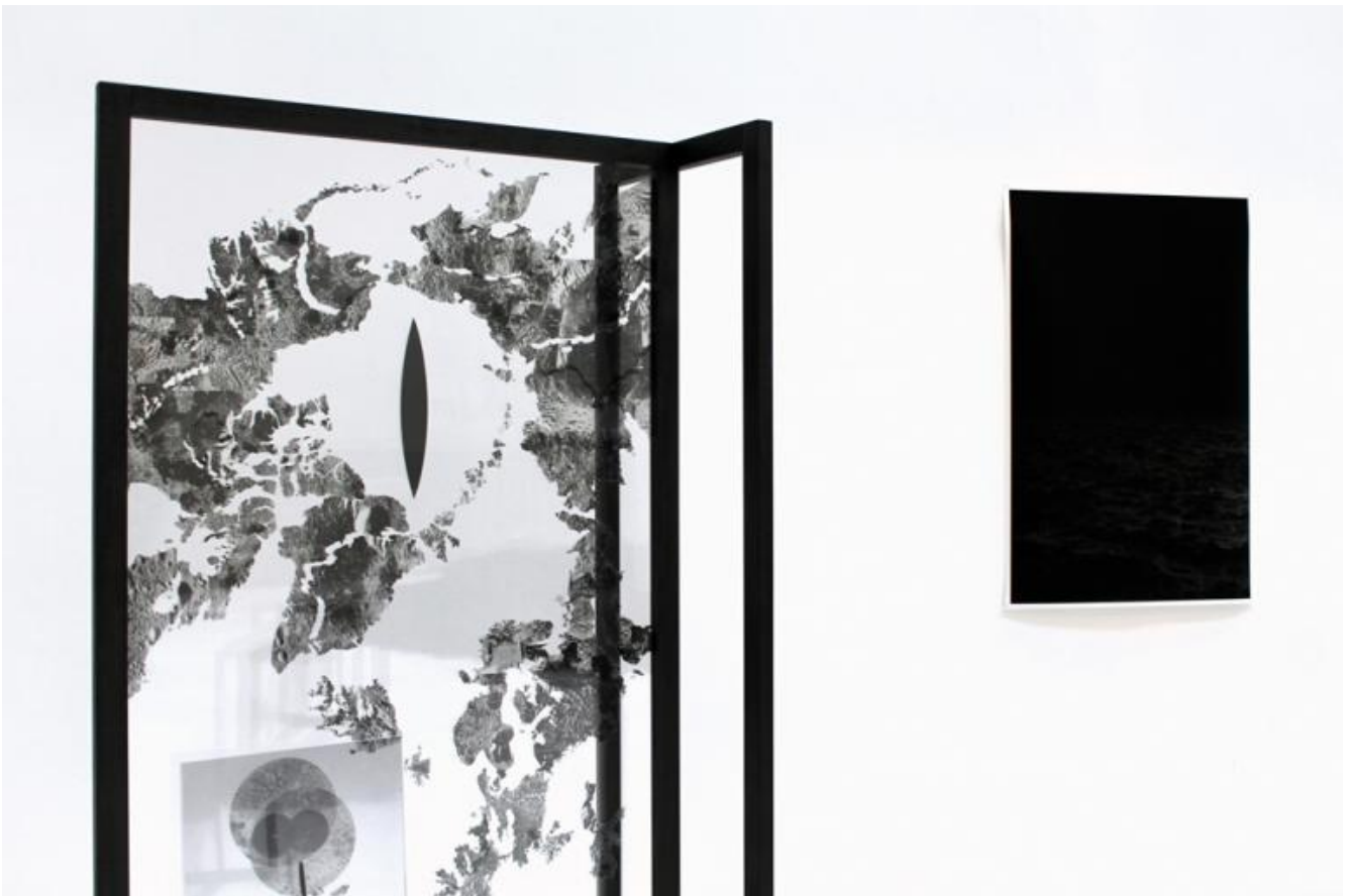
Riccardo Arena Orient 1 - Everlasting Sea 2016

Mi piacerebbe che fosse così. È quello che cerco di fare, quello che per me dovrebbe essere la chiave della ricerca artistica. Da un punto di vista teorico, il futuro distopico di Nikolaj Fëdorovič Fëdorov, fautore del cosmismo russo, che auspicava la colonizzazione di altri pianeti come risposta al sovrappopolamento della Terra conseguito alla sconfitta della morte, mi ha aperto un vaso di Pandora, fino alle Isole Solovskij. Si tratta di un arcipelago russo al confine con la Finlandia e a 160 km dal circo polare. Sede del primo SLON (campo di lavoro forzato) sovietico, dove fu rinchiuso e trovò la morte Pavel Florenski, ha tracce di insediamenti antichissimi e vi si trovano 35 labirinti circolari (Vavilon) fatti di pietre e piante, la cui unica fuga è quella verso l'alto, come quella dei Cosmonauti.