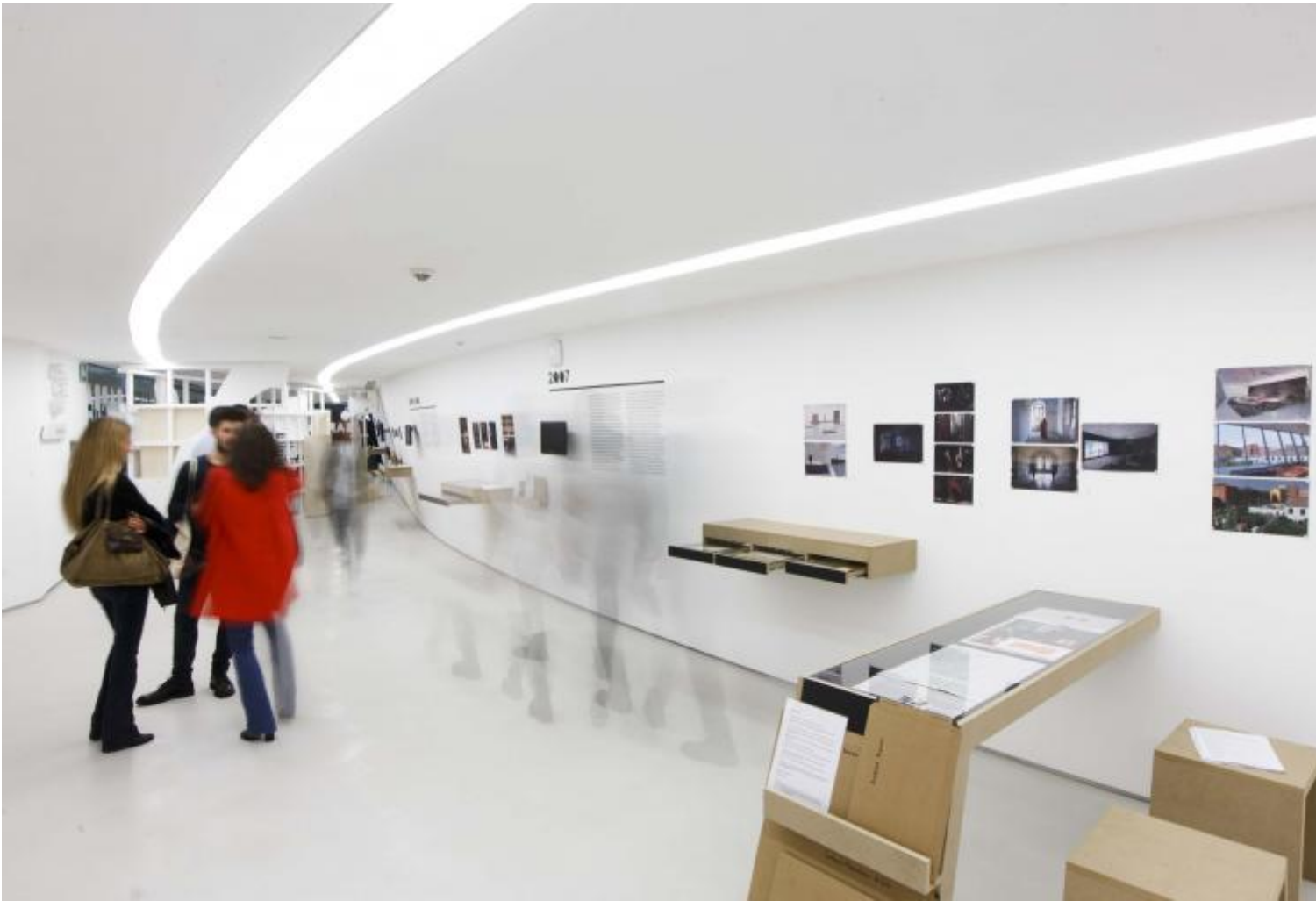
Premio MAXXI | Reading Room