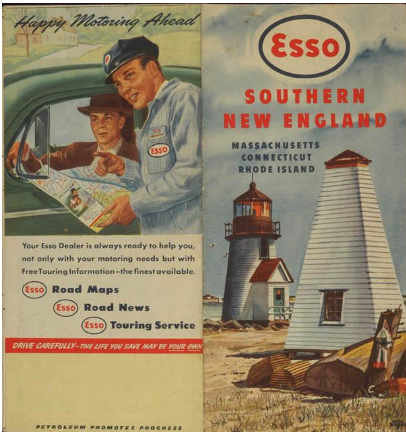
Carta stradale della Esso (New York, 1949).

Dicono che James Joyce fosse ossessionato dalle scrupolose carte dell' Ordnance Survey l'Istituto cartografico britannico, in particolare quelle relative all'Irlanda. Di certo, ne fece largo uso scrivendo l'Ulisse . Il fatto non è privo di ironia e mostra l'ambiguo charme della carta: uno scrittore irlandese che ricorre al lavoro di cartografi e agrimensori imperiali. Quella di Joyce, tuttavia, diviene una contro-cartografia, che confonde e annulla l'ordine della mappa ufficiale in un caleidoscopio di figure e prospettive.