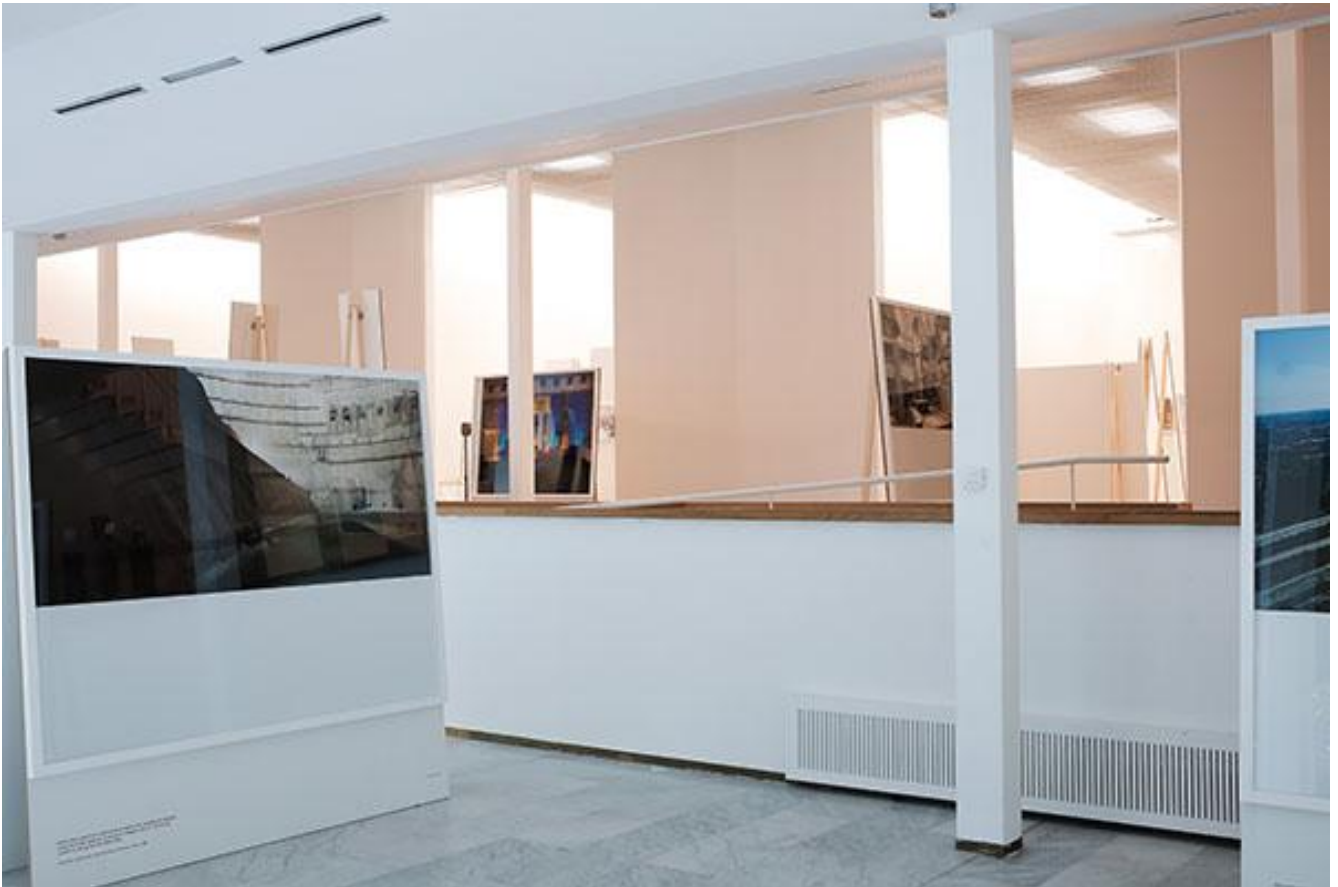
Veduta dell'allestimento PAC - Padiglione d'Arte Contemporanea Milano.