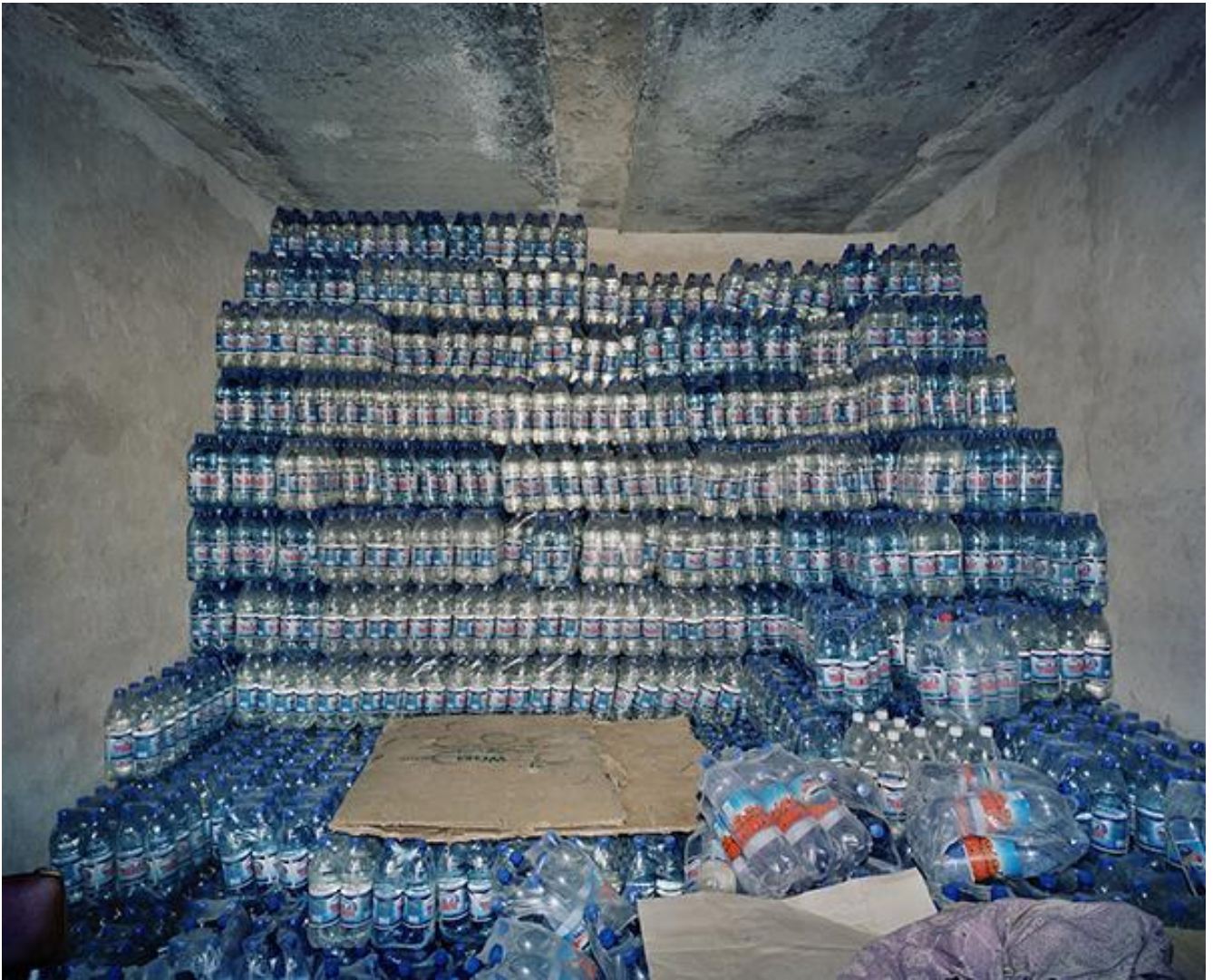
Water shop, Nukus (Aral Lake) Uzbekistan 2001.