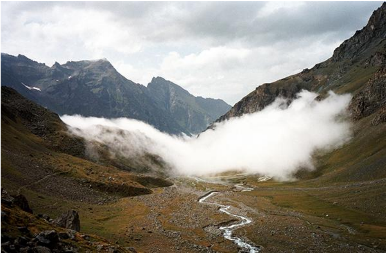
Moving cloud Aosta Italy 2000.