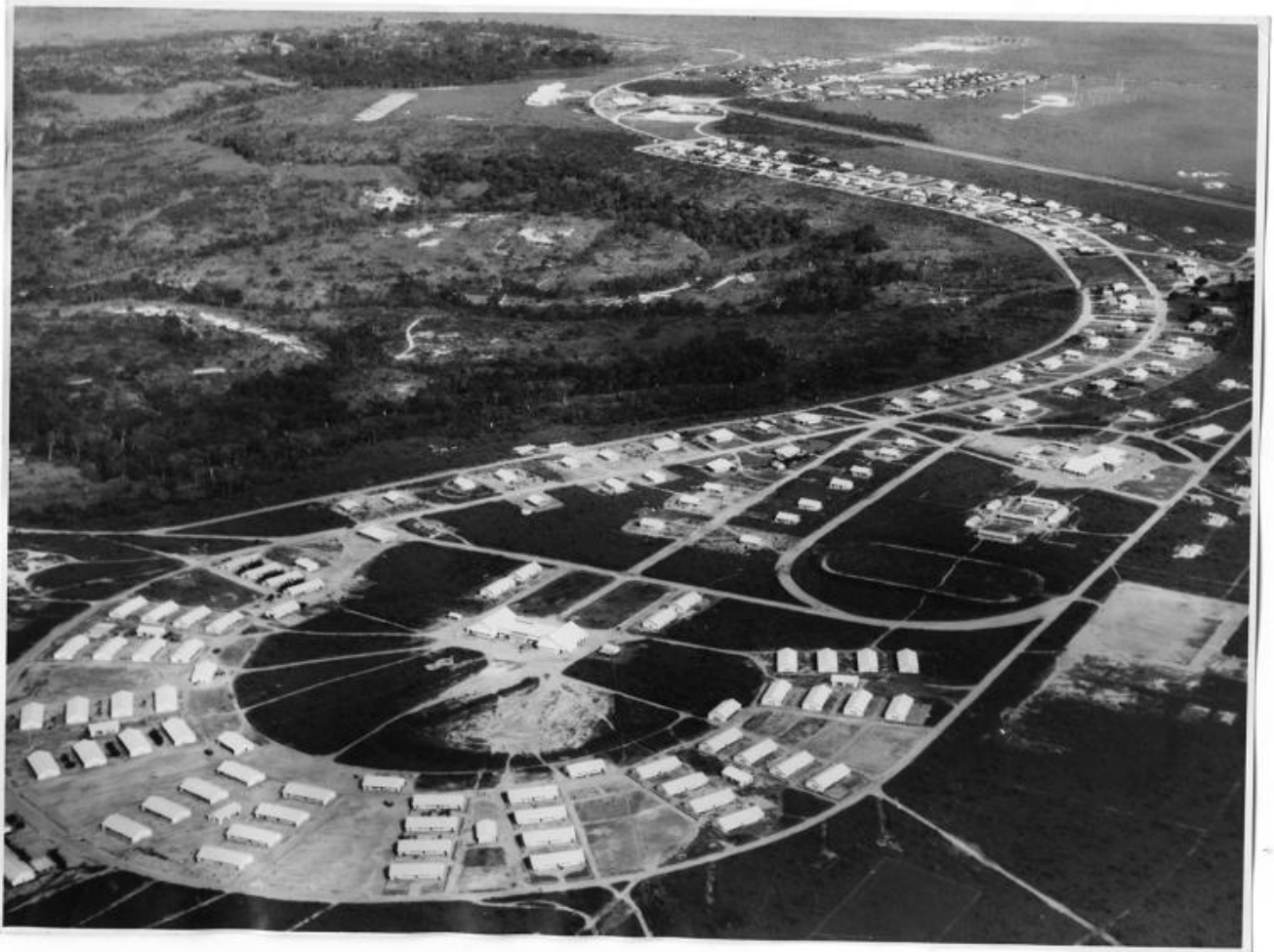
Le Réduit, un progetto di Sven Augustijnen - La Loge, 2016 - fotografo anonimo - Courtesy dell'artista, La Loge & Centre de Documentation historique des Forces armées.