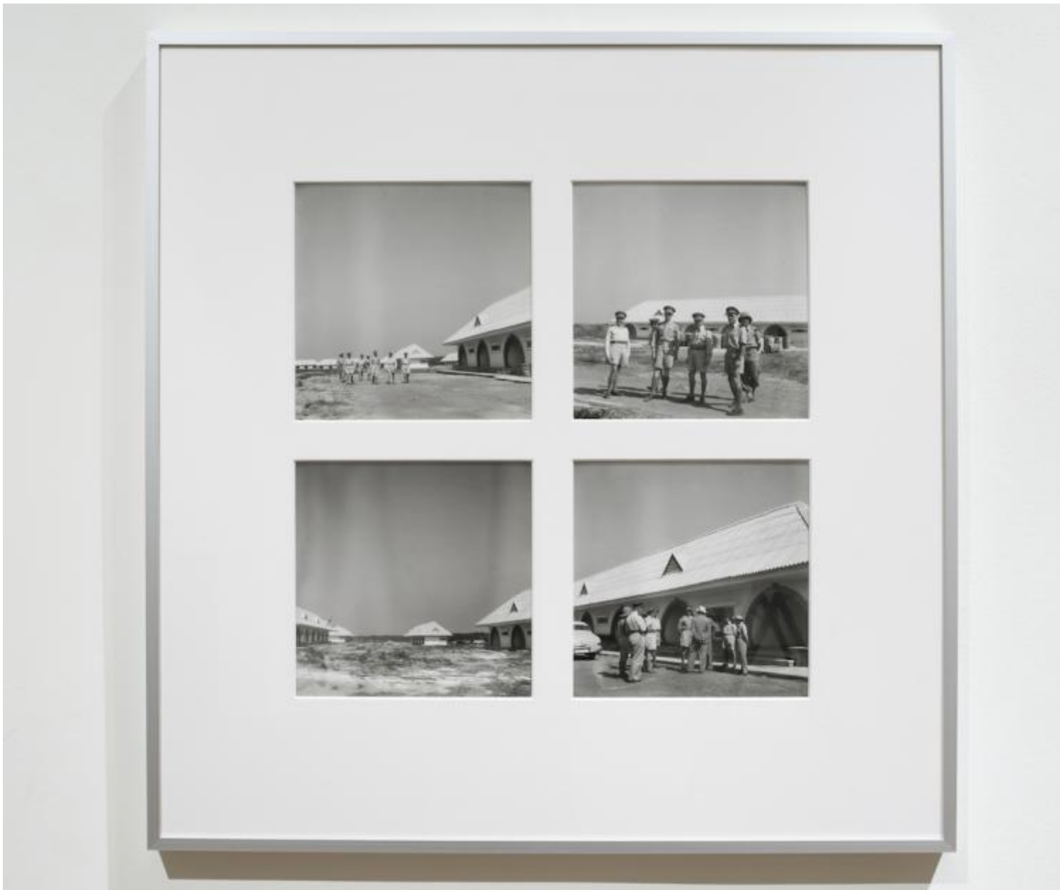
Le R duit, un progetto di Sven Augustijnen, vista della mostra, La Loge, 2016    Copyright & Courtesy dell'artista e La Loge.

Una successione di vedute aeree scattate da un fotografo anonimo nel 1953 mostrano la planimetria della citt  dotata d'infrastrutture civili e militari che si estendeva su una superficie di centinaia di chilometri, mentre un insieme di fotografie in bianco e nero montate su passe-partout ritraggono delle famiglie africane vestite con "gli abiti del potere occidentale", delle abitazioni con i tipici frontoni triangolari in stile fiammingo e una serie di "cerimonie di Stato", simbolo della "dignit  imperiale" come "la posa della prima pietra" in terra straniera da parte di un generale. Queste immagini, "la cui evidenza brucia", sono chiaramente molto lontane dagli "esotismi" del XVIII secolo e dai pensieri ibridanti e tipicamente postmoderni degli anni '80, ma anche da quella particolare imagerie postcoloniale che ha caratterizzato gli anni '90 e che ancora oggi influenza la poetica e il linguaggio di molti artisti.