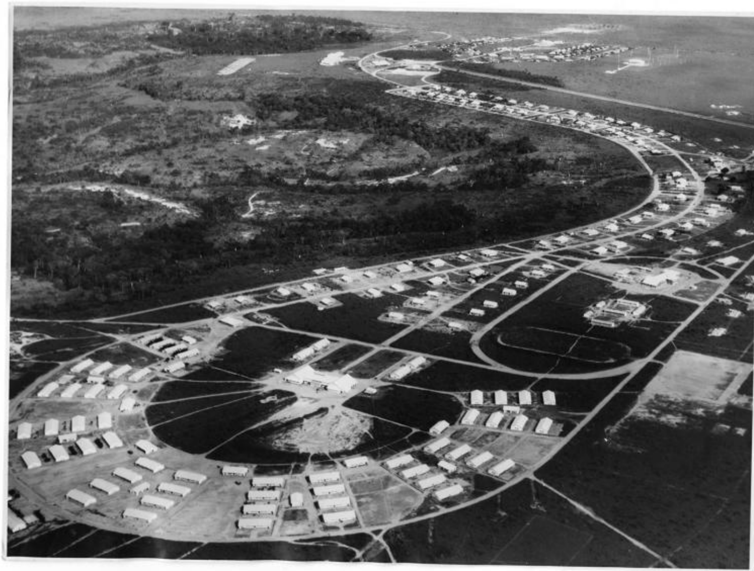
Le Réduit, un progetto di Sven Augustijnen – La Loge, 2016