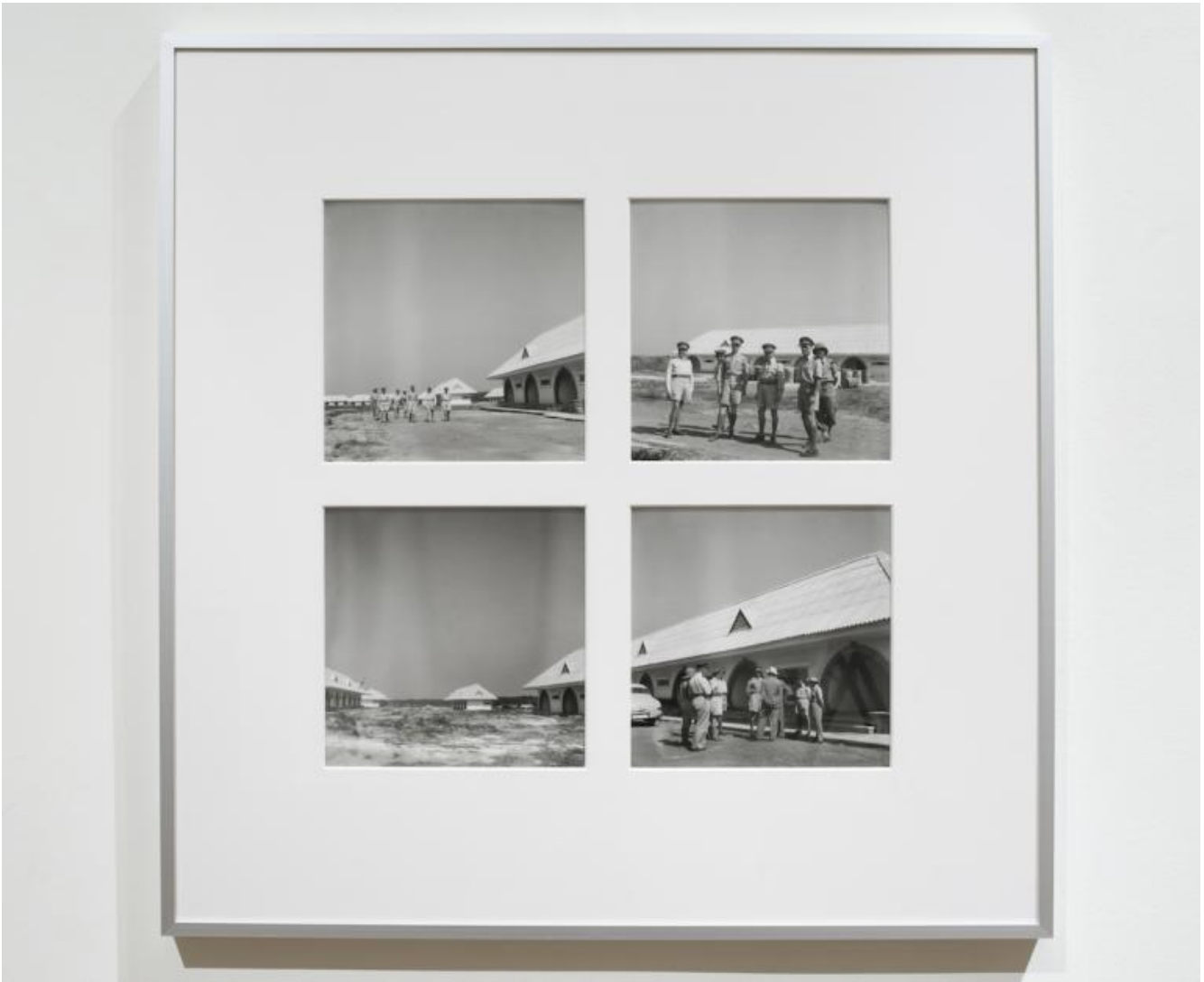
Le Réduit, un progetto di Sven Augustijnen, vista della mostra, La Loge, 2016 - Copyright & Courtesy dell'artista e La Loge.

Una successione di vedute aeree scattate da un fotografo anonimo nel 1953 mostrano la planimetria della città dotata d'infrastrutture civili e militari che si estendeva su una superficie di centinaia di chilometri, mentre un insieme di fotografie in bianco e nero montate su passe-partout ritraggono delle famiglie africane vestite con "gli abiti del potere occidentale", delle abitazioni con i tipici frontoni triangolari in stile fiammingo e una serie di "cerimonie di Stato", simbolo della "dignità imperiale" come "la posa della prima pietra" in terra straniera da parte di un generale. Queste immagini, "la cui evidenza brucia ", sono chiaramente molto lontane dagli "esotismi" del XVIII secolo e dai pensieri ibridanti e tipicamente postmoderni degli anni '80, ma anche da quella particolare imagerie postcoloniale che ha caratterizzato gli anni '90 e che ancora oggi influenza la poetica e il linguaggio di molti artisti.