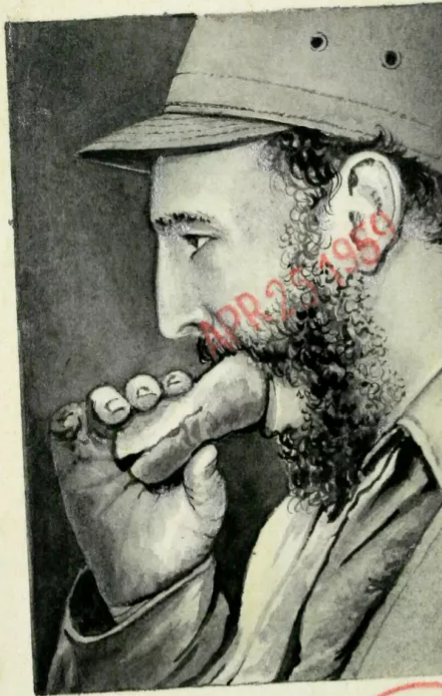
Cuban Prime Minister Fidel Castro ... Americanizing with a hot dog