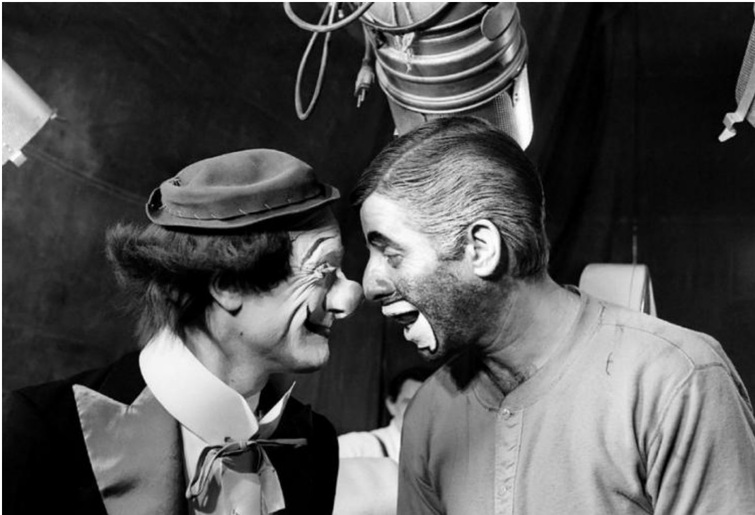
Étaix con Jerry Lewis sul set di “ The Day The Clown Cried ”.

nouvelles vagues di mezzo mondo. La sua posizione può apparire marginale, ma i colleghi registi non tardano ad accorgersi di lui: e se Federico Fellini lo convoca come “cultore della materia” ne I clowns (1970), Jerry Lewis, suo grande amico, lo vuole al proprio fianco nello sfortunato – e tutt'ora invisibile – The Day The Clown Cried (1972).