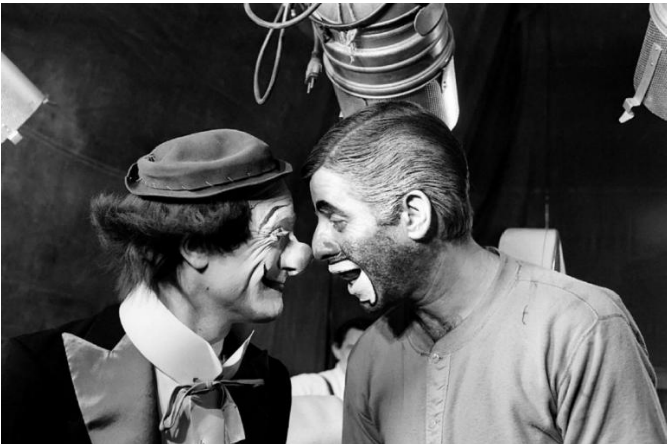
Étaix con Jerry Lewis sul set di “The Day The Clown Cried”.

cooptarlo come assistente per il film Mon Oncle (1958). Purtroppo, il sodalizio con Tati, che Étaix riconoscerà sempre come proprio mentore, si interrompe bruscamente nel momento in cui egli decide di passare alla regia. Prima però, il Nostro fa in tempo a prestare la propria consulenza a Robert Bresson per i “giochi mimici” dei borseggiatori di Pickpocket (1959). Da questo momento in poi, per tutti gli anni Sessanta, l'unico partner creativo di Étaix sarà il grande Jean-Claude Carrière, che qualche anno più tardi diventerà lo sceneggiatore principe di Bunuel e di altri auteurs del cinema europeo. 1961-1971: in soli dieci anni, con tre cortometraggi (uno dei quali, Joyeux anniversaire , premiato con l'Oscar) e cinque lungometraggi all'attivo, Étaix partecipa al rinnovamento del linguaggio cinematografico portato avanti dalle nouvelles vagues di mezzo mondo. La sua posizione può apparire marginale, ma i colleghi registi non tardano ad accorgersi di lui: e se Federico Fellini lo convoca come “cultore della materia” ne I clowns (1970), Jerry Lewis, suo grande amico, lo vuole al proprio fianco nello sfortunato - e tutt'ora invisibile - The Day The Clown Cried (1972).