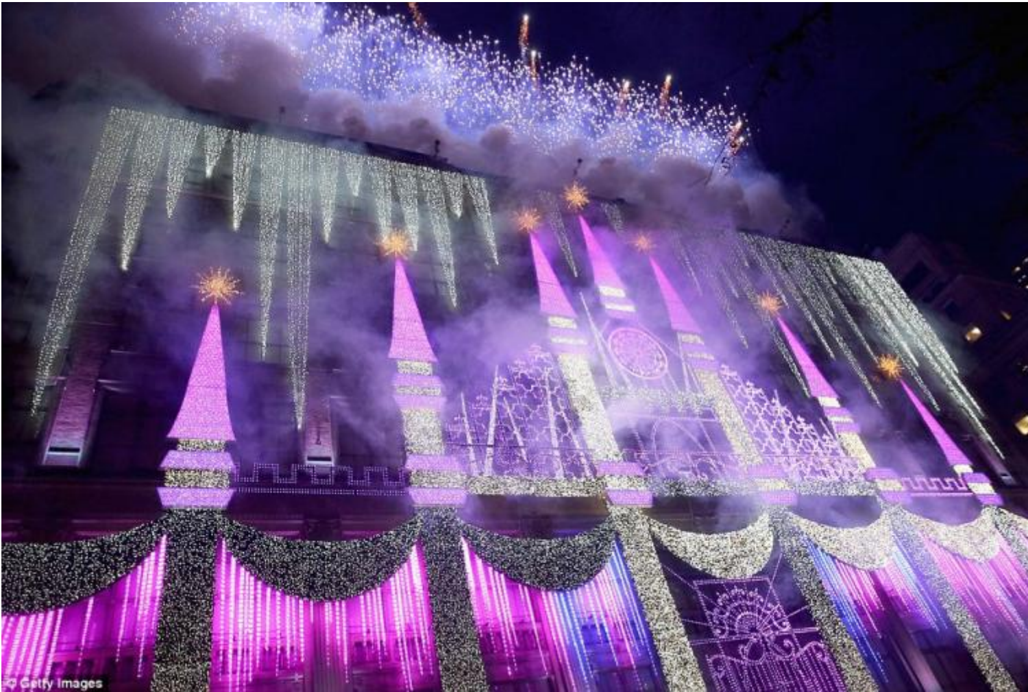
Saks su Fifth Avenue