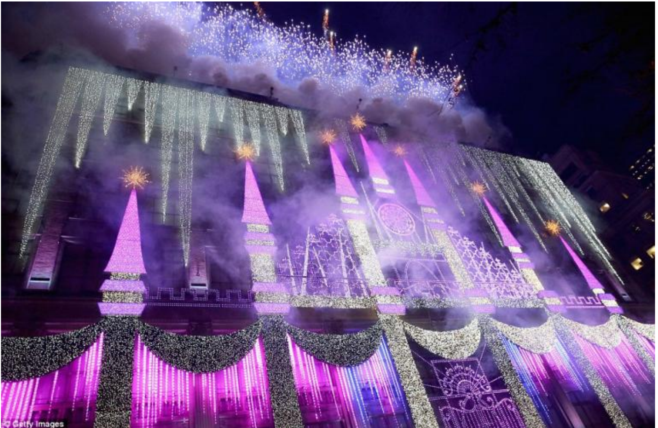
Saks su Fifth Avenue

pubblicitaria, affabulatorie come un racconto mitico e come un video clip, ipnotiche come un film sperimentale e come le luci di un nightclub? Immagini che l'artista sa far funzionare in ampi spazi architettonici come testimonia, per restare a New York, lo spazio cavo del MoMA, una sorta di buco nero, difficile da trattare, in cui persino i quadri immensi di Pölke avevano difficoltà a imporsi ( Pour Your Body Out (7354 Cubic Meters) , 2008).