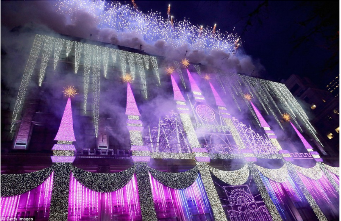
Saks su Fifth Avenue

pubblicitaria, affabulatorie come un racconto mitico e come un video clip, ipnotiche come un film sperimentale e come le luci di un nightclub? Immagini che l'artista sa far funzionare in ampi spazi architettonici come testimonia, per restare a New York, lo spazio cavo del MoMA, una sorta di buco nero, difficile da trattare, in cui persino i quadri immensi di Pölke avevano difficoltà a imporsi ( Pour Your Body Out (7354 Cubic Meters) , 2008).