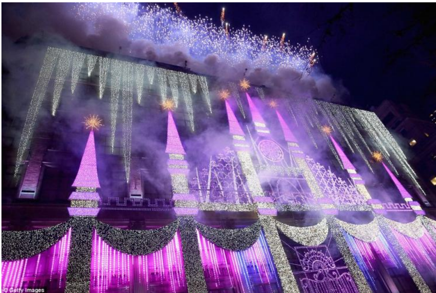
Saks su Fifth Avenue