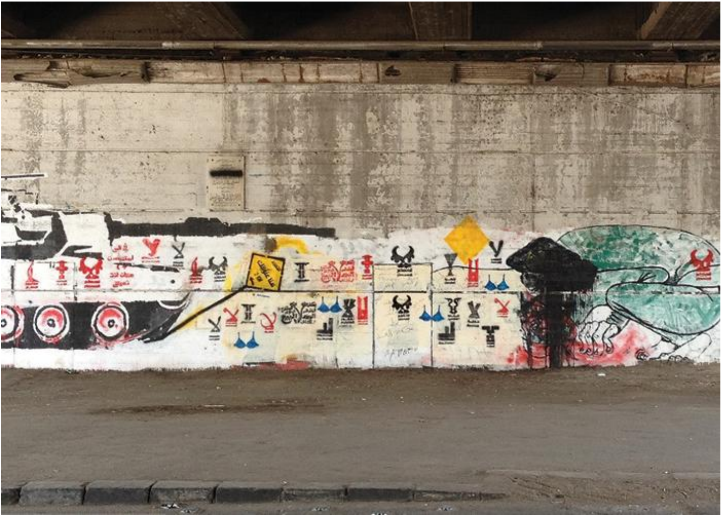
Stencil sul Tank Wall.