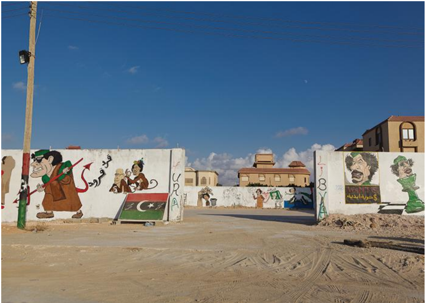
Murales di Ibrahim Hamid, Bengasi, Libia (settembre 2011).

dedicato ai giovani talenti, mettendo insieme street art, musica hip hop e installazioni. Denominato "Back to the City", il festival si tiene annualmente in una data simbolica, il 27 aprile (la giornata in cui si celebra la Festa della Libert  in Sudafrica). Ogni anno, parte di Newtown viene chiusa al traffico, gli artisti si esibiscono sul palco e realizzano i loro graffiti sui pilastri sotto il ponte M1.