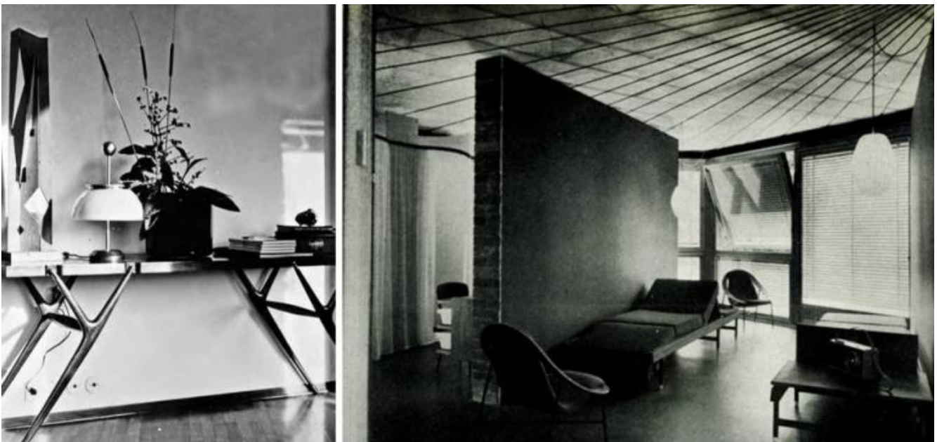
Tavolo mensola con i puntali in ottone del 1947; Soggiorno della Casa per vacanze, Como, mostra Colori e forme nella casa d'oggi, 1957, con la poltrona Conca, 839, 1955, Cassina.

Sul "Pa" pioveranno allora importanti commesse, ad esempio gli arredi della Libreria dello Stato (Milano, 1947), l'allestimento della Mostra del Giornalismo (Milano 1948) e della I Fiera di Bergamo (Bergamo, 1950) fino ad indurlo ad organizzare in prima persona la mostra Colori e forme nella casa d'oggi , a Como, tra il luglio e l'agosto 1957, in quella stessa Villa Olmo che lo aveva visto esordiente giusto venti anni prima.