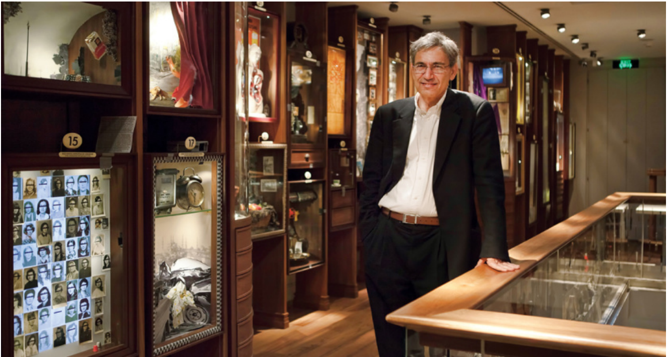
il Museo dell'Innocenza di Orhan Pamuk

Il romanzo racconta la storia d'amore di un uomo, Kemal, il protagonista che parla in prima persona, che si innamora perdutamente di una ragazza, Füsün, che lo corrisponde appassionatamente; ma Kemal è già impegnato con un'altra, Sidel, per cui quando i due si fidanzano ufficialmente Füsün risponde sottraendosi a Kemal, scomparendo per diverso tempo, per ricomparire solo più tardi sposata a Feridun, un aspirante regista cinematografico. A questo punto Kemal, che ha lasciato Sidel, torna a frequentare castamente Füsün e la sua famiglia, oscillando per ben otto anni tra la felicità della sua presenza e dell'attesa di tornare insieme e la disillusione quando sospetta un'indifferenza da parte dell'amata o non intravede gli sviluppi desiderati. Alla fine Füsün divorzia e i due tornano insieme, decidono di sposarsi, ma dopo una notte d'amore Füsün guida un'automobile, con Kemal al suo fianco, contro un albero. Lei muore mentre Kemal sopravvive.