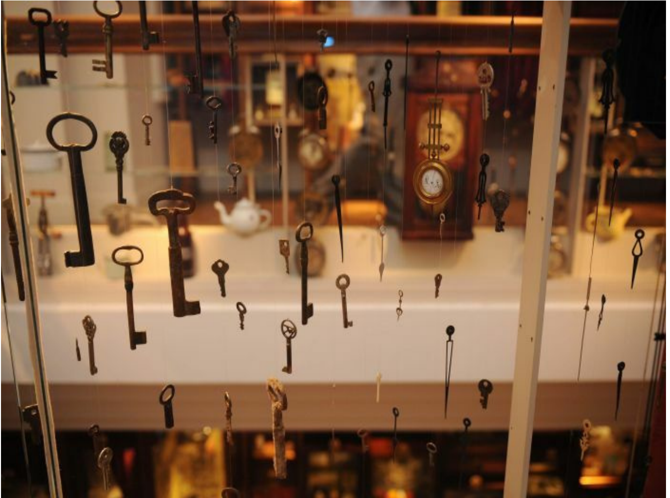
il Museo dell'Innocenza di Orhan Pamuk

La concezione del tempo appare classica: il passato, l'oggetto che lo testimonia, il ricordo che viene rievocato. L'oggetto è come una fotografia, documenta l' "è stato". Ecco dunque che la concezione del tempo diventa centrale, ma non più così scontata, come in fotografia appunto: l'oggetto in realtà è, come la fotografia, un nodo temporale, in cui presente, passato e futuro si rimandano l'un l'altro.