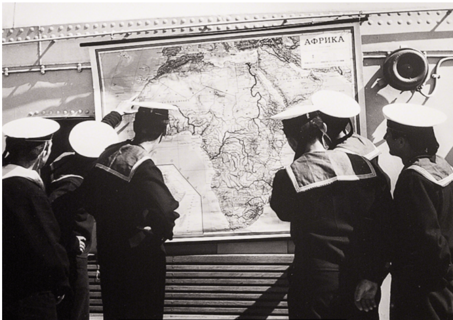
Theo Eshetu, The Mystery of History and My Story in His Story (2015), Courtesy of the artist and Tiwani Contemporary.

La galleria londinese Tiwani Contemporary presenta Field Work , una mostra collettiva che include i lavori di otto artisti africani e della diaspora “le cui pratiche sono ancorate in un profondo scrutinio dei meccanismi della storia”, come dichiara il comunicato stampa. Esplorando il modesto spazio della galleria, il visitatore si trova a incontrare otto distinti approcci alle questioni del tempo e del racconto storico; approcci che mettono in luce nuovi modi di registrare, recuperare e studiare le molte forme del passato, mettendo in discussione la dominante storiografia di matrice occidentale. Ognuno dei lavori presenti in mostra è espressione di pratiche artistiche molto più complesse, che possono, in alcuni casi, entrare in dialogo e rivelare interessanti connessioni metodologiche.