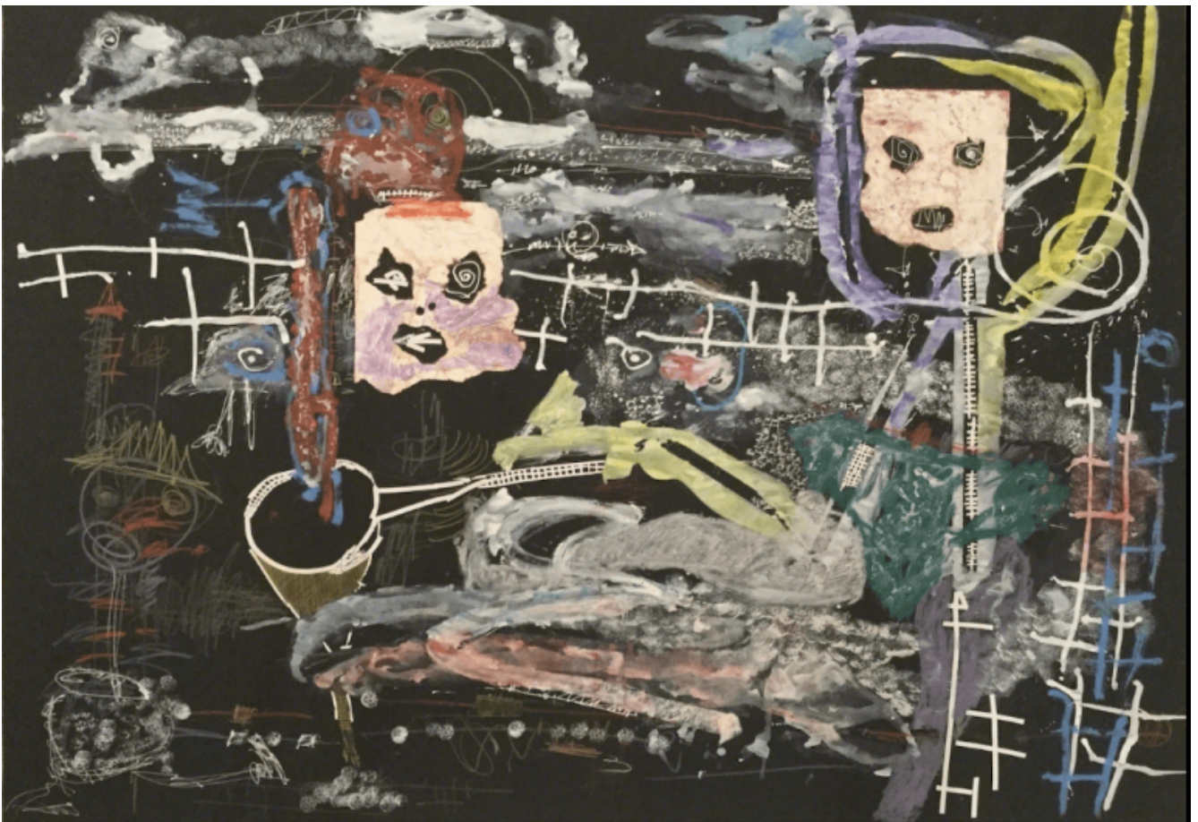
Thierry Oussou, Untitled (2016), Courtesy of the artist and Tiwani Contemporary.

L'intimo e poetico video di Kitso Lynn Lelliott, I was her and she was me and those we might become (2016), concentra la riflessione su un tempo non lineare. In questo lavoro linee temporali distanti si uniscono, in costellazioni mutevoli e frammentarie. L'artista rimarca l'impossibilità che una valida narrazione storica, personale o collettiva, si configuri come un singolo, immutabile oggetto di conoscenza. La storia è il risultato di un costante intrecciarsi di racconti plurali e dissonanti. Irriducibile complesso di tracce, impressioni, sogni.