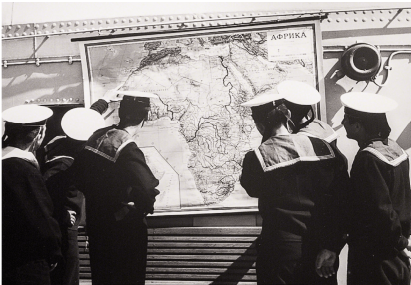
Theo Eshetu, The Mystery of History and My Story in His Story (2015), Courtesy of the artist and Tiwani Contemporary.

Sarebbe arrivata l'arte visiva e performativa a insegnarmi diversamente.