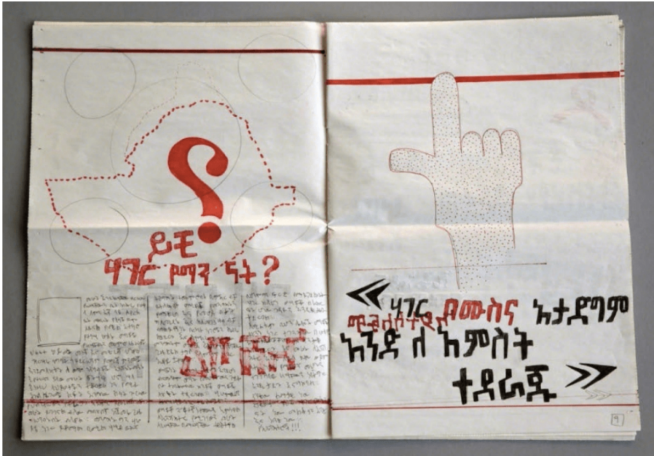
Robert Temesgen, Another Old News (2016), Courtesy of the artist and Tiwani Contemporary.

comune, una pipa appartenuta allo scrittore e attivista nigeriano Ken Saro-Wiwa. L'oggetto inanimato diviene qualcosa di più che un vuoto relitto: privilegiato testimone della storia, tanto efficace nel suo ruolo quanto una vivace foto di Saro-Wiwa stesso. La combinazione della semplice scansione della pipa, che non lascia spazio a nessun altro commento, e la linea sonora che risuona di eco del passato, aprono una finestra inattesa su una precisa narrativa storica.