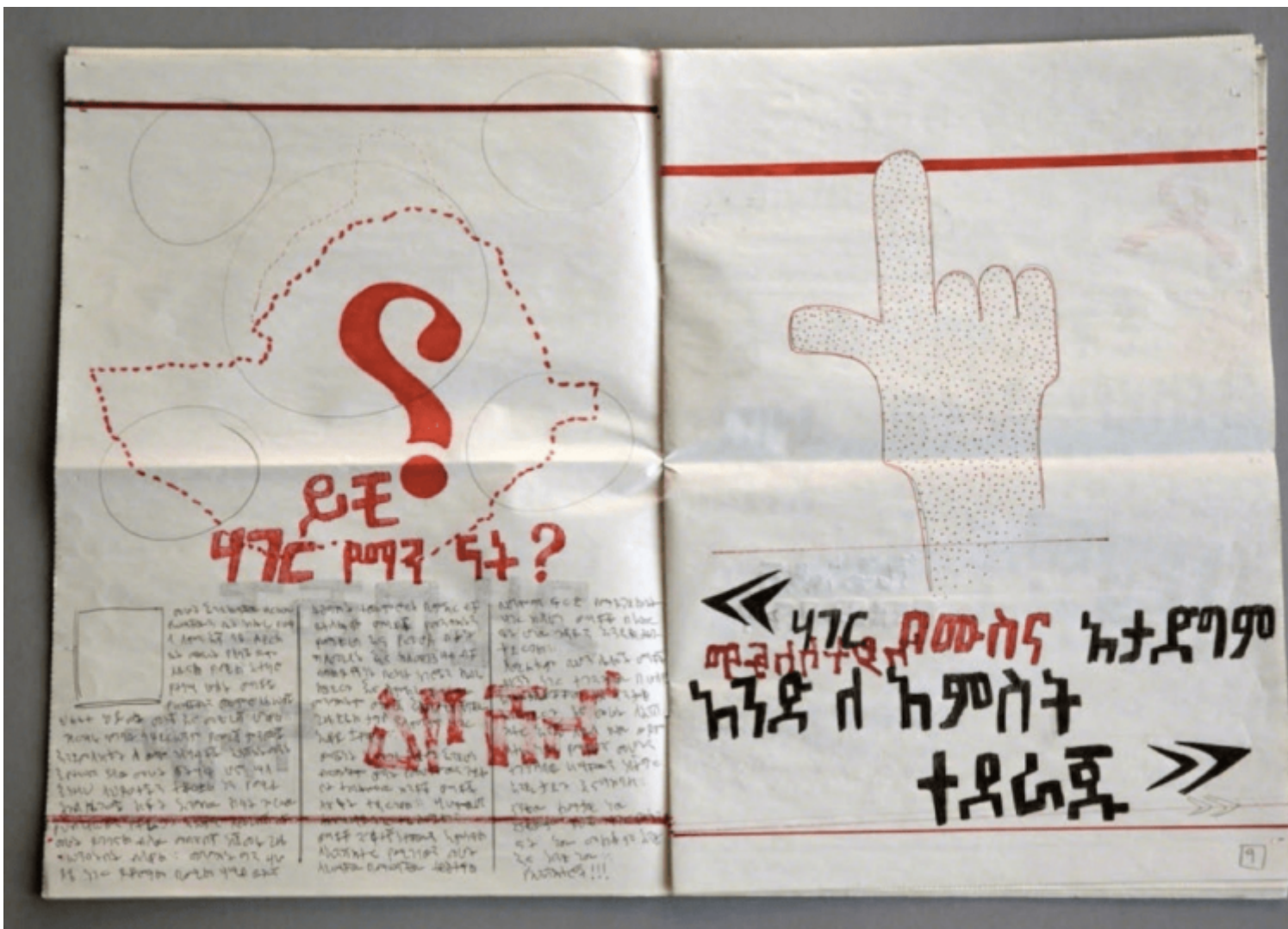
Robert Temesgen, Another Old News (2016), Courtesy of the artist and Tiwani Contemporary.