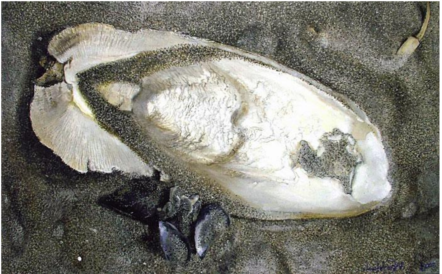
Osso di seppia.

fosse bisogno, l'ultimo indizio necessario a confermarne l'ostinata tensione verso l'integrità.