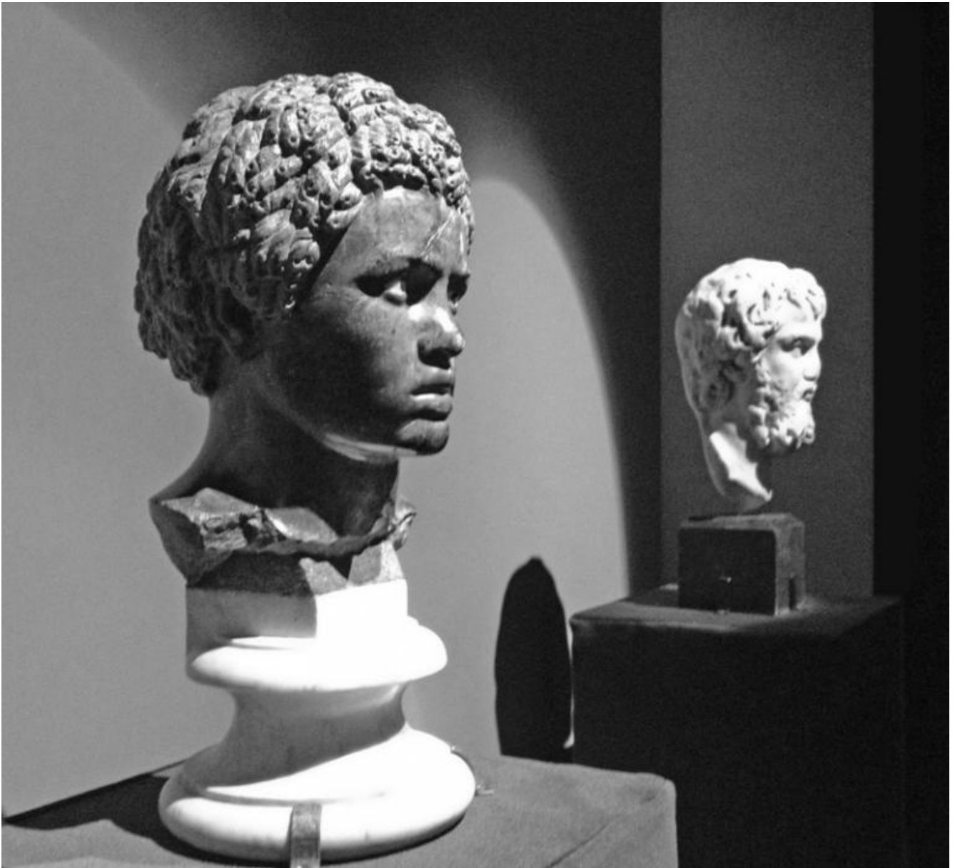
Testa di giovane africano. Marmo grigio morato e calcare, prima metà del II secolo d.C. Museo delle Terme di Diocleziano.

L'archeologia dimostra quindi che non esistono culture "pure", anche se a una presunta "purezza" si sono riferiti alcuni regimi appropriandosi del passato come strumento di legittimazione del potere, dalle epoche più antiche a quella contemporanea. La copia romana del Discobolo di Mirone, che Hitler acquistò dalla famiglia Lancellotti per la cifra di 5 milioni di Lire, rappresentava per il dittatore una classicità di maniera adattata all'ideologia razzista, un modello della razza superiore, alla quale s'ispirò la regista Leni Riefenstahl per la realizzazione del film Olympia nel 1938.