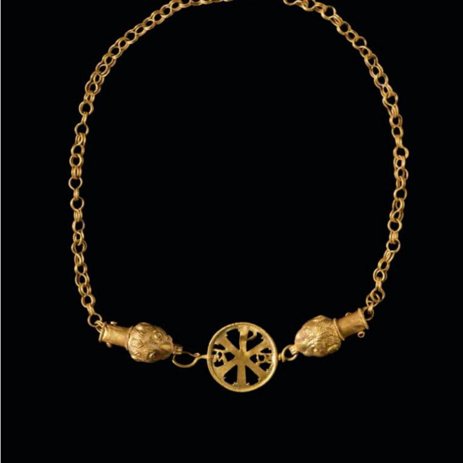
Collana in oro con chrisma, fine IV - met. V secolo d.C. Museo Nazionale Romano - Palazzo Massimo.

Nella seconda sezione l'archeologia è presentata anche come strumento per comprendere la varietà di interazioni e scambi che determina un'identità sociale e culturale. A questo riguardo possiamo ammirare