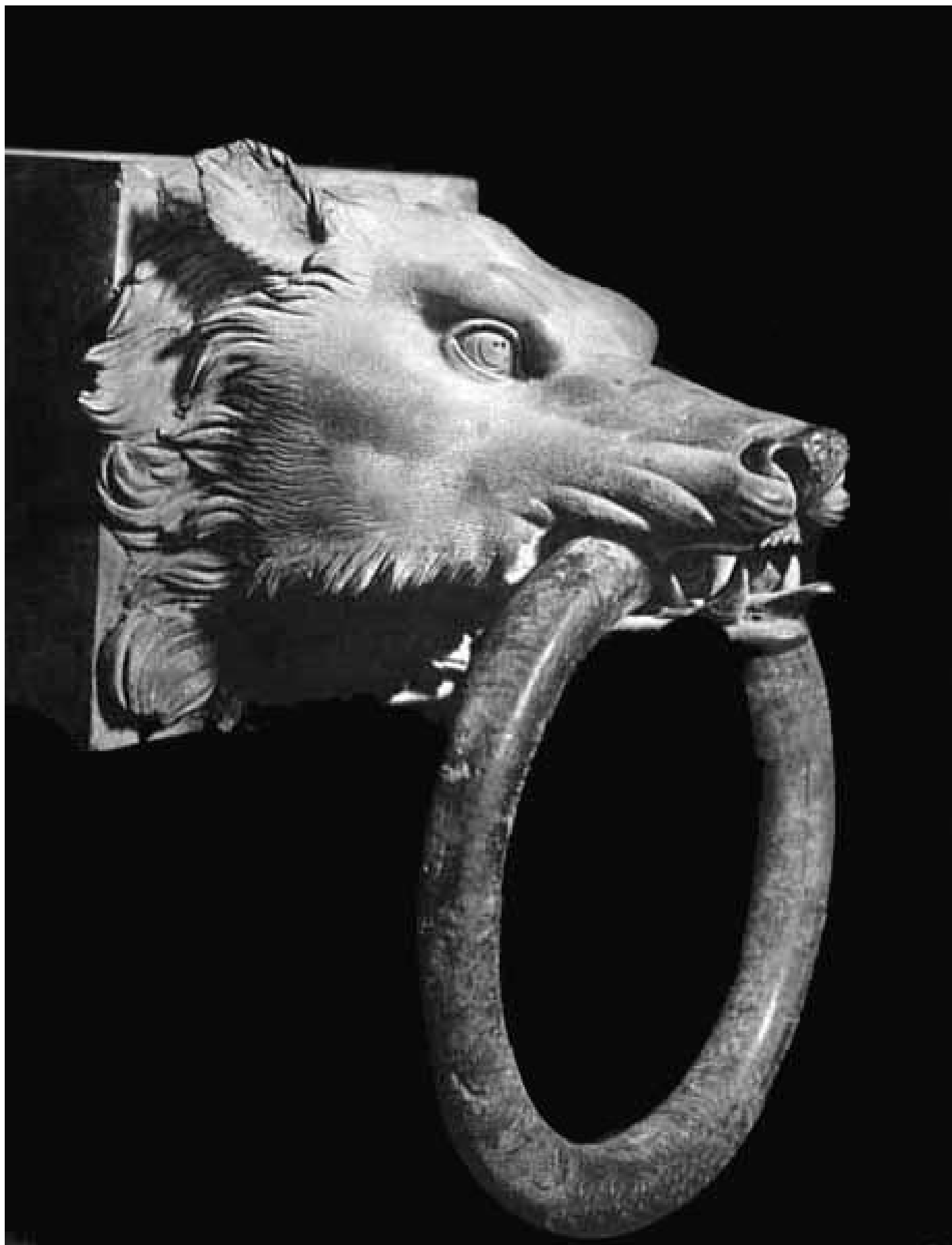
Testa di lupa che decorava la testata di una trave della prima nave di Nemi. Bronzo, 37 - 41 d.C. Museo Nazionale Romano - Palazzo Massimo.