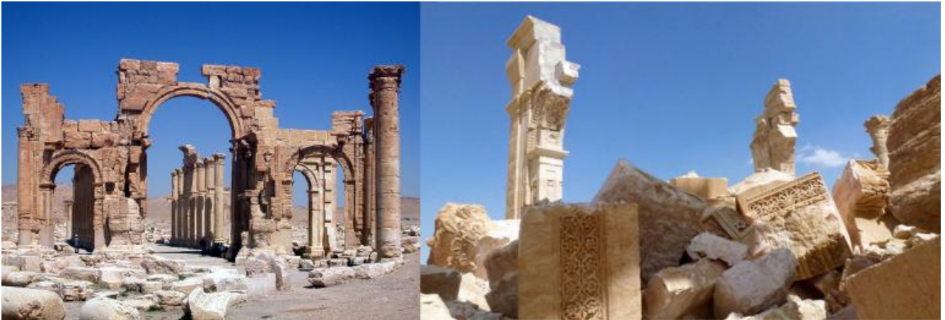
Arco trionfale a Palmira prima e dopo la distruzione avvenuta nel 2016.

incredibile, che per essere concepito ha richiesto la capacità di immaginare un grave edilizio che galleggia su una massa liquida instabile, di mettere in relazione cose che normalmente non lo sono perché estranee l'una rispetto all'altra.