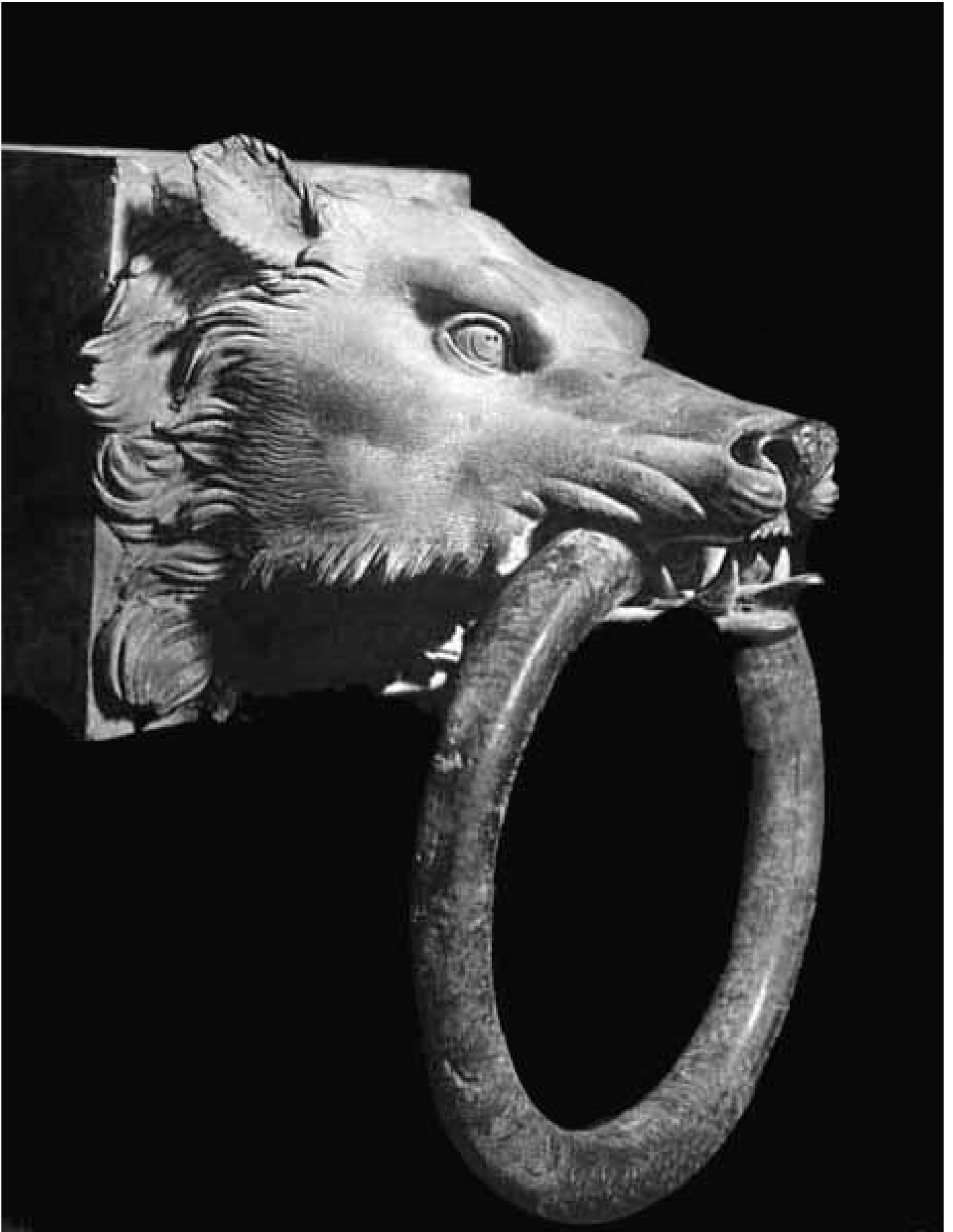
Testa di lupa che decorava la testata di una trave della prima nave di Nemi. Bronzo, 37 - 41 d.C. Museo Nazionale Romano - Palazzo Massimo.