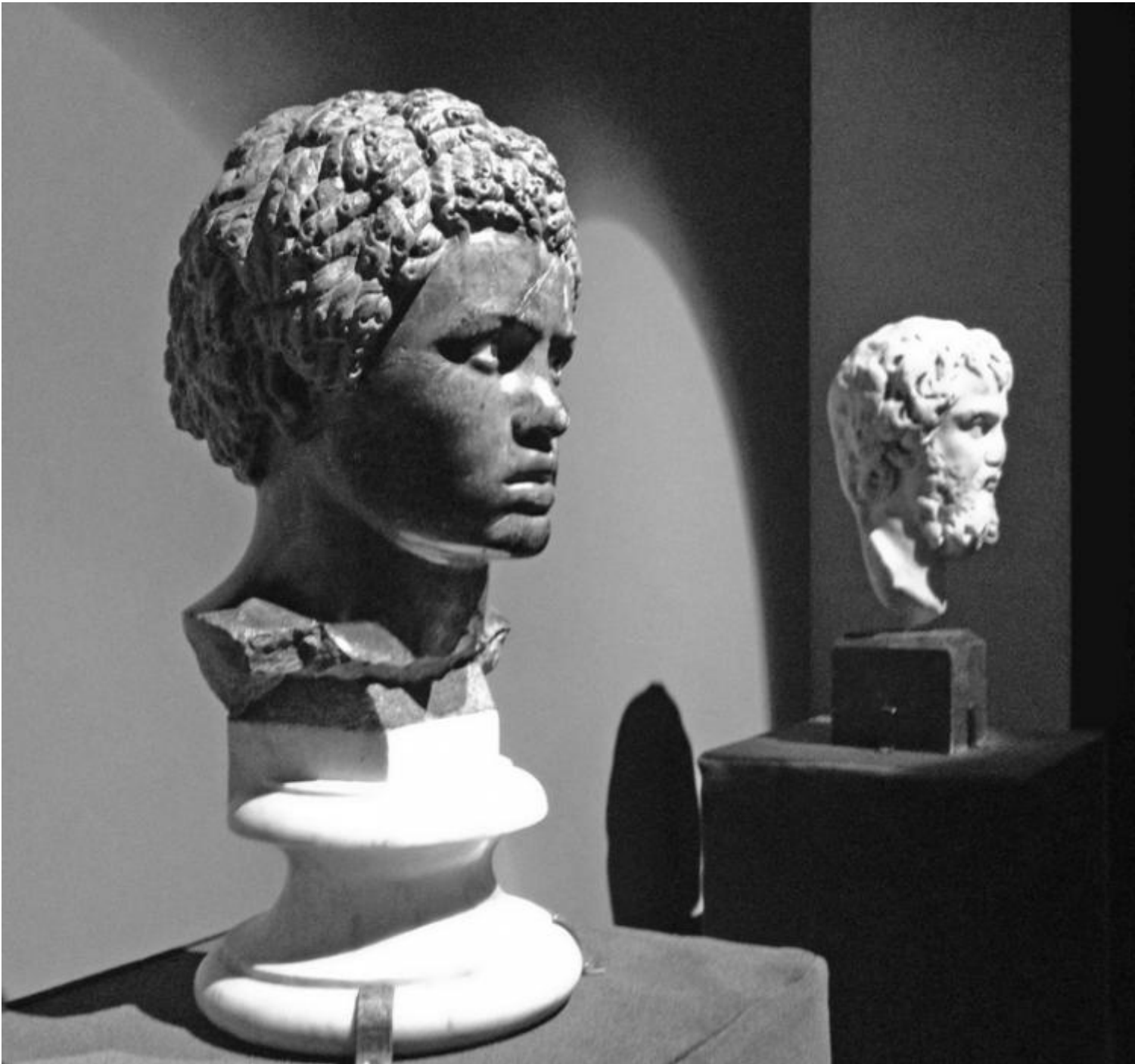
Testa di giovane africano. Marmo grigio morato e calcare, prima met  del II secolo d.C. Museo delle Terme di Diocleziano.

L'archeologia dimostra quindi che non esistono culture "pure", anche se a una presunta "purezza" si sono riferiti alcuni regimi appropriandosi del passato come strumento di legittimazione del potere, dalle epoche pi  antiche a quella contemporanea. La copia romana del Discobolo di Mirone, che Hitler acquist  dalla famiglia Lancellotti per la cifra di 5 milioni di Lire, rappresentava per il dittatore una classicit  di maniera adattata all'ideologia razzista, un modello della razza superiore, alla quale s'ispir  la regista Leni Riefenstahl per la realizzazione del film Olympia nel 1938.