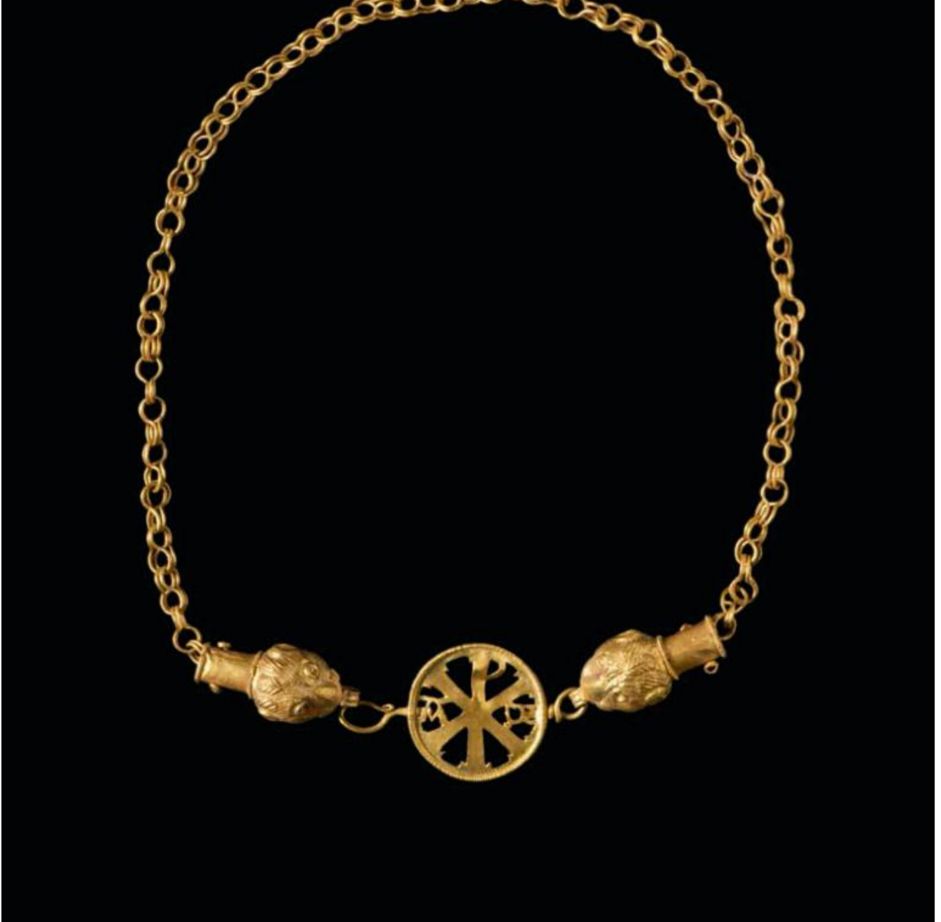
Collana in oro con chrismòn, fine IV- metà V secolo d.C. Museo Nazionale Romano - Palazzo Massimo.

Nella seconda sezione l'archeologia è presentata anche come strumento per comprendere la varietà di interazioni e scambi che determina un'identità sociale e culturale. A questo riguardo possiamo ammirare in mostra una collana d'oro (fine del IV - metà del V secolo d.C.) con terminazioni cilindriche a protomi