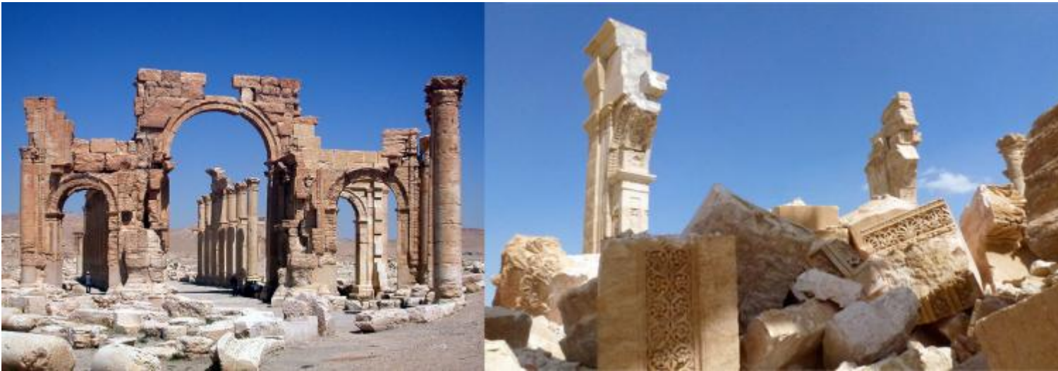
Arco trionfale a Palmira prima e dopo la distruzione avvenuta nel 2016.

Tra le sue stravaganti imprese, Caligola cavalcò anche su un ponte di barche riempite di terra in risposta a chi aveva osato affermare (facendo riferimento al fatto che un cavallo non può galoppare sulle acque) che sarebbe divenuto imperatore solo quando avesse cavalcato sul tratto di mare tra Baia e Pozzuoli. Anche in questo caso, Caligola, o chi per lui, ha dovuto immaginare e inventare la forma di un rapporto tra cose che normalmente non hanno tra loro alcuna relazione, sfidando l'impossibile.