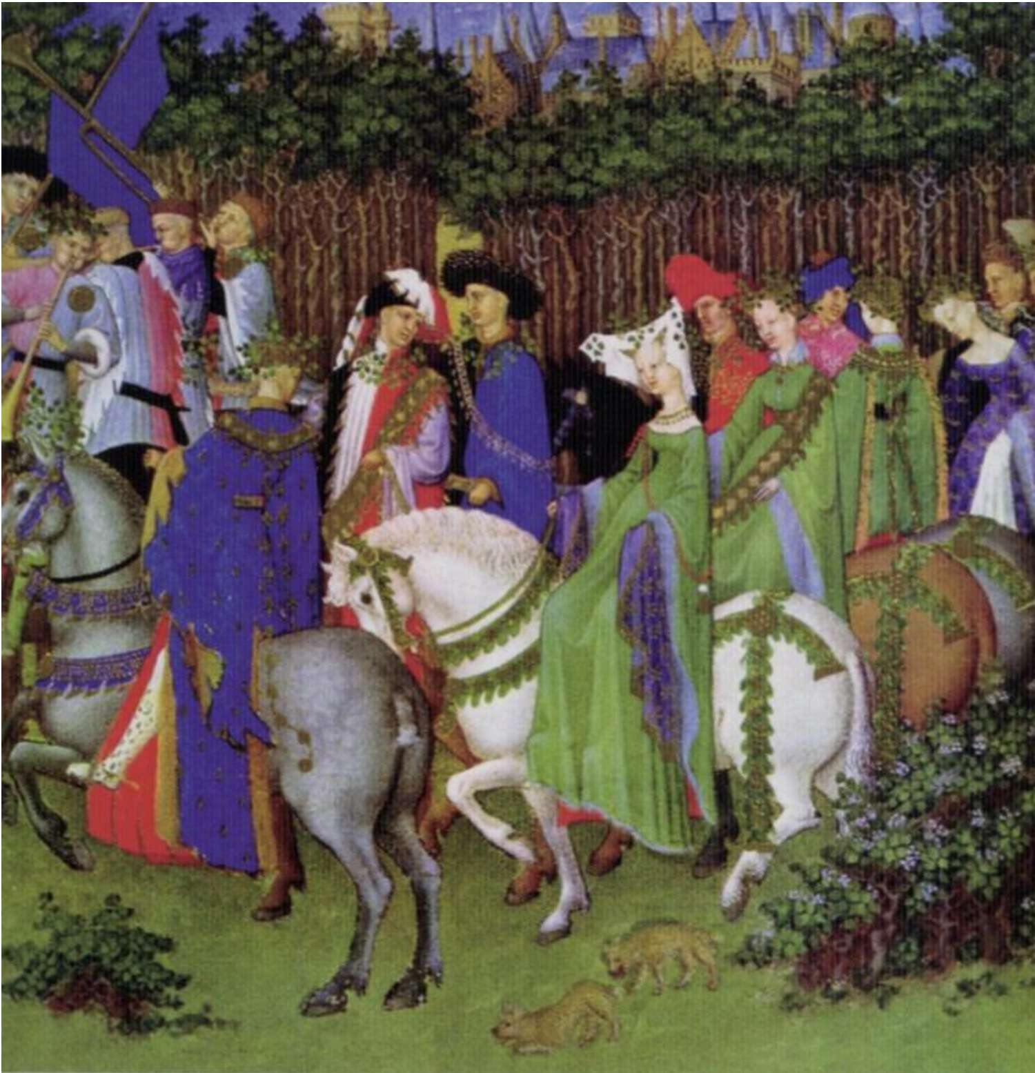
Miniatura delle TrÃs Riches Heures del duca Jean de Berry, mese di maggio, Chantilly (Parigi, 1414-1416 ca).

L'orizzonte simbolico Ã" chiarissimo: la sfumatura di verde proposta Ã" precisamente quella delle prime foglie di primavera, allude alla rinascita, al risveglio e al rivitalizzarsi della natura e si associa alla freschezza dell'acqua e dell'aria pura, vuole ricreare in un mondo, impotente di fronte dalla disperazione dei migranti e minacciato dal terrorismo e dalla guerra, un angolo di serenitÃ . La proposta viene da una grande azienda, Pantone Inc., fondata nel 1962 a Carlstadt nel New Jersey e ora parte del colosso americano X-Rite, che domina nel settore grafico, industriale e chimico. Nel catalogo dei prodotti troviamo le mazzette per grafici e pittori, ma anche oggetti comuni, come cartoline tazze taccuini e accessori, applicazioni per il cellulare e,