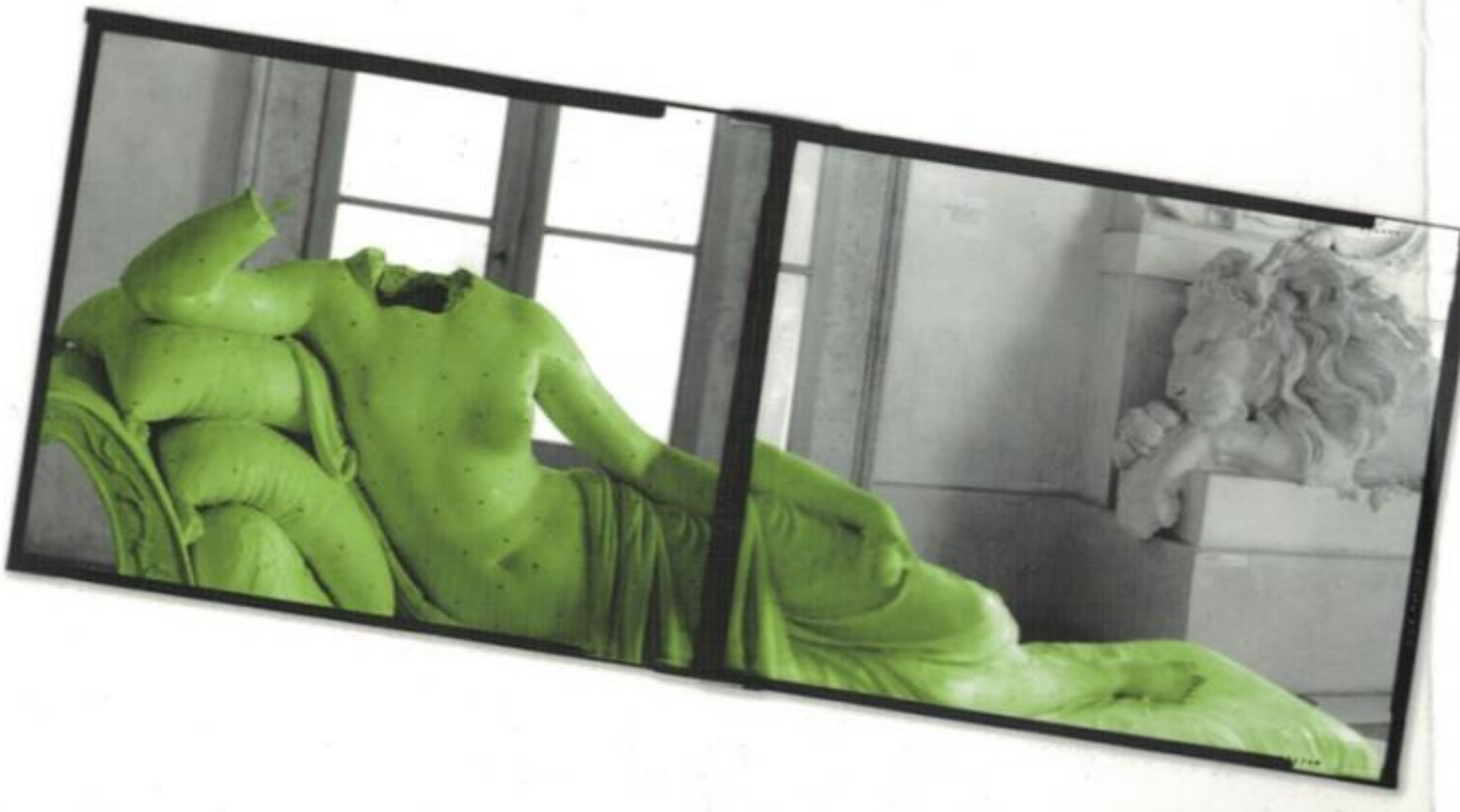
Gianantonio Battistella, foto di Antonio Canova, Paolina Borghese come Venere vincitrice 2013.

Pantone quindi ci propone il greenery e ci assicura la possibilità di abbinarlo con diverse palette di colori; addirittura un articoletto nel sito della ditta ci assicura che il verde rallenta gli ormoni dello stress. In effetti il verde si è affermato nella nostra società come colore della natura, dell'ecologia, della salute e della freschezza, ma anche della gioventù e della libertà. Anche la sua storia ne conferma la positività, almeno: un filone della sua storia.