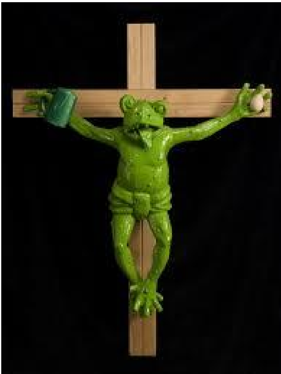
Martin Klippenberger, Rana crocifissa, Museion, Bolzano 1988.