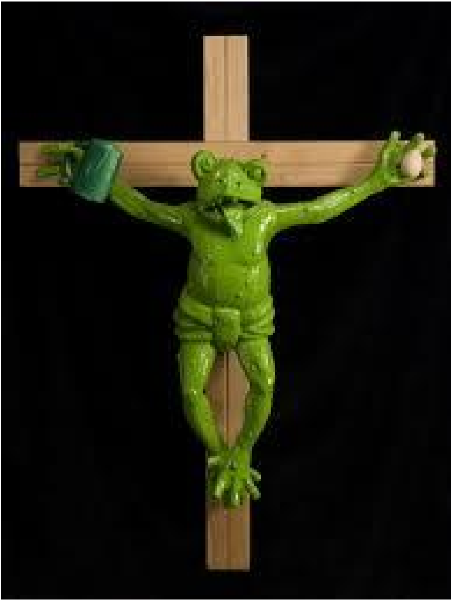
Martin Klippenberger, Rana crocifissa, Museion, Bolzano 1988.

Sarà allora di buon augurio la proposta del verde Pantone 15-0343? Oppure dietro alle immagini laccate di un piccolo hortus conclusus sul terrazzo di una città moderna, accanto a un grattacielo grigio-azzurro, vediamo spuntare alcune immagini inquietanti dell'arte contemporanea? Solo due esempi: il Green Knight in Lego , realizzato dall'artista statunitense Nathan Sawaya con i famosi mattoncini e la Rana crocifissa di Martin Kippenberger, esposta postuma a Bolzano, nel Museion, e subito ritirata sotto l'accusa di blasfemia e che forse ha provocato l'allontanamento da Bolzano della direttrice, Corinne Diserens.