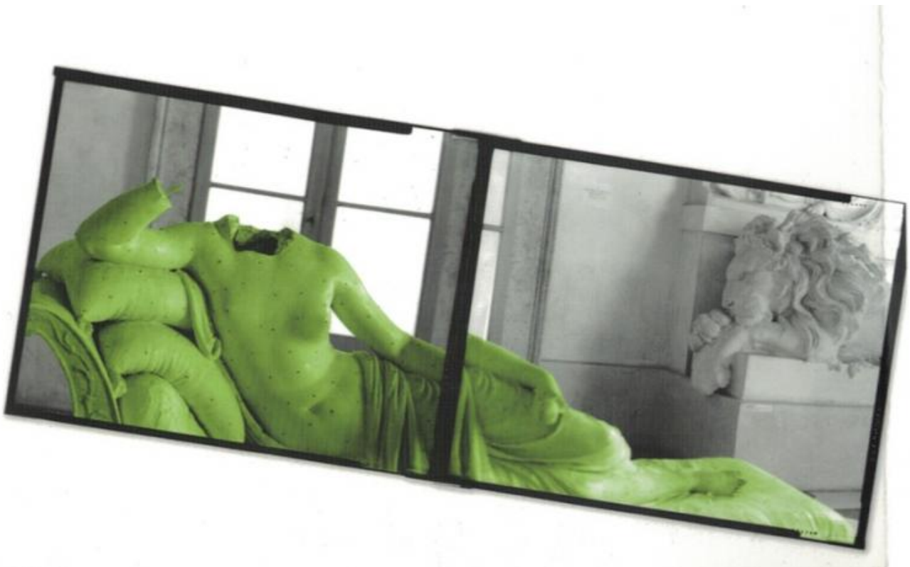
Gianantonio Battistella, foto di Antonio Canova, Paolina Borghese come Venere vincitrice 2013.

Pantone quindi ci propone il greenery e ci assicura la possibilità di abbinarlo con diverse palette di colori; addirittura un articoletto nel sito della ditta ci assicura che il verde rallenta gli ormoni dello stress. In effetti il verde si è affermato nella nostra società come colore della natura, dell'ecologia, della salute e della freschezza, ma anche della gioventù e della libertà. Anche la sua storia ne conferma la positività, almeno: un filone della sua storia.