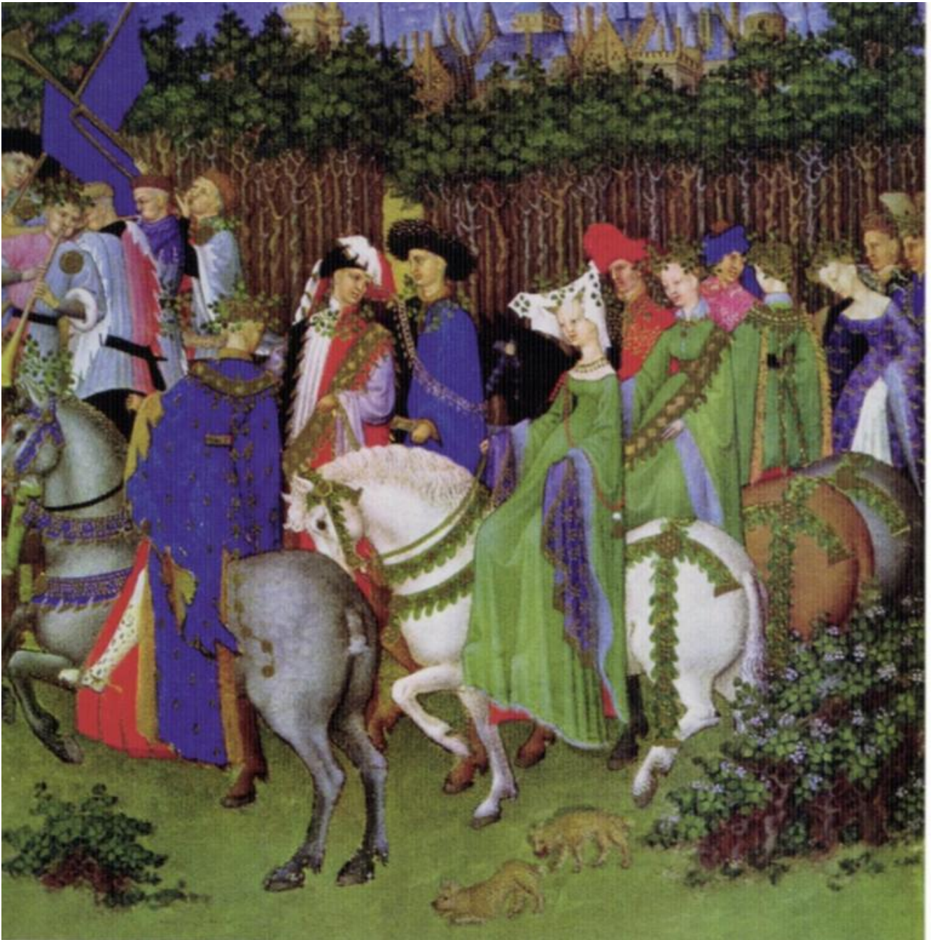
Miniatura delle Très Riches Heures del duca Jean de Berry, mese di maggio, Chantilly (Parigi, 1414-1416 ca).

L'orizzonte simbolico è chiarissimo: la sfumatura di verde proposta è precisamente quella delle prime foglie di primavera, allude alla rinascita, al risveglio e al rivitalizzarsi della natura e si associa alla freschezza dell'acqua e dell'aria pura, vuole ricreare in un mondo, impotente di fronte dalla disperazione dei migranti e minacciato dal terrorismo e dalla guerra, un angolo di serenità. La proposta viene da una grande azienda, Pantone Inc., fondata nel 1962 a Carlstadt nel New Jersey e ora parte del colosso americano X-Rite, che domina nel settore grafico, industriale e chimico. Nel catalogo dei prodotti troviamo le mazzette per