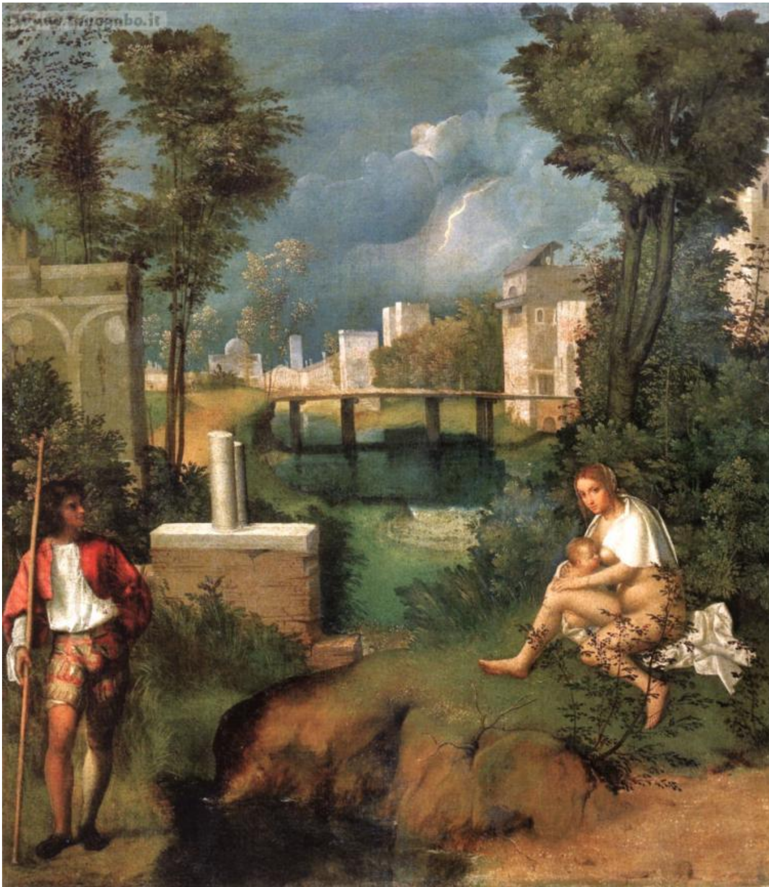
Giorgione, La tempesta.