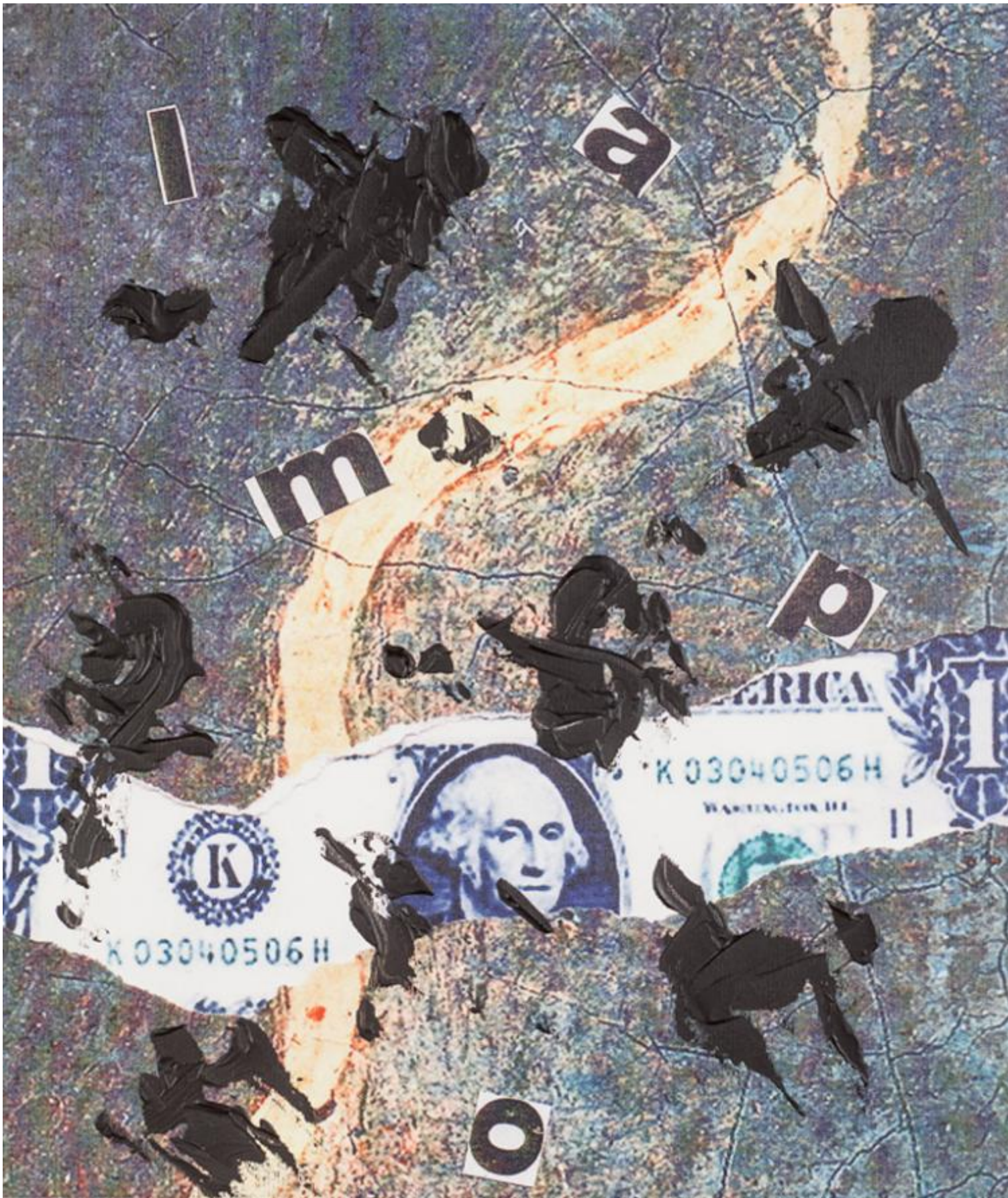
Nanni Balestrini, La tempesta perfetta, Implosioni.