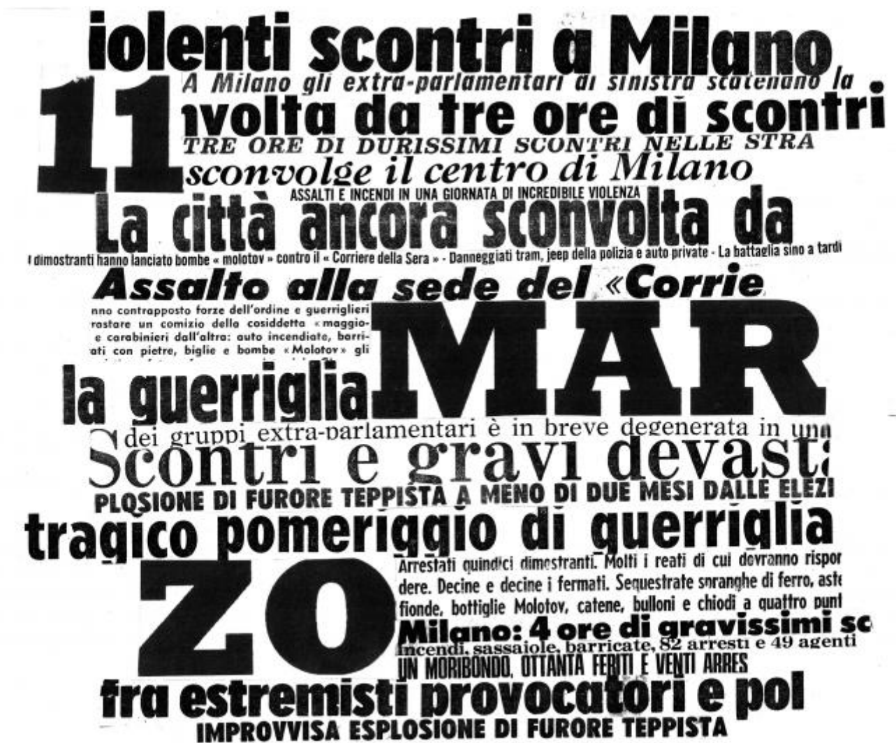
Nanni Balestrini, Vogliamo tutto , 11 marzo.