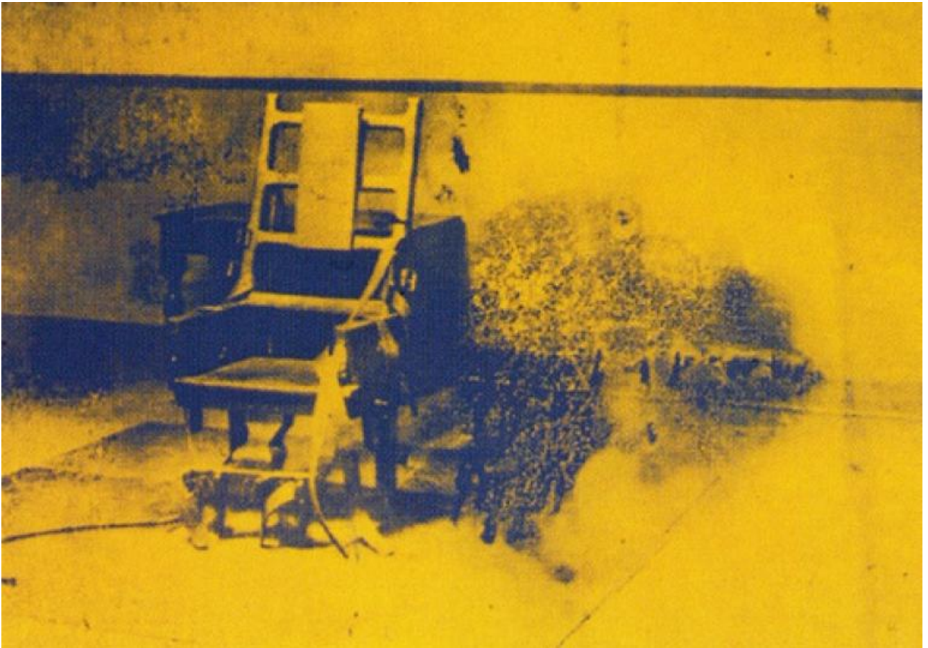
Andy Warhol, Electric Chair