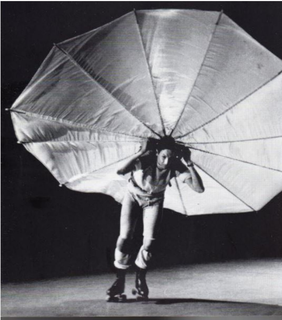
Robert Rauschenberg, Pelican 1963