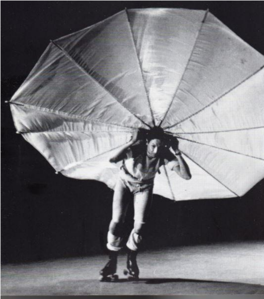
Robert Rauschenberg, Pelican 1963