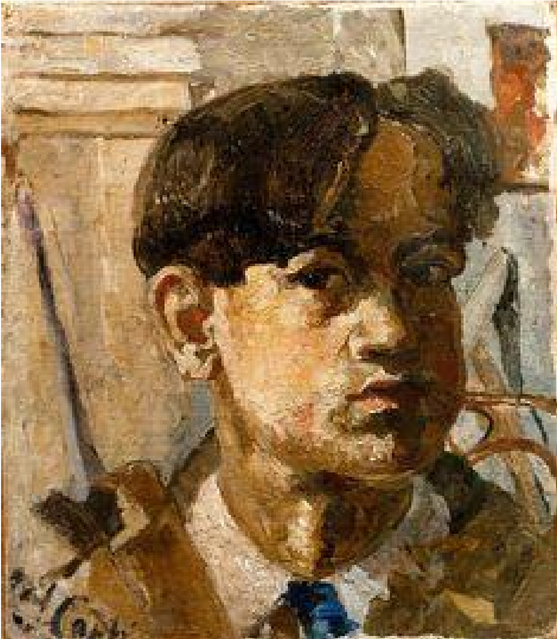
Primo Conti, Autoritratto

AC: Secondo te perché non si è mai affermato come poteva?