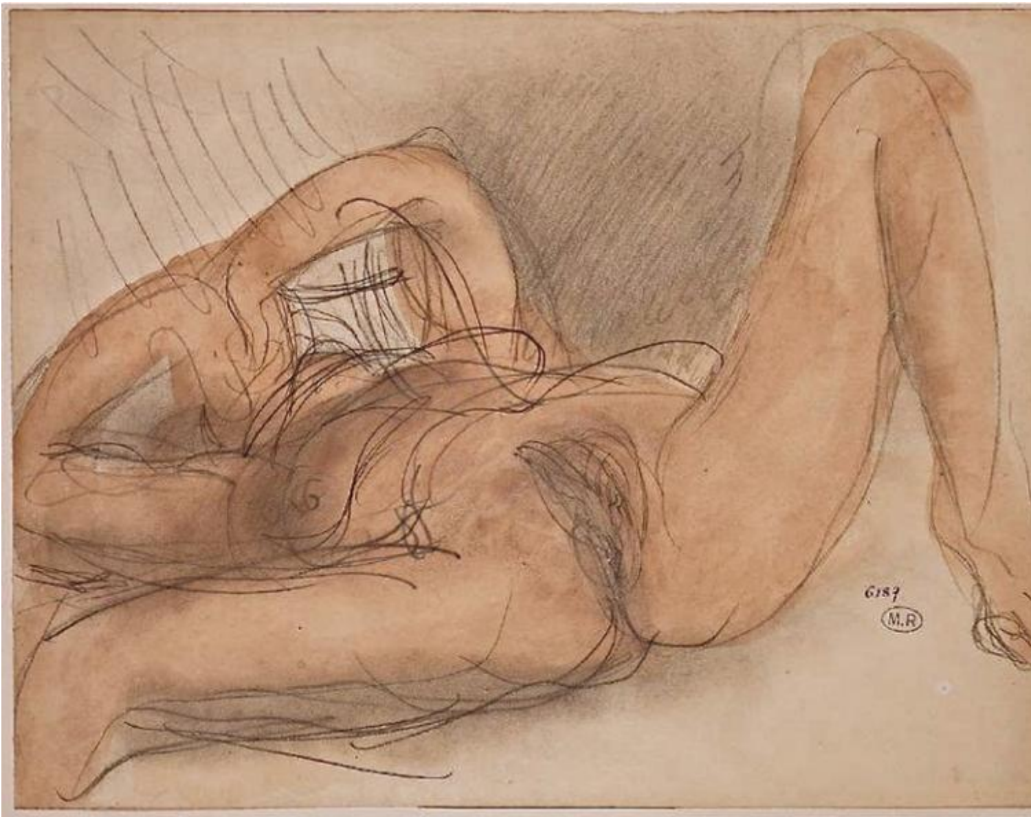
Auguste Rodin, Femme neu sue le dos

AC: ... sui manifesti si scriveva Weltanschauung !