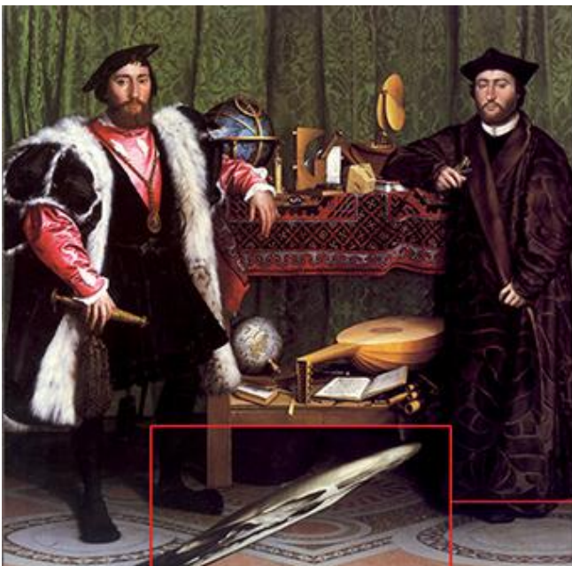
Hans Holbein, Gli ambasciatori