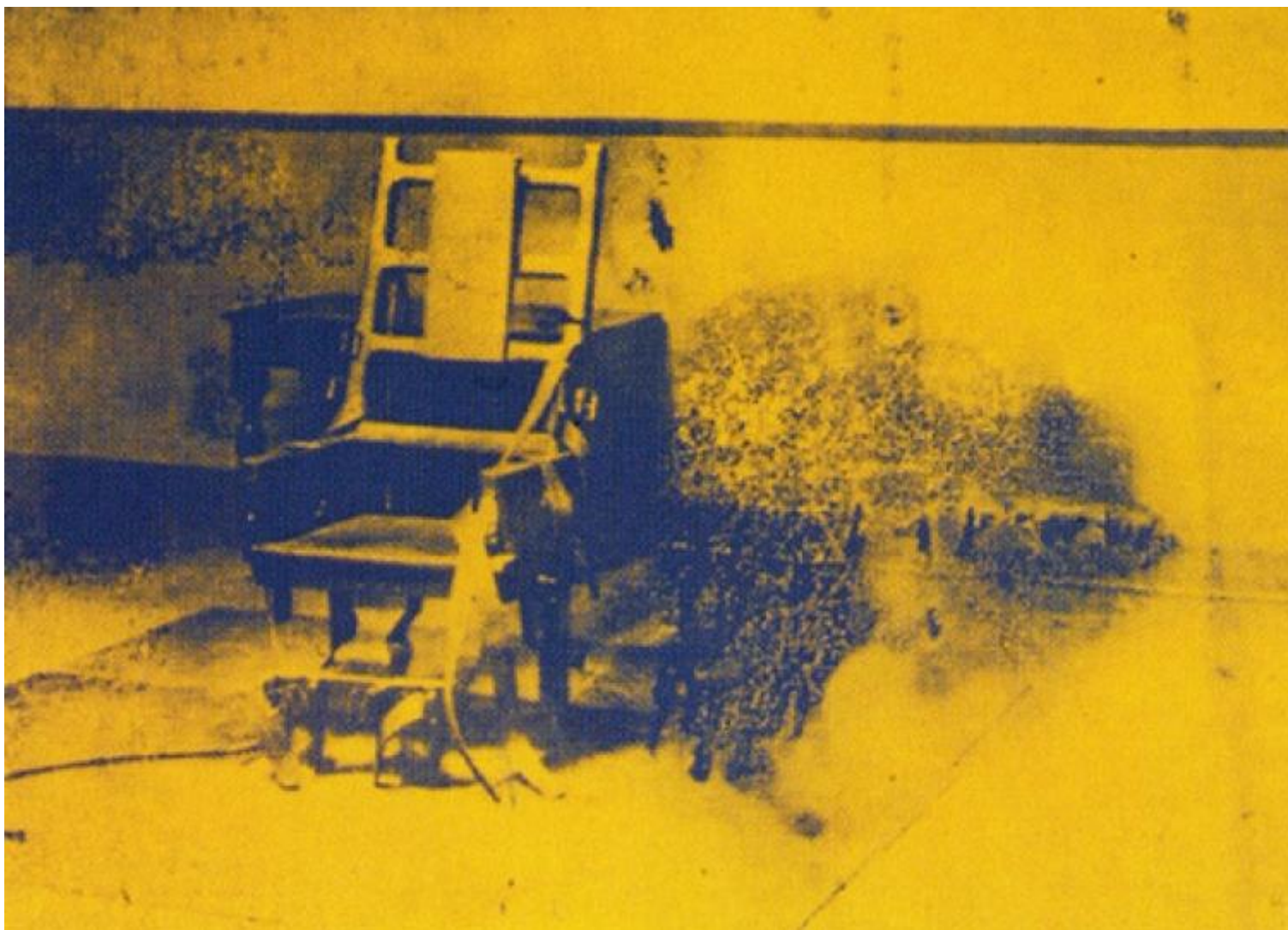
Andy Warhol, Electric Chair