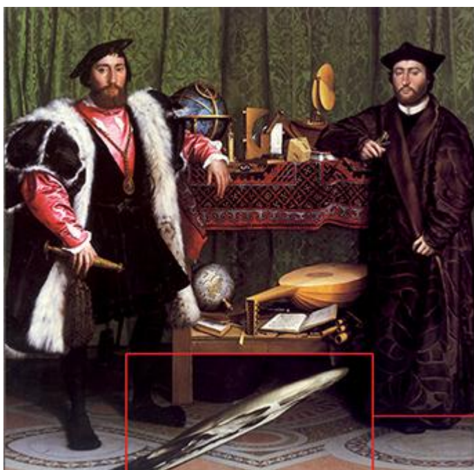
Hans Holbein, Gli ambasciatori