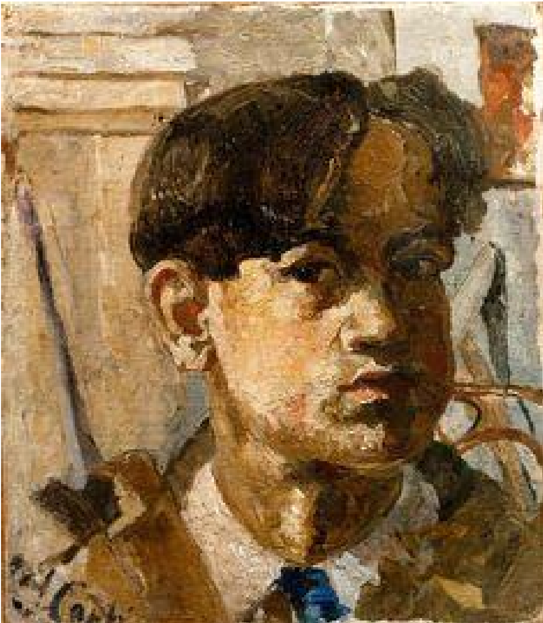
Primo Conti, Autoritratto

AB: No. Conti come pittore era partito splendidamente. A sedici anni sembrava Matisse. Il mio libro Narciso infranto finisce con gli autoritratti da giovani, uno di Picasso e l'altro di Conti, tutti e due a sedici anni. Ma a quell'altezza il più bravo era Conti! Lui ha avuto molta importanza, mi ha invitato nella sua villetta rinascimentale a Fiesole, dove ora c'è il museo della sua Fondazione e ci sono dei quadri stupendi. Per la prima volta entravo in una casa bella. Fu un momento d'illuminazione. Mi colpiva molto il rapporto tra i pieni e i vuoti... quelle stanze arredate con mobili antichi e di valore ma pochi, scelti.