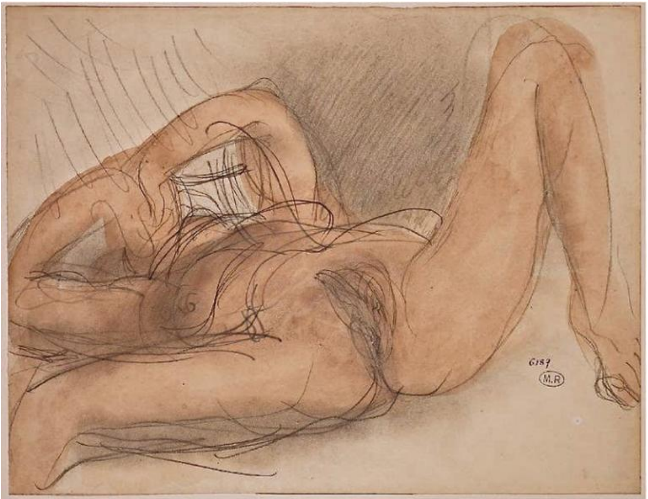
Auguste Rodin, Femme nue sur le dos

AC: ... sui manifesti si scriveva Weltanschauung !