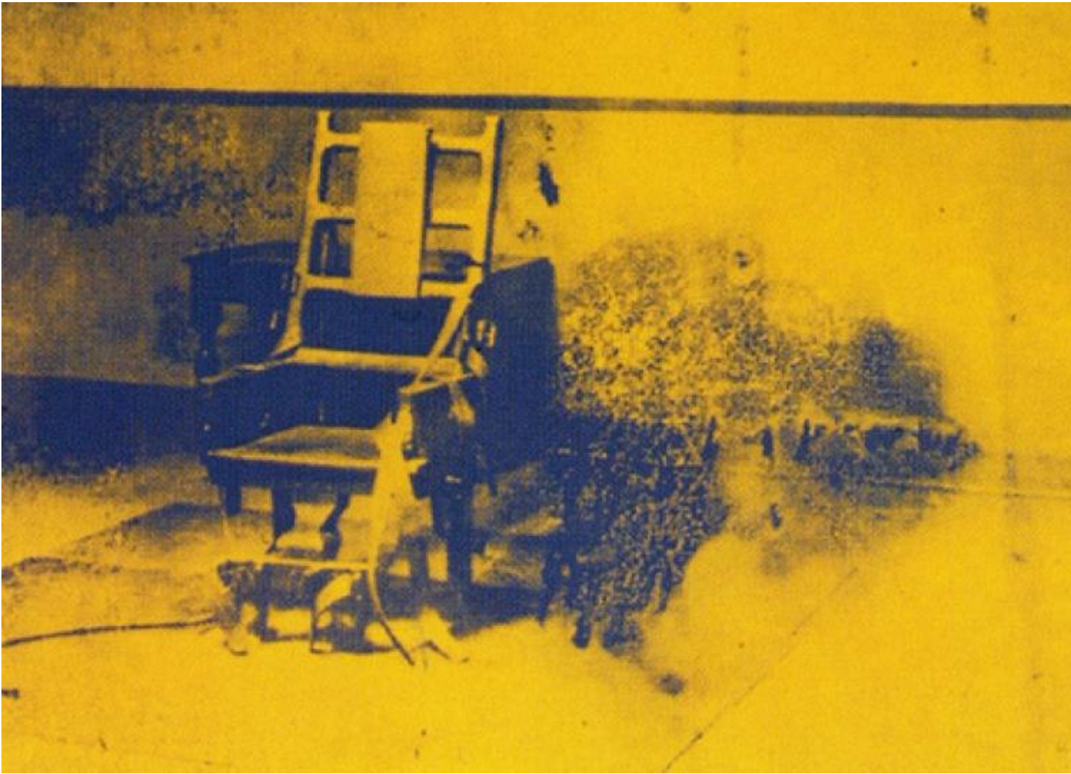
Andy Warhol, Electric Chair