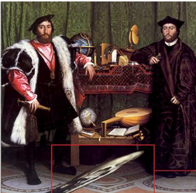
Hans Holbein, Gli ambasciatori