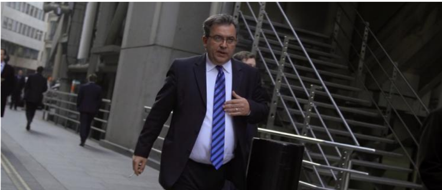
Thomas Vroegev, So help me God

Passare dal potere al delirio di onnipotenza Ã¨ passo breve: So Help me God (2014) del giovane Thomas Vroegev va sondare nel profondo l'animo di finanzieri e uomini d'affari, in un'epoca di crisi e instabilitÃ . Il lavoro Ã¨ articolato sull'alternanza di tre narrazioni: l'audizione presso il senato americano del CEO di Goldman Sachs, in seguito allo scandalo del 2007 che ha condotto alla bancarotta e alla depressione l'intero sistema economico internazionale, il racconto di un analista che ripercorre mentalmente le sedute con un trader finanziario, suo paziente, e la descrizione poetica per analogia visiva , dei sentimenti di questi uomini, attraverso immagini della City silenziosa e della sua metropolitana deserta. Solo in apparenza impenetrabili e composti, hanno le sorti del mondo tra le loro mani; dovrebbero essere salde, invece sembrano tremare: l'artista li ritrae fragili, isolati e desolati, tormentati come tutti noi dalla paura originaria della perdita , della mancanza di controllo, che produce fantasmi e apre una ferita insanabile, un contagioso senso di impotenza e inadeguatezza.