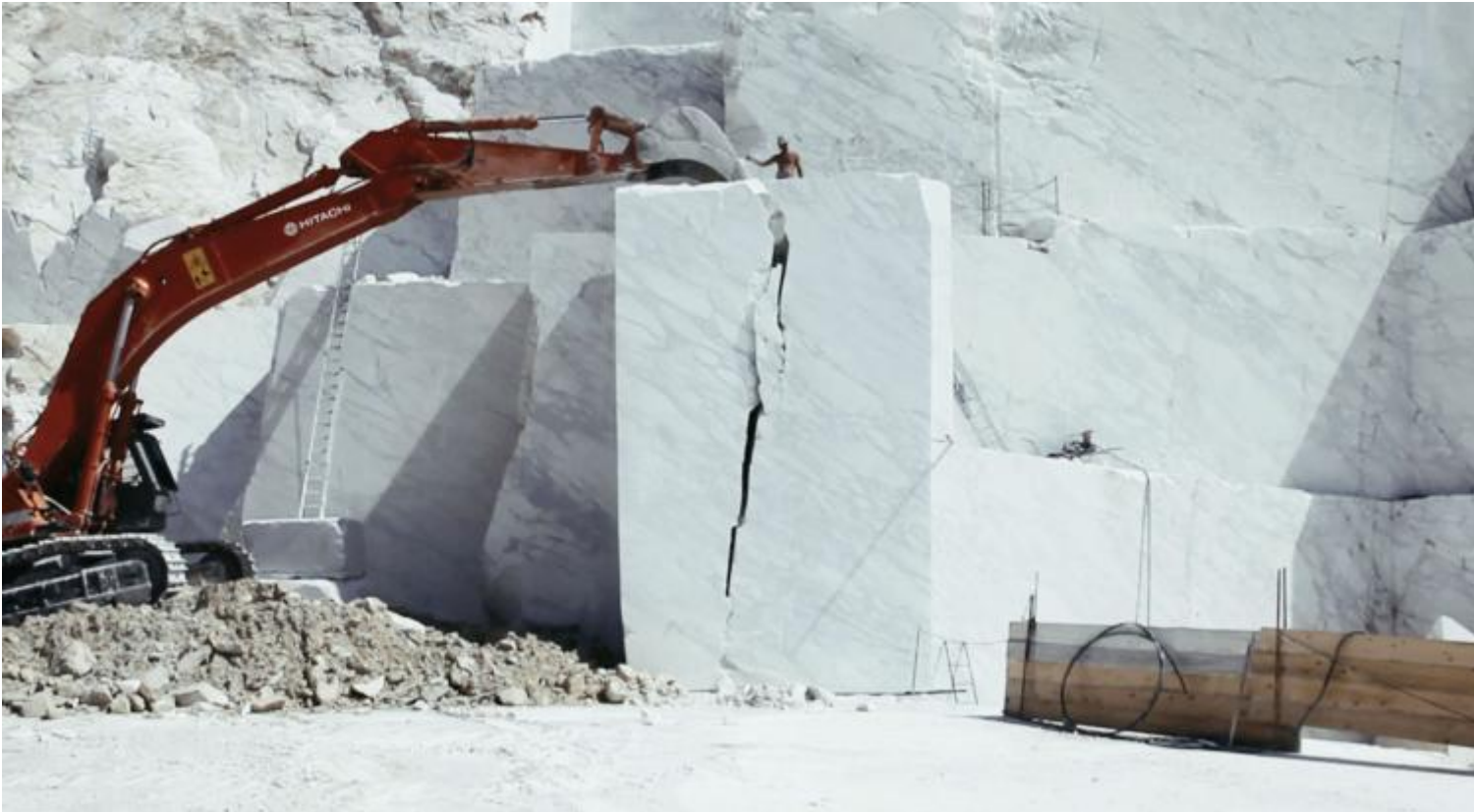
Yuri Ancarani, Il capo

La videoarte, direbbe Lacan, Ã¨ arte dell' aphanisis . Ha a che fare con l'evanescenza e spesso mostra l'invisibile, l'inaudibile: proprio nell'interstizio tra presenza e assenza si situano i tre di video di Yuri Ancarani, che indagano altrettanti lavori, tanto complessi quanto discreti, piÃ¹ probabilmente misconosciuti. I gesti minuziosi de Il Capo (2010) sono i segni di un linguaggio silente, il codice segreto attraverso cui un uomo, con la ferma grazia e precisione di un maestro d'orchestra, conduce altri uomini alla guida di macchine pesanti, intenti a scavare la montagna nelle preziose cavi marmoree delle Alpi Apuane ?? vicino al Monte Altissimo , dove Michelangelo trascorse lunghi mesi a cercare la pietra 'piÃ¹ pura e perfetta' per le sue sculture