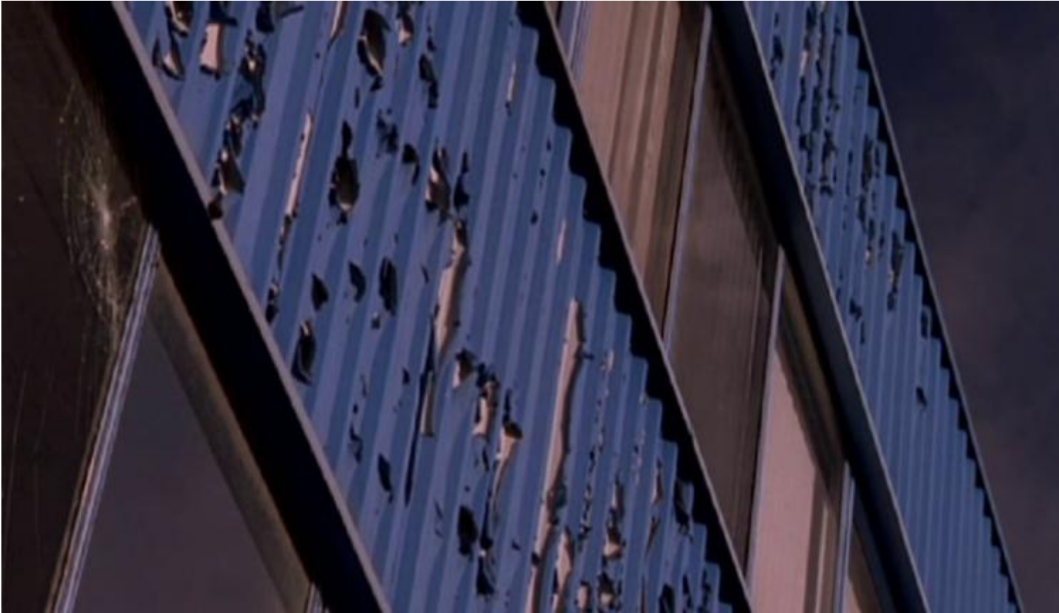
Willie Doherty, Empty

Ad un primo sguardo, la telecamera apparentemente fissa della videoproiezione 16:9 Empty (2006) di Willie Doherty che riprende dall'alba al tramonto un palazzo abbandonato di Belfast, fa eco poetico e stilistico a quel sostare ostinato davanti alle Scogliere sul mare di Etretat o alle Ninfee del proprio giardino a Giverny , di un infaticabile pittore impressionista, soltanto per catturare la mutevolezza dell'atmosfera, della percezione dei colori e del sentimento del tempo. Si tratta, invece, di una serie innumerevole di fotografie scattate dall'artista tutt'intorno all'edificio, poi montate come un film. Anche qui, i passaggi lentamente modulati dall'ombra alla luce determinano minimi mutamenti, impercettibili come la piega temporale di una ruga sul viso, e documentano una metamorfosi delle rovine che cade l'intonaco, e scopre lo scheletro arrugginito della struttura che evocano con nostalgia il passato di spazi un tempo vitali.