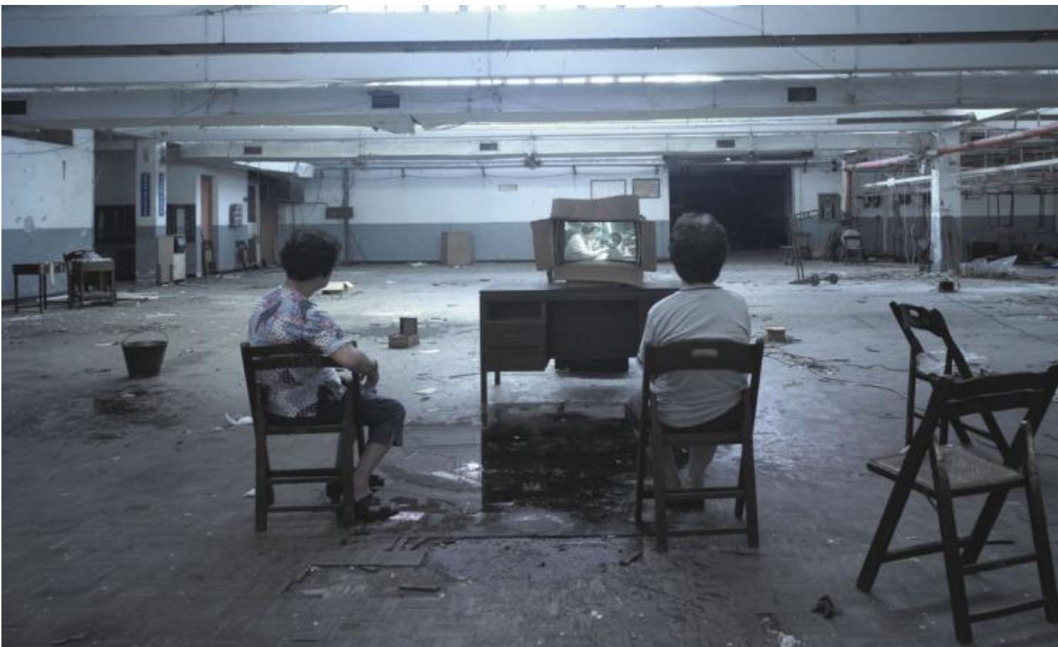
Chien Chen-jen, Factory

PiÅ¹ critico, sul tema delle fabbriche, era giÅ² intervenuto nel 2003, Chen Chieh-jen con Factory . Questo video militante , sui toni del grigio-blu, senza voce nÃ© sonoro, in realtÃ Å² un vero e proprio re-enactement teatrale (pratica oggi assai diffusa sulla scena post-drammatica). Fotografie d'archivio si alternano alle riprese. Funziona qui da incisivo controcanto; se in alcuni casi le macchine alleggeriscono il lavoro dell'uomo, altrove lo sottraggono completamente. Assistiamo alla messa in scena del crollo dell'industria tessile a Taiwan, fiorita negli anni Sessanta sulla scia delle politiche post Guerra Fredda e favorita dai costi irrisori della manodopera, pian piano delocalizzata, sulla scia di una globalizzazione pressante, fino alla chiusura definitiva delle fabbriche che ha inesorabilmente condotto alla disoccupazione di larga parte della popolazione, e ad una condizione di povertÃ difficilmente sanabile.