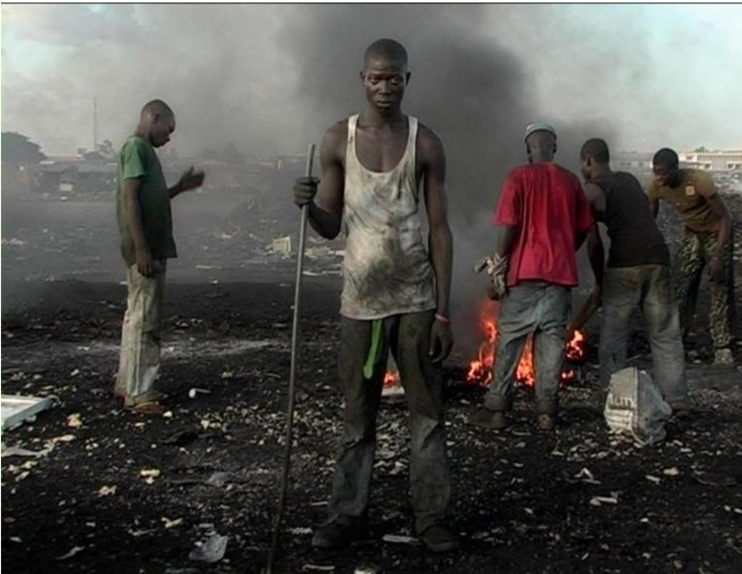
Pieter Hugo, Permanent error

Le sostanze liberate in questo processo di recupero sono altamente tossiche, inquinano l'organismo, l'aria che si respira, la poca acqua che non si può bere e la terra che mai tornerà fertile. Madre Africa. Per fortuna non ci riguarda. Così vogliamo credere.