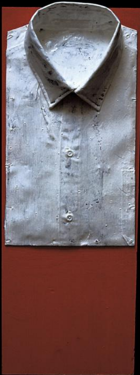
Gianfranco Baruchello, Exercices de style , 1962, Fondazione Baruchello, Roma.

La bellissima mostra Greenhouse (a Milano, negli spazi di Piazzetta Belgioioso della Galleria Massimo De Carlo, fino al 18 marzo), con dodici opere per lo più di grandi proporzioni dal '68 al '96, prende il nome da un lavoro del '77 e illustra nelle sue sorprendenti e polimorfe potenzialità , appunto, questo aspetto architettonico dell'ispirazione di Baruchello. I due lavori più estesi, i due grandi tritici intitolati rispettivamente Nella stalla della Sfinge (del 1980-1981) e Acrobata clandestino (1988), mostrano benissimo il principio "cartografico", o più precisamente "planimetrico", che domina il suo immaginario.