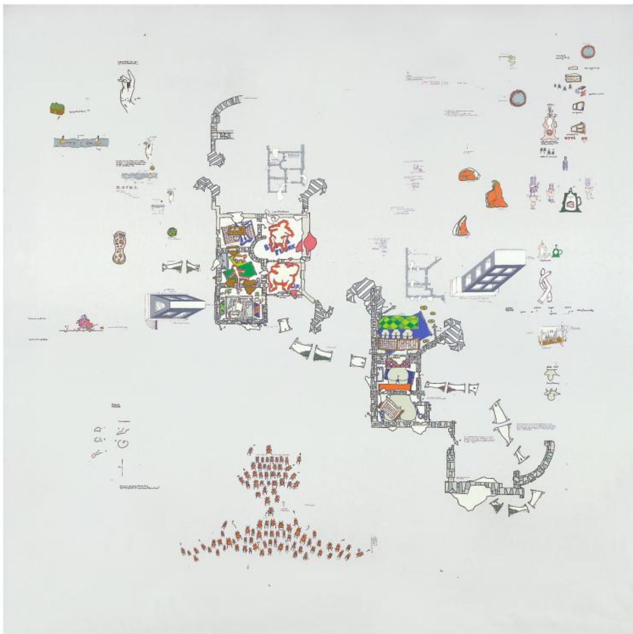
Gianfranco Baruchello, Nella stalla della sfinge , 1980, courtesy Massimo De Carlo.

Moltissimi dei suoi lavori, infatti, si possono leggere come piante di ambienti più o meno vasti, in quanto tali accompagnati da minuziose legende - glosse, postille, le amatissime liste (ed è sintomatico che quelli bidimensionali siano destinati alla verticalità della parete, mentre i rari esempi aggettanti - i bellissimi Rilievi ideali del '65, visti alla fondamentale mostra curata da Bonito Oliva e Subrizi nel 2011 al Palazzo delle Esposizioni di Roma, Certe idee - vengano esposti sul piano orizzontale). Greenhouse significa «serra» (i lavori che recano questo titolo sono