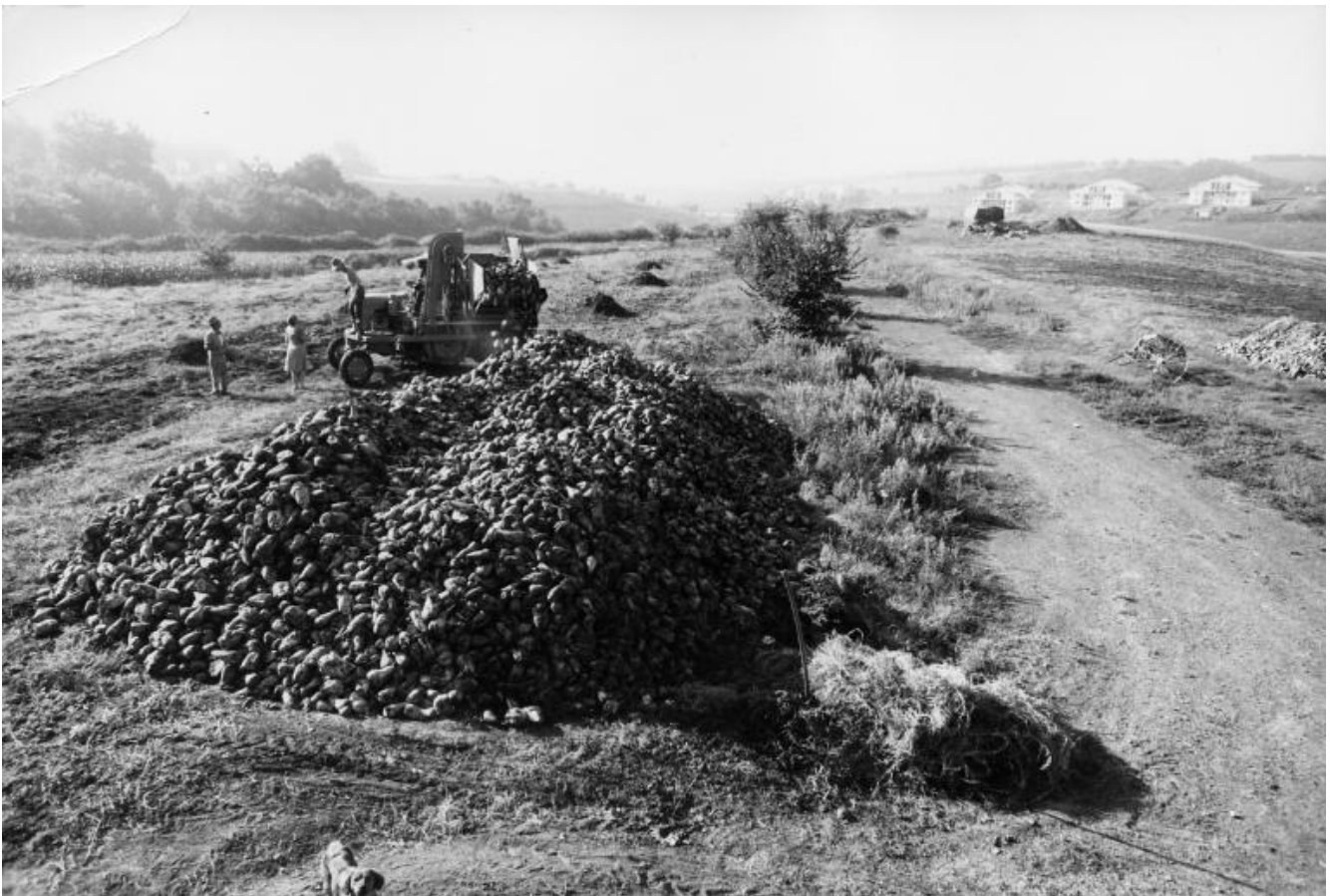
Raccolto delle barbabietole agricola cornelia, s.p.a. 1975, documentazione fotografica della Fondazione Baruchello, Roma.

ne seguiva uno più indiretto o meglio, forse, più diretto ancora – in nome del valore d'uso dell'arte (o, tout court , della propria attività). Si chiedeva polemico, allora, Baruchello: «occupare terreni incolti destinati alla speculazione edilizia, seminarci 5 (cinque) chilogrammi di barbabietola da zucchero e raccoglierne dopo qualche mese 84340 (ottantaquattromilatrecentoquaranta) chilogrammi, pari a tre autotreni con rimorchio, è più o meno artistico (perché “utile anziché inutile”) che praticare nello stesso periodo puri movimenti di terra tipo Land Art atti a modificare esteticamente le superfici?». A posteriori dirà a Obrist, invece, che si era trattato di «un'operazione molto provocatoria», in quanto tale assimilabile alla «società finta» fondata qualche anno prima, l' Artiflex (che, per esempio, metteva all'asta banconote) – da leggere a sua volta, insomma, nell'ambito della lezione duchampiana (a Obrist dirà Baruchello: «Duchamp odiava la natura», ma il suo discorso era «Art is what you call» e dunque «è stato importante per avermi dato il coraggio di fare quello che volevo fare»; nell'85 aveva così sintetizzato la sua lezione: Duchamp è «colui che dà l'autorizzazione»).