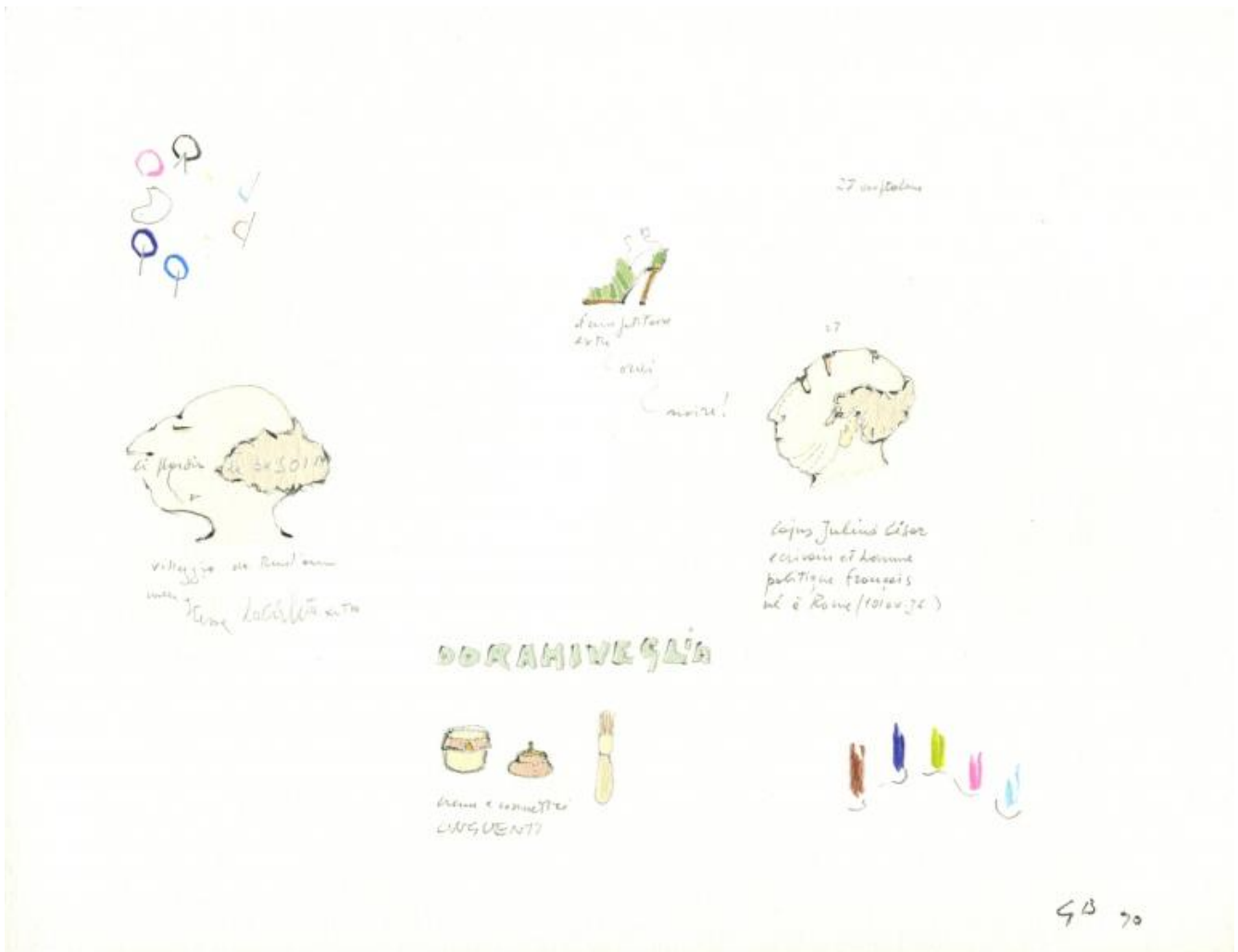
Gianfranco Baruchello, Villaggio da trent'anni nella stessa località detta dormiveglia in store , 1989, da Sogni di Humboldt books , 2017.

O forse quelle spoglie che restano a terra, alla fine dell'agone con Baruchello, appartengono alla bestia che, ahinoi, conosciamo meglio di ogni altra. Alla fine del testo di Mari lampeggia uno dei dialoghetti metafisici che punteggiano i suoi racconti più belli (come quelli di Tu, sanguinosa infanzia ). Il sognatore cerca di resistere al sogno: «Verrà comunque il mattino». «Anch'esso farà parte di me». «E tutti i risvegli della mia vita?» «È questa, la tua vita». «E quando morirò?» «Allora incomincerai a sognarmi davvero».