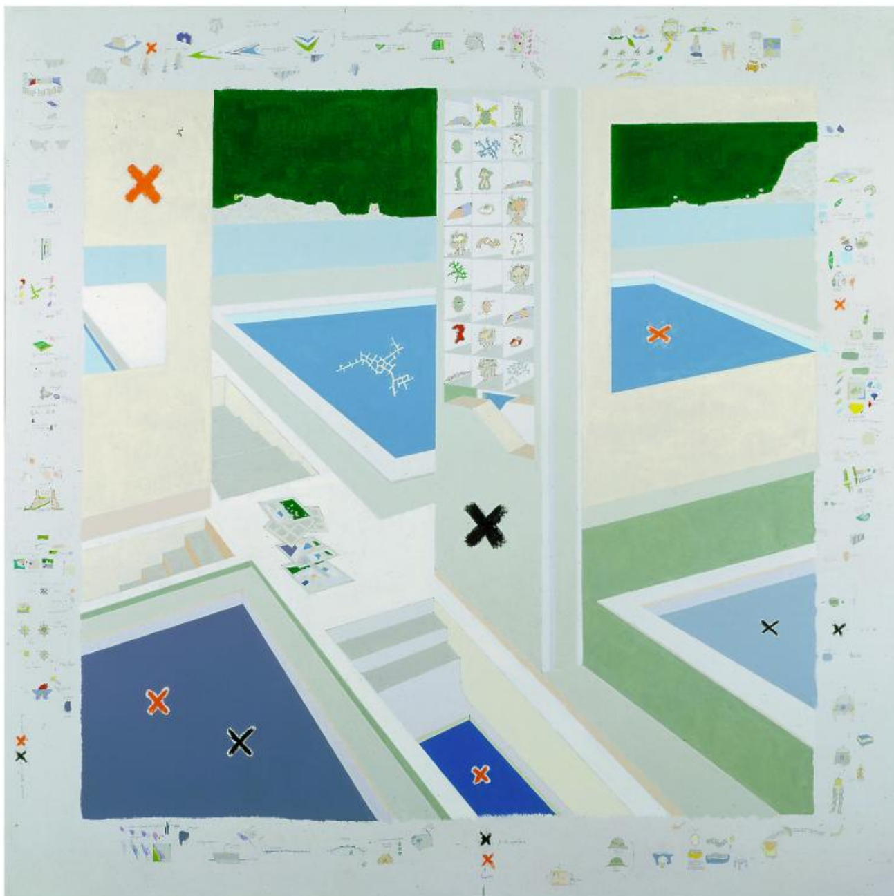
Gianfranco Baruchello, Acrobata clandestino , 1988.

Nel 1973 infatti Baruchello, con la compagna Agnese, decide di trasferirsi fuori città, a nord di Roma, in una grande casa in campagna al km 6,5 di via di Santa Cornelia. Qui fonda l' Agricola Cornelia S.p.A. , «con lo scopo sociale di coltivare la terra». E quello fa, Baruchello, per otto anni. Coltiva patate e barbabietole da zucchero, produce miele. I motivi di una scelta simile sono diversi o almeno diversi, di volta in volta, sono quelli che adduce Baruchello. Si era senz'altro per lui concluso un ciclo, esistenziale prima che artistico; all'impegno politico diretto