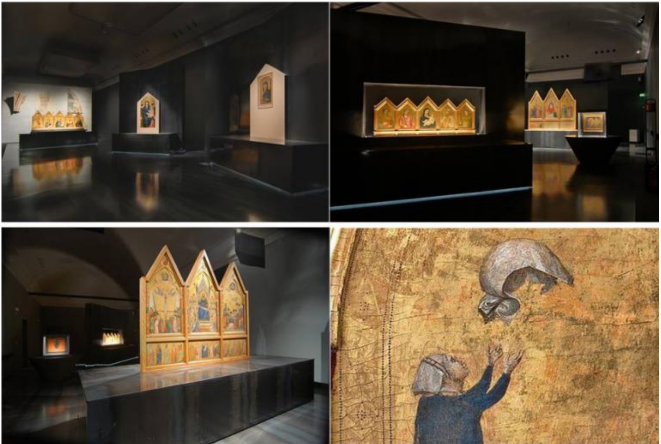
Milano, Palazzo Reale, 2 settembre 2015 / 10 gennaio 2016, mostra: "Giotto e l'Italia", alcuni scorci dell'allestimento belliniano. (ph. Raffaele Cipolletta); a destra dettaglio del velo di Plautilla, dal verso del Polittico Stefaneschi.

Su una parete sono poi riprodotte, come in una sorta di wunderkammer, le mani del maestro che reggono oggetti fondamentali per la sua poetica, dal quadro "L'architetto" di Mario Sironi a una giacca di Issey Miyake; da alcuni oggetti di Ettore Sottsass alla raccolta completa delle lettere di Mozart; da un piatto di Lucio Fontana al portaghiaccio di Gio Ponti; dal Compasso d'Oro a una matita con un foglio di carta, bianco, e molto altro ancora.