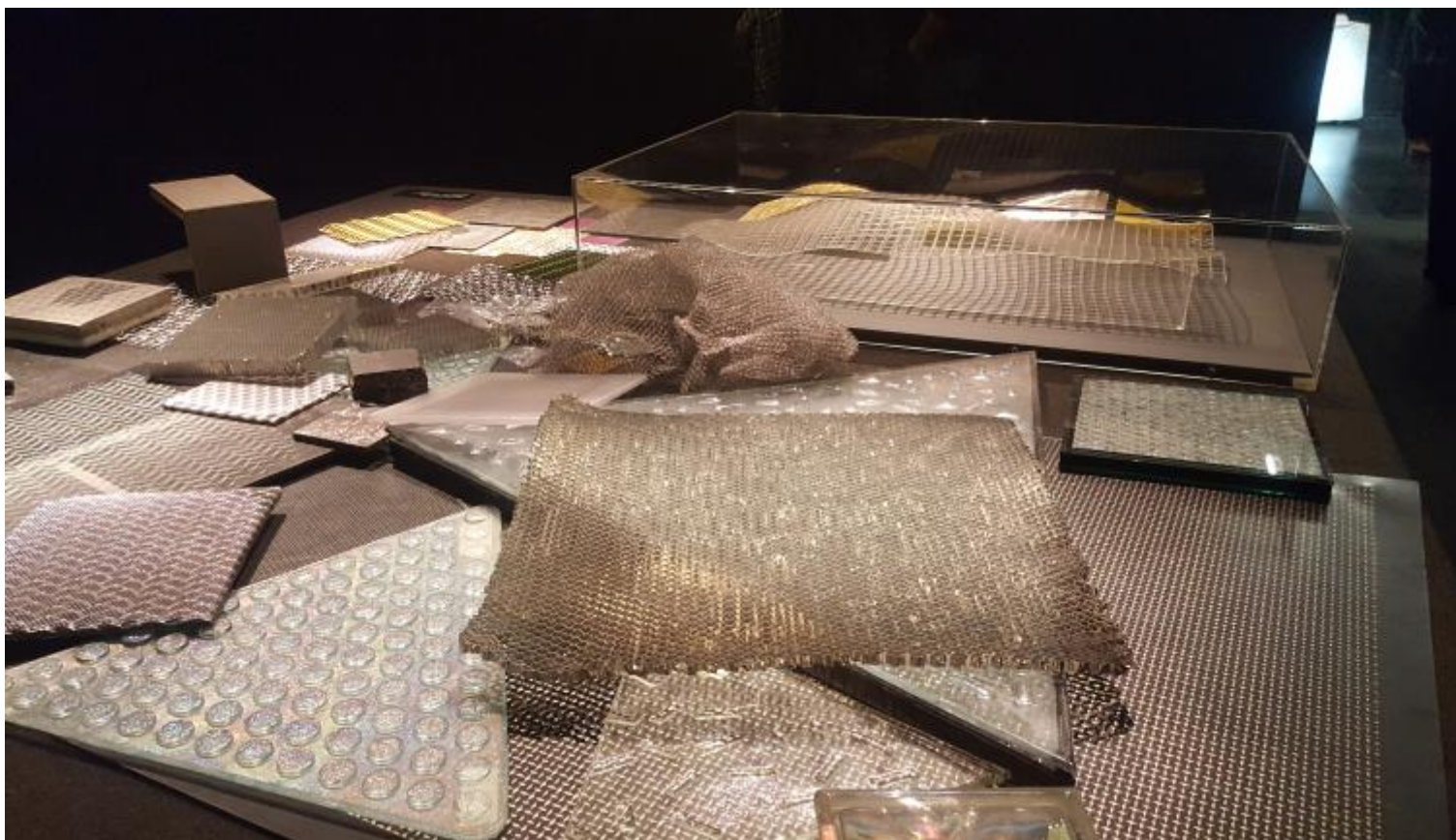
Sopra: Alcuni dei materiali costruttivi utilizzati per il velario del Dipartimento di Arti Islamiche del Museo del Louvre (2005-2012) esposti nella mostra milanese. Sotto: dettagli dell'intervento progettuale.