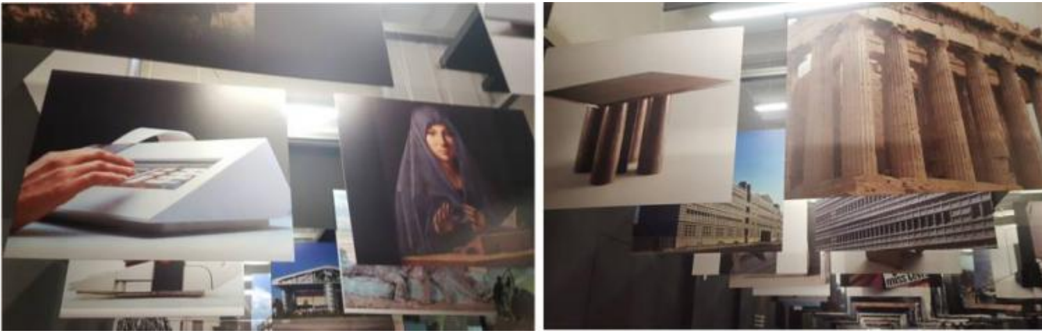
In alto: il calcolatore Logos 50-60 (Olivetti, 1973) e il leggio dell'Annunciata di Antonello da Messina; a destra: il tavolo Colonnato (Cassina, 1977) e le colonne di un tempio dorico. Sotto: Scorci della Galleria. (ph. MLG).