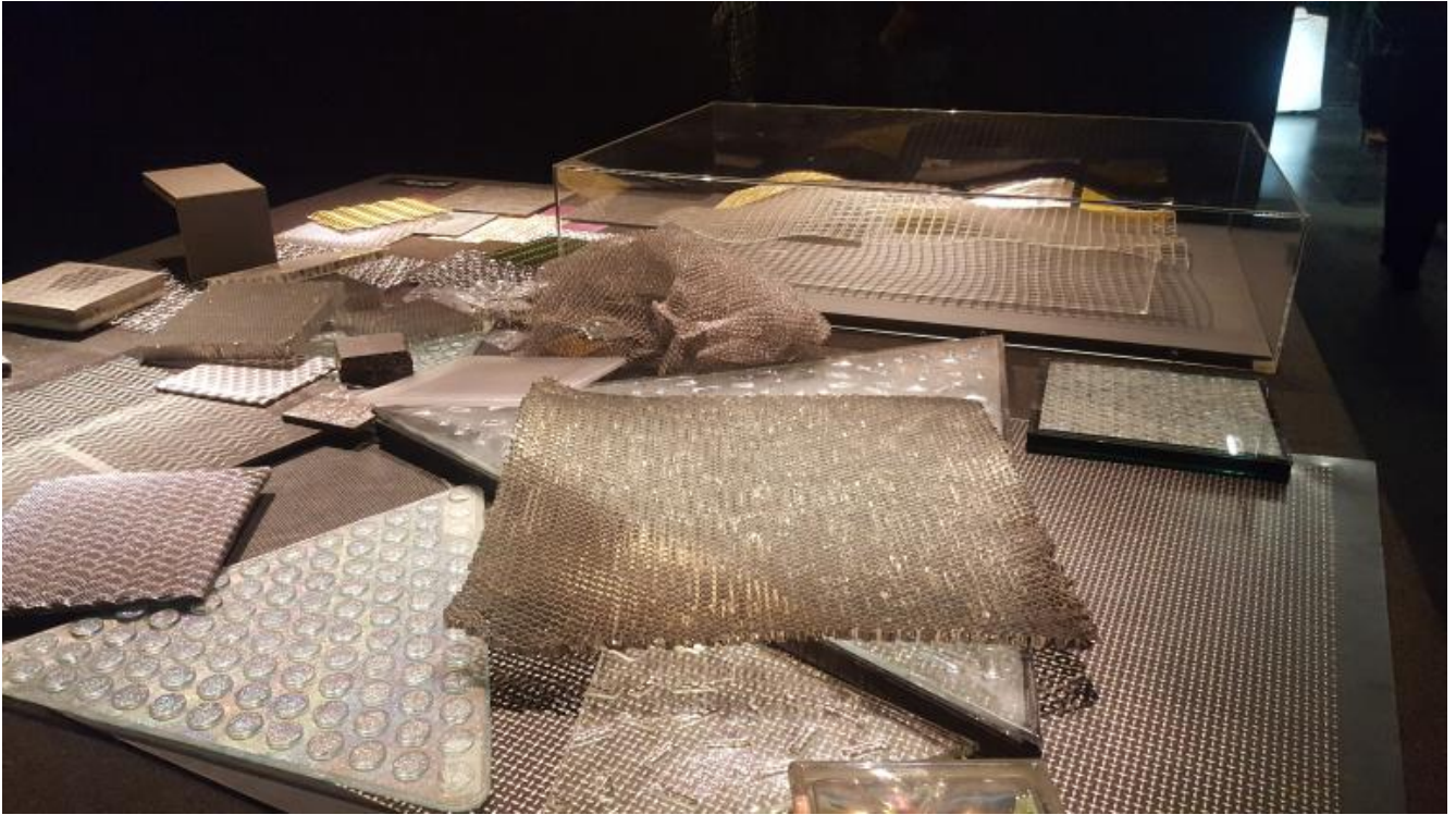
Sopra: Alcuni dei materiali costruttivi utilizzati per il velario del Dipartimento di Arti Islamiche del Museo del Louvre (2005-2012) esposti nella mostra milanese. Sotto: dettagli dell'intervento progettuale.