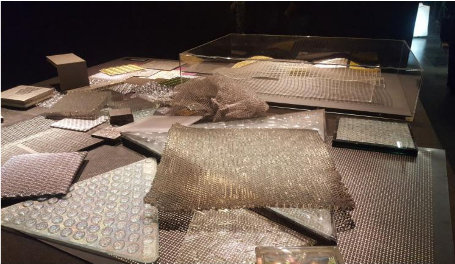
Sopra: Alcuni dei materiali costruttivi utilizzati per il velario del Dipartimento di Arti Islamiche del Museo del Louvre (2005-2012) esposti nella mostra milanese. Sotto: dettagli dell'intervento progettuale.