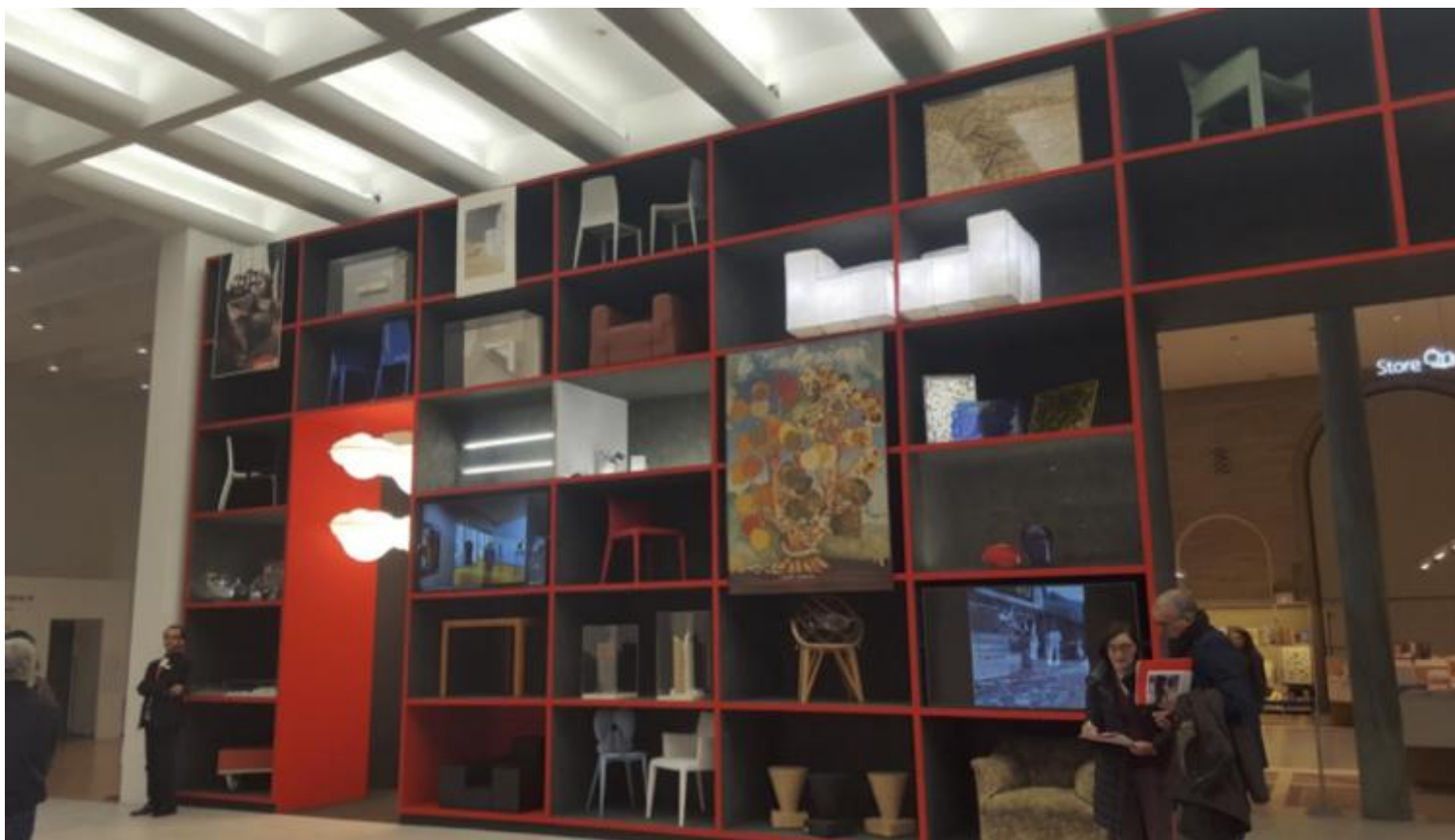
Il Portale, ovvero la grande libreria all'ingresso della mostra, che ne preannuncia i contenuti.

Un lunga Galleria, corredata di specchi, si snoda poi a ferro di cavallo per più di 100 metri. Vicina ai labirinti dei Luna Park, ospita in serie cronologica gli oggetti di design creati dal maestro (vincitore di ben otto Compassi d'Oro). Appesi all'alto soffitto, galleggiano sopra ciascun oggetto grandi pannelli fotografici (più di cento) riproducenti le immagini di riferimento a cui Bellini si è ispirato nel progettarlo: il profilo con branchie del muso di uno squalo per Programma 101 (Olivetti, 1965); una conchiglia spiraliforme per il prototipo della sedia Teneride (Cassina, 1970); il leggio dell' Annunciata di Antonello da Messina per il calcolatore Logos 50-60 (Olivetti, 1973); un grande cappello da suora per la lampada Area (Artemide, 1974); il tavolo de l'Ultima cena di Andrea del Castagno per il tavolo Basilica (Cassina, 1977); le colonne di un tempio dorico per il tavolo Colonnato (Cassina, 1977); il trono di Tutankamon per la sedia Cab (Cassina, 1979); il profilo di un airone che decolla per la sedia Persona (Vitra, 1984) e ancora molte altre, in un caleidoscopio rutilante di forme e di colori che ammalia e che inebria.