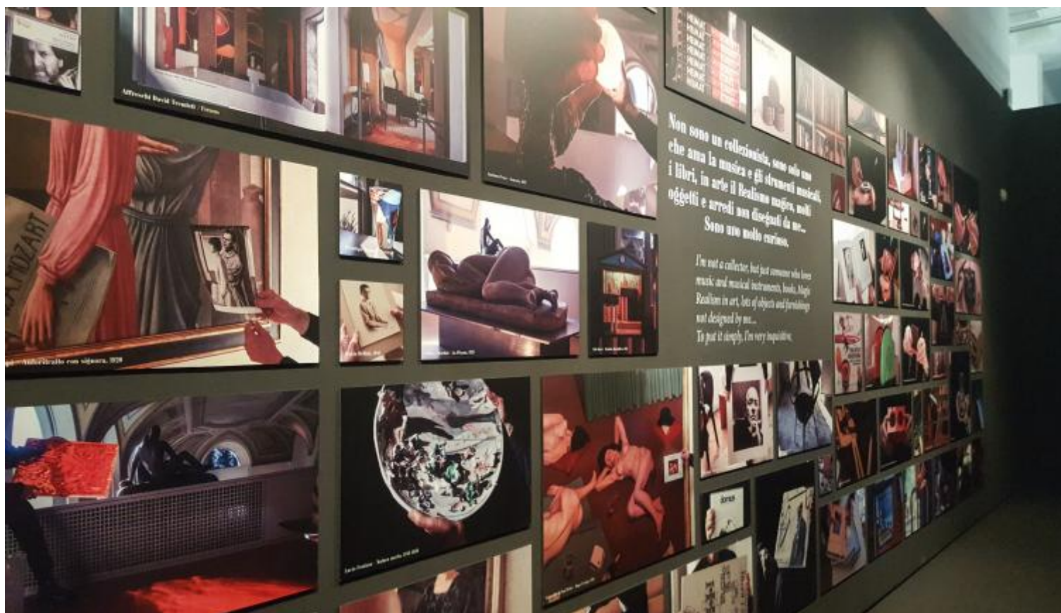
La wunderkammer. (ph. MLG).

Sulla parete di fronte, completamente nera, campeggiano invece alcune parole chiave del ‘multiverso belliniano’. Si tratta degli “Appunti per un progetto di abbecedario”: