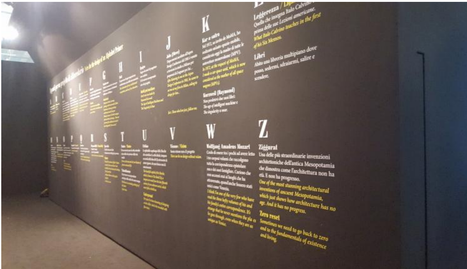
La parete degli appunti per un progetto di Abbecedario.

capolavoro delle Marche che custodisce La città ideale, tempera su tavola della fine del Quattrocento di autore ignoto, che non finisce mai di emozionarmi); Visione (Senza visione non c'è progetto); Wolfgang Amedeus Mozart (Credo di essere tra i pochi ad aver letto i tre corposi volumi che raccolgono tutta la corrispondenza epistolare sua e dei suoi famigliari. Curioso che non accenni mai ai luoghi che ha attraversato, quando anche fossero stati unici, come Venezia); Ziggurat (Una delle più straordinarie invenzioni architettoniche della Mesopotamia, che dimostra come l'architettura non ha età. E non ha progresso).