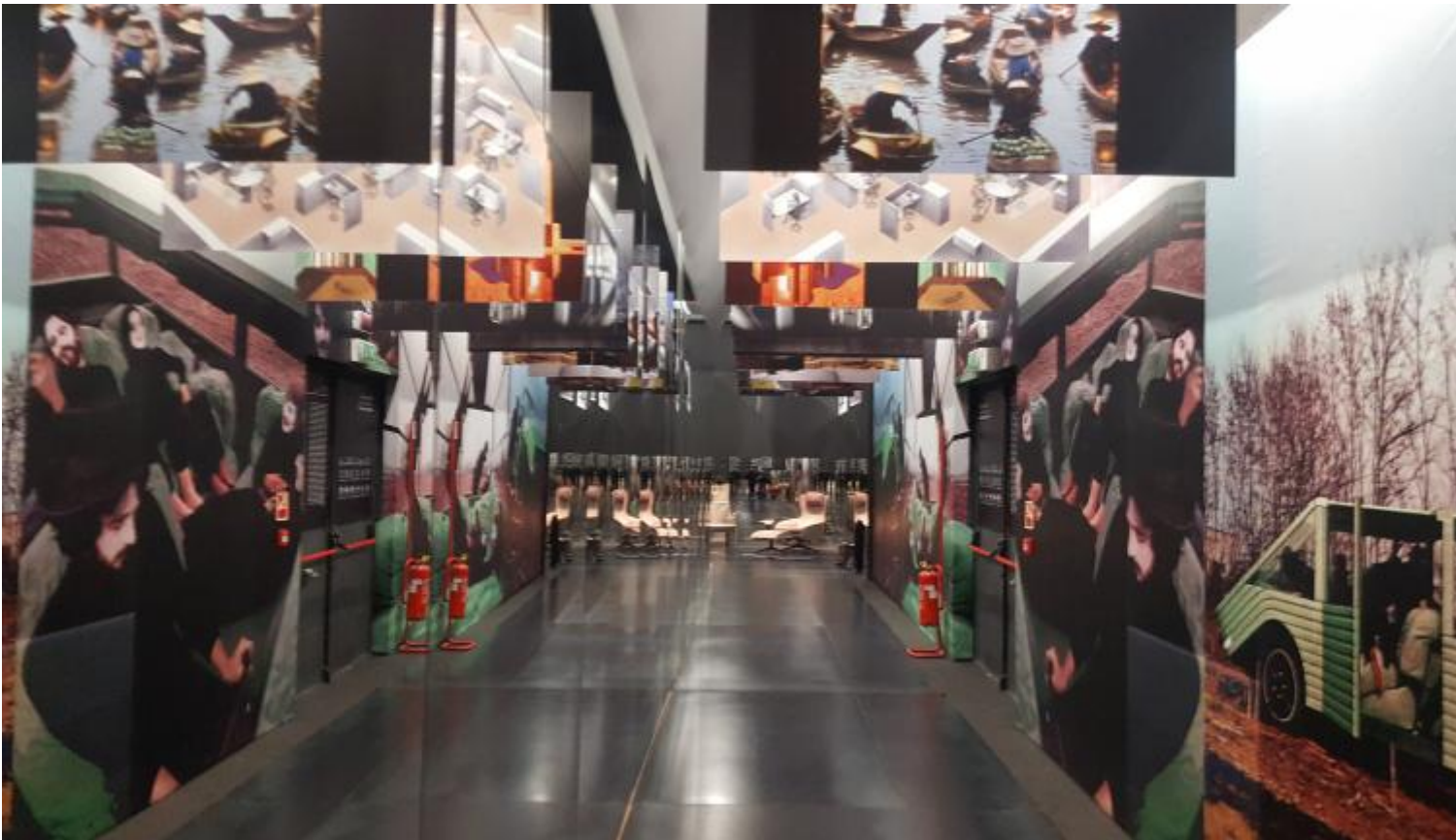
Veduta della Galleria.

La retrospettiva, intitolata Mario Bellini. Italian Beauty e curata da Deyan Sudjic, Ermanno Ranzani e Marco Sammiceli, cade a trent'anni di distanza dalla mostra che gli dedicò il MoMA di New York, incentrata sulla sua attività di designer (con 25 suoi pezzi già inclusi nella collezione permanente di quel museo). La rassegna milanese, allestita in Triennale, e visitabile fino al 19 marzo, accanto agli oggetti di design, presenta invece un intero multiverso belliniano, che si compone della sua architettura alla quale egli ha atteso a partire dal 1989, dei suoi interventi urbanistici, della sua virtù di mostrare, della declinazione delle sue preferenze musicali, di quella dei suoi interessi artistici e letterari e della miriade di suggestioni che egli ha saputo trarre dall'osservazione del mondo naturale e dallo studio della Storia dell'Arte e della cultura dei vari popoli dell'umanità.