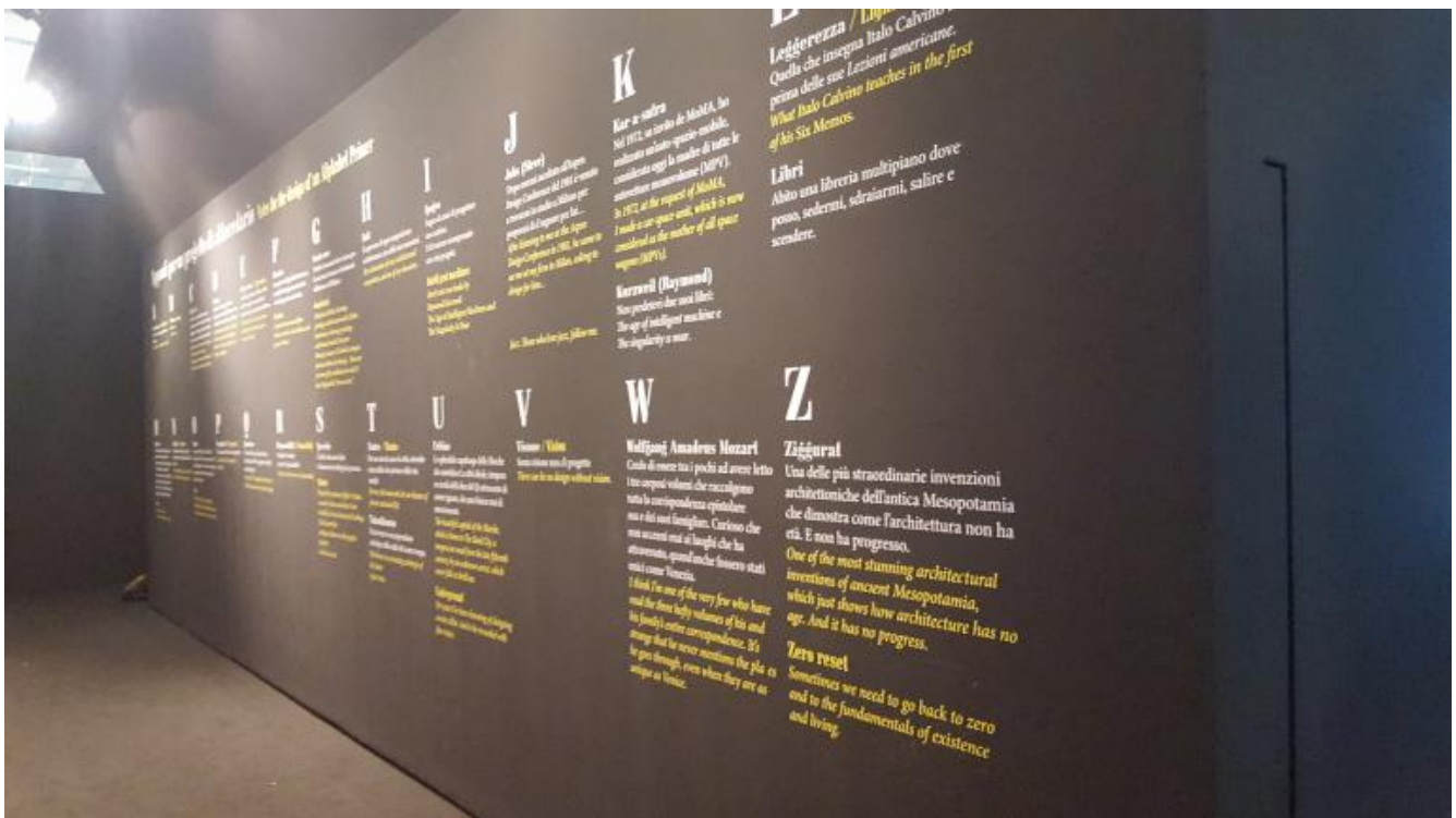
La parete degli 'Appunti per un progetto di Abbecedario'. (ph. MLG).