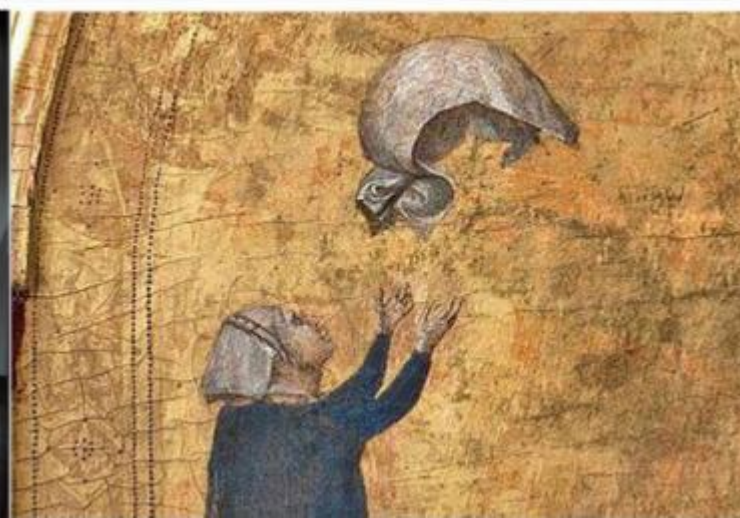
Milano, Palazzo Reale, 2 settembre 2015 / 10 gennaio 2016, mostra: Giotto e l'Italia , alcuni scorci dell'allestimento belliniano. (ph. Raffaele Cipolletta); a destra dettaglio del velo di Plautilla, dal verso del Polittico Stefaneschi.

Su una parete sono poi riprodotte, come in una sorta di wunderkammer, le mani del maestro che reggono oggetti fondamentali per la sua poetica, dal quadro L'architetto di Mario Sironi a una giacca di Issey Miyake; da alcuni oggetti di Ettore Sottsass alla raccolta completa delle lettere di Mozart; da un piatto di Lucio Fontana al portagiaccio di Gio Ponti; dal Compasso d'Oro a una matita con un foglio di carta, bianco, e molto altro ancora.