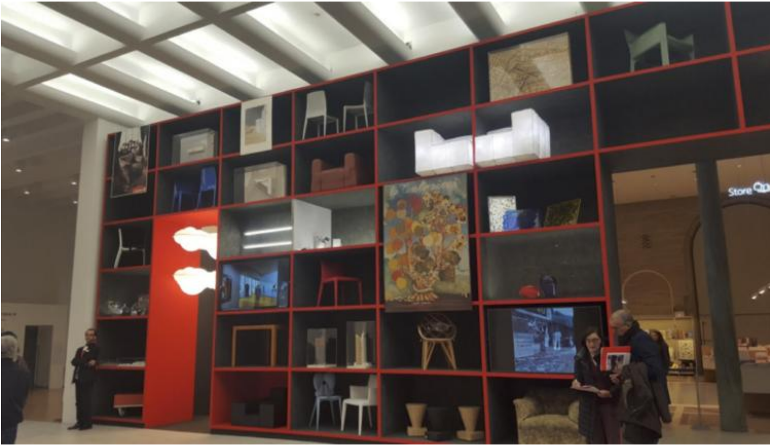
Il Portale, ovvero la grande libreria all'ingresso della mostra, che ne preannuncia i contenuti.

Un lunga Galleria, corredata di specchi, si snoda poi a ferro di cavallo per piÃ¹ di 100 metri. Vicina ai labirinti dei Luna Park, ospita in serie cronologica gli oggetti di design creati dal maestro (vincitore di ben otto Compassi d'Oro). Appesi all'alto soffitto, galleggiano sopra ciascun oggetto grandi pannelli fotografici (piÃ¹ di cento) riproducenti le immagini di riferimento a cui Bellini si Ã¨ ispirato nel progettarlo: il profilo con branchie del muso di uno squalo per Programma 101 (Olivetti, 1965); una conchiglia spiraliforme per il prototipo della sedia Teneride (Cassina, 1970); il leggio dell'Annunciata di Antonello da Messina per il calcolatore Logos 50-60 (Olivetti, 1973); un grande cappello da suora per la lampada Area (Artemide, 1974); il tavolo de l'Ultima cena di Andrea del Castagno per il tavolo Basilica (Cassina, 1977); le colonne di un tempio dorico per il tavolo Colonnato (Cassina, 1977); il trono di Tutankamon per la sedia Cab (Cassina, 1979); il profilo di un airone che decolla per la sedia Persona (Vitra, 1984) e ancora molte altre, in un caleidoscopio rutilante di forme e di colori che ammalia e che inebria.