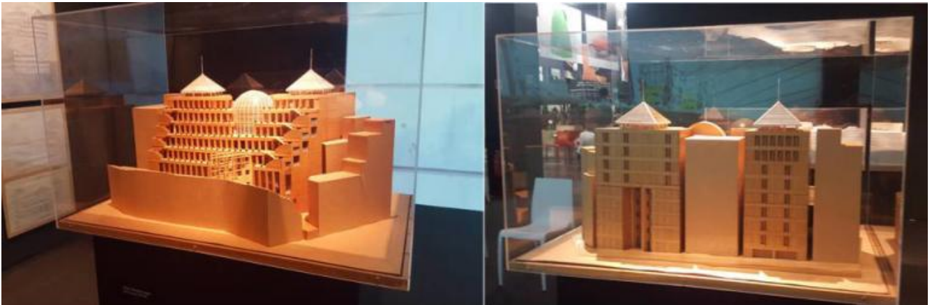
Plastici del Tokyo Design Center, 1991. Sotto: alcuni scorci del Tokyo Design Center.

In Giappone vige il divieto di proiettare l'ombra di un edificio sul terreno del vicino. Pare che il problema si possa ovviare in due modi: o acquistando dal proprietario del terreno il diritto di proiettarvi l'ombra, oppure con un colpo di genio. A raccontare di questa peculiarità giapponese è Mario Bellini (1935), mentre illustra il modellino del Tokyo Design Center, edificio da lui progettato nel 1991, esposto nella bella mostra che Milano, la sua città natale, finalmente gli dedica.