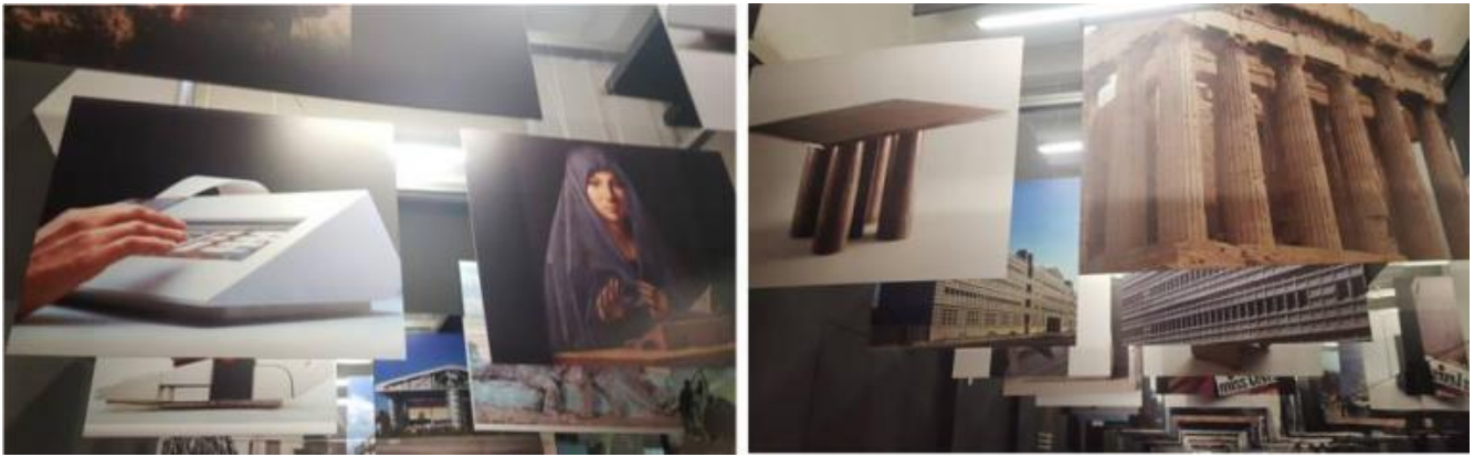
In alto: il calcolatore Logos 50-60 (Olivetti, 1973) e il leggio dell'Annunciata di Antonello da Messina; a destra: il tavolo Colonnato (Cassina, 1977) e le colonne di un tempio dorico. Sotto: Scorci della Galleria.