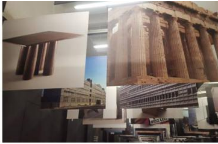
In alto: il calcolatore Logos 50-60 (Olivetti, 1973) e il leggio dell'Annunciata di Antonello da Messina; a destra: il tavolo Colonnato (Cassina, 1977) e le colonne di un tempio dorico. Sotto: Scorci della Galleria.