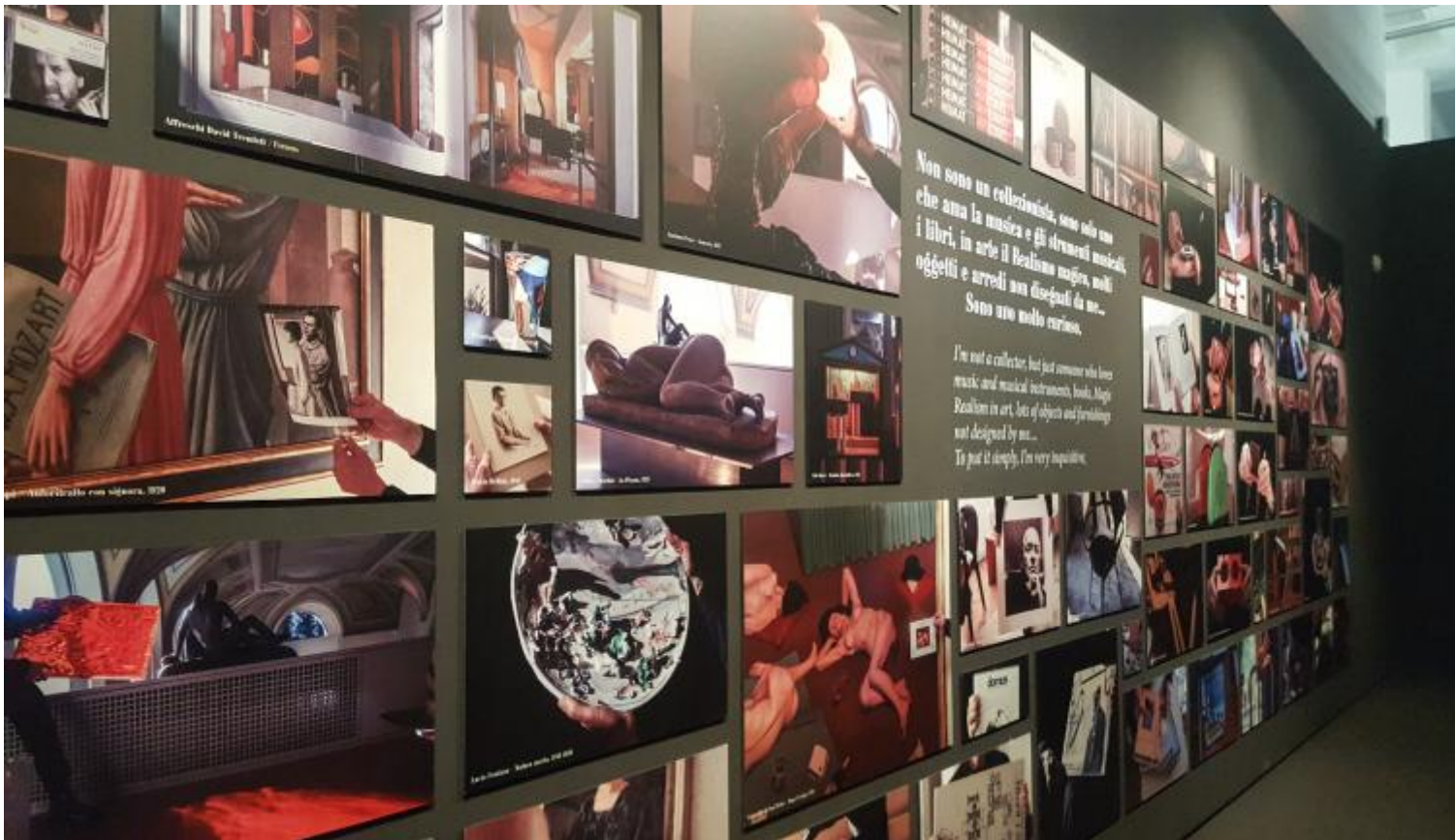
La wunderkammer.

Sulla parete di fronte, completamente nera, campeggiano invece alcune parole chiave del "multiverso belliniano". Si tratta degli "Appunti per un progetto di abbecedario":