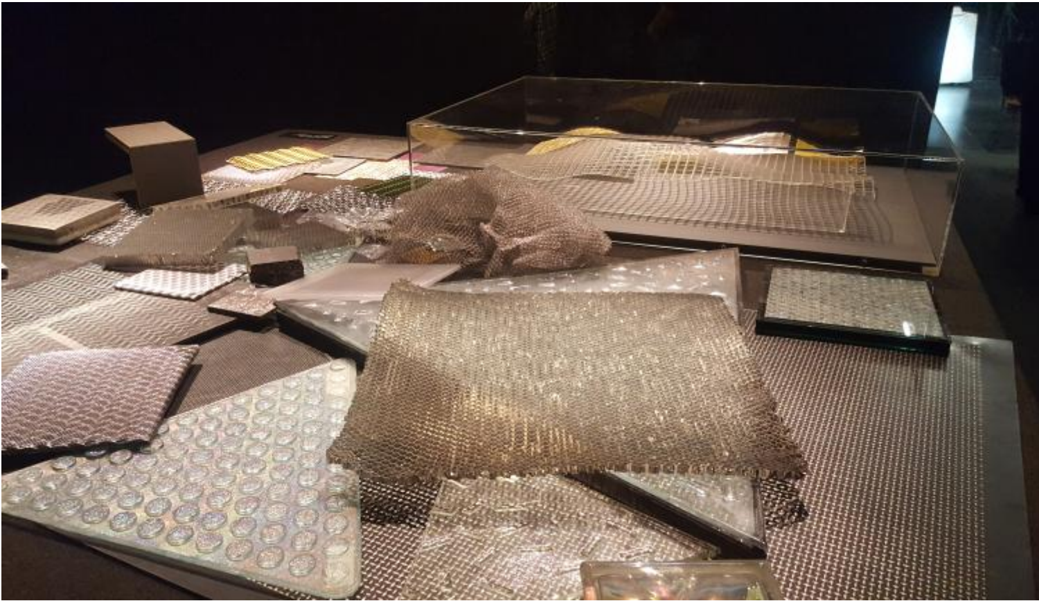
Sopra: Alcuni dei materiali costruttivi utilizzati per il velario del Dipartimento di Arti Islamiche del Museo del Louvre (2005-2012) esposti nella mostra milanese. Sotto: dettagli dell'intervento progettuale.