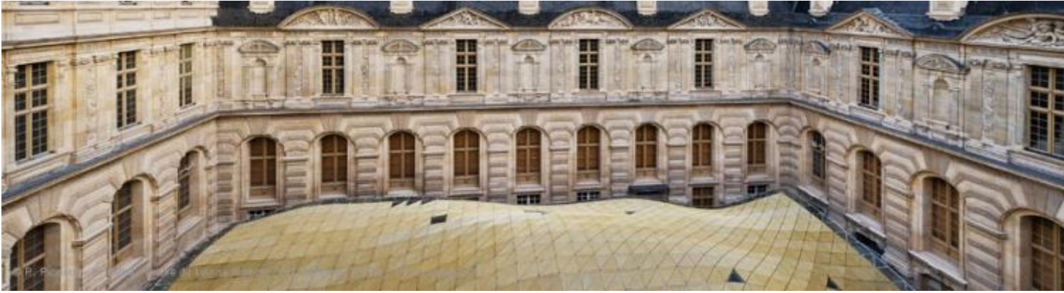
Dipartimento di Arti Islamiche del Museo del Louvre (2005-2012). Definizioni che sono state date della copertura: “Foulard”, “Vela”, “Tenda beduina”, “Duna d’oro”, “Onda dorata”.

disegni del Louvre), dove l'ortogonalità del sistema trilitico si coniuga alle sinuosità di quello archivoltato, perseguono l'eleganza, il cromatismo e la leggerezza. Tutti e due, poi, vivono in epoche di transizione, Jacopo a cavallo tra Gotico e Rinascimento, Mario fra Tarda Modernità e il linguaggio architettonico del domani a cui ancora non è stato attribuito un nome, ma che lui previene, preannunciandolo ai posteri con magistrale sapienza.