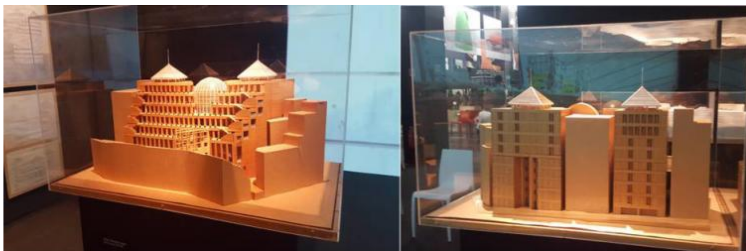
Plastici del Tokyo Design Center, 1991. Sotto: alcuni scorci del Tokyo Design Center.

In Giappone vige il divieto di proiettare lâ??ombra di un edificio sul terreno del vicino. Pare che il problema si possa ovviare in due modi: o acquistando dal proprietario del terreno il diritto di proiettarvi lâ??ombra, oppure con un colpo di genio. A raccontare di questa peculiaritÃ giapponese Ã" Mario Bellini (1935), mentre illustra il modellino del Tokyo Design Center, edificio da lui progettato nel 1991, esposto nella bella mostra che Milano, la sua cittÃ natale, finalmente gli dedica.