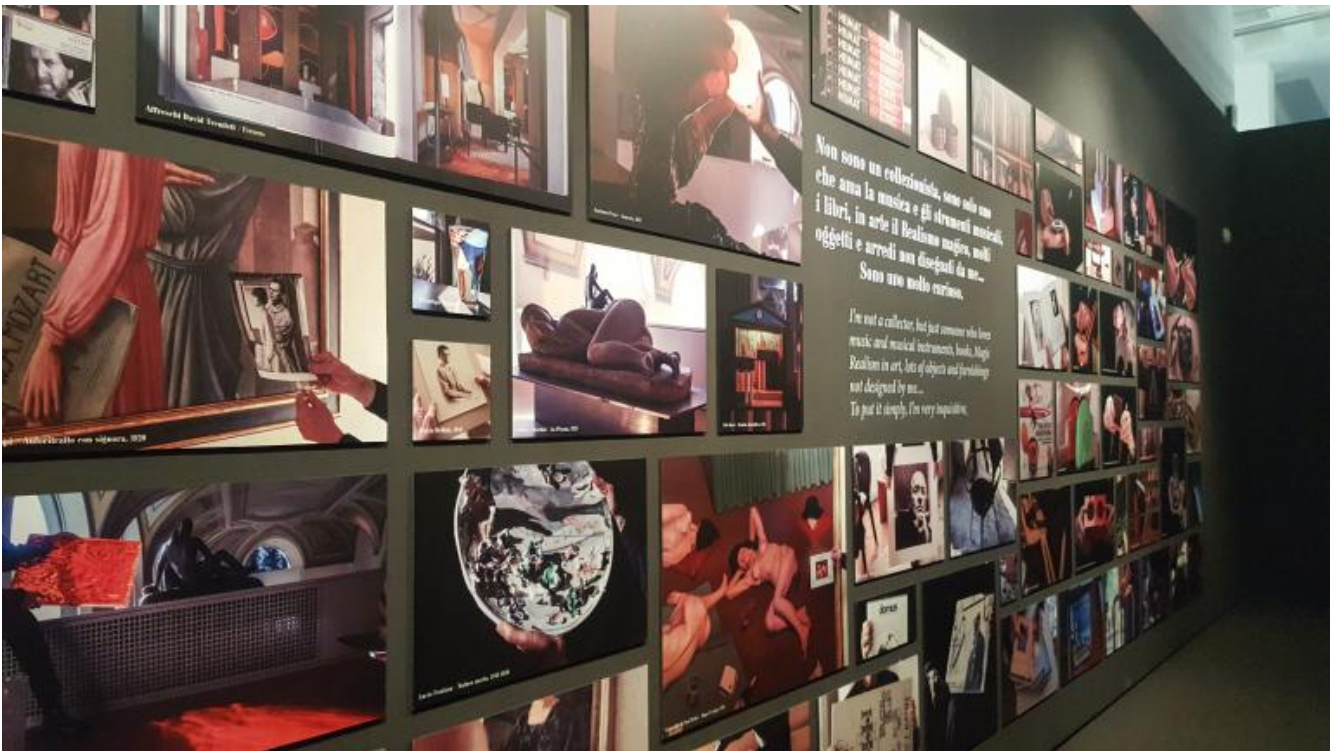
La wunderkammer. (ph. MLG).

Sulla parete di fronte, completamente nera, campeggiano invece alcune parole chiave del 'multiverso belliniano'. Si tratta degli "Appunti per un progetto di abbecedario":