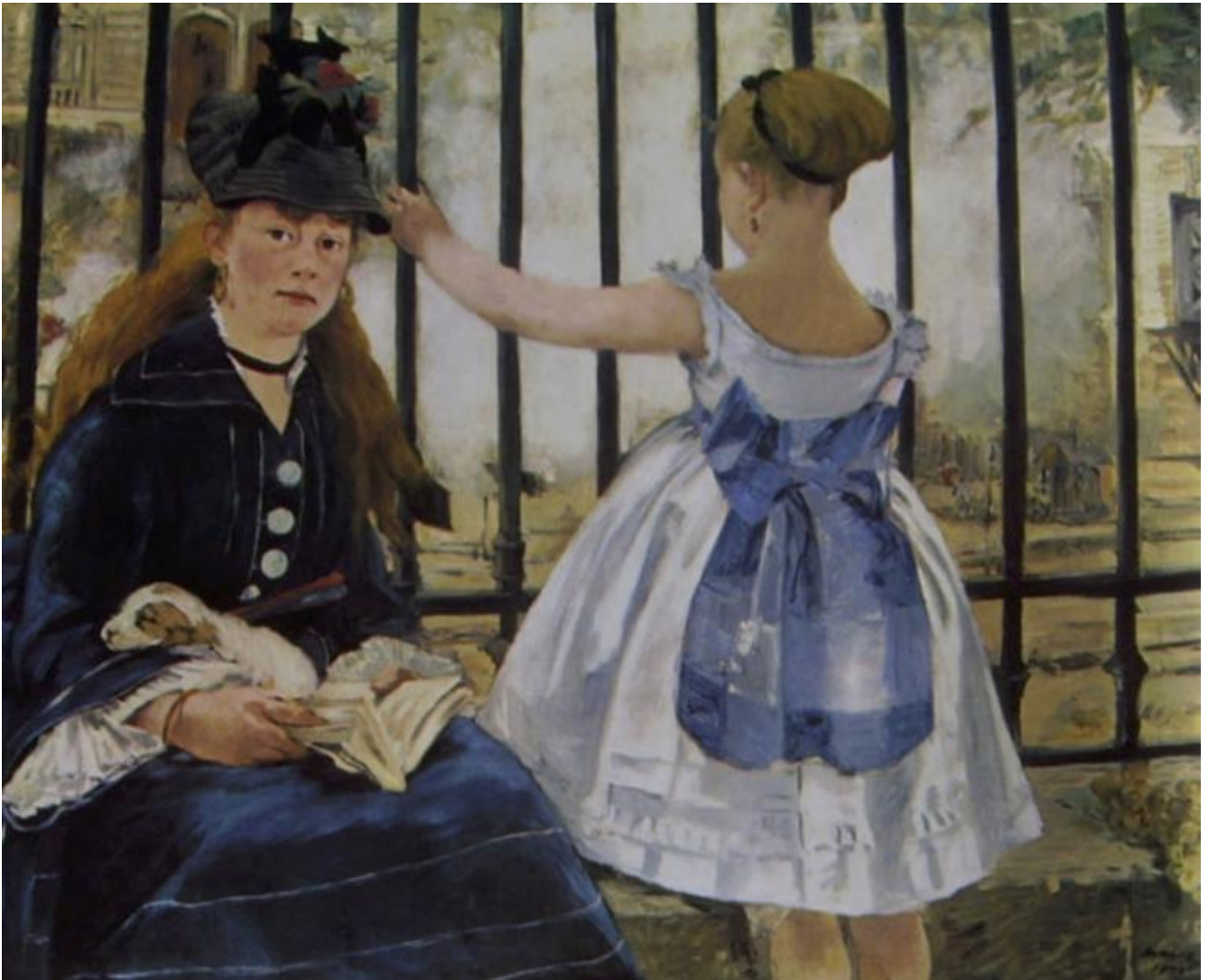
Manet, Le chemin de fer (1872-73).

Il dialogo fra Degas e Manet ricostruito pazientemente da Stoichita, tutto svolto con le risorse della pittura, è in questo illuminante. Da una parte il pittore che sta fuori il quadro, l'oggettivante Degas, che rappresenta il mondo come una scena a sé, frutto di una visione insistente e nascosta ma per nulla problematica.