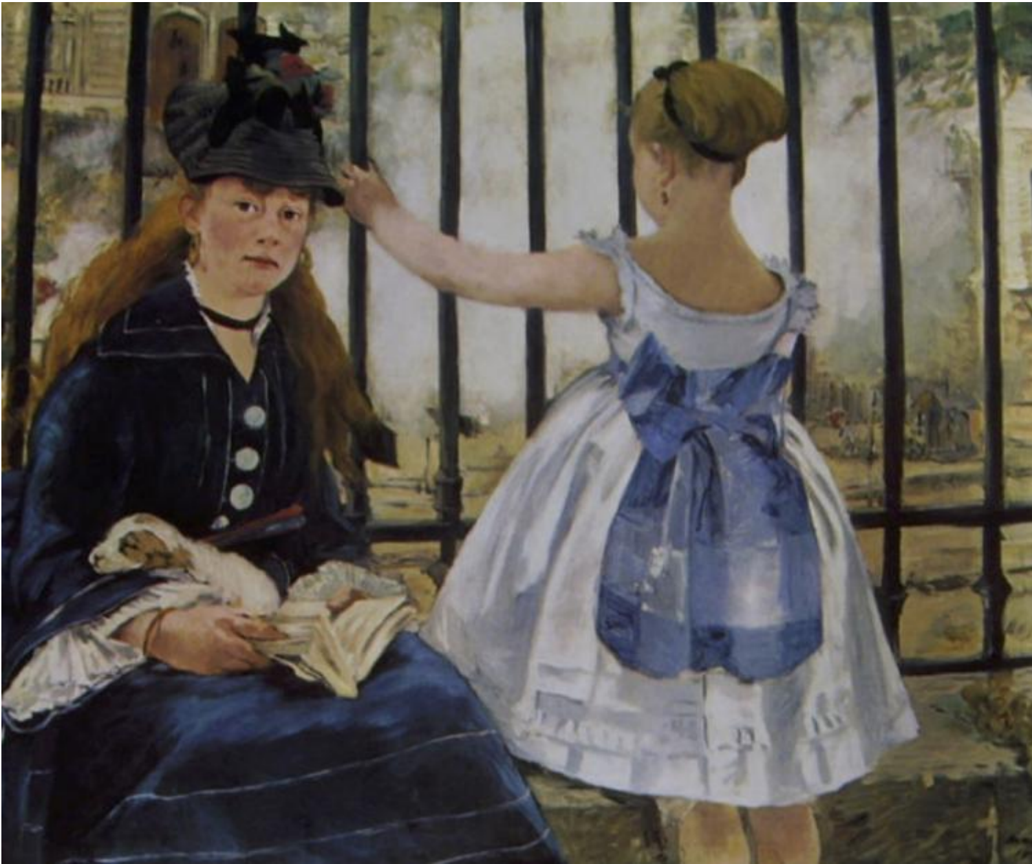
Manet, Le chemin de fer (1872-73).

Il dialogo fra Degas e Manet ricostruito pazientemente da Stoichita, tutto svolto con le risorse della pittura, è in questo illuminante. Da una parte il pittore che sta fuori il quadro, l'oggettivante Degas, che rappresenta il mondo come una scena a sé, frutto di una visione insistente e nascosta ma per nulla problematica. Dall'altra l'artista che si mette in gioco inserendosi in vario modo nella tela (ora come autoritratto di scorcio ora come firma inscritta nella rappresentazione), il soggettivante Manet, che restituisce il mondo come esito di un atto percettivo che del mondo stesso fa parte (situato, direbbero oggi i migliori cognitivisti): guardare verso la realtà, spesso, essere guardati da essa. In questo, il vero voyeur è proprio Degas, che vede senza essere visto, cancellandosi come autore di un'opera che pure ha prodotto; mentre Manet, mettendo a nudo il procedimento pittorico, mostra il suo sguardo all'opera, un'opera che va inserita in un flusso comunicativo potenzialmente reversibile. E la cosa va avanti fino a che i due non cominciano a farsi ironicamente il verso: Degas dipinge una donna con un binocolo in mano e che le copre il viso (la Manet); Manet dipinge la moglie di profilo, al centro della tela, mentre suona il piano (la Degas).