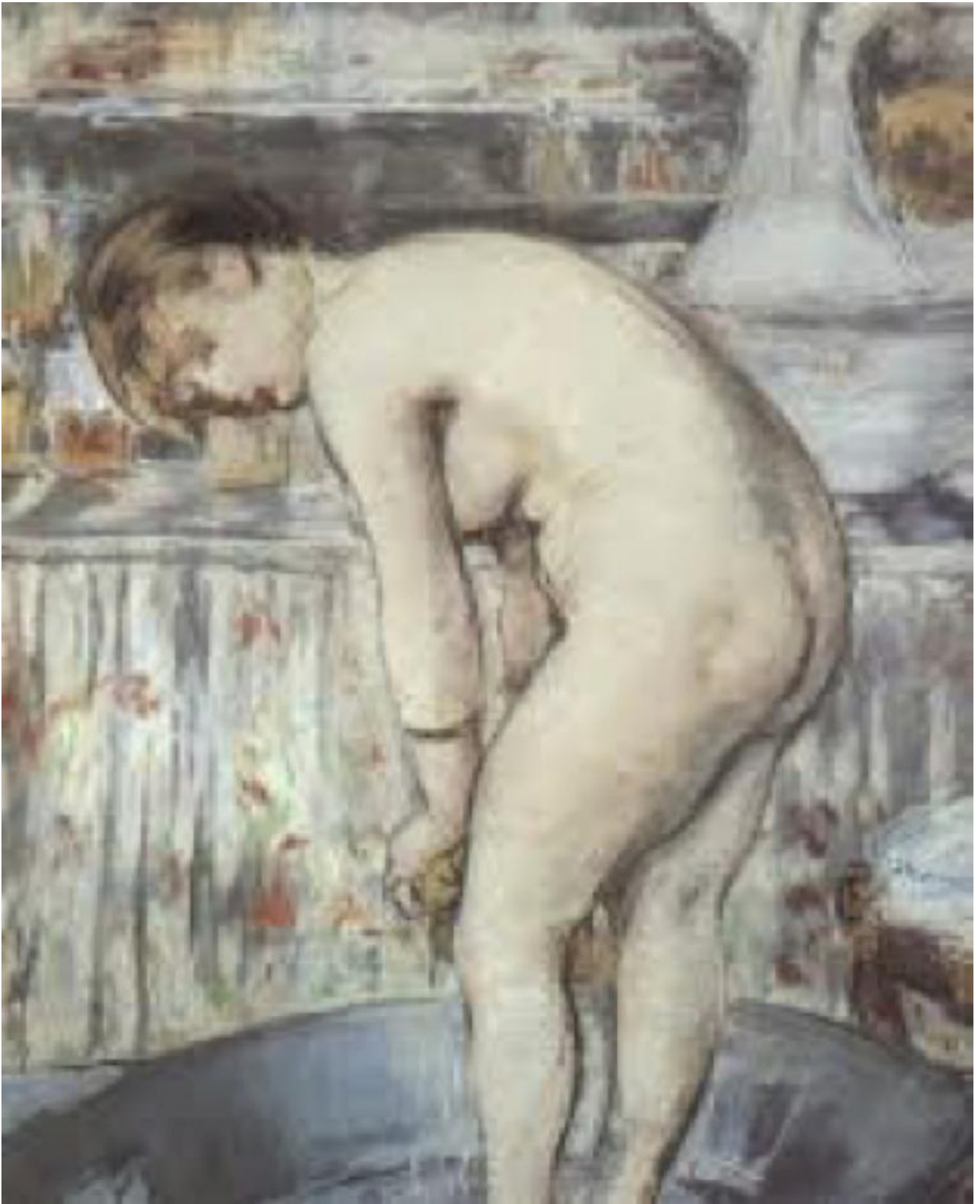
Manet, Le tub (1878-79).

Alfred Hitchcock, profondo conoscitore di questo genere di questioni pittoriche, e gran lettore di polizieschi, riesce magistralmente a trasferirle sullo schermo cinematografico, adattandole a un medium a prima vista meno preoccupante, ma