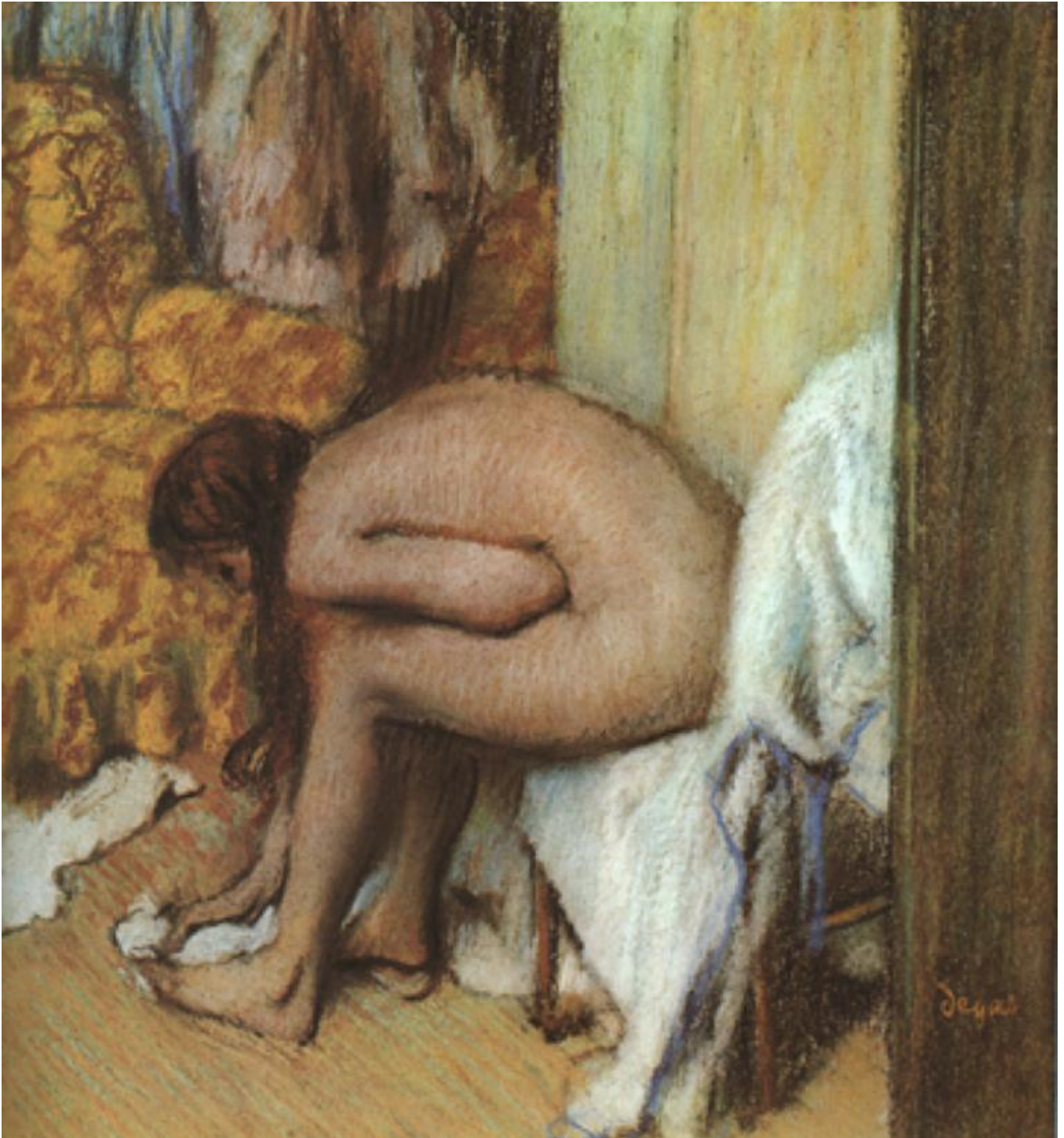
Degas, Femme à sa toilette essuyant son pied gauche (1886).

con un binocolo in mano e che le copre il viso (à la Manet); Manet dipinge la moglie di profilo, al centro della tela, mentre suona il piano (à la Degas).