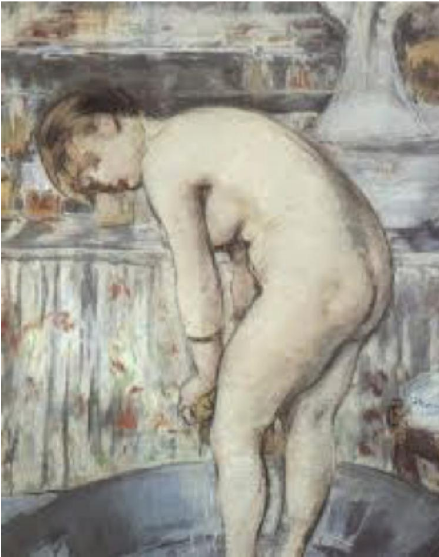
Manet, Le tub (1878-79).