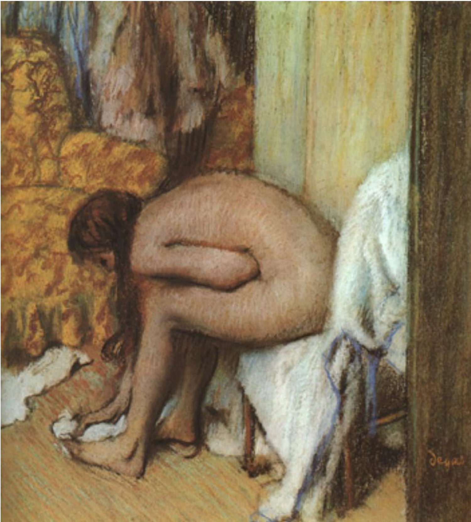
Degas, Femme à sa toilette essuyant son pied gauche (1886).