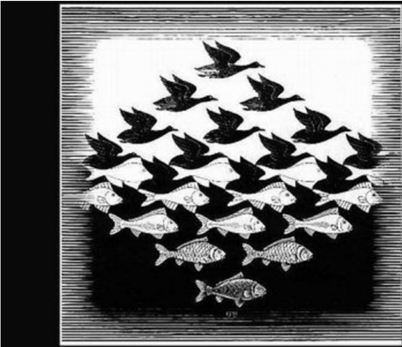
Un'immagine di Escher.

Ignoro se le mie parole avranno un qualche effetto nel dibattito in corso. La mia illusione \tilde{\cdot} che il dialogo iniziale tra A e B assuma, alla fine e dopo un lungo meditare in comune, la forma che segue: