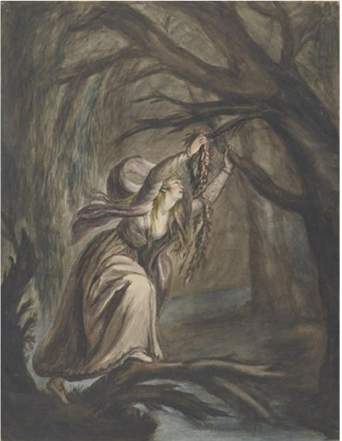
Hoare Mary, La morte di Ofelia.

anche tali aspetti tutt'altro che marginali, per risultare davvero efficace/motivata.