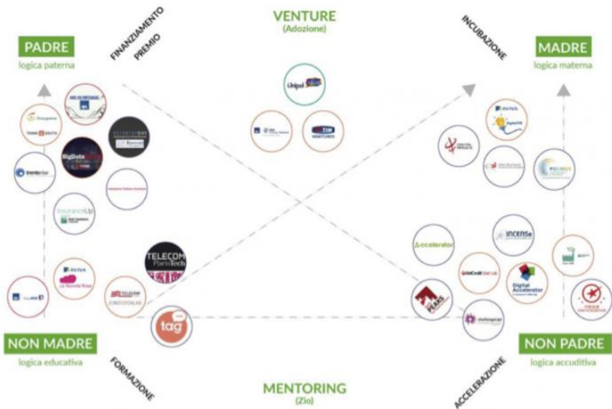
IL QUADRATO SEMIOTICO DELL'INCUBAZIONE

Come si vede qui sotto, nel quadrato semiotico dell'incubazione tradizionale, ciò che sta sull'asse superiore racconta le due logiche (paterna e materna, quella che elargisce un premio e quella che porta a sé, che incuba fisicamente) più forti, quello inferiore le logiche della formazione (più paterna, ma non completamente tale) e dell'accelerazione (più materna, ma non completamente tale).