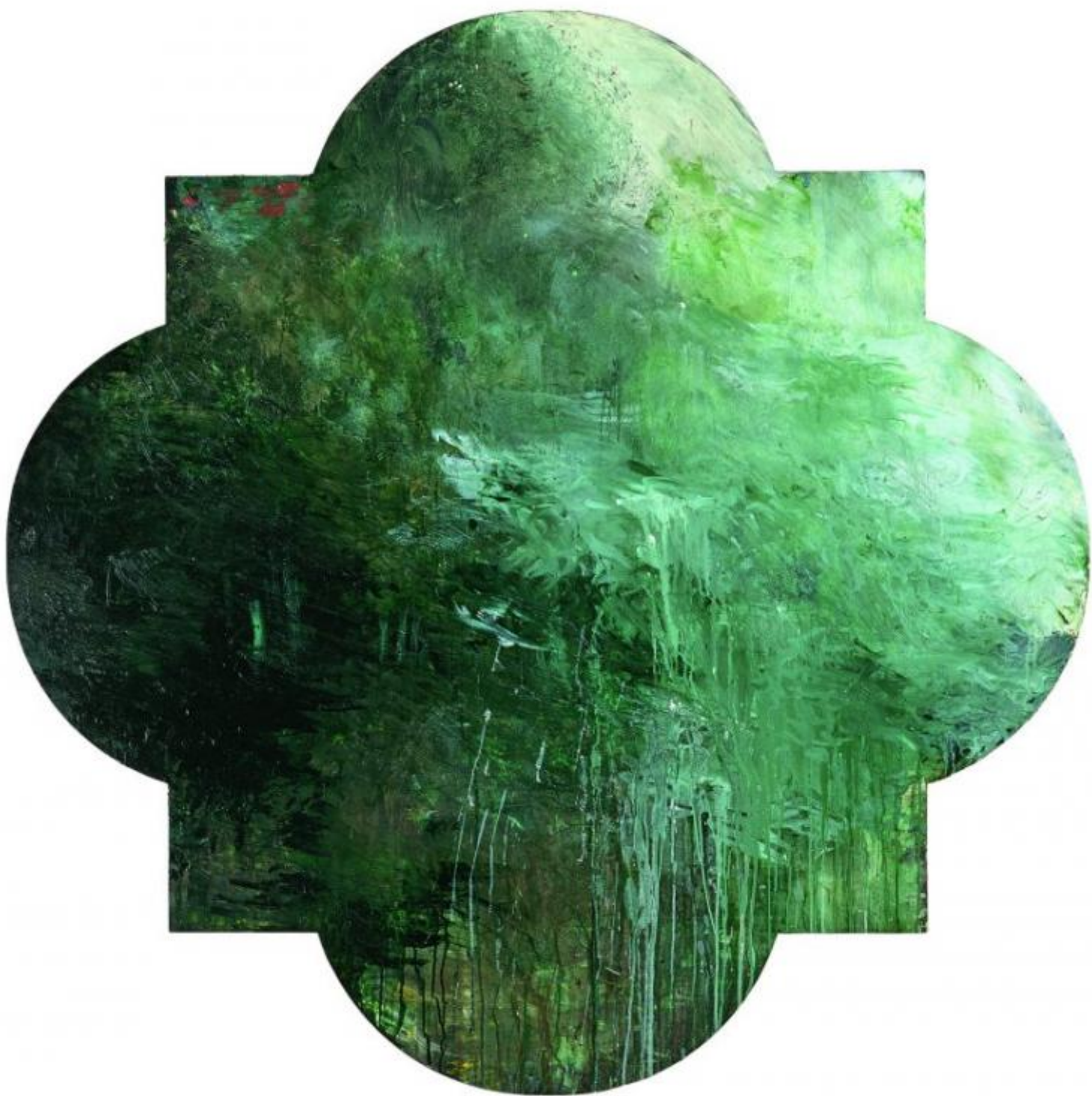
Cy Twombly, senza titolo, Bassano in tenerina, 1985.