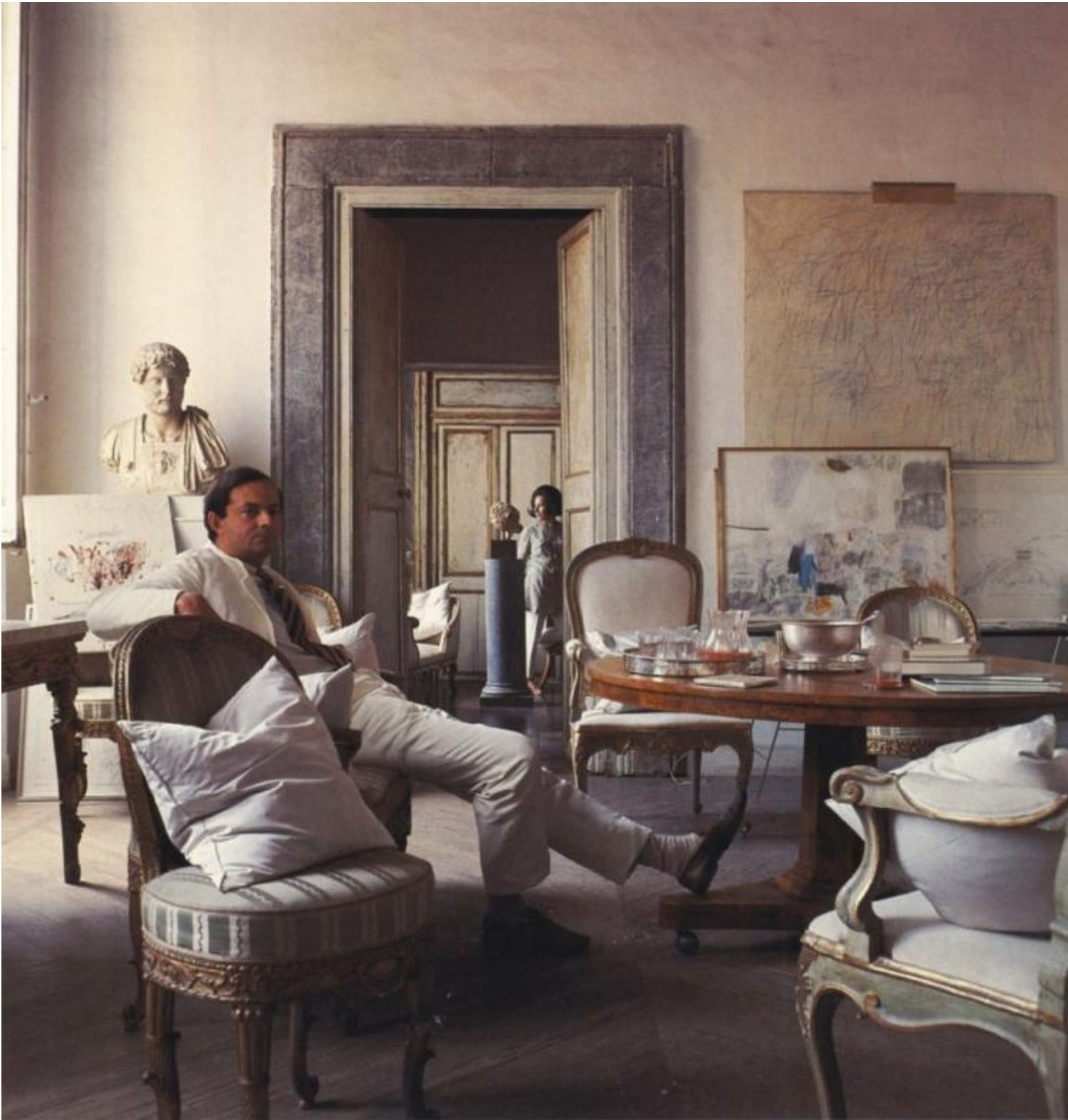
Cy Twombly nella sua casa di via Monserrato