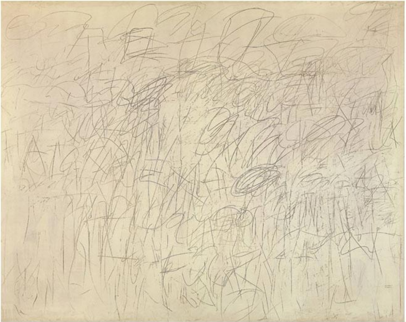
Cy Twombly, Academy , 1955.

È in questo atteggiamento che lo aveva ritratto Rauschenberg, nel 1952, in un'altra foto celebre: di profilo lo stesso sguardo serio e intento, un quaderno di appunti nella mano stesa su un fianco a contemplare il gigantesco dito alzato, unico ammonitorio resto della Statua colossale di Costantino nel cortile dei Musei Capitolini. Ed è proprio questo, direi, a fare dello sguardo di Twombly quanto di più fraterno e contemporaneo si possa oggi immaginare. Quello che aveva fatto spendere una parola profetica al mentore Charles Olson, al Black College nel 1951, quando aveva definito il poco più che ventenne Cy un «archaic postmodern».