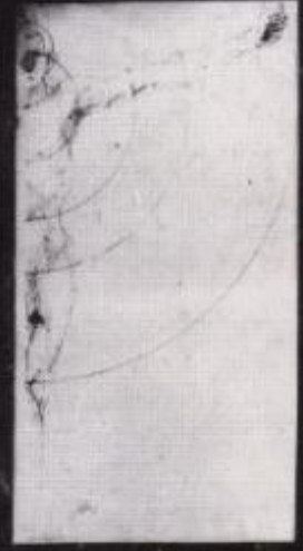
A small caption or label below the faint diagram, possibly identifying the subject or source of the illustration.