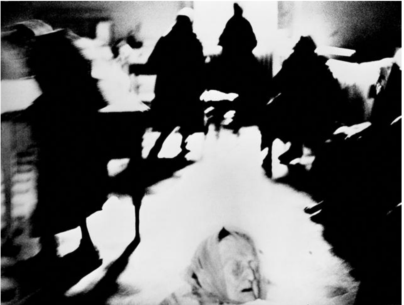
Mario Giacomelli, Verrà la morte e avrà i tuoi occhi, 1955 - 1957

Tra il 1955 e il 1957 Mario Giacomelli realizza una serie di scatti intitolata Vita d'ospizio , prima parte di un ciclo ritenuto da lui stesso il lavoro più importante, su cui tornerà più volte nel corso della sua vita (1966-1968 e 1981-1983), quando l'artista fotografa gli anziani ricoverati nella casa di riposo di Senigallia, avendo in testa ossessivamente la celebre poesia Verrà la morte e avrà i tuoi occhi , di Cesare Pavese.