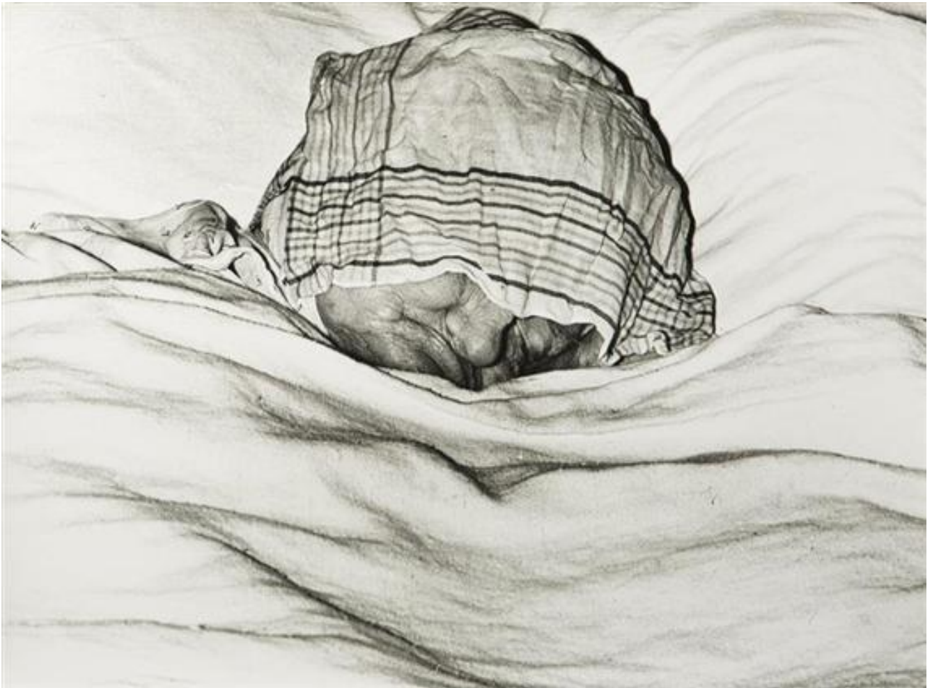
Mario Giacomelli, Verrà la morte e avrà i tuoi occhi, 1966 - 1968

Ma se tu la guardi ancora meglio, non c'è più né vecchia né ospizio, è come un mare bianco, come una barca su un'onda. Ma questo è venuto dopo che ho pianto dentro di me una quantità di volte, di fronte ad altre immagini. Non so se questa è più importante, per me sono tutti attimi, come il respiro, quella prima non è più importante di quella dopo, ce ne sono tanti, finché tutto si blocca e tutto finisce. Quante volte abbiamo respirato questa sera? Nessun respiro era più bello dell'altro e tutti insieme sono la vita" (cit. in: Frank Horvat, Entre Vues , Paris 1990).