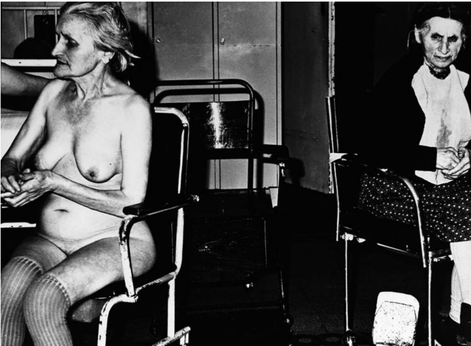
Mario Giacomelli, Verrà la morte e avrà i tuoi occhi, 1981 - 1983