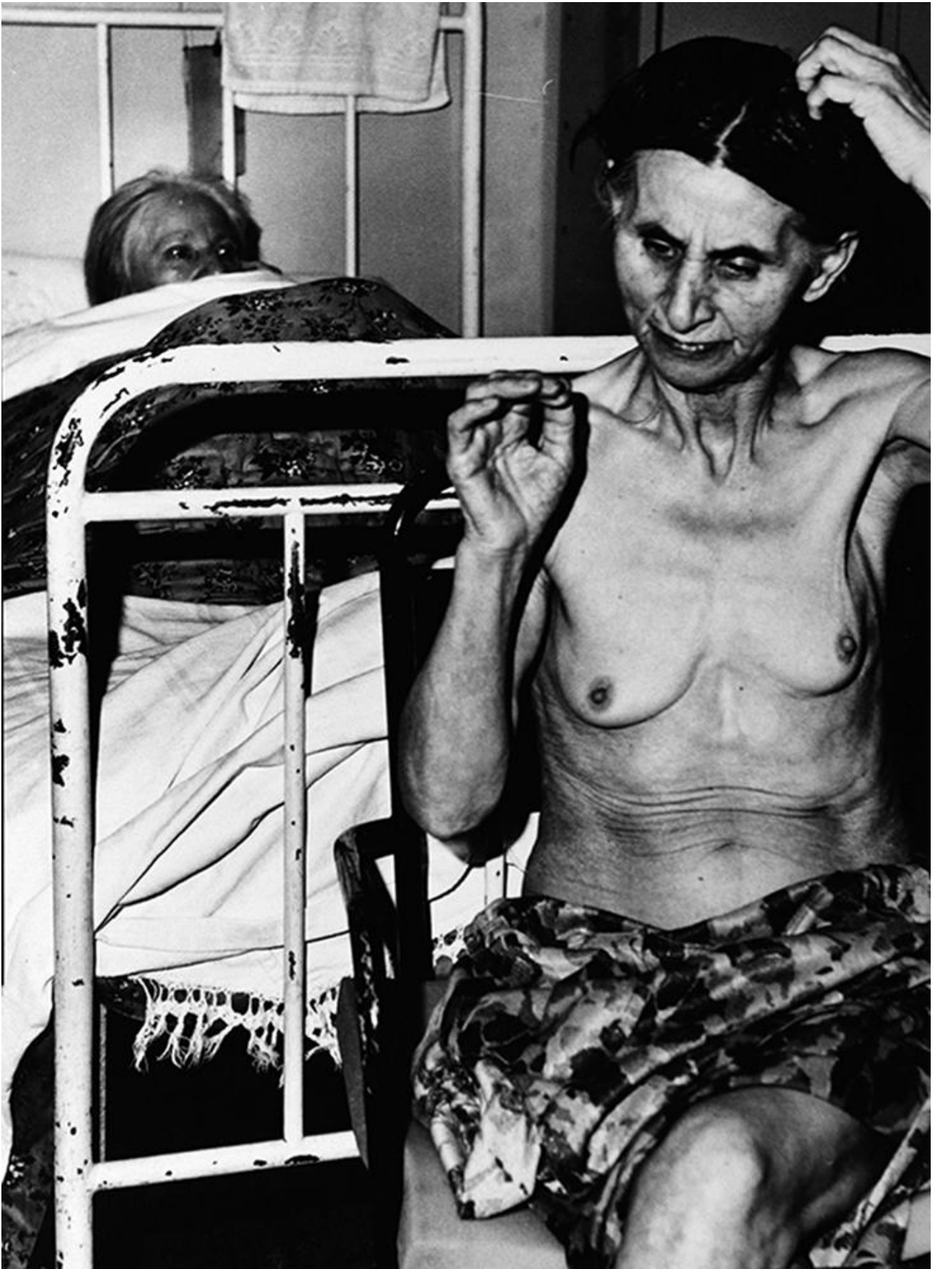
Mario Giacomelli, E io ti vidi fanciulla, Ospizio , 1981 - 1983.