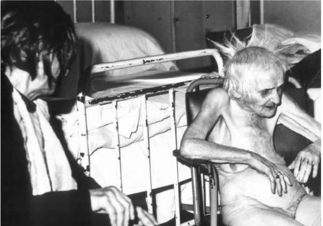
Mario Giacomelli, Verrà la morte e avrà i tuoi occhi, 1981 - 1983