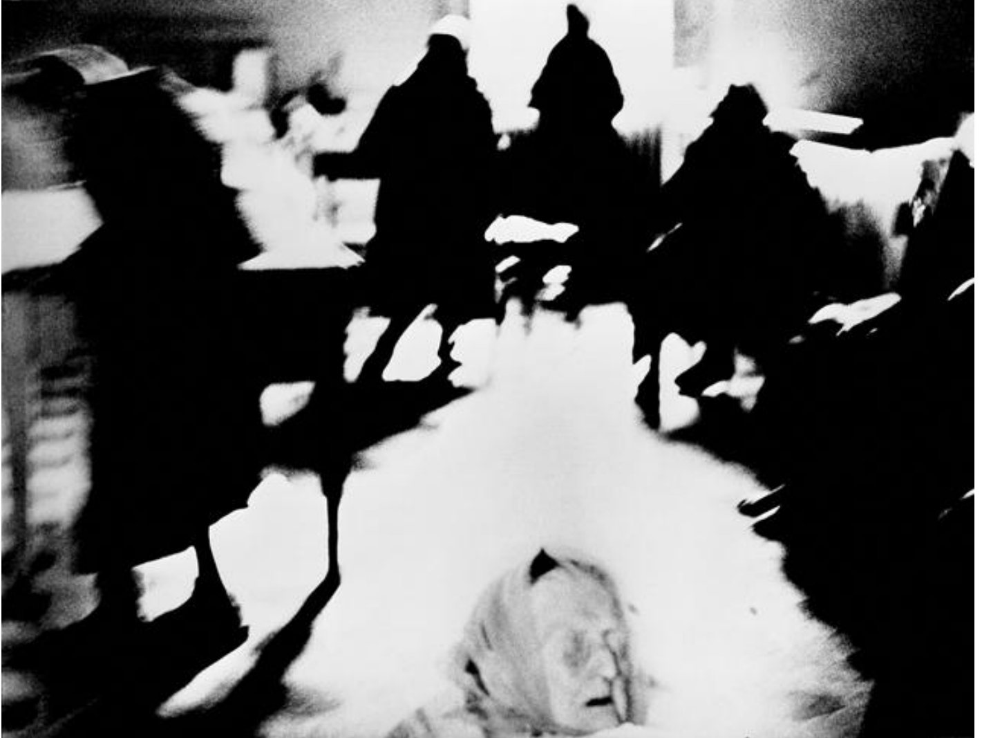
Mario Giacomelli, Verrà la morte e avrà i tuoi occhi, 1955 - 1957

Ma se tu la guardi ancora meglio, non c'è più una vecchia ospizio, è come un mare bianco, come una barca su un'onda. Ma questo è venuto dopo che ho pianto dentro di me una quantità di volte, di fronte ad altre immagini. Non so se questa è più importante, per me sono tutti attimi, come il respiro, quella prima non è più importante di quella dopo, ce ne sono tanti, finché tutto si blocca e tutto finisce. Quante volte abbiamo respirato questa sera? Nessun respiro era più bello dell'altro e tutti insieme sono la vita?• (cit. in: Frank Horvat, Entre Vues , Paris 1990).