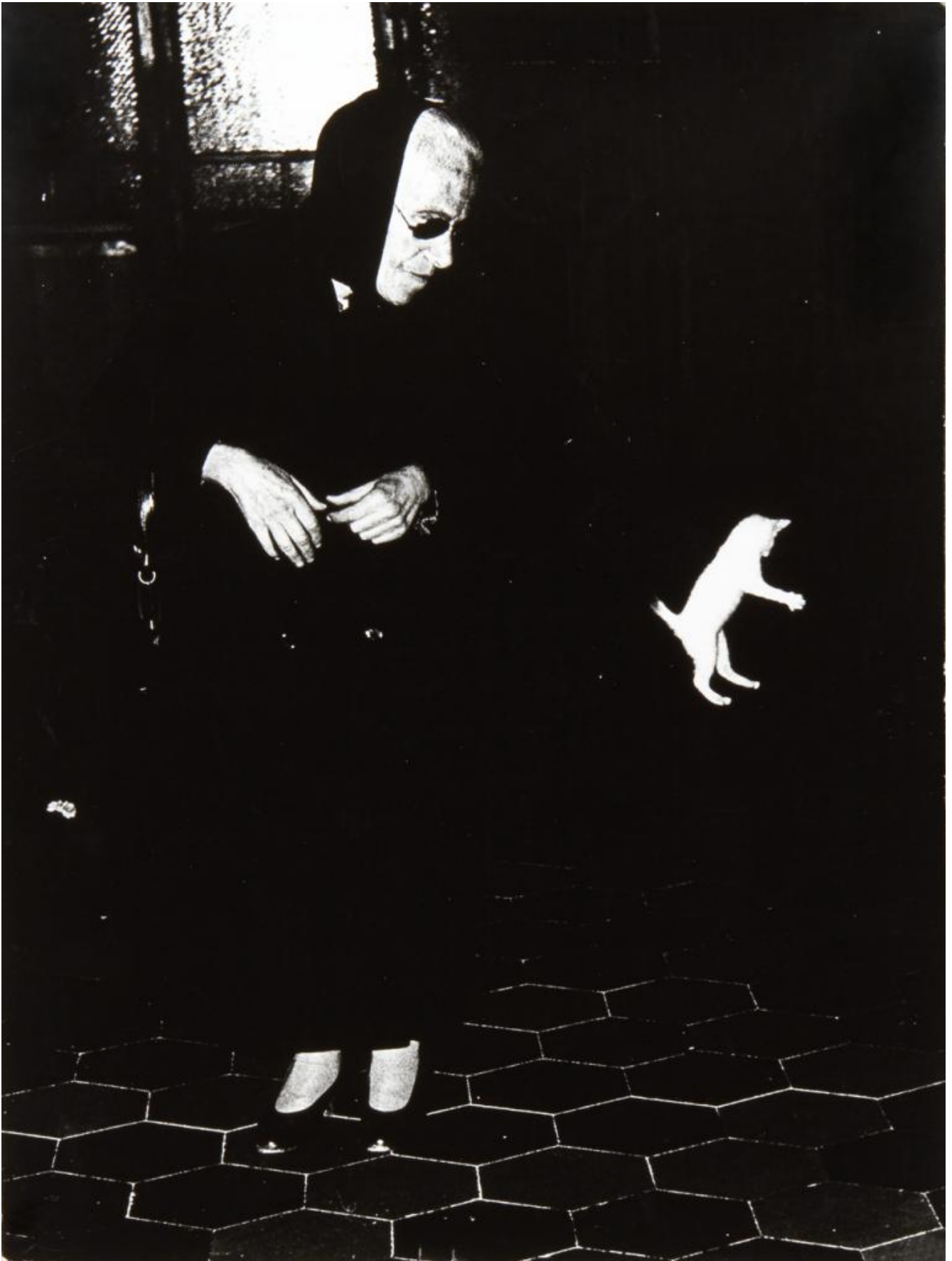
Mario Giacomelli, Verrà la morte e avrà i tuoi occhi, 1955 - 1957