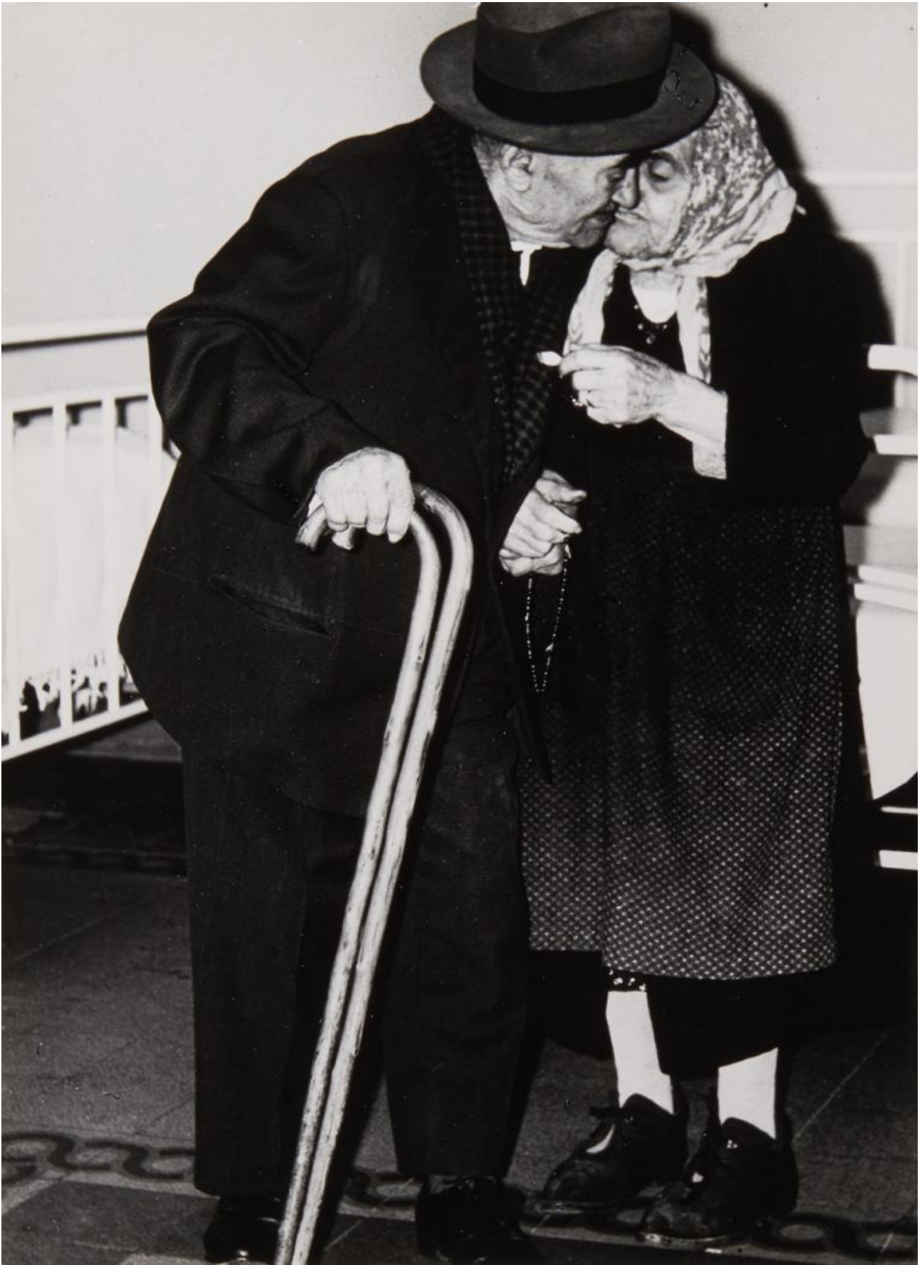
Mario Giacomelli, Verrà la morte e avrà i tuoi occhi, 1955 - 1957