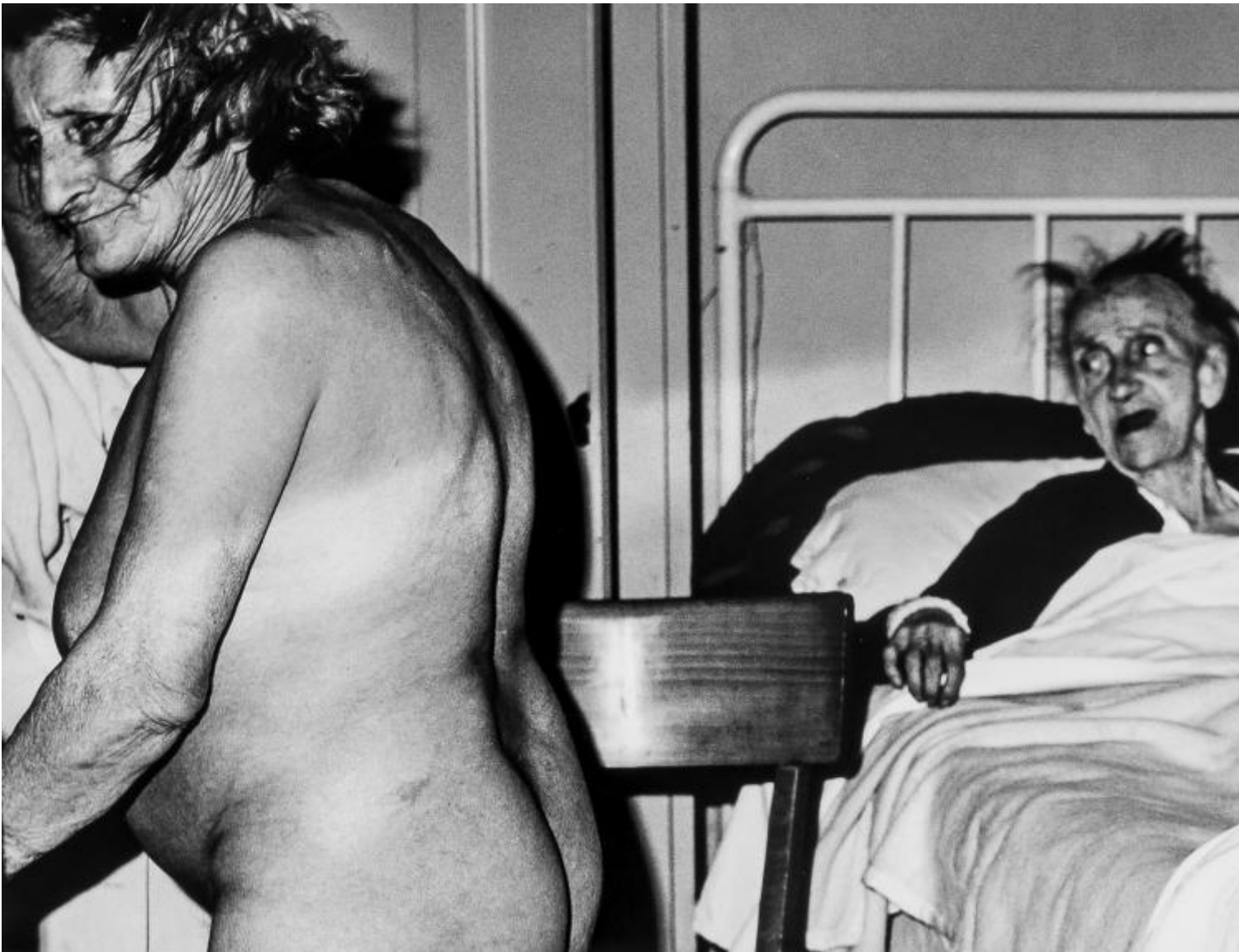
Mario Giacomelli, Non fatemi domande, 1955

Io faccio queste immagini perché vorrei che gli altri, dal momento in cui le vedono, vivessero diversamente. Che la carezza che questi ancora cercano da vecchi, da giovani l'avessero saputa fare. Quanta gente vive e non sa carezzare? Quante donne muoiono senza aver mai provato l'orgasmo? Quando io mostro questi vecchi, mostro me stesso, le cose che non ho capito, che avrei voluto fare in un'altra maniera, che vorrei ricominciare. Ma l'immagine è solo una minima parte di quello che sento, ed è per questo che se ne fanno tante? (cit. in: Frank Horvat, Entre Vues , Paris 1990).