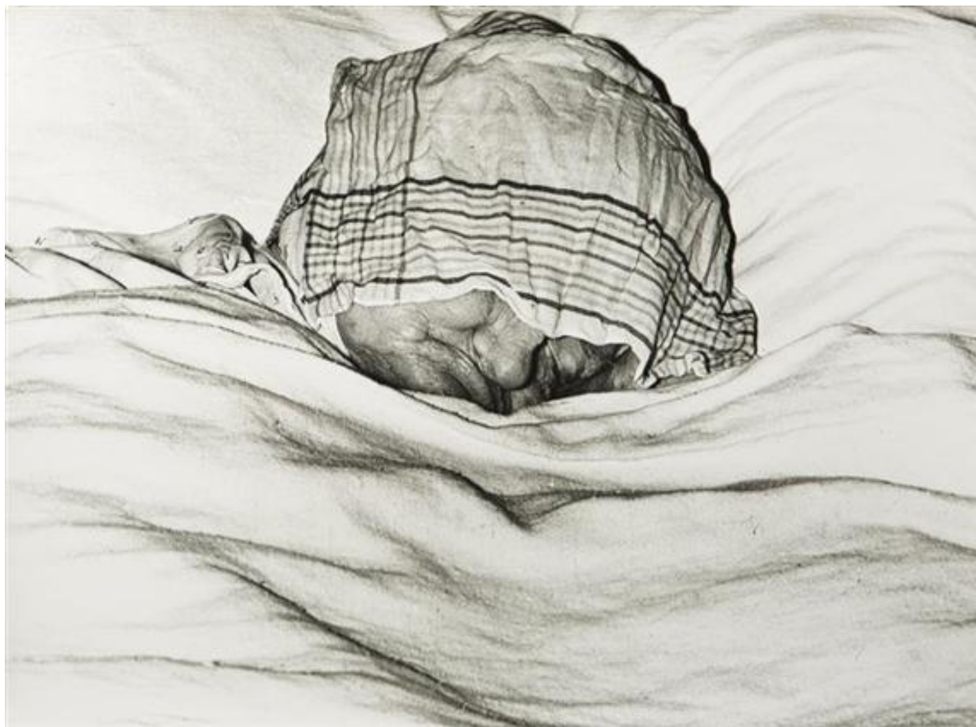
Mario Giacomelli, Verrà la morte e avrà i tuoi occhi, 1966 - 1968

Nel bianco del letto d'ospizio, una donna anziana dorme profondamente. Sogna, forse, con un fazzoletto sulla testa, il paradiso o la prossima vita. Le si vede un occhio solo, il naso degli ultimi respiri, e il labbro di una bocca senza più denti. Dorme tra le pieghe di un'altra dimensione. Il suo sudario è reale e metafisico al contempo. L'immagine è insieme drammatica, densa di tenerezza e magnetica: "Sai perché per me è bella? Tu vedi la vecchia, l'ospizio."