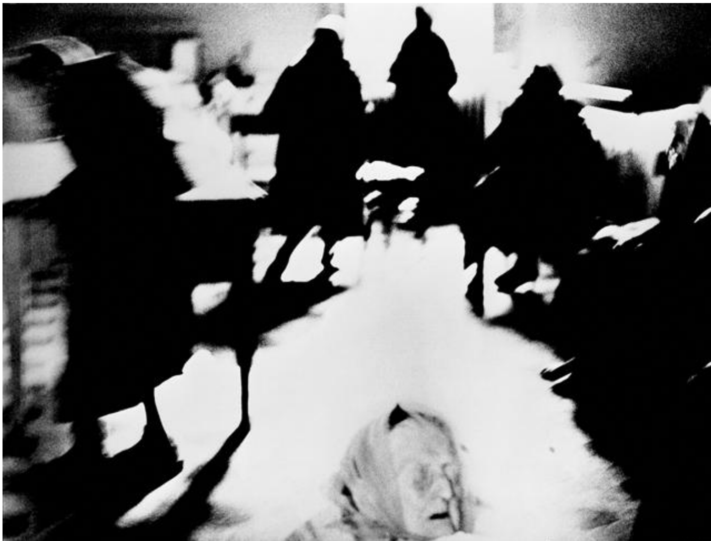
Mario Giacomelli, Verrà la morte e avrà i tuoi occhi, 1955 - 1957

Ma se tu la guardi ancora meglio, non c'è più né vecchia né ospizio, è come un mare bianco, come una barca su un'onda. Ma questo è venuto dopo che ho pianto dentro di me una quantità di volte, di fronte ad altre immagini. Non so se questa è più importante, per me sono tutti attimi, come il respiro, quella prima non è più importante di quella dopo, ce ne sono tanti, finché tutto si blocca e tutto finisce. Quante volte abbiamo respirato questa sera? Nessun respiro era più bello dell'altro e tutti insieme sono la vita” (cit. in: Frank Horvat, Entre Vues , Paris 1990).