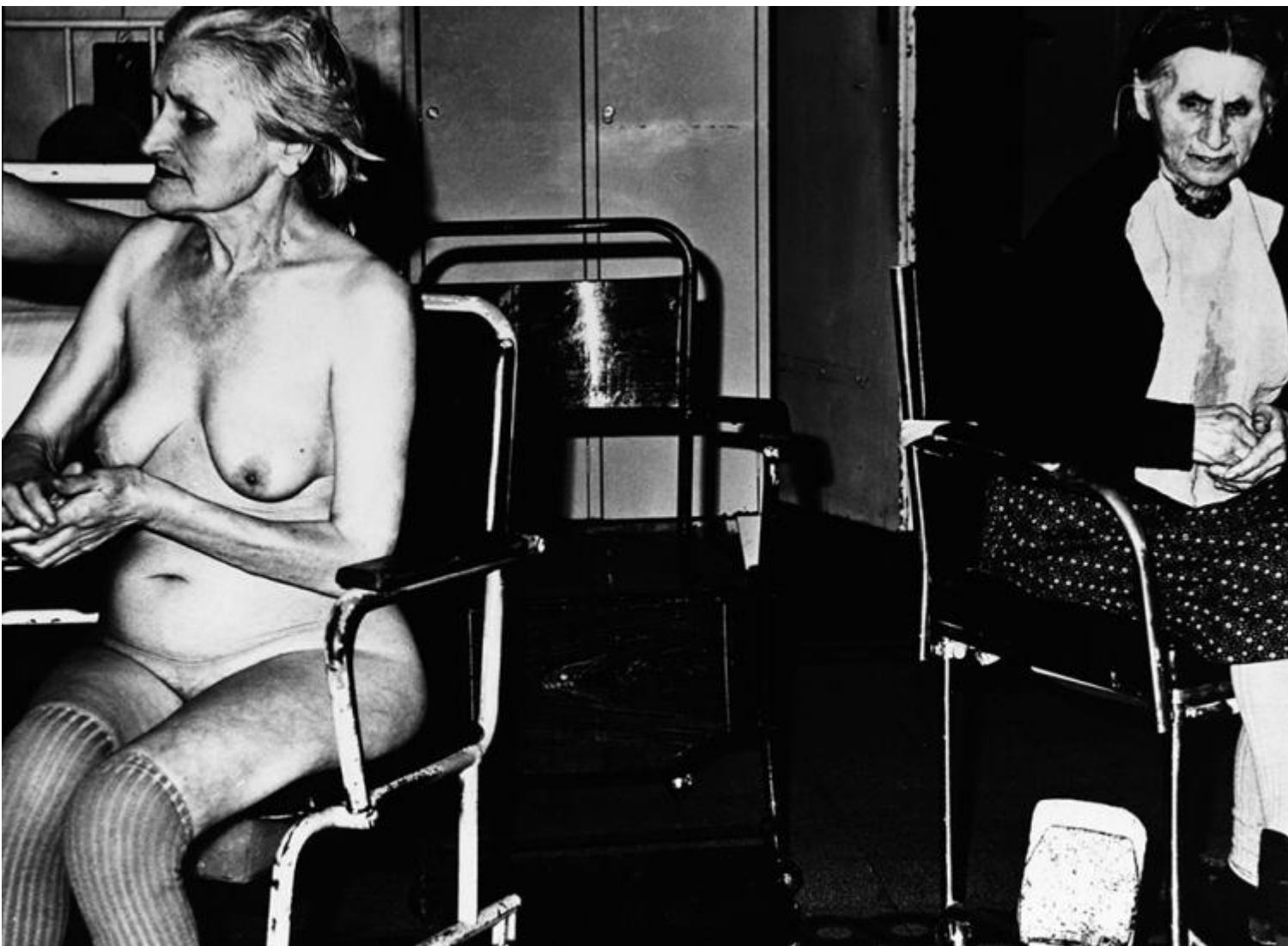
Mario Giacomelli, VerrÃ la morte e avrÃ i tuoi occhi, 1981 - 1983