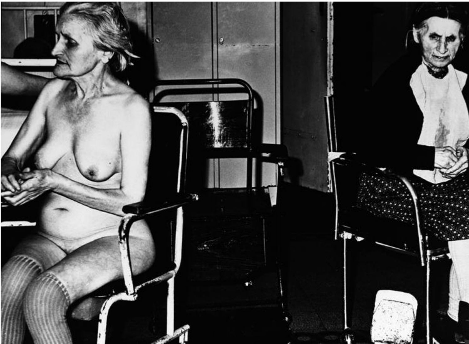
Mario Giacomelli, VerrÃ la morte e avrÃ i tuoi occhi, 1981 - 1983