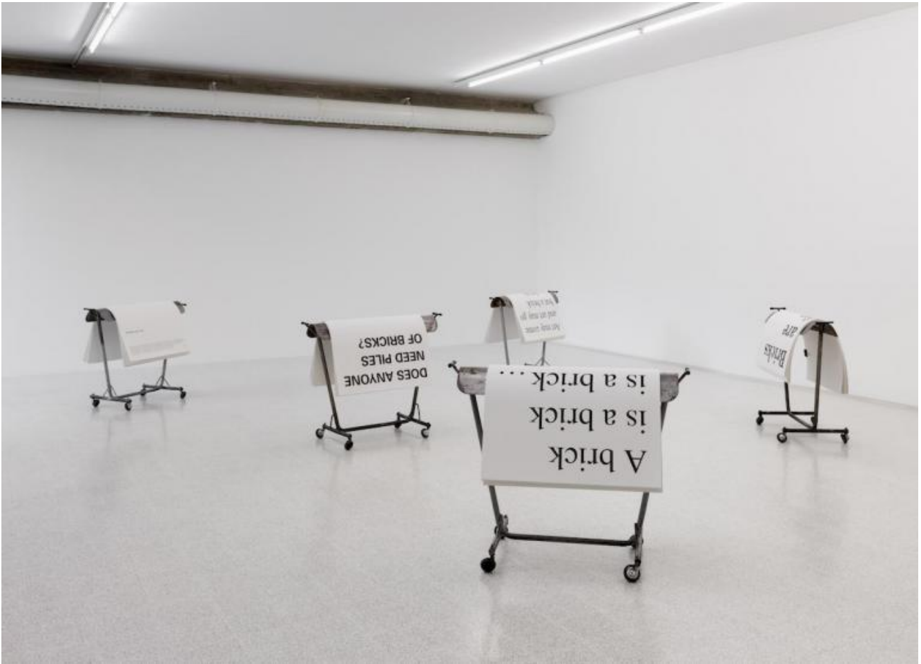
Elisabetta Benassi, It starts with the firing, 2017. Cinque elementi metallici, manifesti, traccia audio / five metal elements, posters, audio track, dimensioni variabili / variable dimension.

Gli enigmi che l'artista pone allo spettatore, ricollocando oggetti di uso quotidiano, sovvertendone l'uso, rimescolando le carte che compongono la memoria sembrano suggerire con disincanto la necessità di un approccio critico verso la realtà storica, che abbia la forza di coglierne le incongruenze e il relativismo. Il pensiero forte è ormai un ricordo lontano e anche il pensiero debole è già alle nostre spalle. Ideologie e sistemi filosofici si sono susseguiti per poi crollare sotto la spinta del tempo. La consapevolezza che i mattoni più solidi che compongono l'architettura della nostra civiltà non siano assoluti ma possano un giorno assumere improvvisamente un valore che neghi o contraddica il significato originario attribuitogli, è qualcosa di innegabilmente malinconico. Al contempo, tale consapevolezza ci dona il distacco necessario a cercare con costanza un senso nella realtà, nell'accadere, ponendoci in una posizione di presenza attiva nel mondo. Mettere in atto una forma di iconoclastia dolce, cancellando le immagini per renderle di nuovo visibili. Togliere significato alle parole, per farlo