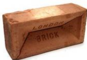
Elisabetta Benassi. Appunti per una mostra 02 / [Notes for a show 02], 2017. Courtesy Elisabetta Benassi.