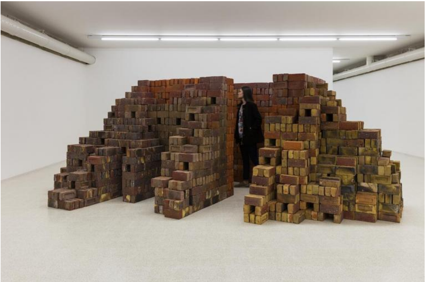
Elisabetta Benassi. Zeitnot , 2017. Cinquemila mattoni refrattari inglesi / five thousand English firebricks, 175 x 500 x 380 cm. Courtesy Collezione Maramotti © Elisabetta Benassi. Ph. Andrea Rossetti.

Affrontando il corpus delle sue opere spesso si scomoda la categoria degli spettri, ma bisognerebbe forse chiamare in causa la figura del revenant , con tutta la sua forza archetipica. La ri-messa in scena di elementi cristallizzati in una forma e in un significato assodati nel tempo pone lo spettatore di fronte a quella condizione di spaesamento che assomiglia molto a quel perturbante che si insinua in colui che accoglie il ritorno a casa del ritornante: un senso di angoscia legata alla certezza del conosciuto che si sgretola, la paura di affrontare una estraneità in ciò che è familiare, il timore della sostituzione dell'oggetto affettivo con un feticcio maligno. Non ultima, la paura del ritorno da una zona d'ombra la morte come paradigma di stasi a cui solo la memoria ha diritto di accesso e il timore della trasfigurazione di un oggetto (o soggetto) in un agente estraneo e incontrollabile.