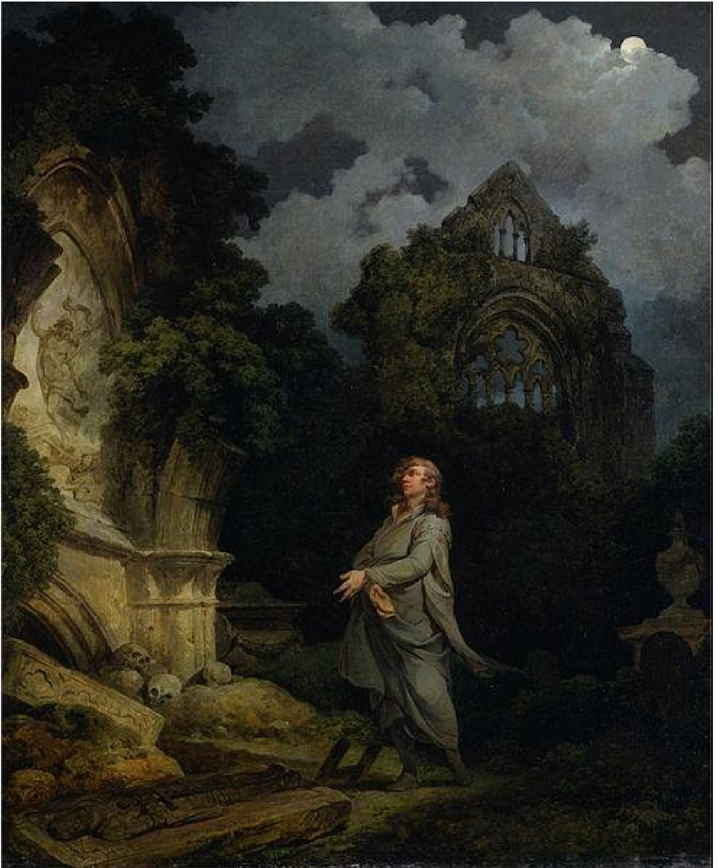
Philippe-Jacques de Loutherbourg, Visitor to a Moonlit Churchyard , 1790, oil on canvas.

Ma quali differenze tra il modello ottocentesco e la sua ri-attualizzazione medio-novecentesca!