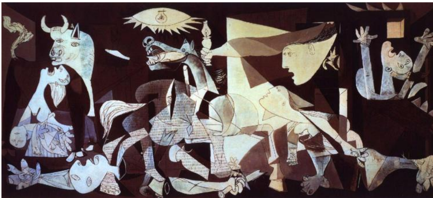
Pablo Picasso, Guernica, 1937.

Se si guarda un quadro di Matisse vicino ad un quadro impressionista si vede che l'immagine sostanziale, la figura dei personaggi e degli oggetti, non cambia. Cambia un certo modo di vederla. Il colore e la struttura, nel quadro di Matisse, subiscono una deformazione: il che vuol dire che è sempre una certa forma a venire piegata in nuovi aspetti. Le Demoiselles d'Avignon rappresentano un'altra cosa. È un tentativo di mutare la sostanza stessa dell'immagine delle cose e dei personaggi. Matisse investiva la realtà data con una nuova carica di emozioni. Picasso non deforma affatto: costituisce una nuova forma della realtà. Tutti i rivoluzionari della storia dell'arte hanno fatto esattamente questo. Nell' Autobiografia di Alice Toklas , Gertrude Stein racconta che allora c'erano veri scontri tra matissiani e picassiani. E Picasso si ricorda di quando mostrò le Demoiselles d'Avignon a Matisse e questi si mise a ridergli dietro le spalle.