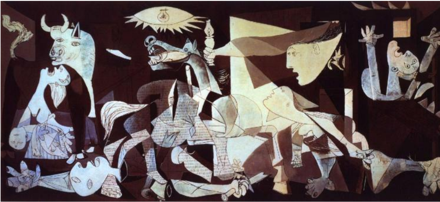
Pablo Picasso, Guernica , 1937.

Se si guarda un quadro di Matisse vicino ad un quadro impressionista si vede che l'immagine sostanziale, la figura dei personaggi e degli oggetti, non cambia. Cambia un certo modo di vederla. Il colore e la struttura, nel quadro di Matisse, subiscono una deformazione: il che vuol dire che c'è sempre una certa forma a venire piegata in nuovi aspetti. Le Demoiselles d'Avignon rappresentano un'altra cosa. È un tentativo di mutare la sostanza stessa dell'immagine delle cose e dei personaggi. Matisse investiva la realtà data con una nuova carica di emozioni. Picasso non deforma affatto: costituisce una nuova forma della realtà. Tutti i rivoluzionari della storia dell'arte hanno fatto esattamente questo. Nell' Autobiografia di Alice Toklas , Gertrude Stein racconta che allora c'erano veri scontri tra matissiani e picassiani. E Picasso si ricorda di quando mostrò le Demoiselles d'Avignon a Matisse e questi si mise a ridergli dietro le spalle.