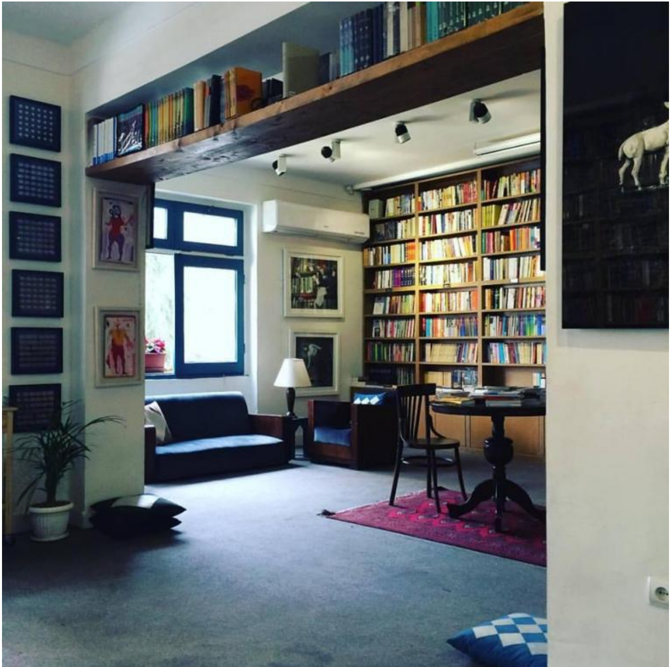
Una libreria del centro di Tehran.

procede scopriamo che alle spalle di questa ragazza che sembra concentrata solo sui soldi e sul trucco c'è un'intricata vicenda familiare che affonda le radici proprio nei tumulti della rivoluzione e nel destino in cui scivolarono tanti militanti di sinistra.