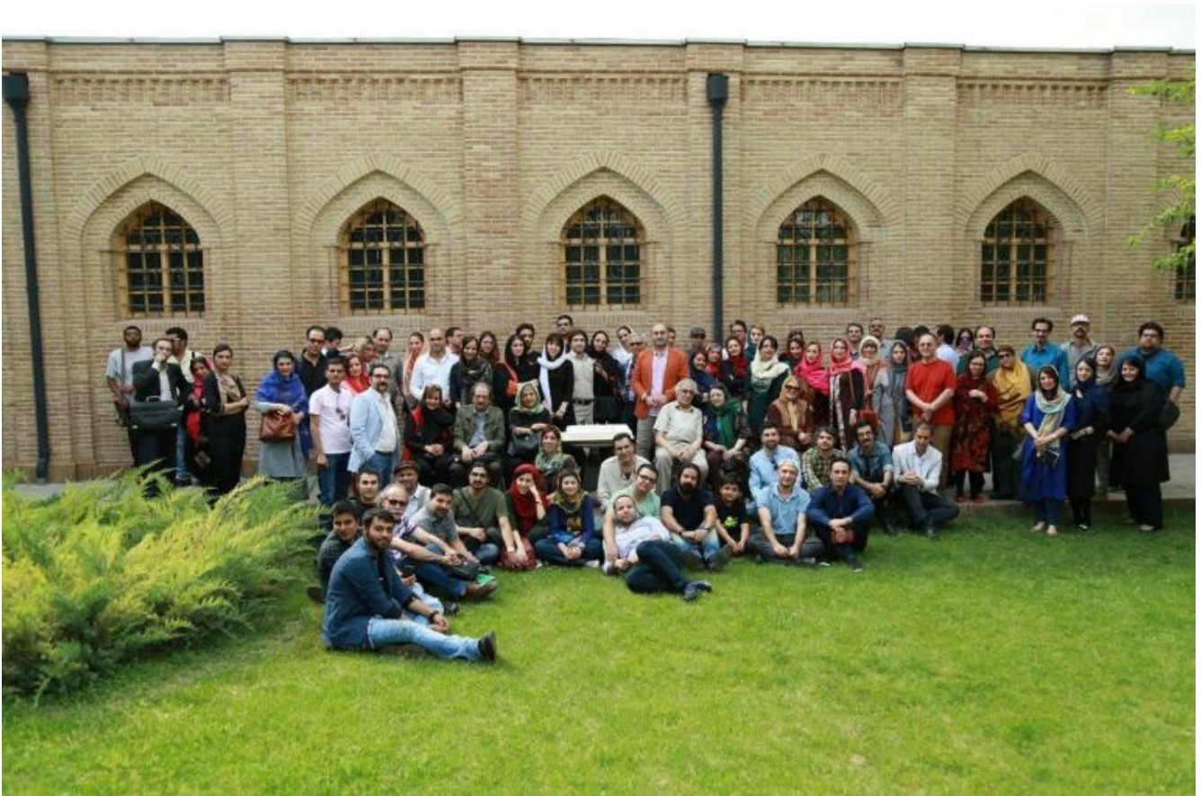
Una foto di gruppo (dove compare qualche scrittore citato) scattata al museo della prigione Qasr nel 2014 in occasione del quinto anniversario del sito "Doshanbeh".

Nel 2015 la rivista si è fatta promotrice di un premio, in collaborazione col comune di Tehran. Scrittori professionisti e principianti sono stati invitati a inviare alla redazione un racconto ambientato nella capitale. Le adesioni sono state numerosissime, e hanno coinvolto non solo l'area metropolitana, ma anche le province: nella prima edizione sono pervenuti 1400 racconti e il dato è cresciuto in quelle successive.