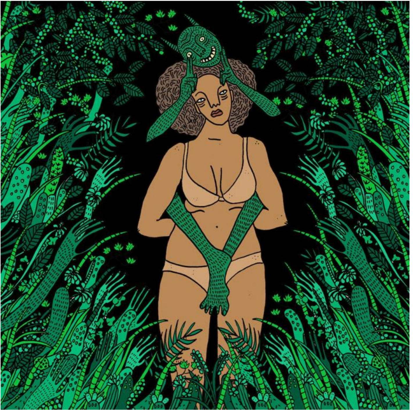
Opera di Polly Nor.

Se lâ??inchiesta condotta con osservazione partecipante da Witt Ã?? ricca di aneddoti curiosi che permettono di infilare il naso sui set si-fa-per-dire liberatori del porno su internet o in quella specie di Parco Lambro per ricchi del â??Burning Manâ?•, un festival annuale di otto giorni che dal 1991 si svolge a Black Rock City nel nord-ovest del Nevada, quel che manca quasi del tutto in queste pagine Ã?? la riflessione critica, in altre parole una visione politica del corpo e dei sentimenti.