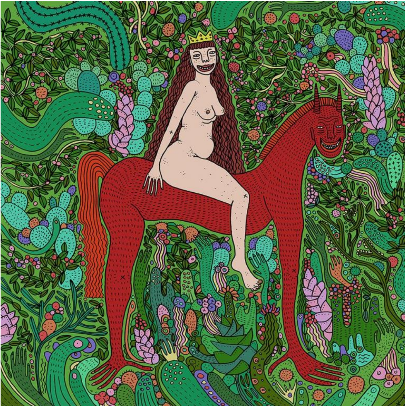
Opera di Polly Nor.

direi di non fermarsi al perbenismo dei suoi genitori. Gli direi di indagare la strana realtà in cui è capitato per comprenderla, ribellarsi, scrivere un nuovo capitolo.