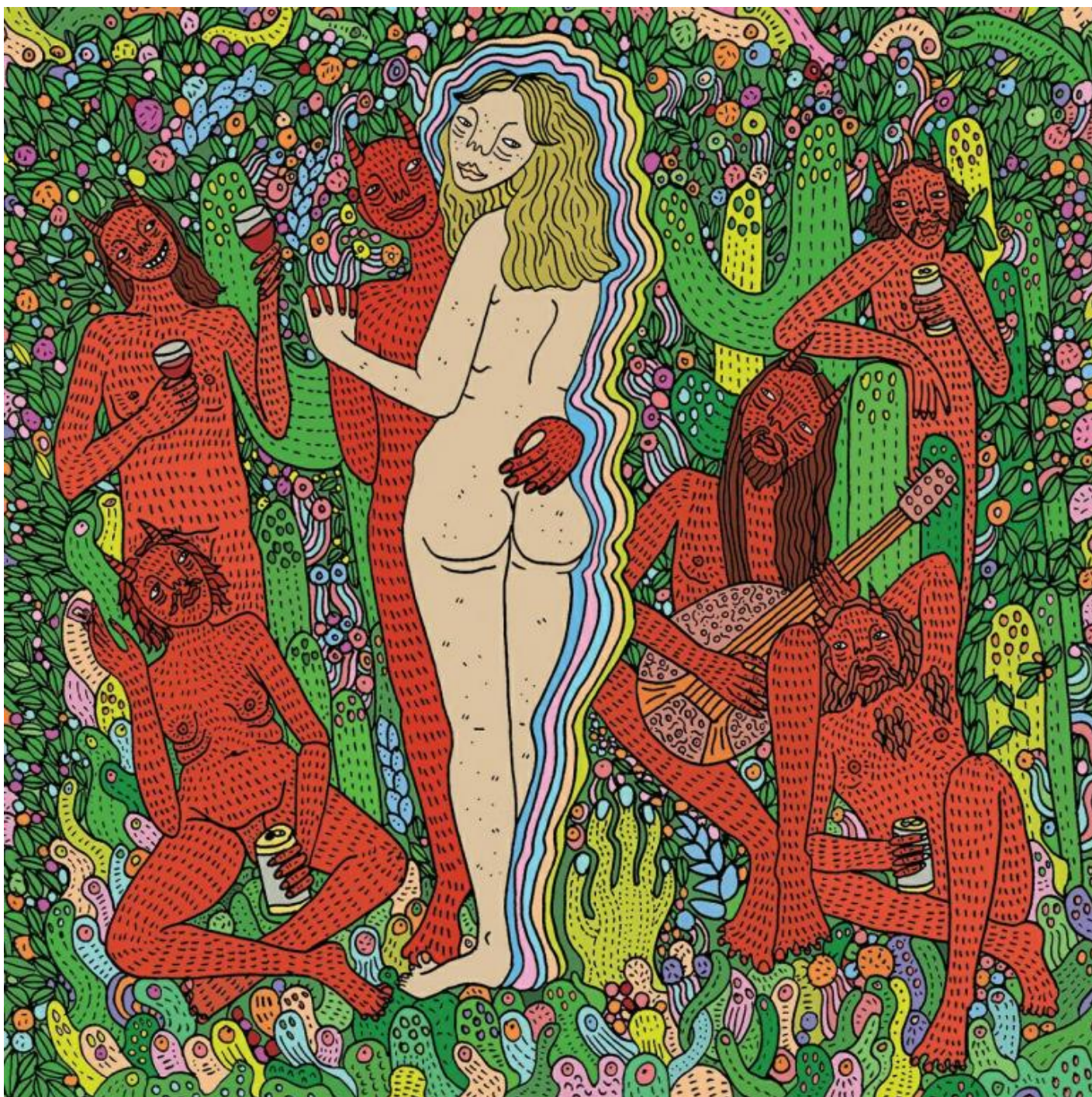
Opera di Polly Nor.

carnevolesche volte ad affermare con scarsa convinzione che 'non siamo vittime del sistema'. Ma veniamo al sesso.