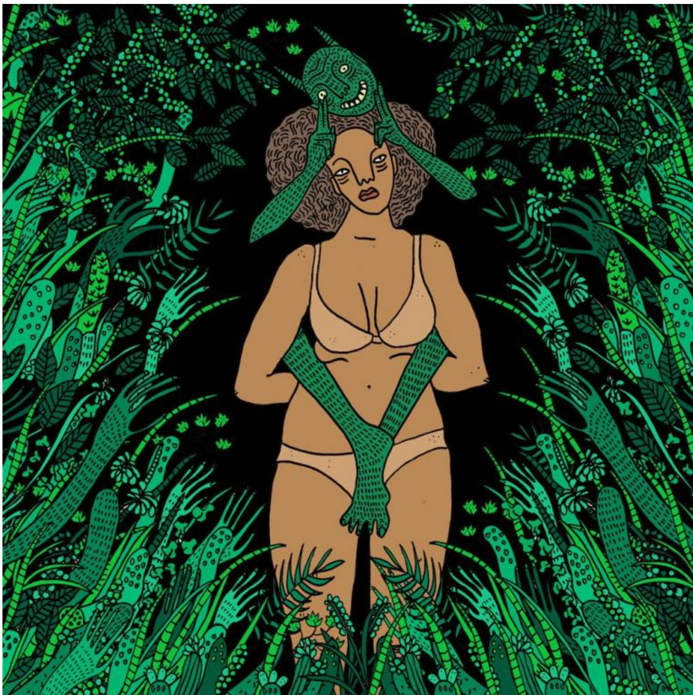
Opera di Polly Nor.

Se l'inchiesta condotta con osservazione partecipante da Witt è ricca di aneddoti curiosi che permettono di infilare il naso sui set si-fa-per-dire liberatori del porno su internet o in quella specie di Parco Lambro per ricchi del "Burning Man", un festival annuale di otto giorni che dal 1991 si svolge a Black Rock City nel nord-ovest del Nevada, quel che manca quasi del tutto in queste pagine è la riflessione critica, in altre parole una visione politica del corpo e dei sentimenti.