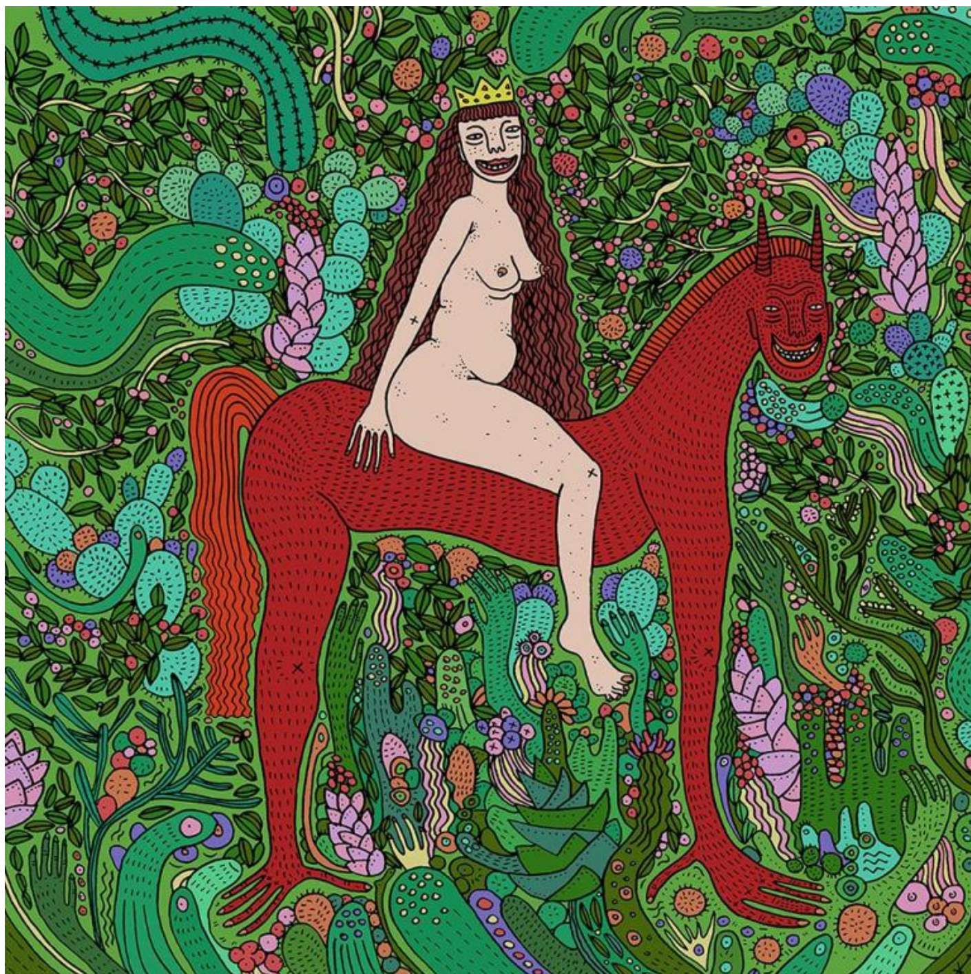
Opera di Polly Nor.

perbenismo dei suoi genitori. Gli direi di indagare la strana realtà in cui è capitato per comprenderla, ribellarsi, scrivere un nuovo capitolo.