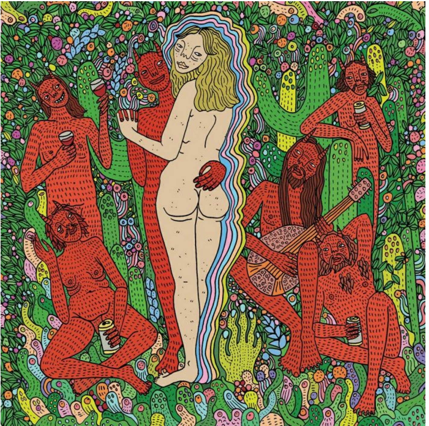
Opera di Polly Nor.

carnevolesche volte ad affermare con scarsa convinzione che «non siamo vittime del sistema». Ma veniamo al sesso.