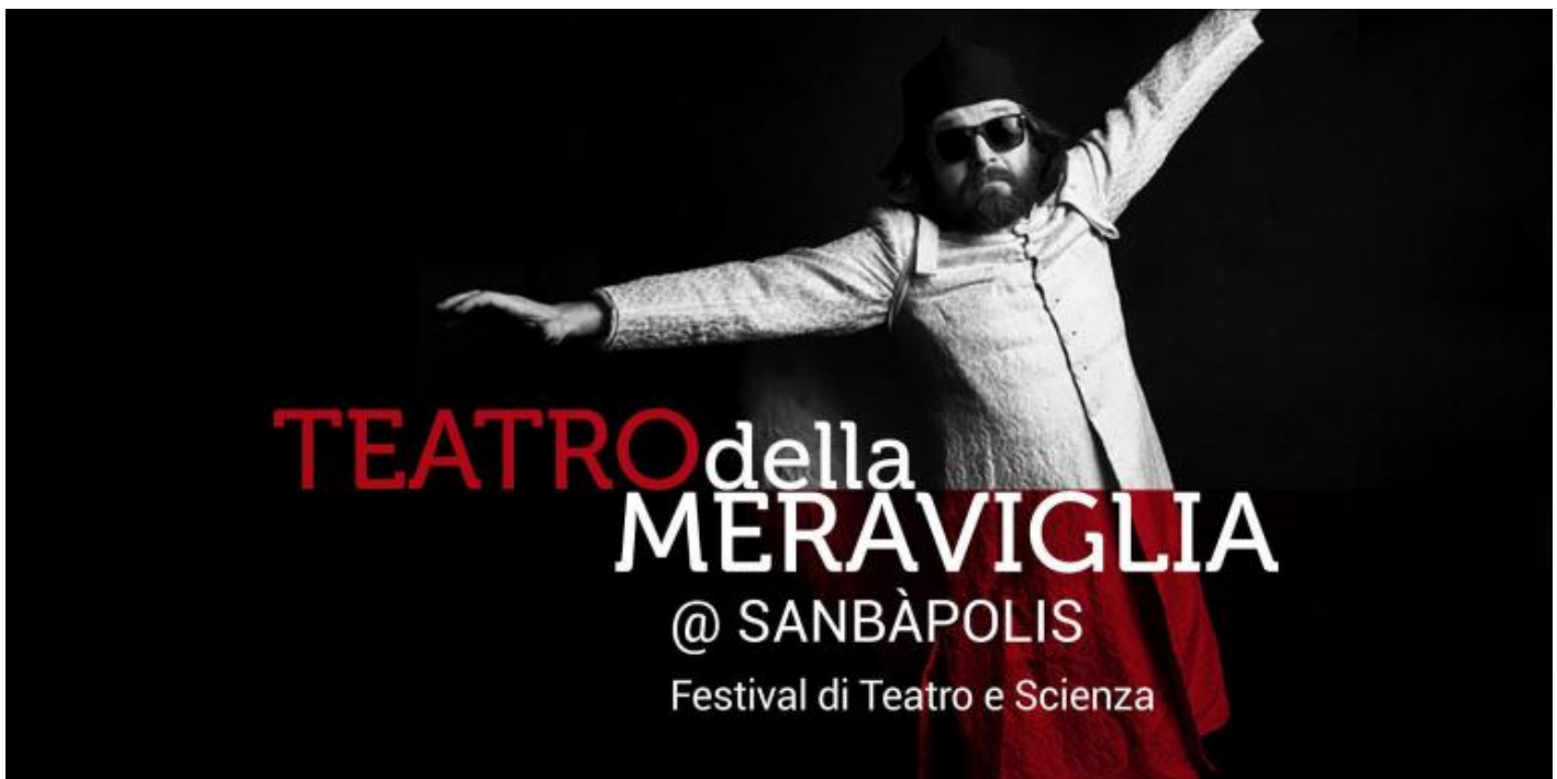
Logo del Festival

Ma che significa "teatro-scienza"? Fermandosi al piano squisitamente empirico, la risposta sarebbe semplice, persino scontata. "Teatro-scienza" è quell'insieme di prodotti spettacolari che portano il sapere scientifico negli spazi teatrali, con finalità ludiche, educative e/o poetiche. Se si va più nello specifico, tuttavia, la domanda solleva almeno due problemi. Anzitutto, affinché l'espressione "teatro-scienza" abbia senso, occorre capire cosa significhino i concetti semplici di "teatro" e "scienza". Ma poiché questi stessi sono in sé oscuri, il composto risulterà ancora più oscuro e, privi di adeguata riflessione, se ne parlerà senza sapere che cosa si sta davvero dicendo. In secondo luogo, posto che sappiamo cosa siano il "teatro" e la "scienza" (in realtà, ci va a mio avviso ancora appurato), si solleva il problema della loro relazione. È il teatro che attinge alla scienza, per generare prospettive ludiche, educative, poetiche? O al contrario, è la scienza che diverte, educa, genera poesia, usando il linguaggio del teatro? L'espressione "teatro-scienza" in apparenza innocua si rivela così essere un ginepraio, in cui è difficile anche solo impostare le premesse per orientarsi senza perdersi.