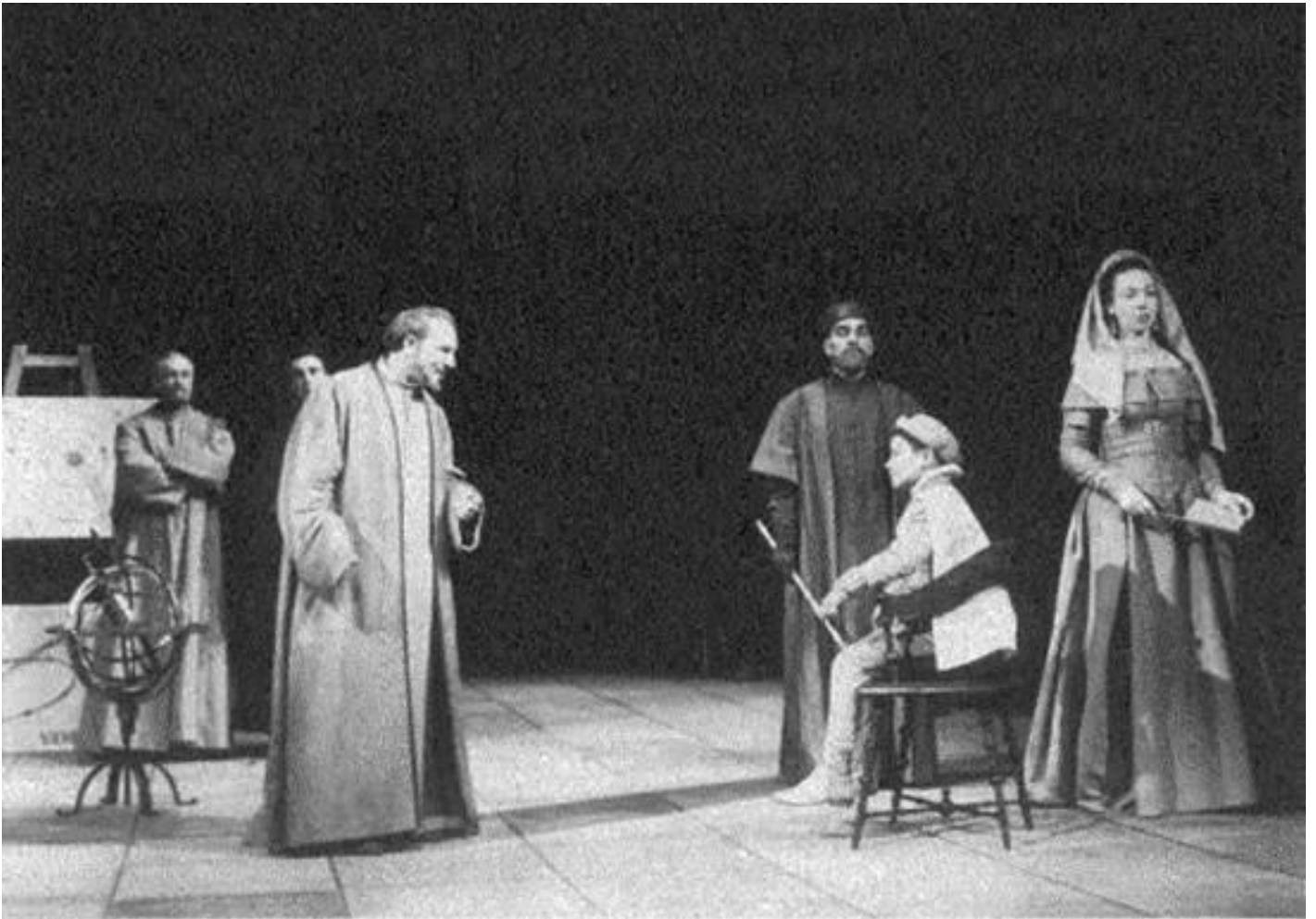
Vita di Galileo di Bertolt Brecht

Resta da delineare in che modo il Teatro della Meraviglia mette in relazione il "teatro" e la "scienza". Il rapporto tra i due è pensato solitamente secondo il nesso mezzo-fine. Il teatro è visto come un facilitatore dei processi di apprendimento: per esempio, si usa il piacere della visione spettacolare come un modo per esprimere concetti scientifici difficili in forma ludica. Lo spettacolo è subordinato alla scienza. Mi pare di vedere, invece, che il Teatro della Meraviglia non crei la separazione tra i due ambiti, sottesa al nesso mezzo-fine. Teatro e scienza sono come due facce di uno stesso processo poetico, ossia quello della riscoperta della bellezza di questo mondo e del bisogno di tutelarla attraverso una buona prassi politica. In questo senso, se uno viene separato dall'altra, e viceversa, si rischia di rendere più povera l'efficacia di entrambi. La scienza ha bisogno del teatro per raggiungere il suo pieno potenziale etico, perché richiede che le sue conoscenze escano dal dominio di pochi sapienti e acquistino peso nella vita attiva, mentre il teatro ha bisogno della scienza per andare oltre il velo delle cose, ritrovando la loro essenza meravigliosa e bella.