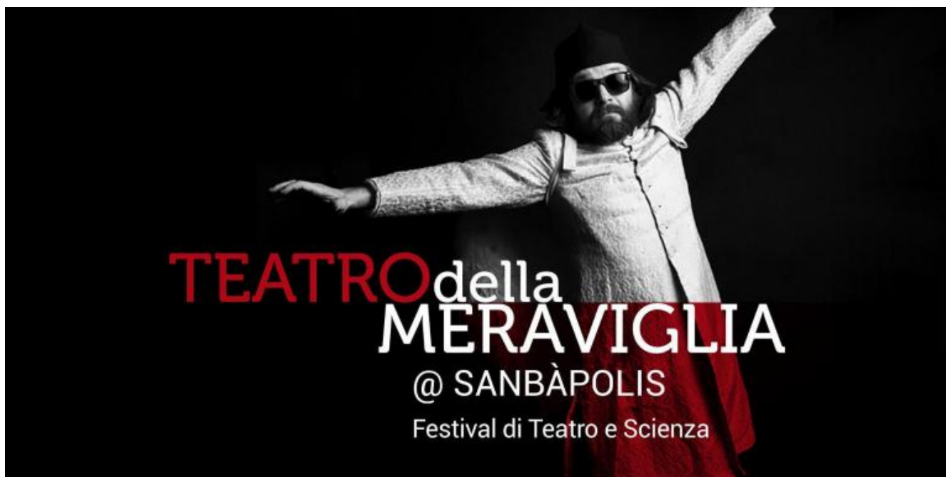
Logo del Festival

Ma che significa “teatro-scienza”? Fermandosi al piano squisitamente empirico, la risposta sarebbe semplice, persino scontata. “Teatro-scienza” è quell’insieme di prodotti spettacolari che portano il sapere scientifico negli spazi teatrali, con finalità ludiche, educative e/o poetiche. Se si va più nello specifico, tuttavia, la domanda solleva almeno due problemi. Anzitutto, affinché l’espressione “teatro-scienza” abbia senso, occorre capire cosa significhino i concetti semplici di “teatro” e “scienza”. Ma poiché questi stessi sono in sé oscuri, il composto risulterà ancora più oscuro e, privi di adeguata riflessione, se ne parlerà senza sapere che cosa si sta davvero dicendo. In secondo luogo, posto che sappiamo cosa siano il “teatro” e la “scienza” (in realtà, ciò va a mio avviso ancora appurato), si solleva il problema della loro relazione. È il teatro che attinge alla scienza, per generare prospettive ludiche, educative, poetiche? O al contrario, è la scienza che diverte, educa, genera poesia, usando il linguaggio del teatro? L’espressione “teatro-scienza” in apparenza innocua si rivela così essere un ginepraio, in cui è difficile anche solo impostare le premesse per orientarsi senza perdersi.