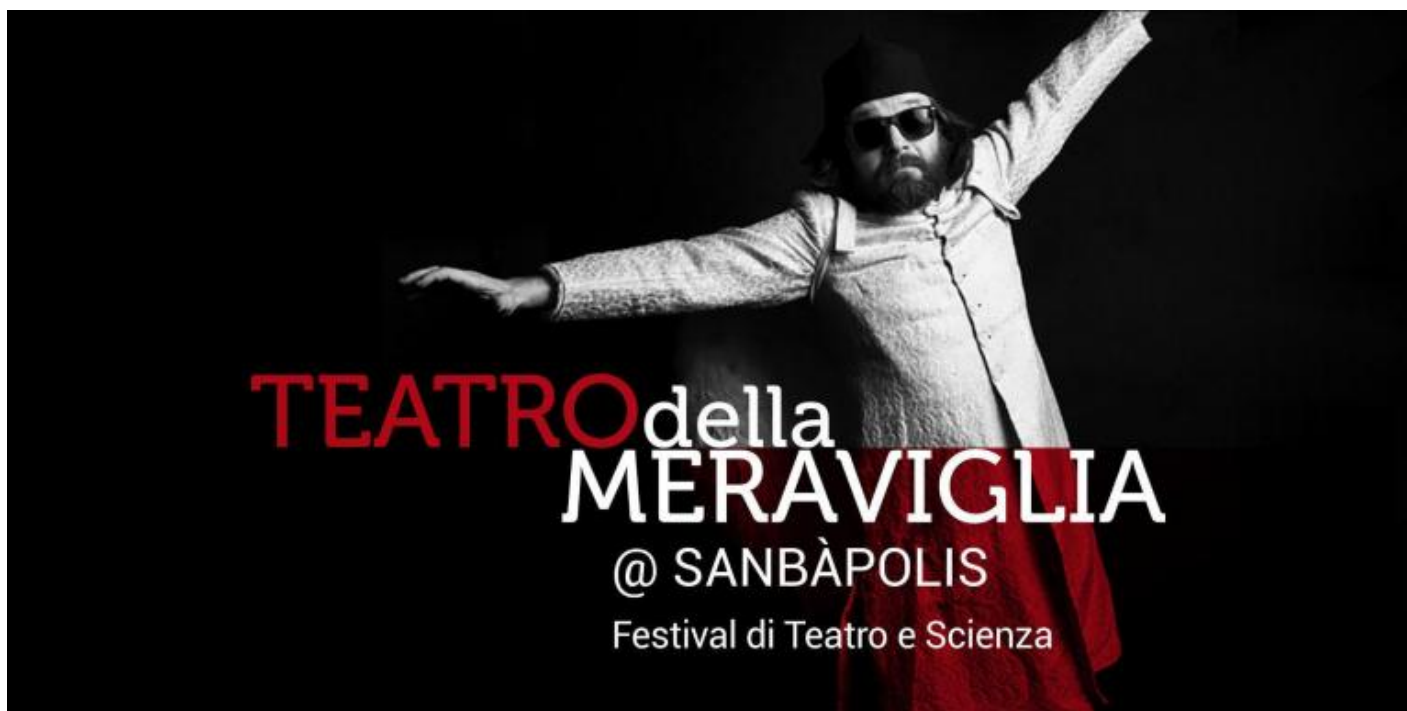
Logo del Festival

Ma che significa “teatro-scienza”? Fermandosi al piano squisitamente empirico, la risposta sarebbe semplice, persino scontata. “Teatro-scienza” è quell’insieme di prodotti spettacolari che portano il sapere scientifico negli spazi teatrali, con finalità ludiche, educative e/o poetiche. Se si va più nello specifico, tuttavia, la domanda solleva almeno due problemi. Anzitutto, affinché l’espressione “teatro-scienza” abbia senso, occorre capire cosa significhino i concetti semplici di “teatro” e “scienza”. Ma poiché questi stessi sono in sé oscuri, il composto risulterà ancora più oscuro e, privi di adeguata riflessione, se ne parlerà senza sapere che cosa si sta davvero dicendo. In secondo luogo, posto che sappiamo cosa siano il “teatro” e la “scienza” (in realtà, ciò va a mio avviso ancora appurato), si solleva il problema della loro relazione. È il teatro che attinge alla scienza, per generare prospettive ludiche, educative, poetiche? O al contrario, è la scienza che diverte, educa, genera poesia, usando il linguaggio del teatro? L’espressione “teatro-scienza” in apparenza innocua si rivela così essere un ginepraio, in cui è difficile anche solo impostare le premesse per orientarsi senza perdersi.