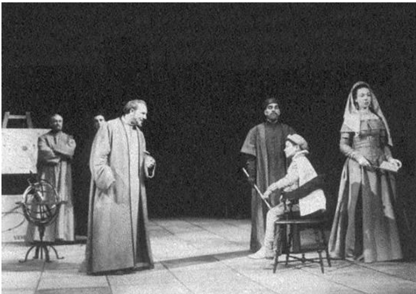
Vita di Galileo di Bertolt Brecht

Resta da delineare in che modo il Teatro della Meraviglia mette in relazione il “teatro” e la “scienza”. Il rapporto tra i due è pensato solitamente secondo il nesso mezzo-fine. Il teatro è visto come un facilitatore dei processi di apprendimento: per esempio, si usa il piacere della visione spettacolare come un modo per esprimere concetti scientifici difficili in forma ludica. Lo spettacolo è così subordinato alla scienza. Mi pare di vedere, invece, che il Teatro della Meraviglia non crei la separazione tra i due ambiti, sottesa al nesso mezzo-fine. Teatro e scienza sono come due facce di uno stesso processo poetico, ossia quello della riscoperta della bellezza di questo mondo e del bisogno di tutelarla attraverso una buona prassi politica. In questo senso, se l’uno viene separato dall’altra, e viceversa, si rischia di rendere più povera l’efficacia di entrambi. La scienza ha bisogno del teatro per raggiungere il suo pieno potenziale etico, perché richiede che le sue conoscenze escano dal dominio di pochi sapienti e acquistino peso nella vita attiva, mentre il teatro ha bisogno della scienza per andare oltre il velo delle cose, ritrovando così la loro essenza meravigliosa e bella.