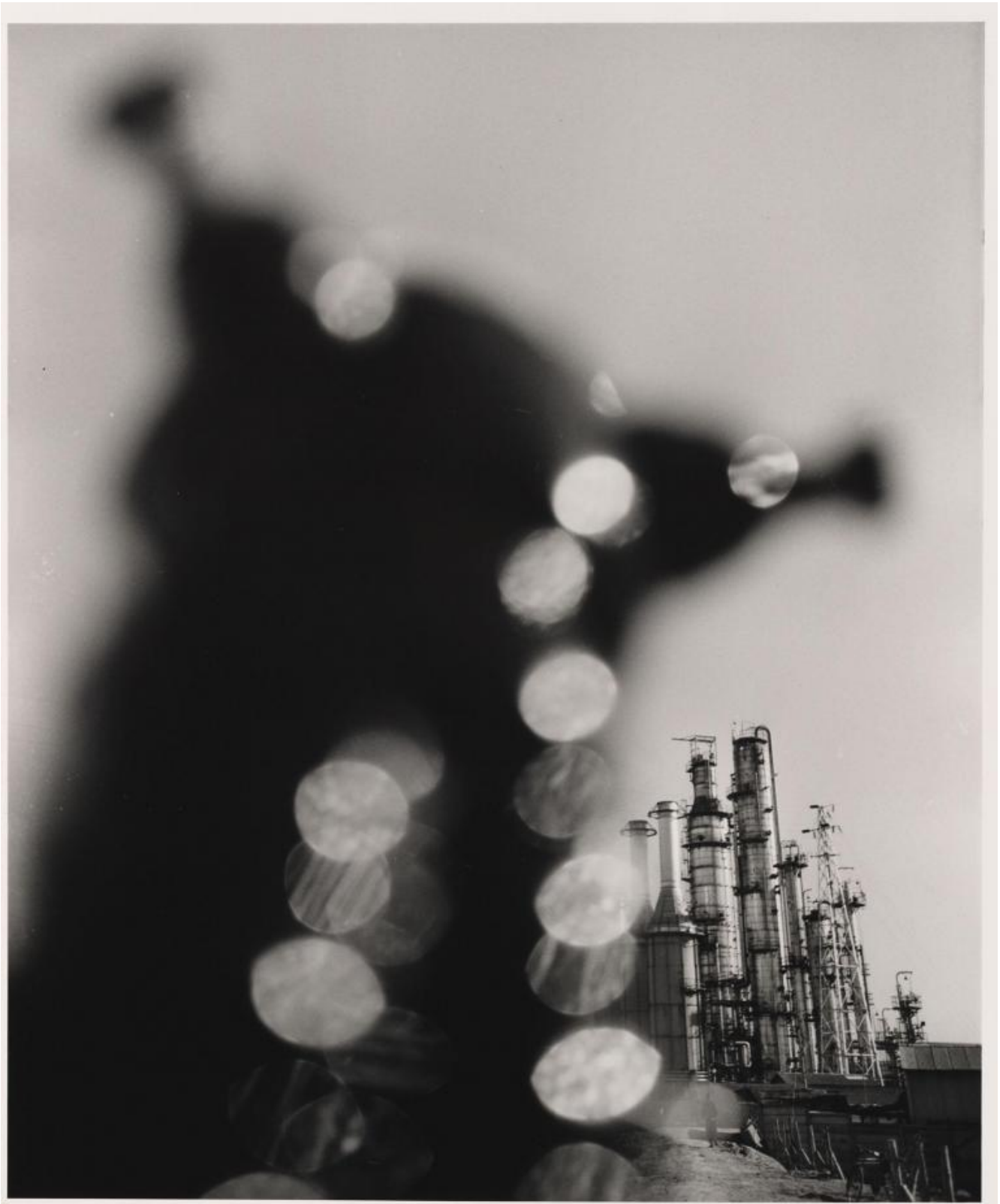
Shomei Tomatsu, Impianto petrolchimico. Yokkaichi, Mie, 1960 ©Shomei Tomatsu Estate, courtesy | PRISKA PASQUER, Cologne.

Tuttavia la forza di queste immagini è davvero liberatoria, nel senso che seduce e allo stesso tempo consente allo spettatore di essere libero di lasciarsi sedurre,