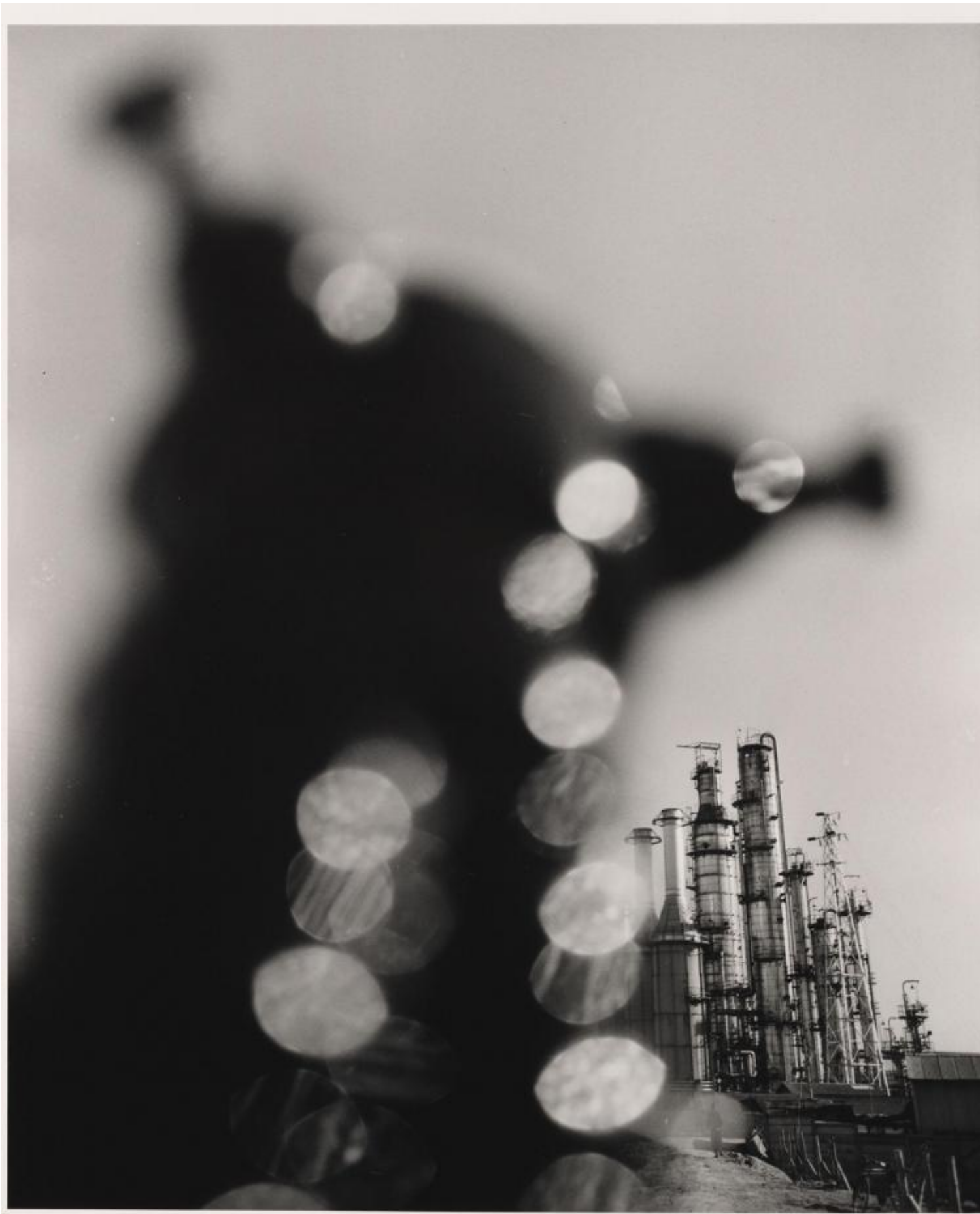
Shomei Tomatsu, Impianto petrolchimico. Yokkaichi, Mie, 1960 ©Shomei Tomatsu Estate, courtesy / PRISKA PASQUER, Cologne.