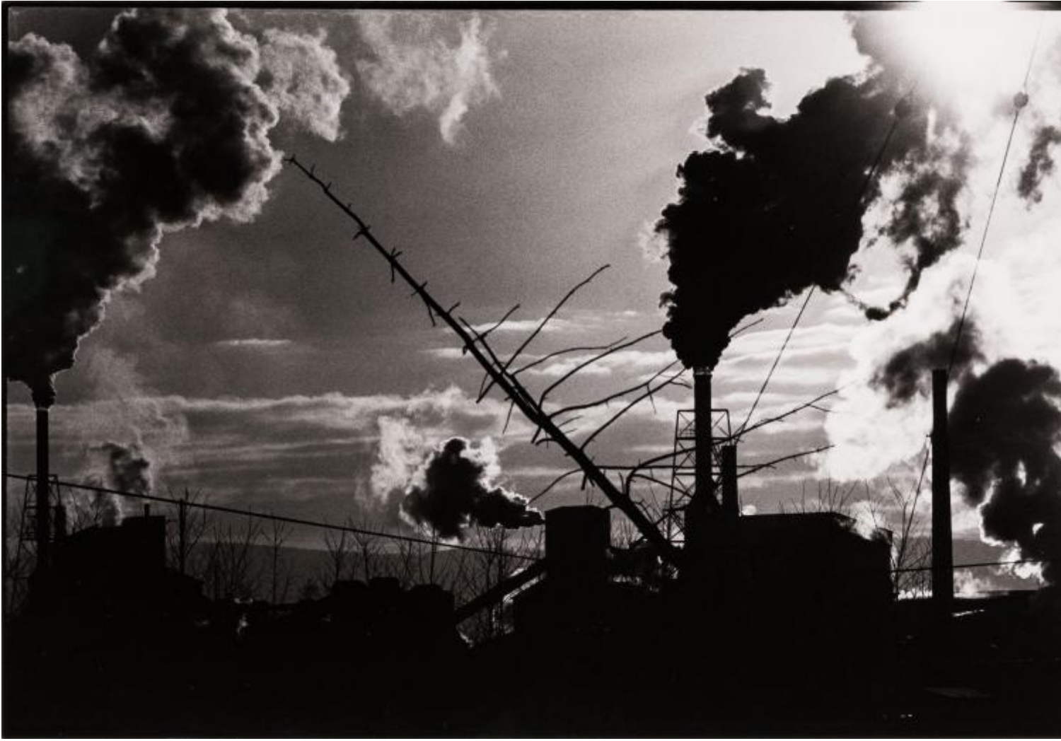
Masahisa Fukase, Nayoro, 1978 © Masahisa Fukase Archives.