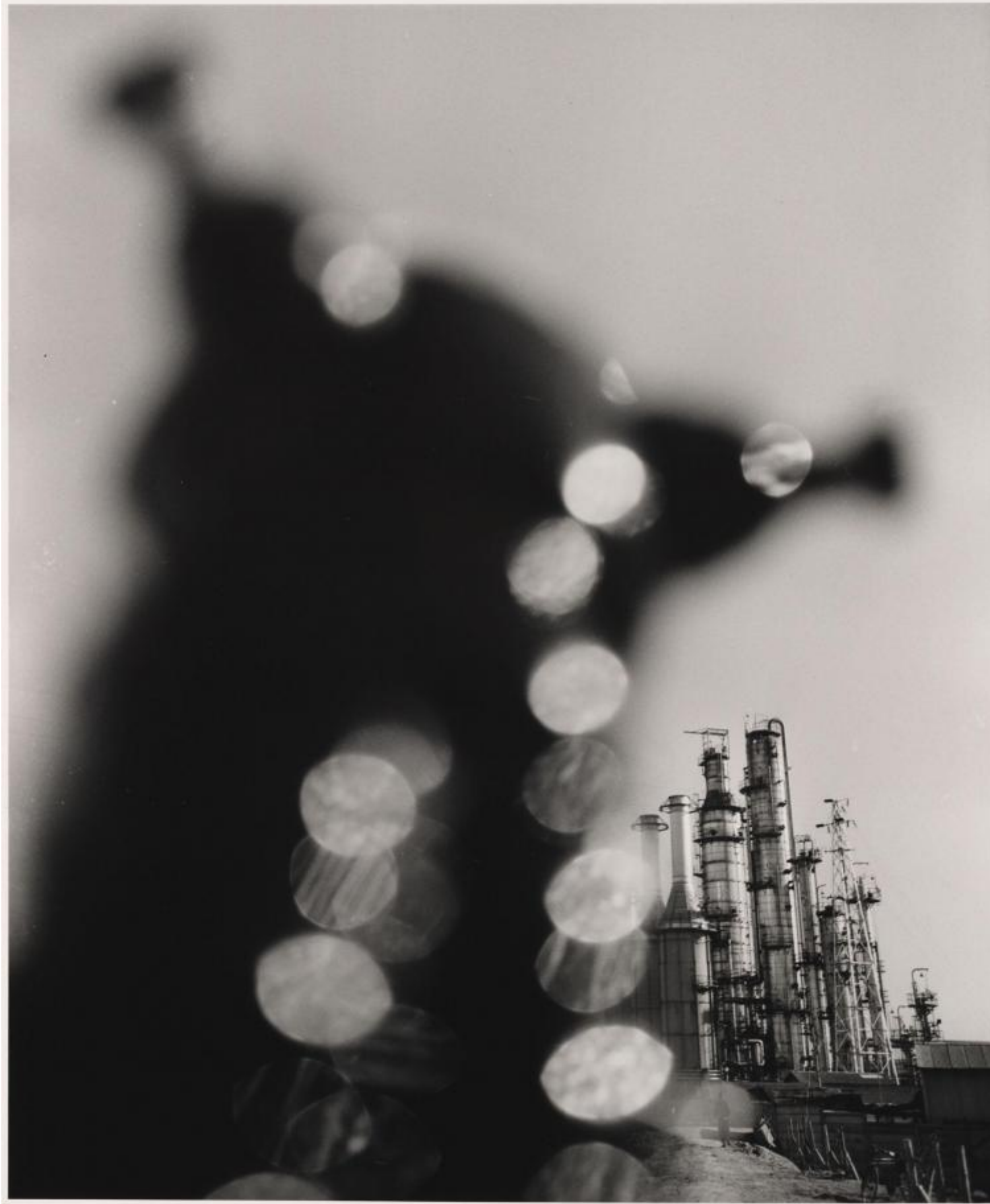
Shomei Tomatsu, Impianto petrolchimico. Yokkaichi, Mie, 1960