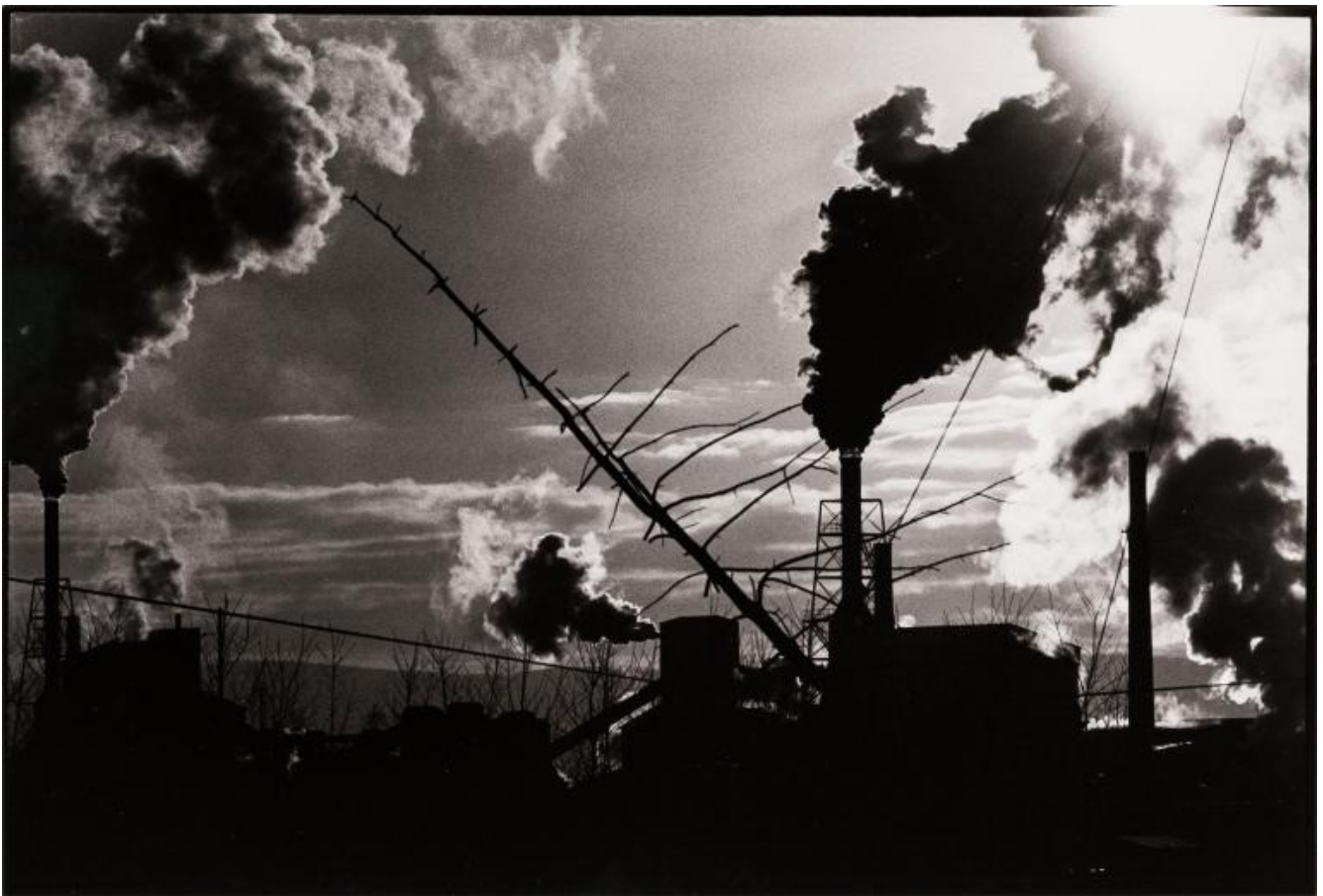
Masahisa Fukase, Nayoro, 1978